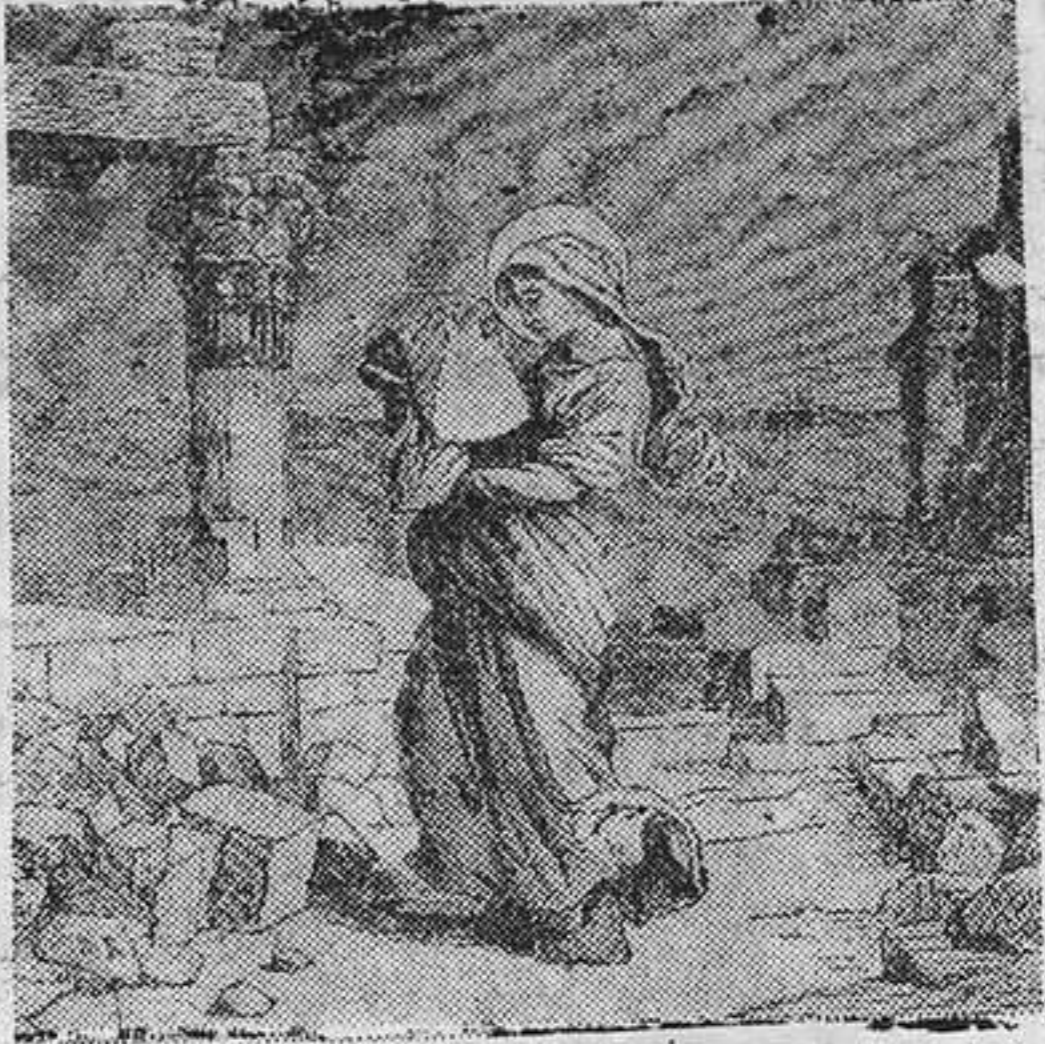
juvene aún. Pero ella, para que no se hablase más del asunto, trasladose a Egipto, donde tenía cuantos bienes, y visi-