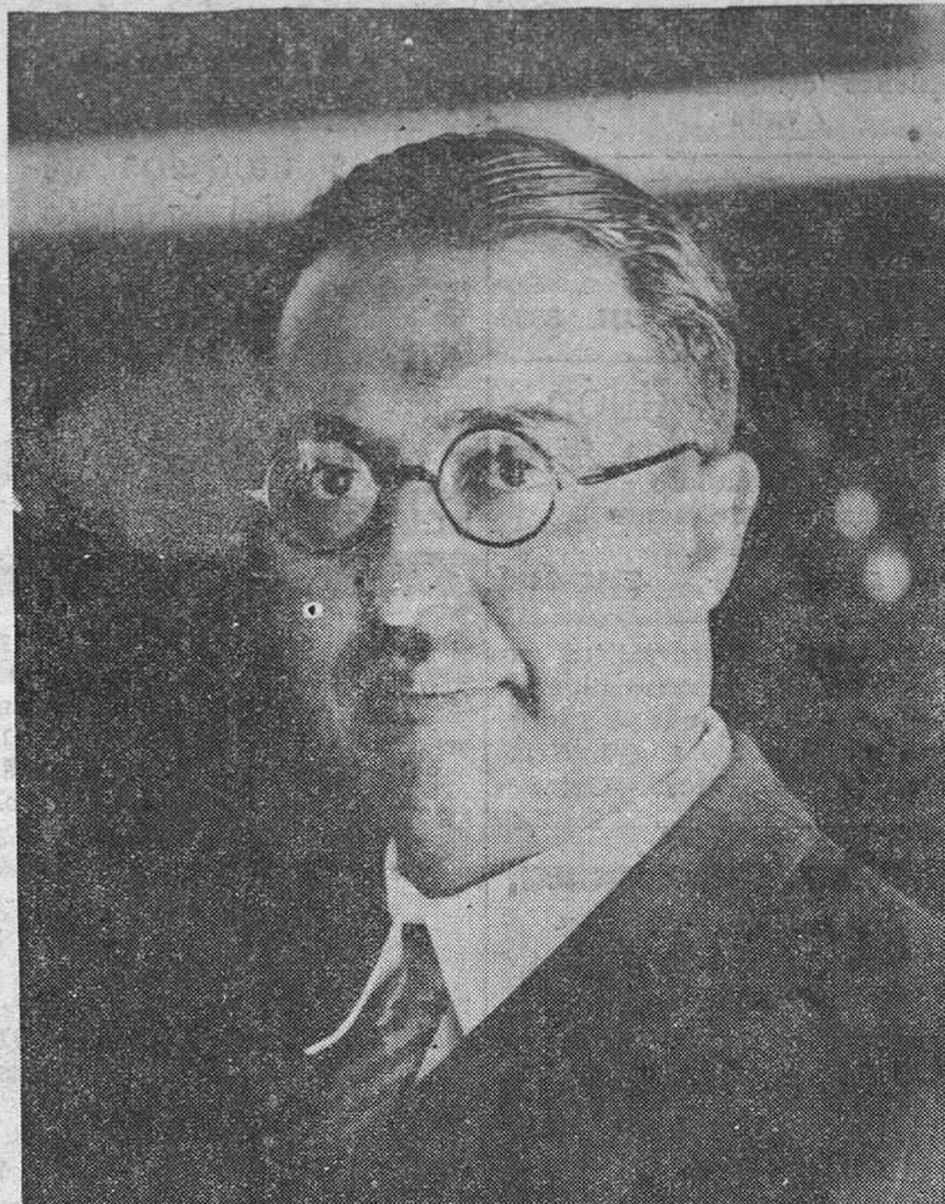
El nuevo gobernador del Banco de España, don Alfredo Zavala.