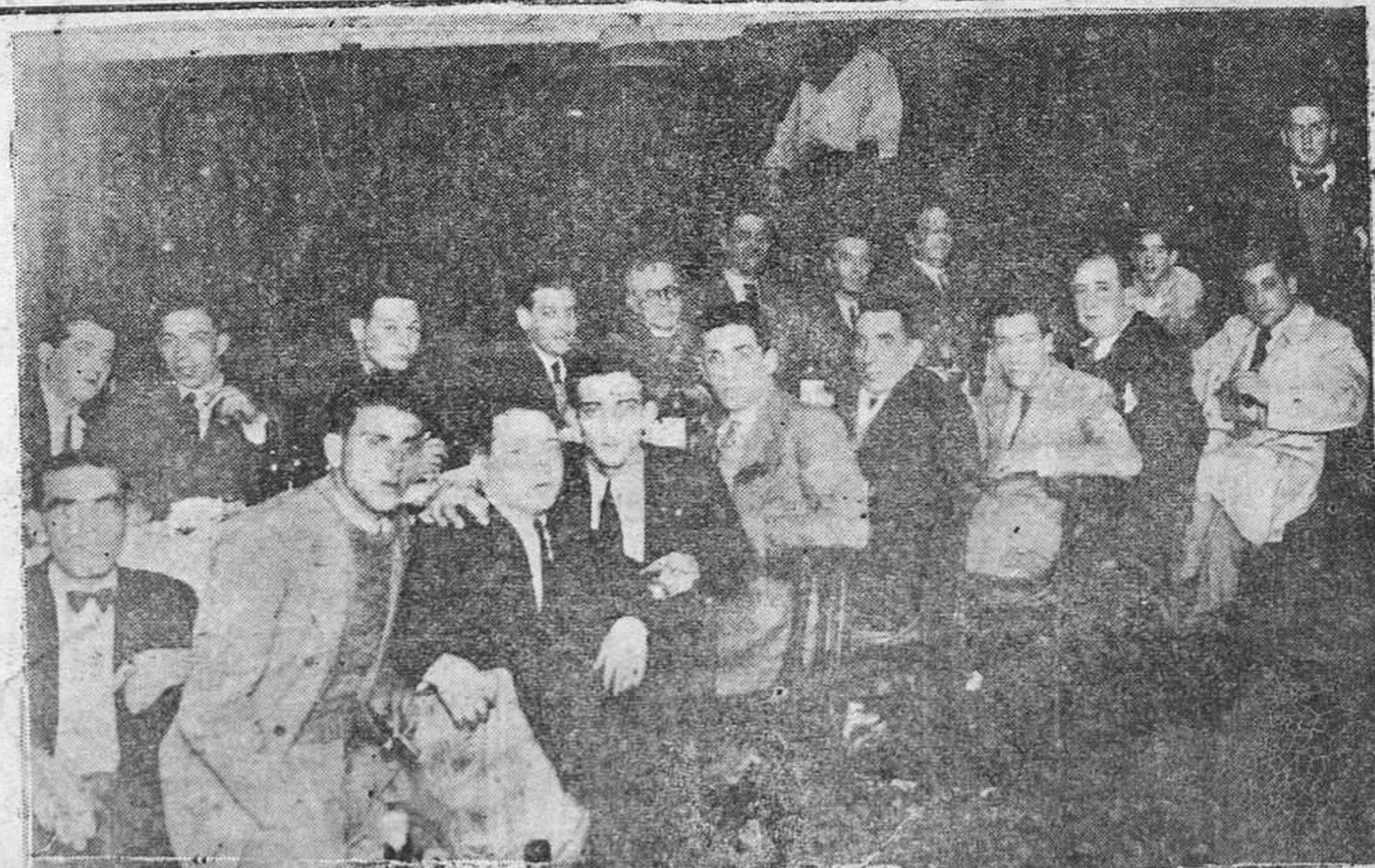
Grupo de aficionados al fútbol que se reunió a comer con motivo de la terminación del campeonato de Liga.

HALLAZGO DE CANTIDAD DE NAMITA Se cree procedente robo