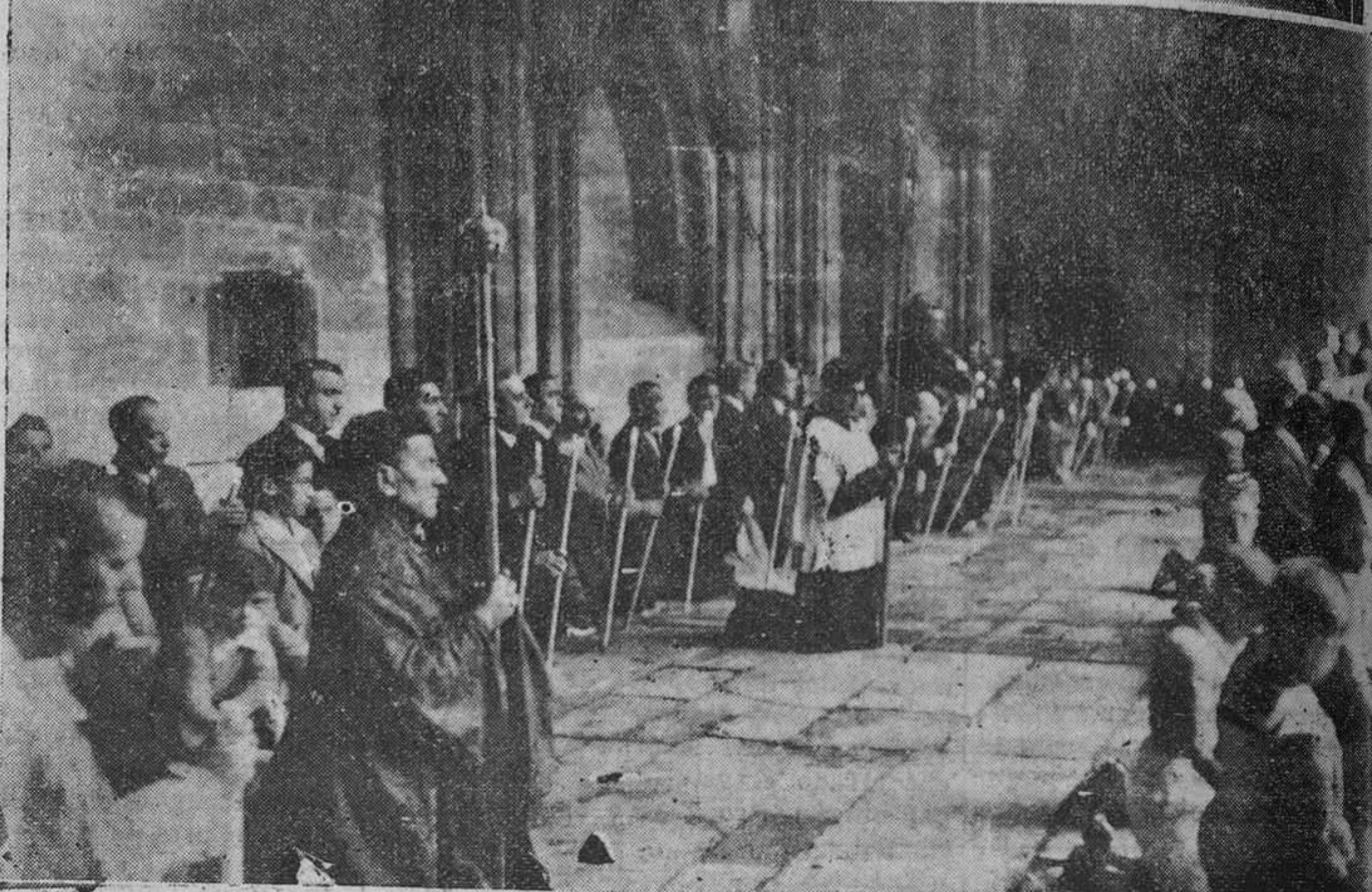
OVIEDO.— La procesión recorriendo el claustro de la Catedral, seguida por gran número de fieles. Abajo: Los fieles esperando el paso del Santísimo.