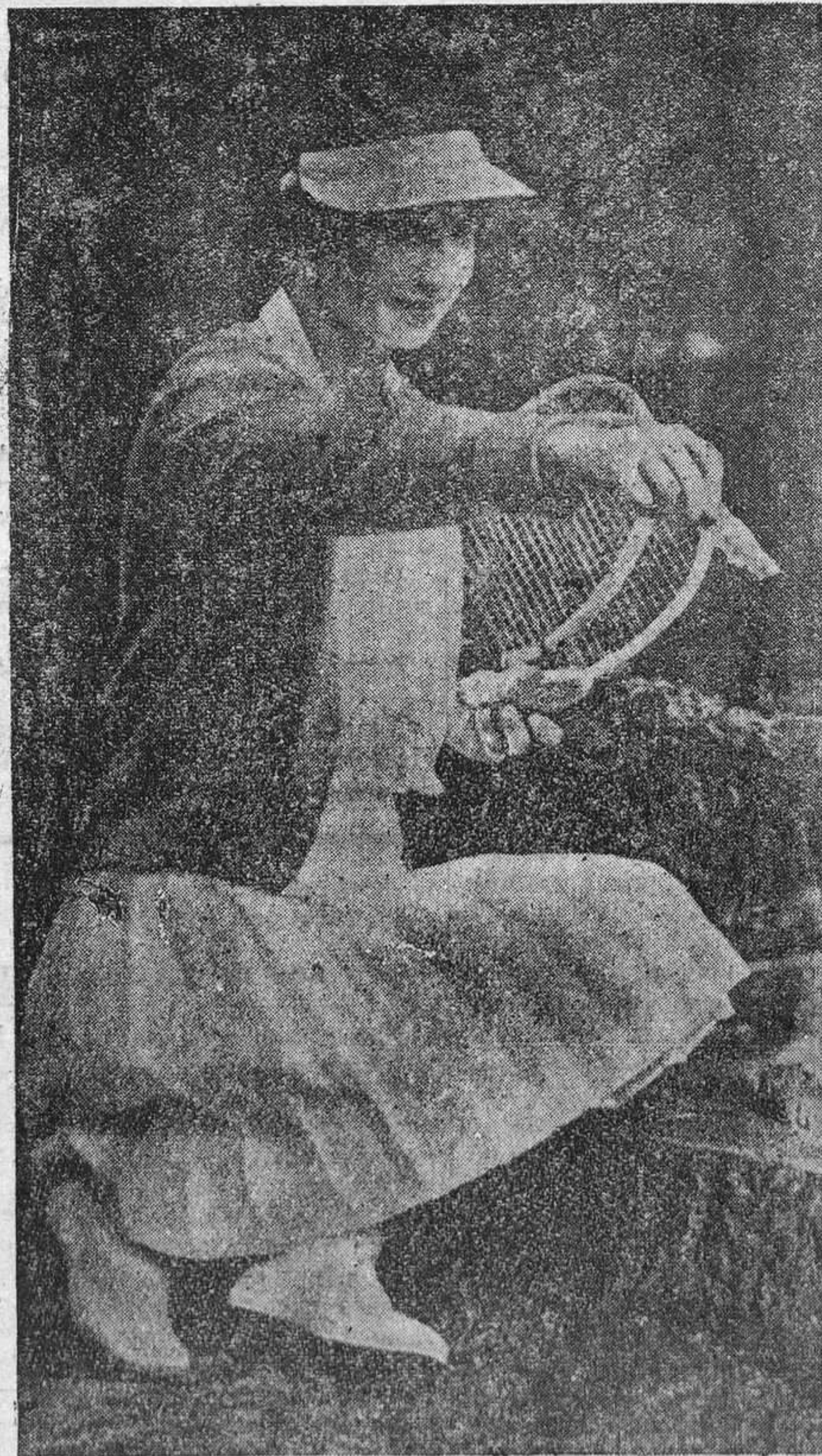
Miss Helen Wills, famosa tenista norteamericana, dando de comer a los cisnes, momentos antes de empezar los partidos en Wimbledon