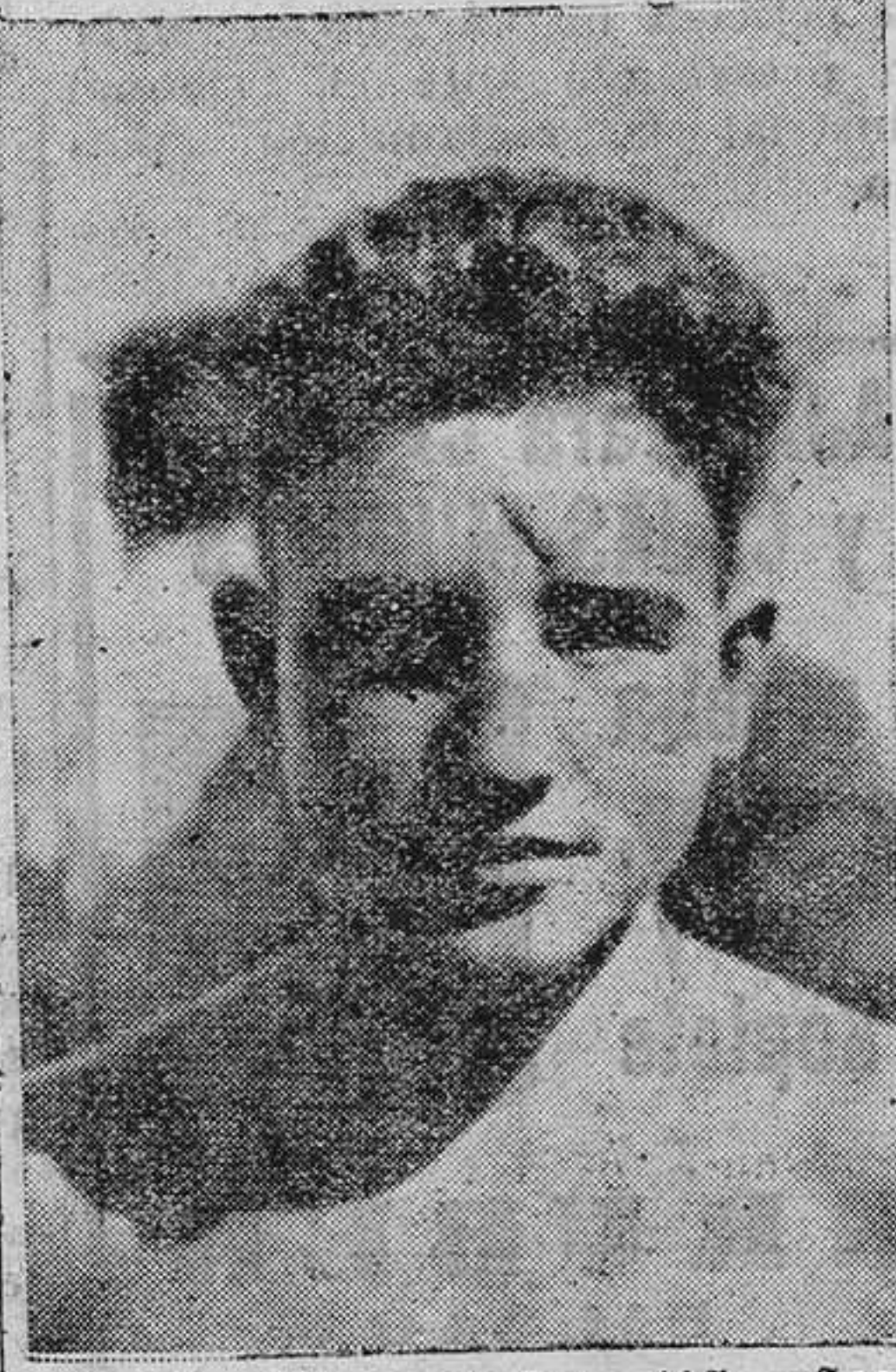
GIJON.--El nadador (15 años) que obtuvo el tercer puesto en la travesía a nado Gijón-Musel.

Nos alegraríamos que se cumpla lo que se pronostica sobre "Ablaña", ya que si sentimos satisfacción, por aquello de ser ovetense, más es para que los dirigentes de los clubs de la provincia, se den cuenta, que no les falta salir de casa para buscar buenos jugadores.