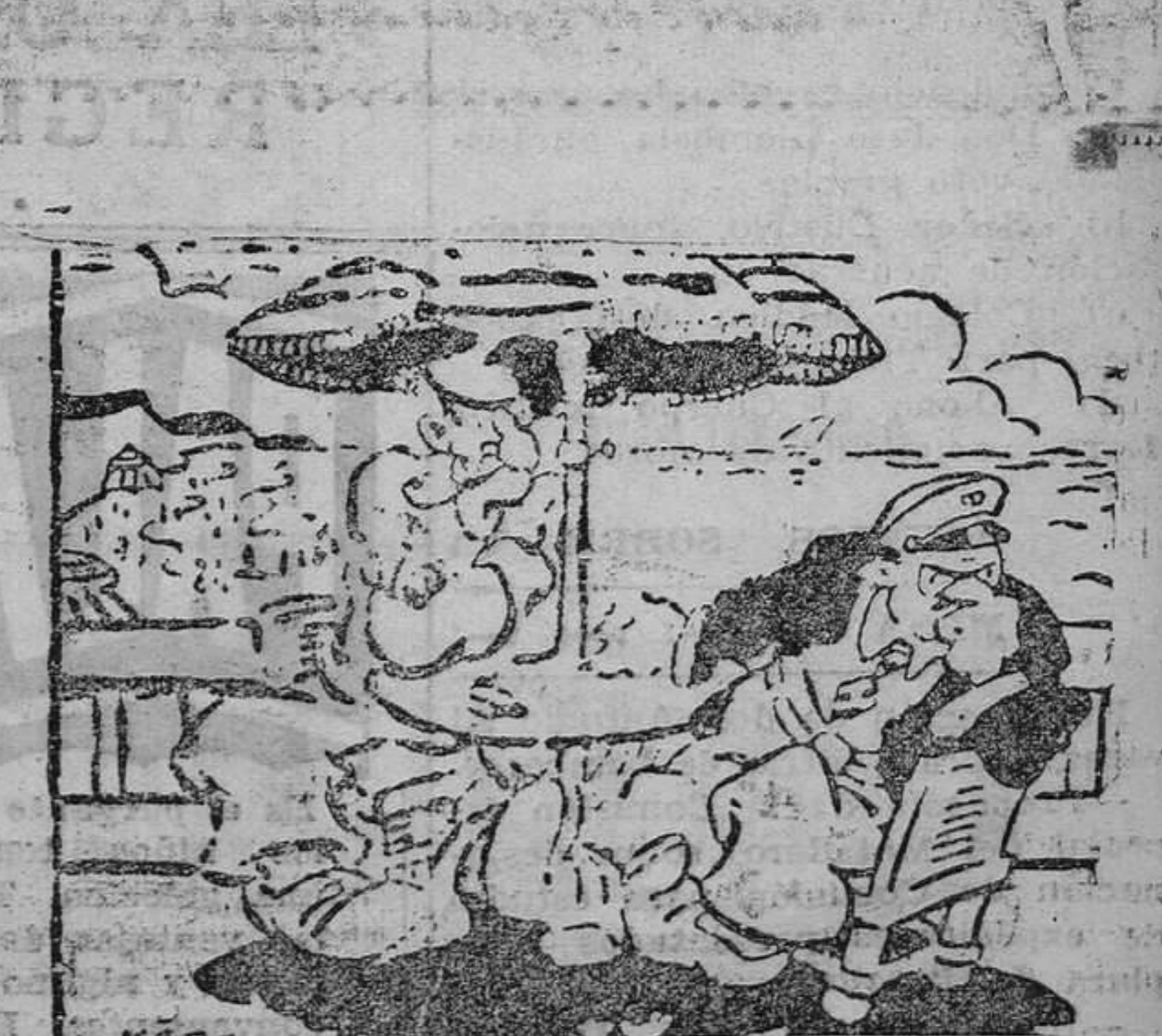
—¿Qué es lo que oyes? —Una conferencia sobre el arte de arreglar el hogar. El conductor del tranvía se encuentra por la calle con el conductor del autobús. —Mi mujer no viene. Los minutos me parecen siglos. —¿Está en el mar? —No. En la sala de bacará.