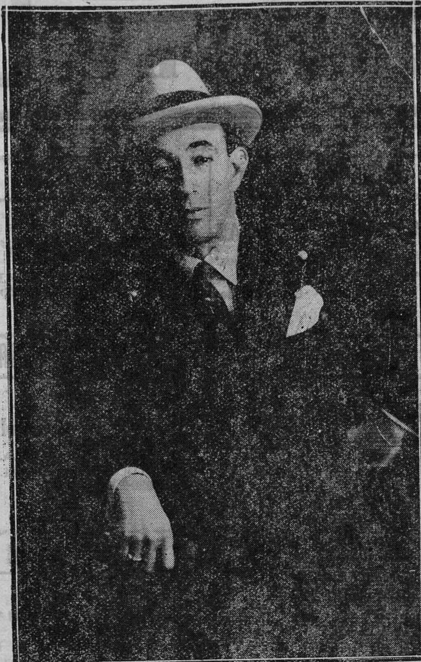
El popular gijonés Pepe Argüelles, que se encuentra en su patria chica, descansando de sus actividades cinematográficas. (Foto archivo REGION).