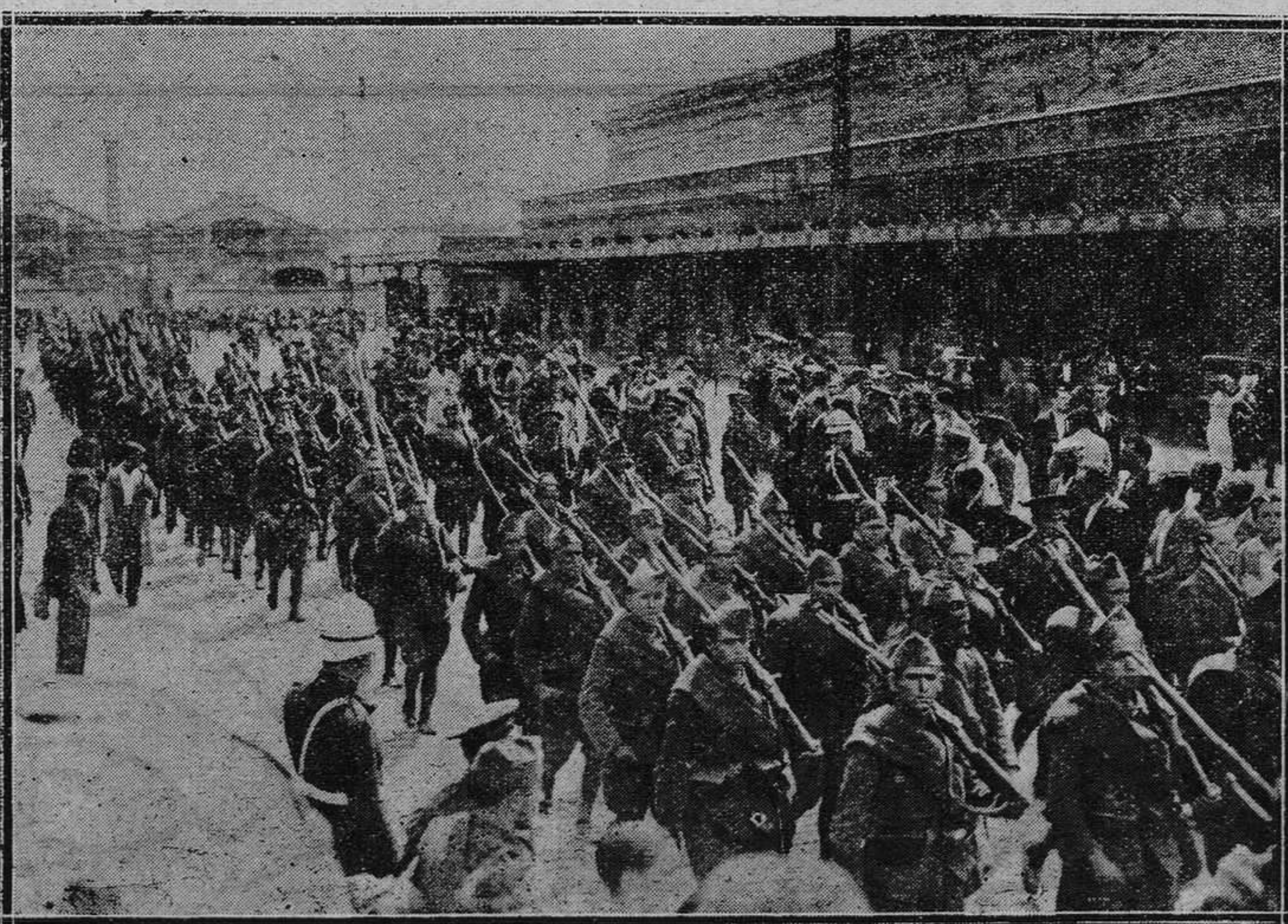
El regimiento de infantería número 1 saliendo de la estación del Mediodía a su regreso de Sevilla.

La Junta administrativa de Urias (Somiedo) solicita autorización para ligitar.