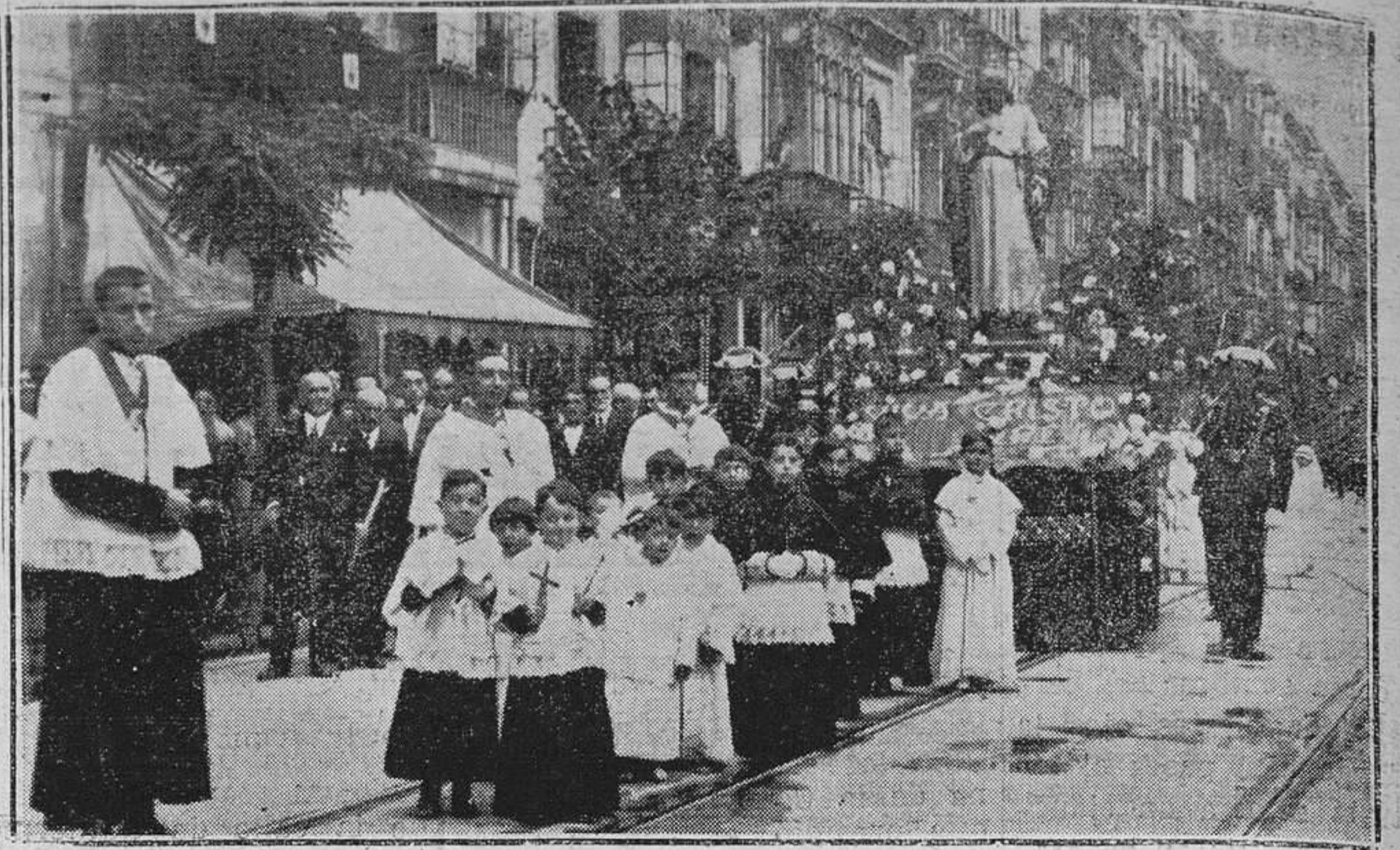
OVIEDO.-La procesión del Sagrado Corazón de Jesús, a su paso por la calle de Uría.

suspende su consulta hasta el martes 28 de este mes