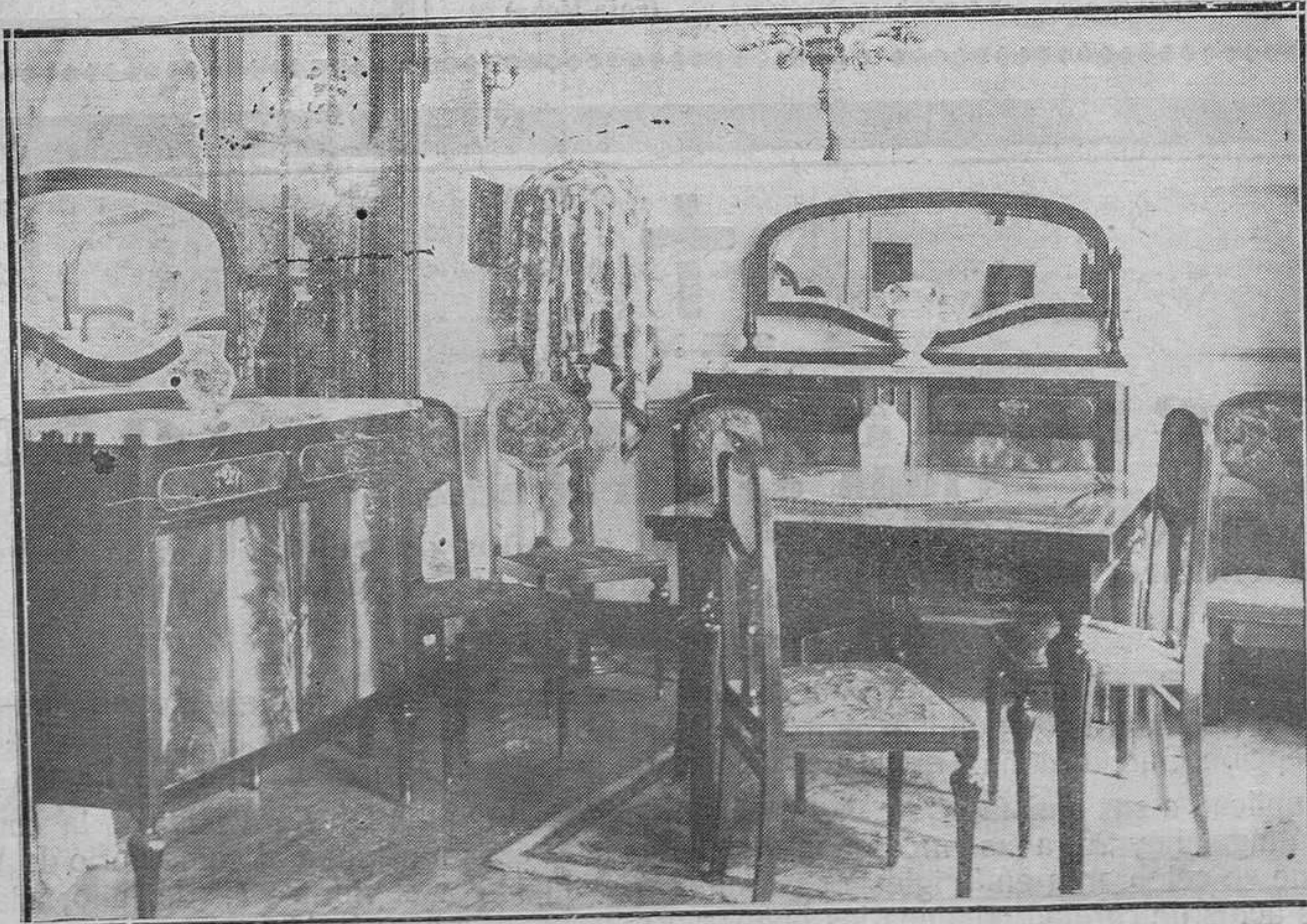
El bonito comedor que regala REGION en el Concurso de belleza, y que está expuesto en la Casa Viena.