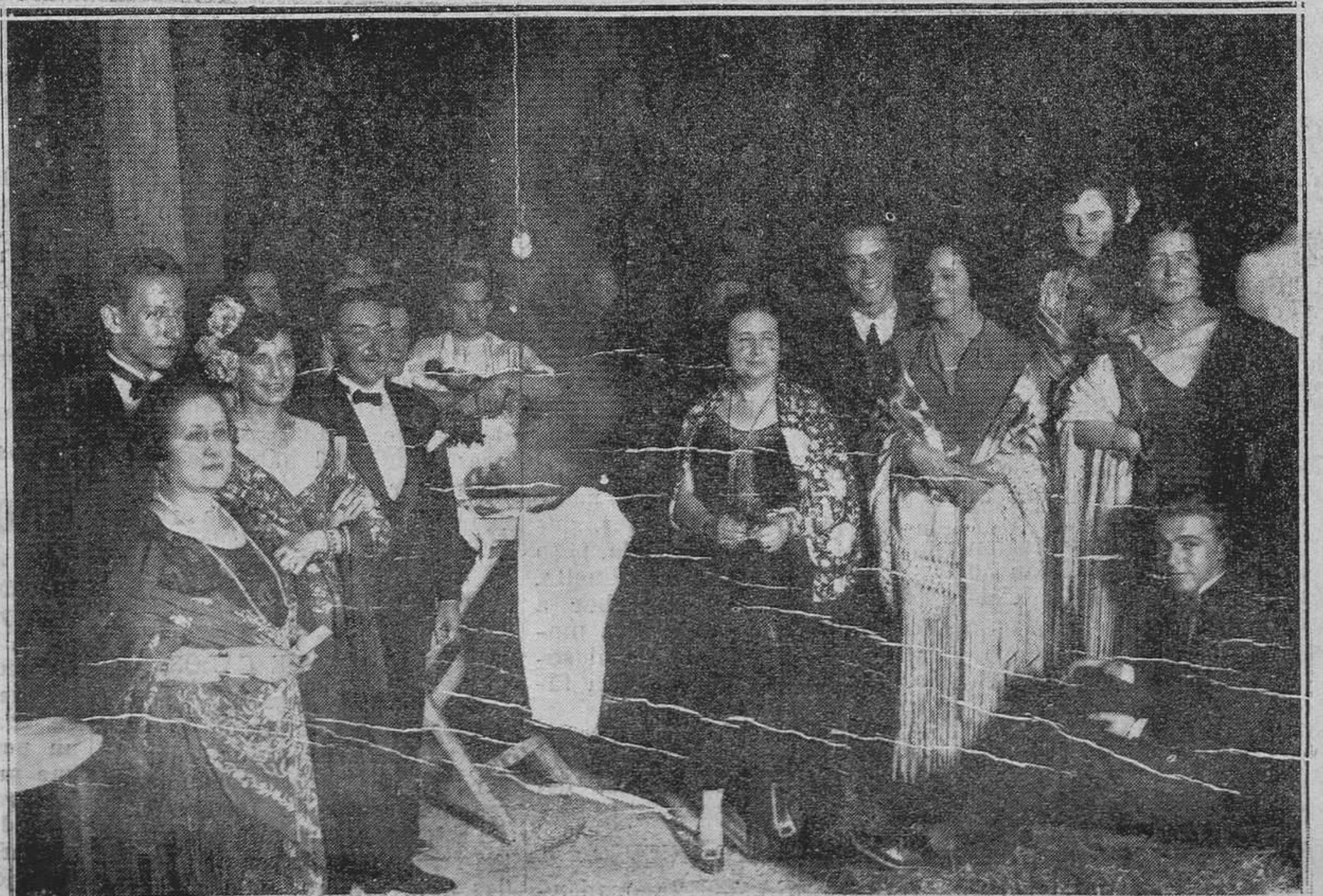
DE LA VERBENA EN EL MINISTERIO DE LA GUERRA.-Un puesto de churros.