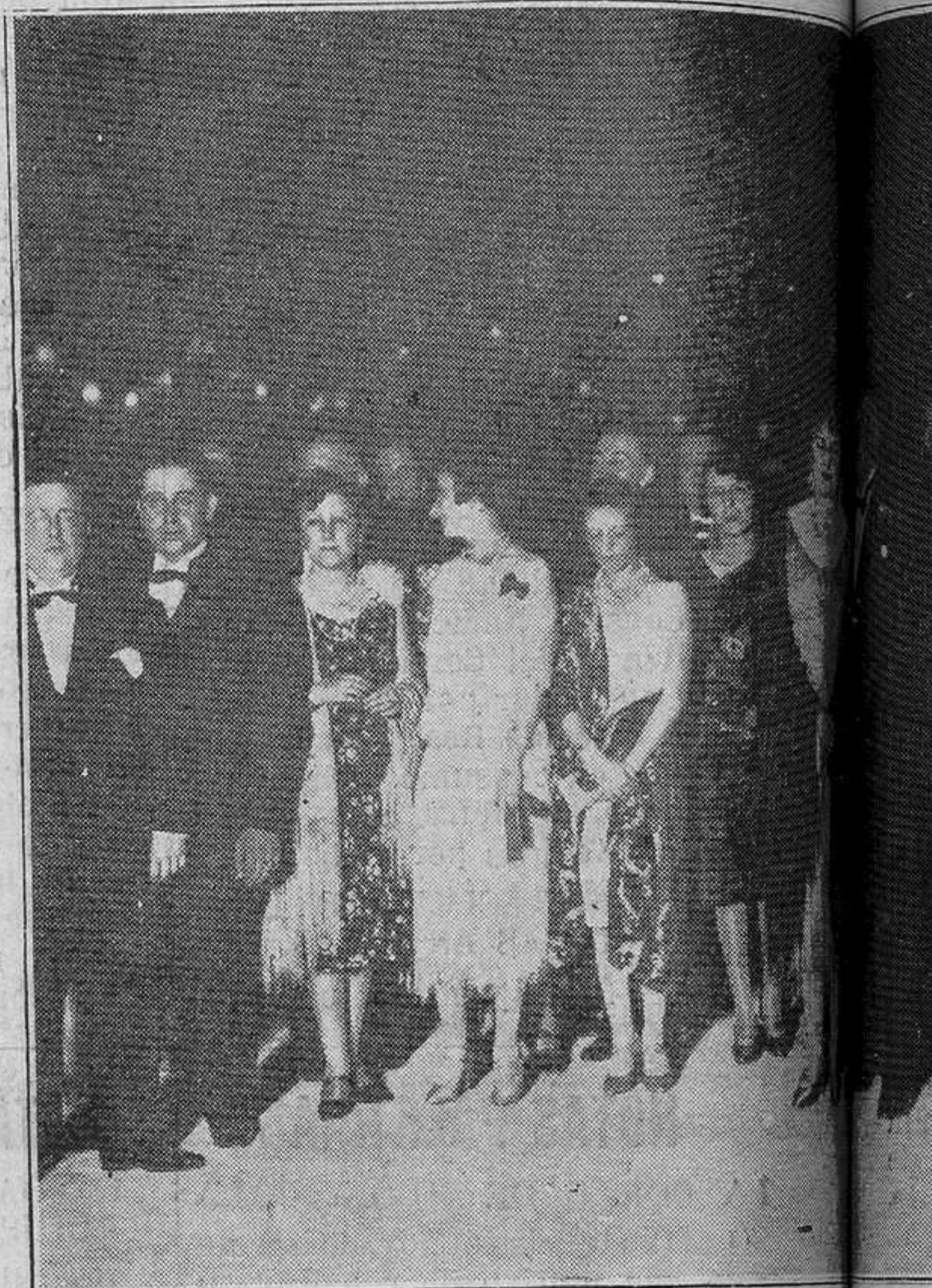
De la verbena celebrada en el ministerio de la Guerra. S. M. la Reina doña Victoria con el Príncipe de Asturias.

Si el famoso tarrén insuperable, orgullo de la patria pequeña, ye Mieres del Carmín, la palomina que vola pa l' altura formidable. Si la ruta febril endisputable,