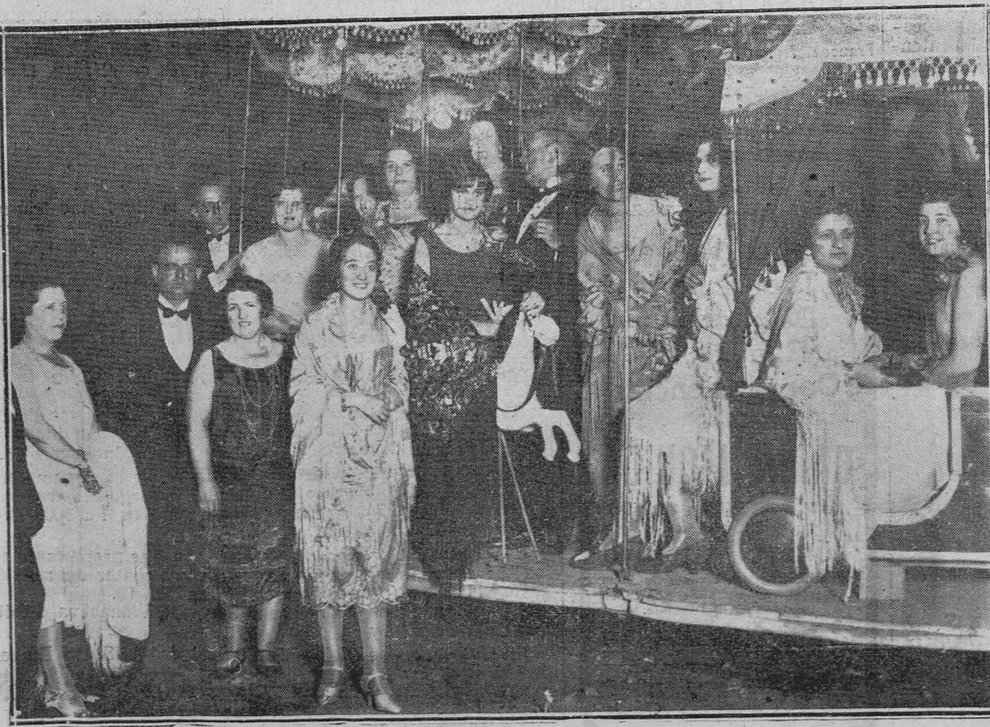
DE LA VERBENA EN EL MINISTERIO DE LA GUERRA.-Bellas señoritas en el "tío-vivo,,,"

Nuestra primera visita fué a la Escuela Materna. Estaban los niños jugueteando y saltando alegremente entretenidos en el campo de recreo. Al vernos suspendieron unos momentos sus infantiles juegos, mirando con curiosidad a los extranjeros. El simpático y amable inspector nos iba mostrando minuciosamente las amplias salas de clase, llenas de luz, repletas de material moderno; todas con calefacción y hermosas cantinas para dar de comer gratuitamente a los niños; botiquín y médico para recomendar a los niños y curar a los enfermos; salones de gimnasia