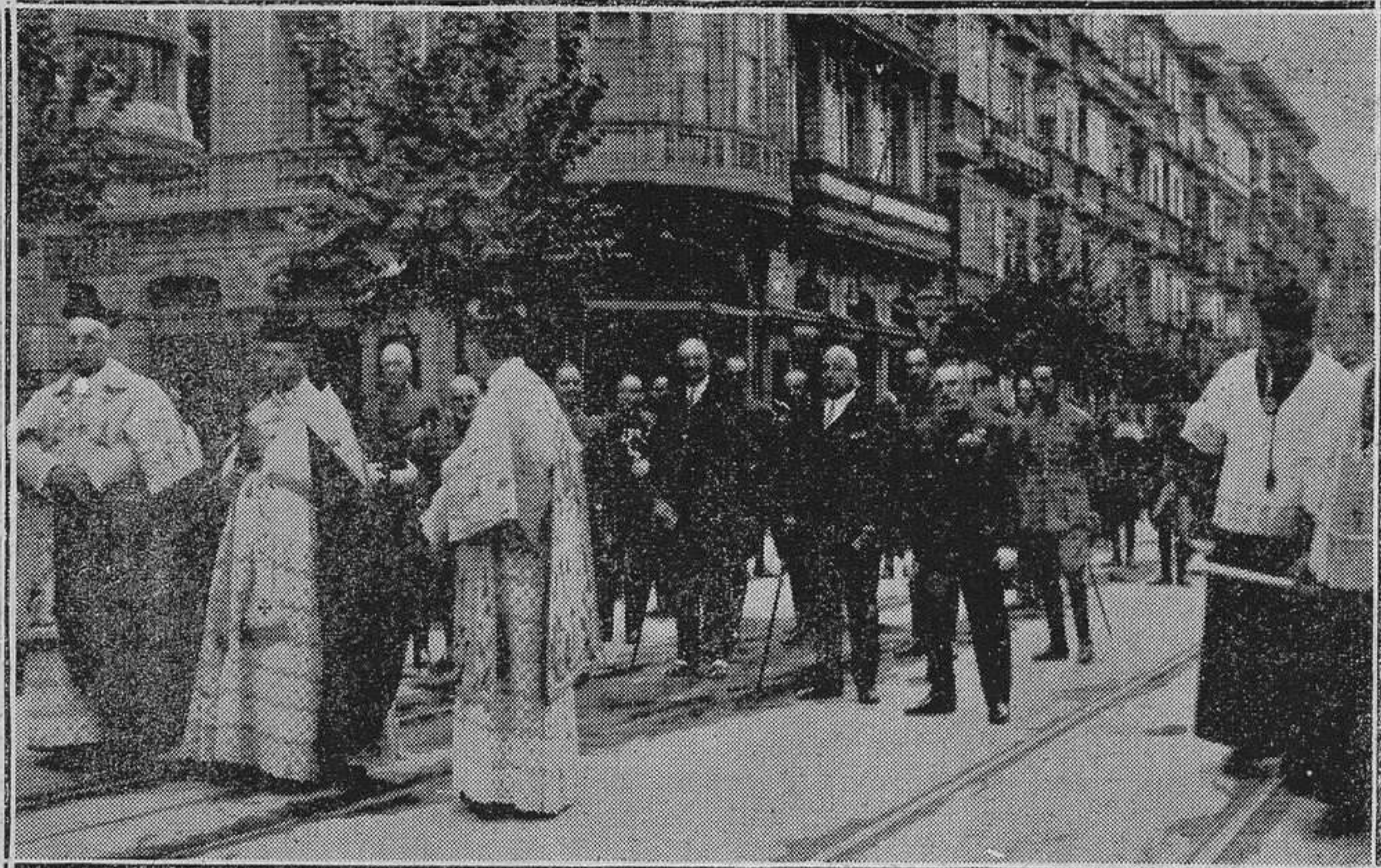
OVIEDO: LA PROCESION DEL SAGRADO CORAZON DE JESUS.-Las autoridades que presidieron el acto.