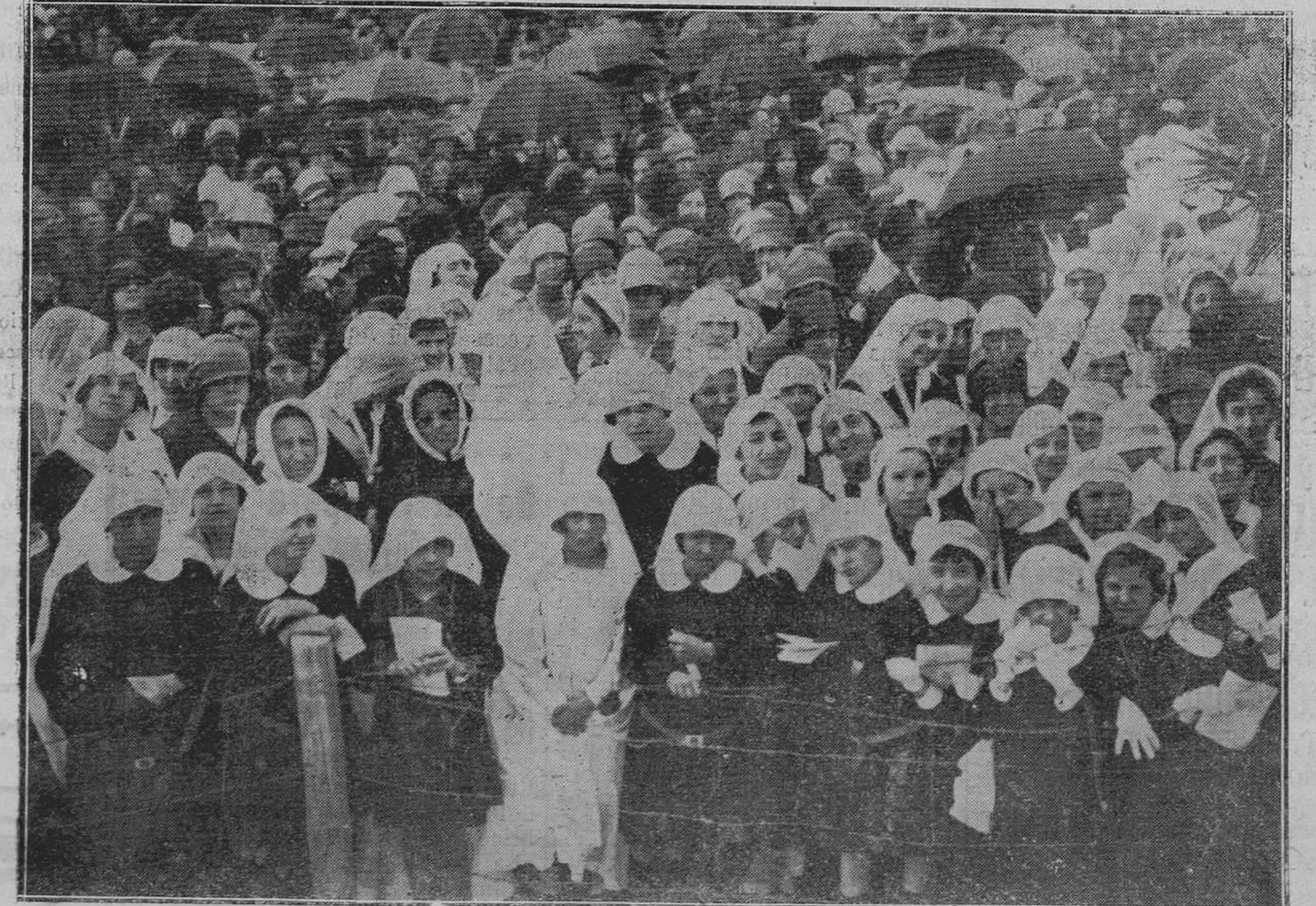
De la solemnidad religiosa celebrada en el Cerro de los Angeles. Las alumnas del Colegio del Sagrado Corazón de Jesús.