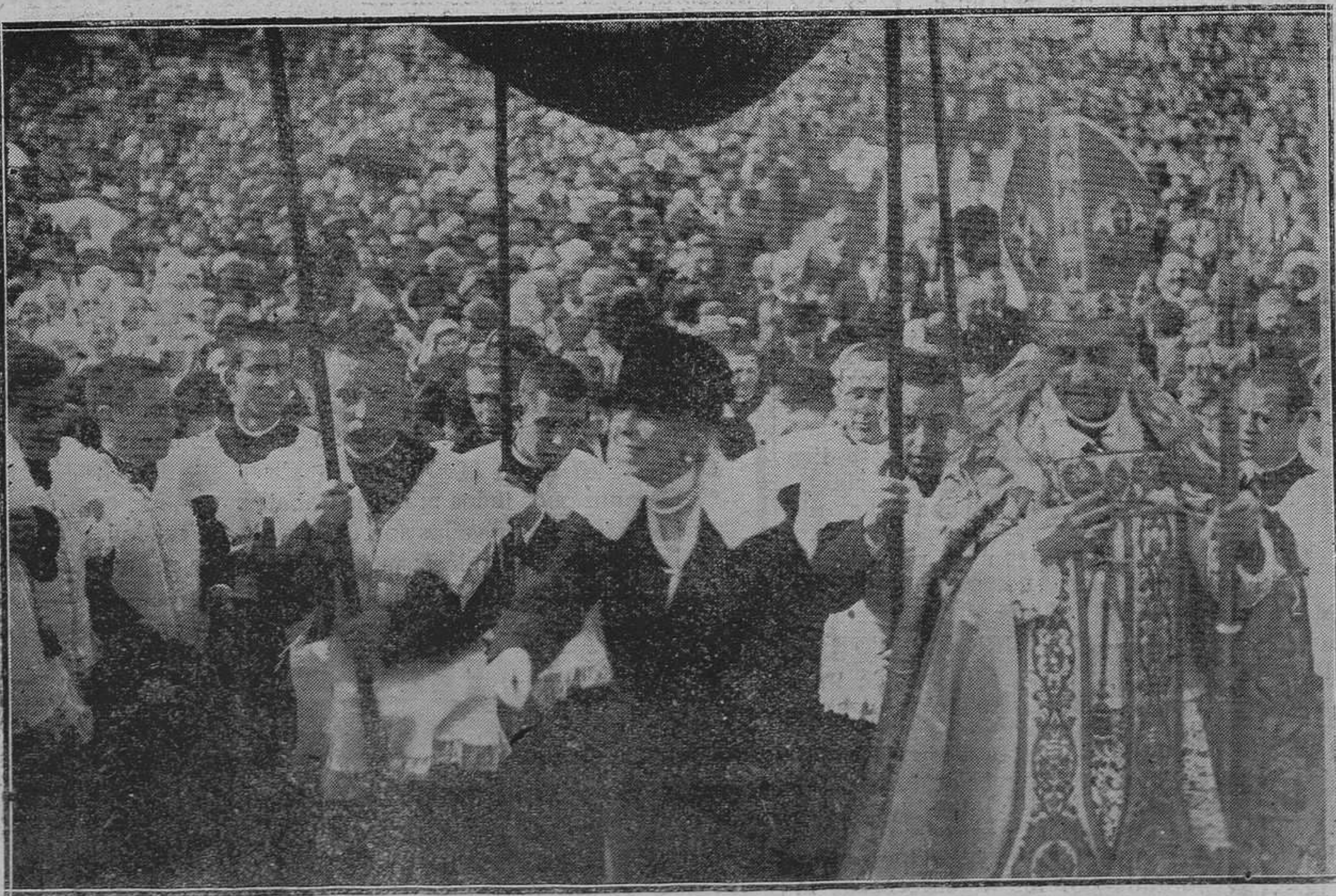
De la solemnidad religiosa celebrada en el Cerro de los Angeles para dar las gracias al Sagrado Corazón de Jesús por el completo restablecimiento de S. M. el Rey.—Llegada de S. M. la Reina doña María Cristina, acompañada del Obispo de Madrid.