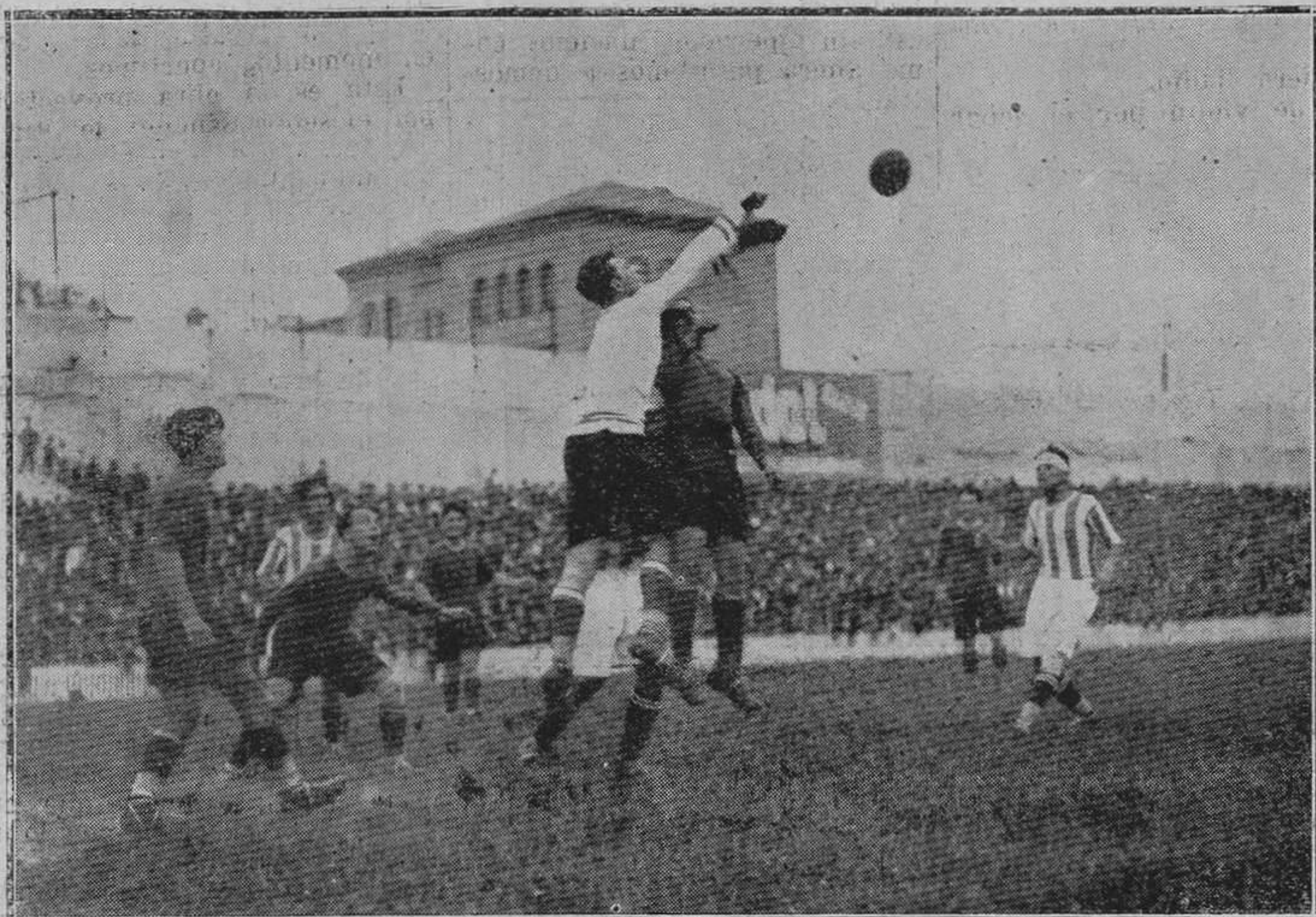
MARID.-Del partido de desempate jugado entre los equipos Real Betis Balompié, de Sevilla, y Barcelona F. C.; venció éste último por 1-0.

Será, a no dudar, una fiesta lírica verdaderamente magna, que perdurará en el recuerdo de los amantes del canto y del arte regional.