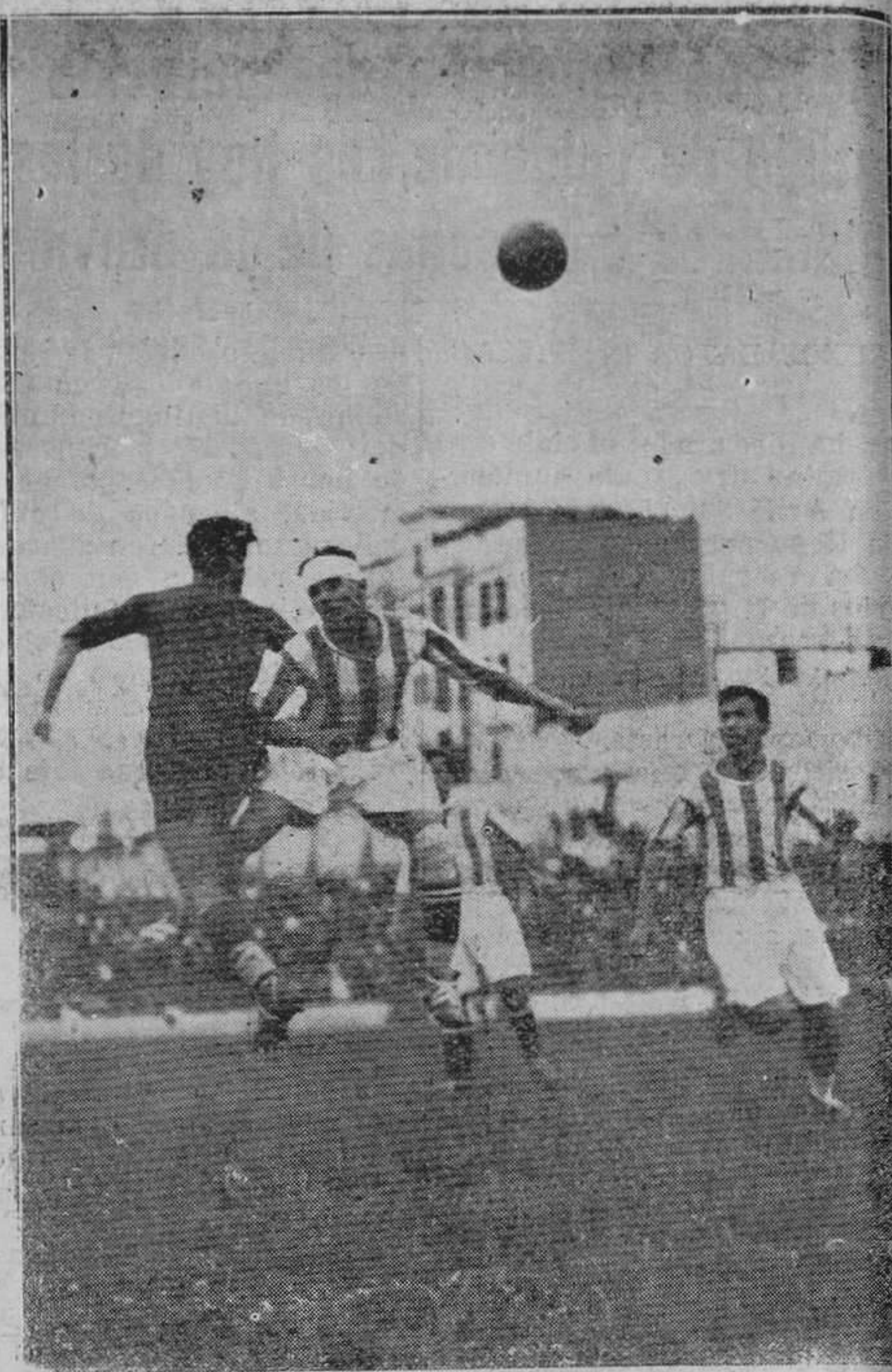
MADRID.-Del partido de desempate jugado entre los equipos Real Betis Balompié, de Sevilla, y Barcelona F. C.; venció éste último por 1-0.

periodísticas enviadas desde Trubia comentando la primera vuelta de campeonato entre el Athletic Club de Lugones y el Juvencia F. C. Trubieco, rompemos nuestro silencio para lamentarnos de que se pretenda llevar por distintos cauces el resultado de los dos encuentros habidos, puesto que el fruto de sus campañas, tampoco puede corresponder a los mismos deseos ya manifestados en el anterior campeonato, en que nuestro equipo local, alcanzó la copa de subcampeón de segunda categoría.