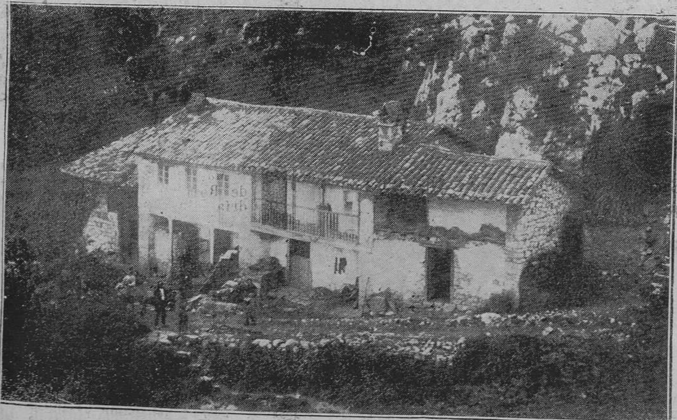
NARANCO.-Casa cercana al monte de la Cogolla, donde nos refirieron interesantes leyendas acerca del mismo que publicaremos mañana.

Mieres 1.º de mayo de 1927.—El presidente, Gaspar García de Viedma.