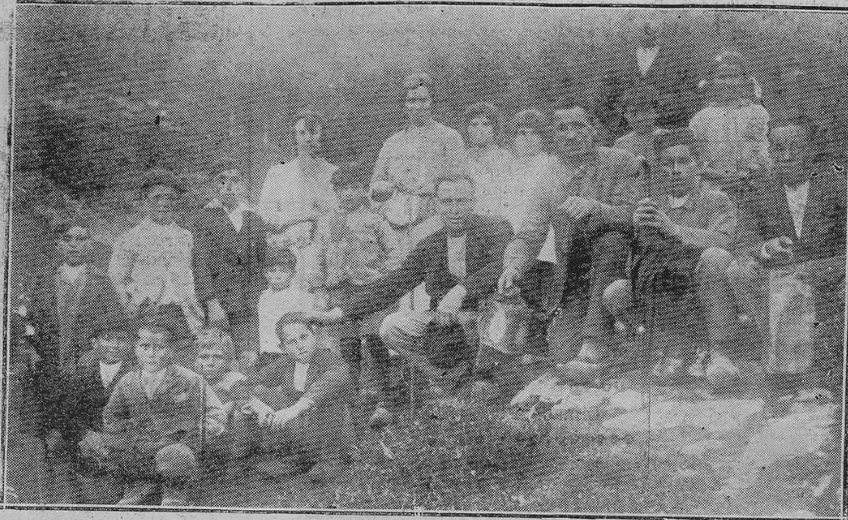
NARANCO.-Un grupo de vecinos de Fitoria que nos hicieron interesantes relatos sobre las leyendas de aquellos contornos.