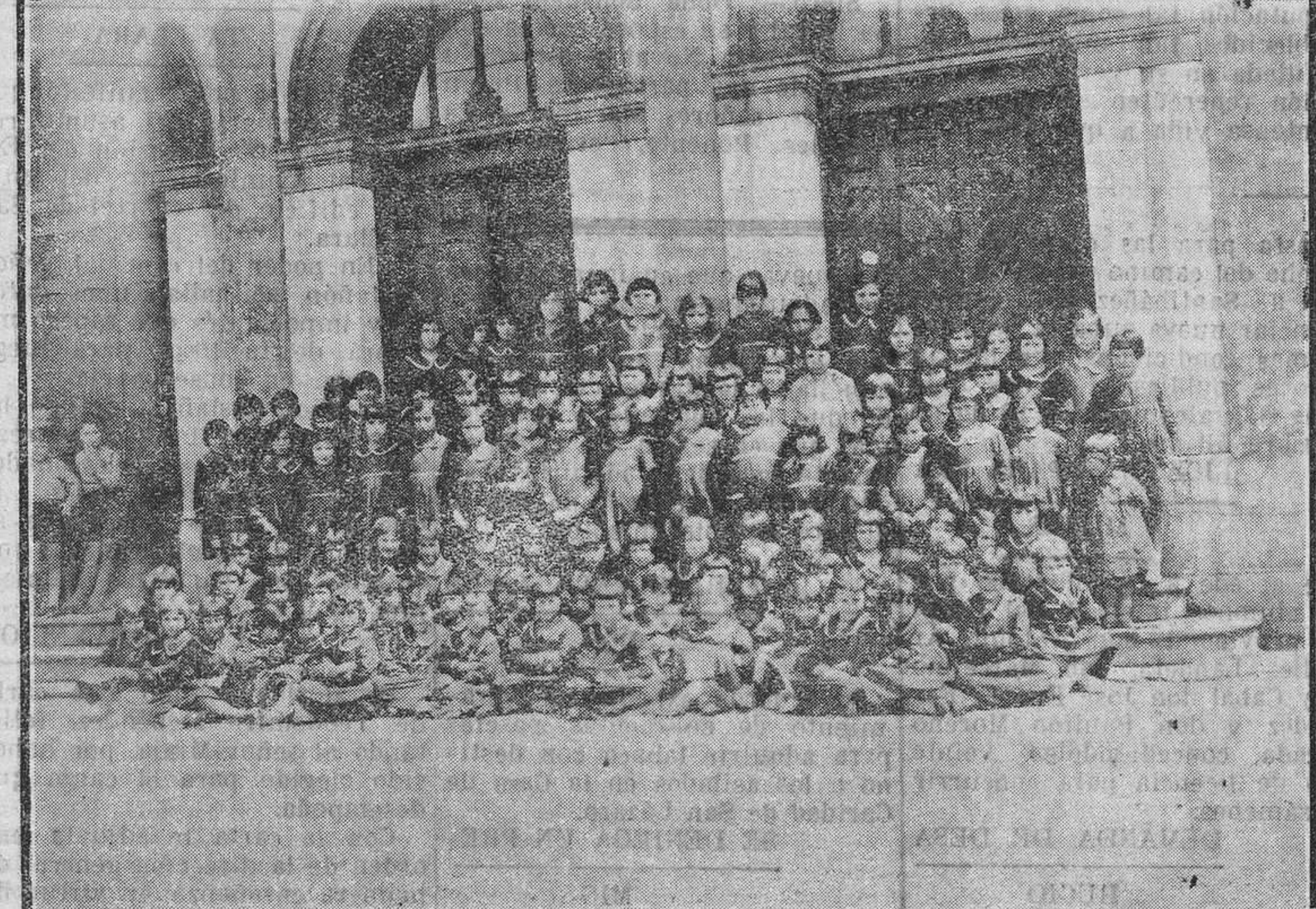
ARRIBA.—La directora y las maestras de las escuelas municipales con sus cursillistas que hacen sus prácticas en las mismas.—ABAJO: Las niñas de los tres grados de las escuelas municipales luciendo sus nuevos uniformes.

Por lo cual, continuará la fabricación. La fábrica tiene ya importantes pedidos de Madrid, Alicante, La Coruña, Vigo, Santander, etcétera. Aparte de la producción de estos engranajes y de otras cosas análogas por su finalidad netamente pacífica, continúa con toda normalidad la de material de guerra con arreglo a los planes ordinarios. Inmediatamente se emprenderá la construcción de seis baterías de diez y medio, veinticuatro piezas en total, dos de quince y medio, de obuses, dos más, de quince, y algunas otras.