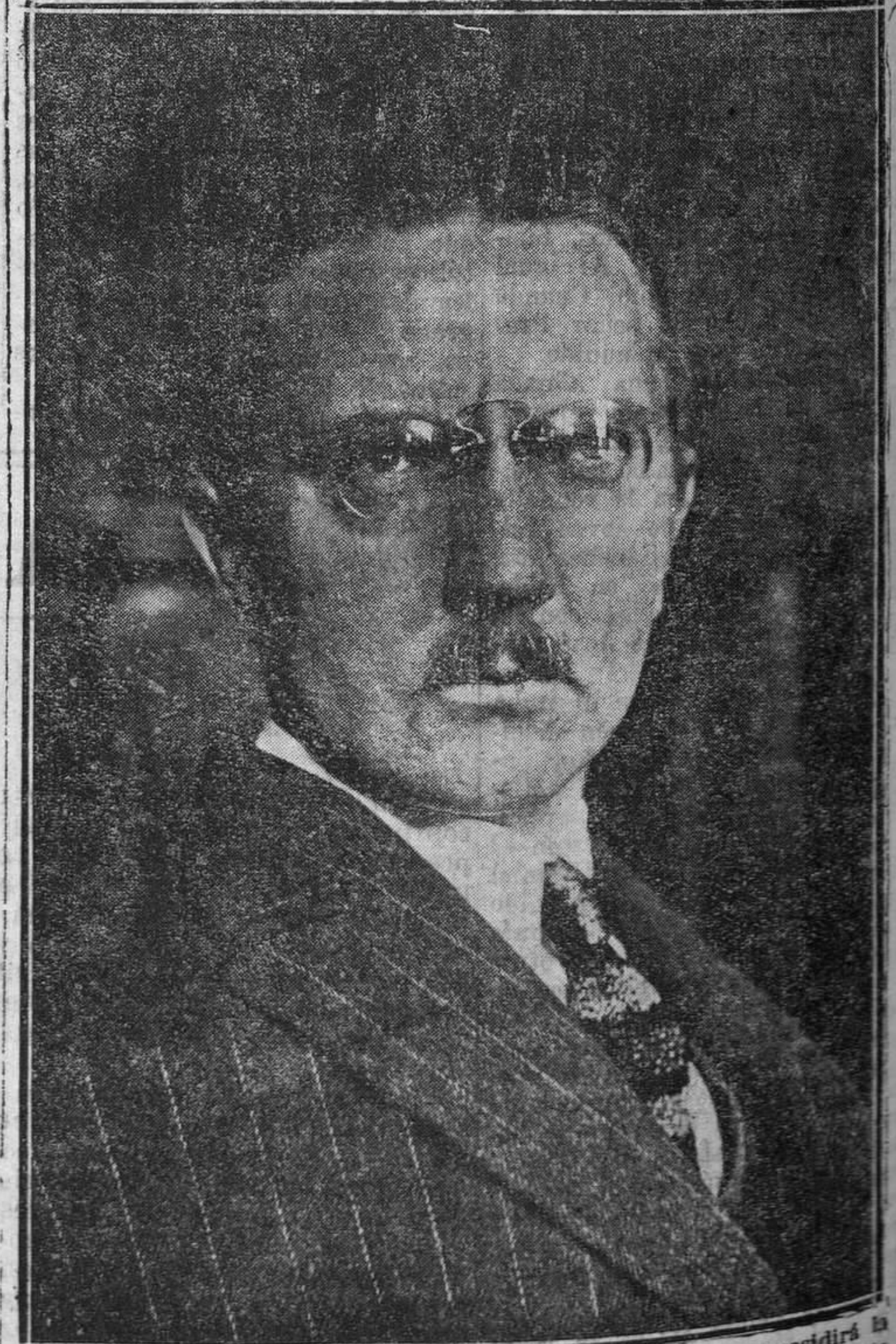
El doctor SCHACHT, ex director del Reichsbank, que presidirá la delegación alemana en la próxima conferencia de Lausana.