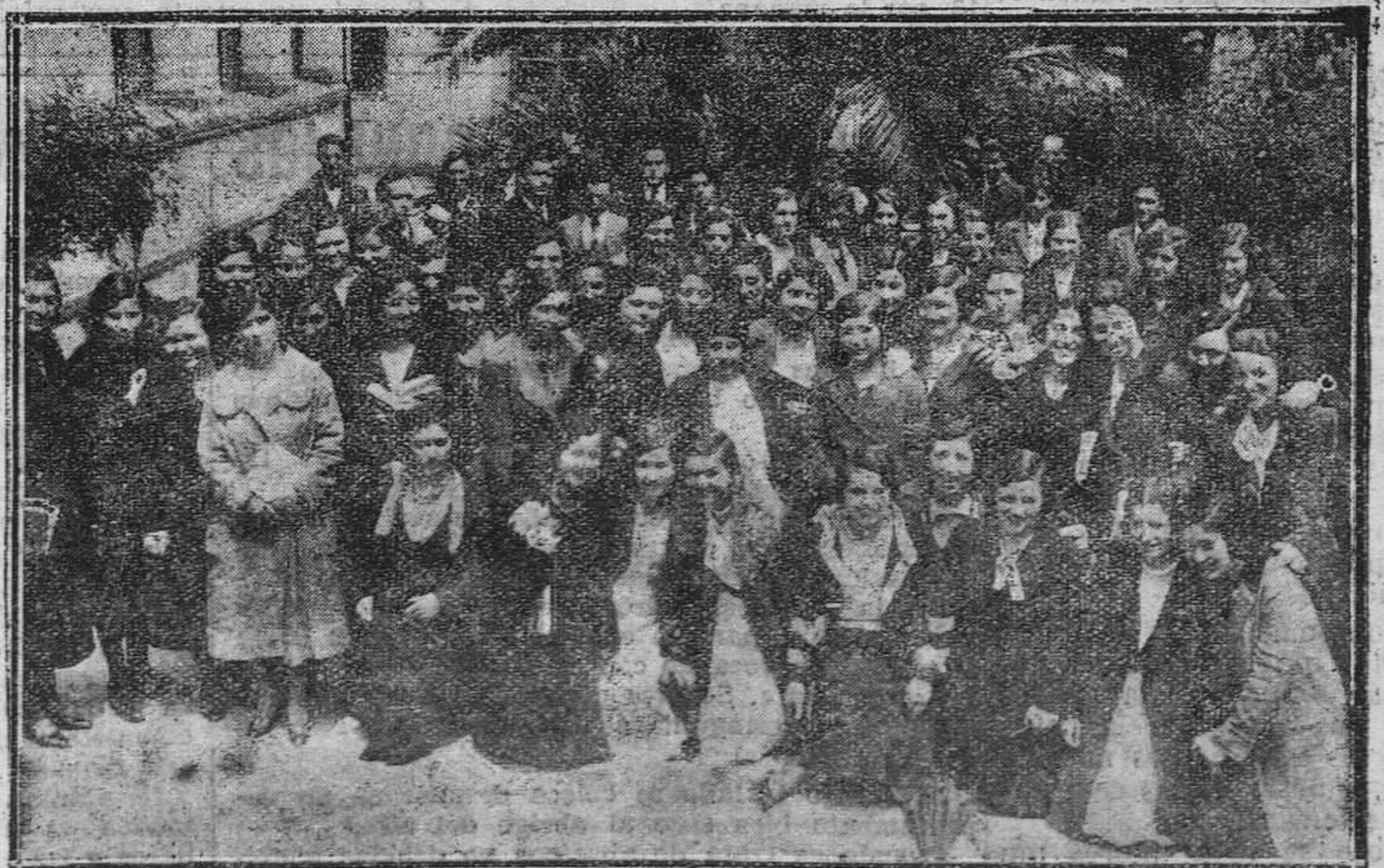
OVIEDO.—Las alumnas de cuarto curso de la Escuela Normal que acaban de adquirir el título de maestras. (Foto Méndiz).

Se espera en este puerto la entrada de los vapores "Caruso", "Astur" y "Santiago López", que cargarán 1.340, 1.200 y 4.000 toneladas de carbón, respectivamente, para distintos puertos.