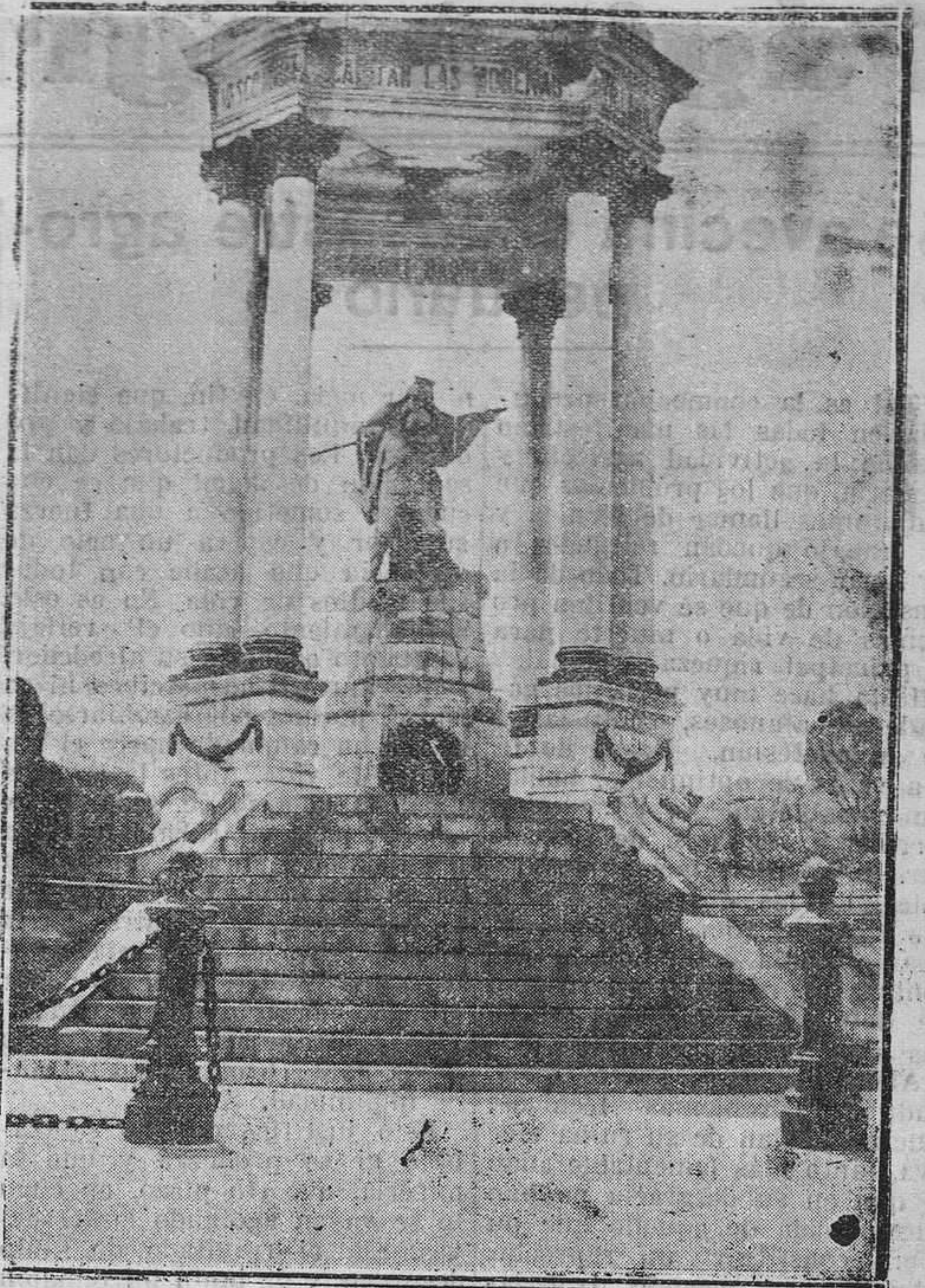
MADRID.—Vista del monumento a los héroes de Caney después de haber sido colocada una corona, dedicada por la colonia norteamericana de Madrid con motivo de la conmemoración del "Memorial Day".

Oviedo, 30 de mayo de 1932.— EL OBISPO DE OVIEDO.