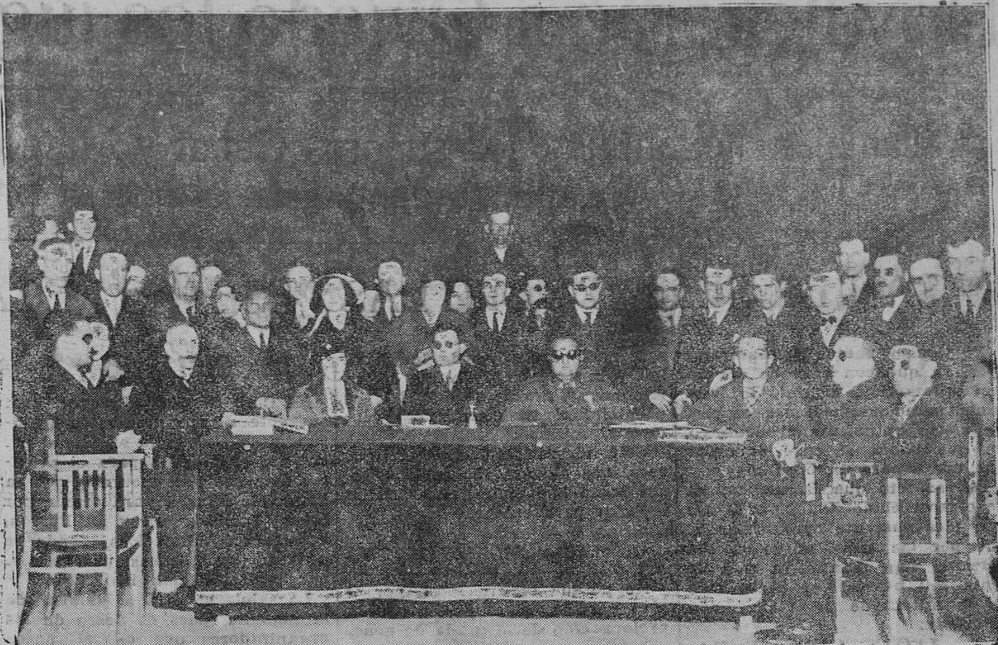
MADRID.—Sesión de apertura de la primera asamblea de la Federación Nacional de Ciegos Españoles.