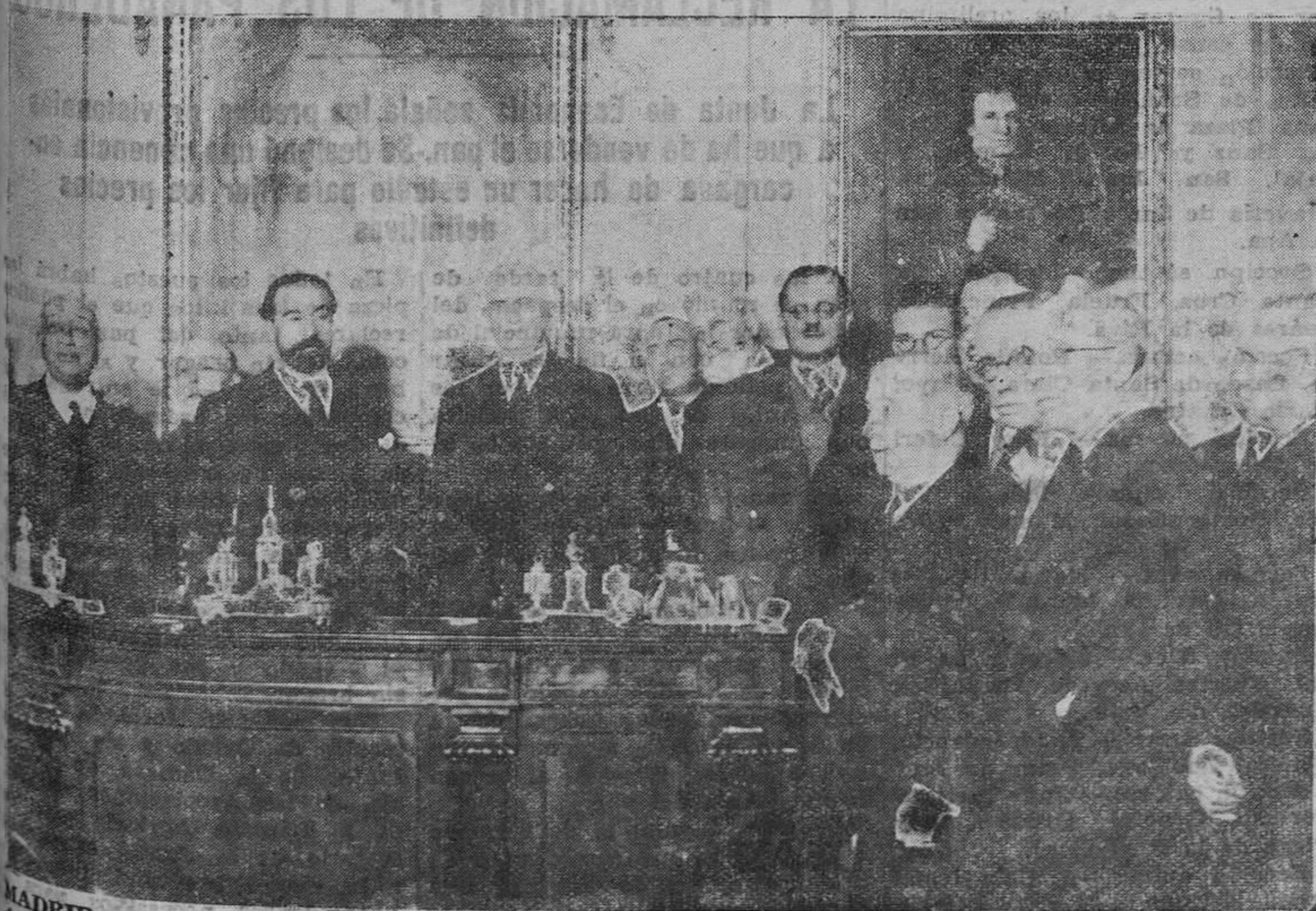
MADRID.— La presidencia de la sesión a la memoria del insigne don José Echegaray, con motivo de cumplirse el centenario de su nacimiento, acto celebrado en la Escuela de Caminos, Canales y Puertos. (Foto Vidal).

Una ponencia formada por el alcalde de Oviedo y los representantes de la Cámara de Comercio, de las Asociaciones obreras, de la Cámara Agrícola y el secretario de la Junta examinará a la mayor brevedad todos los antecedentes necesarios para fijar de modo definitivo el precio a que justamente deba venderse el pan.