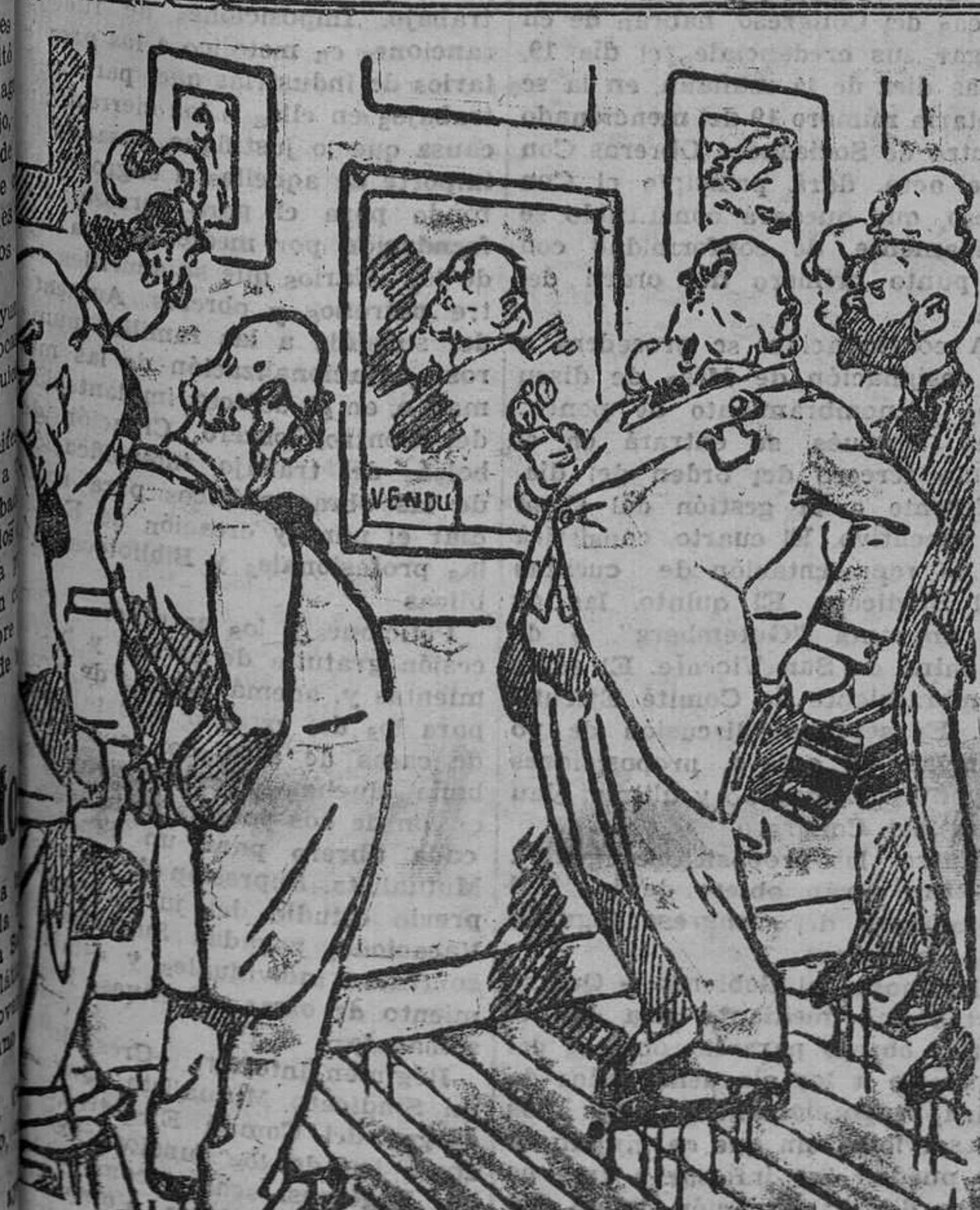
EL SENADOR.—¡Saque ese rótulo de "vendido" a mi retrato!