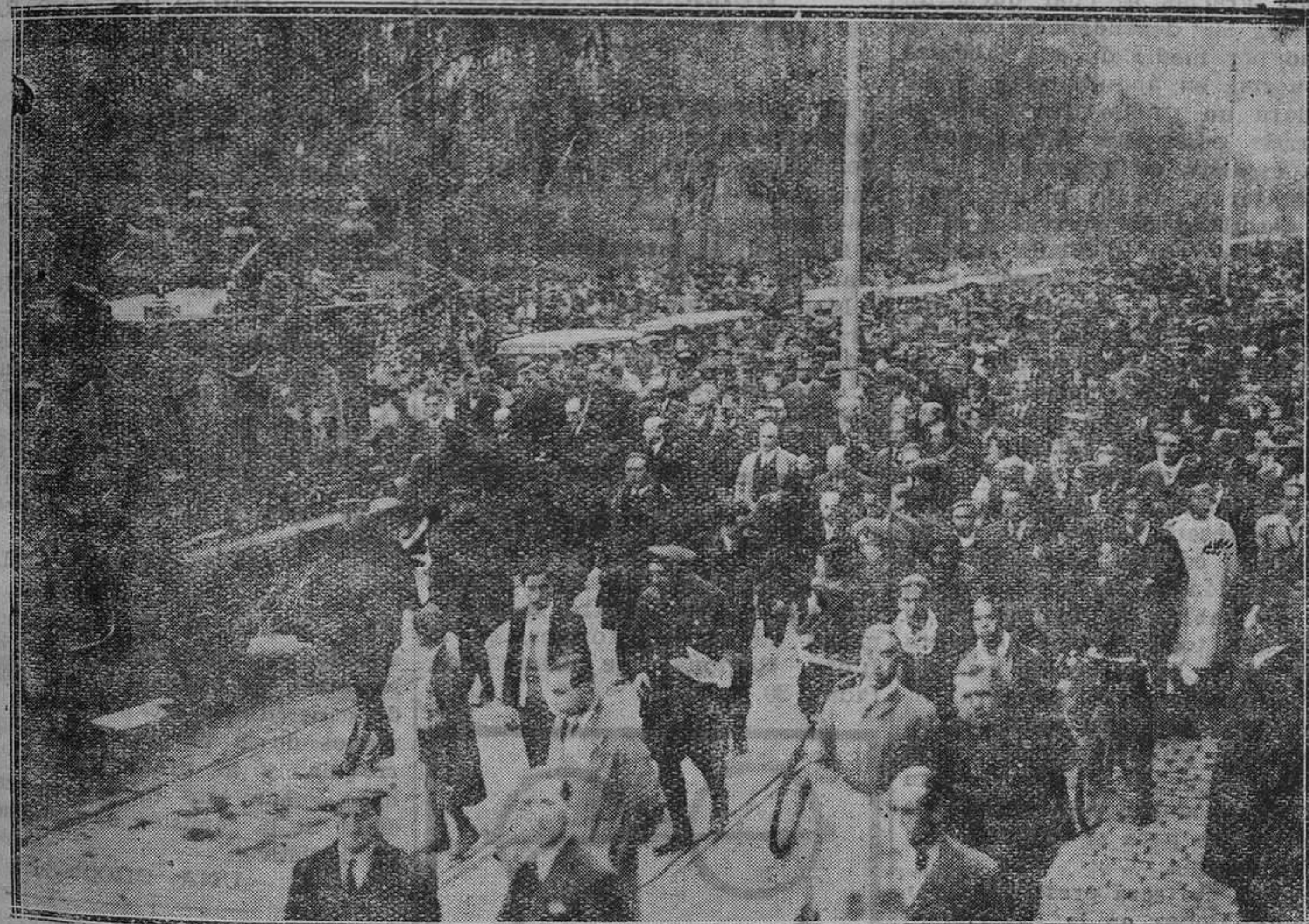
MADRID.—Entierro del guardia de asalto muerto en Toledo. La fúnebre comitiva al dirigirse al cementerio.

lo, para demostrar su procedencia americana. Y el sello americano, viene en el desplace... una americana.