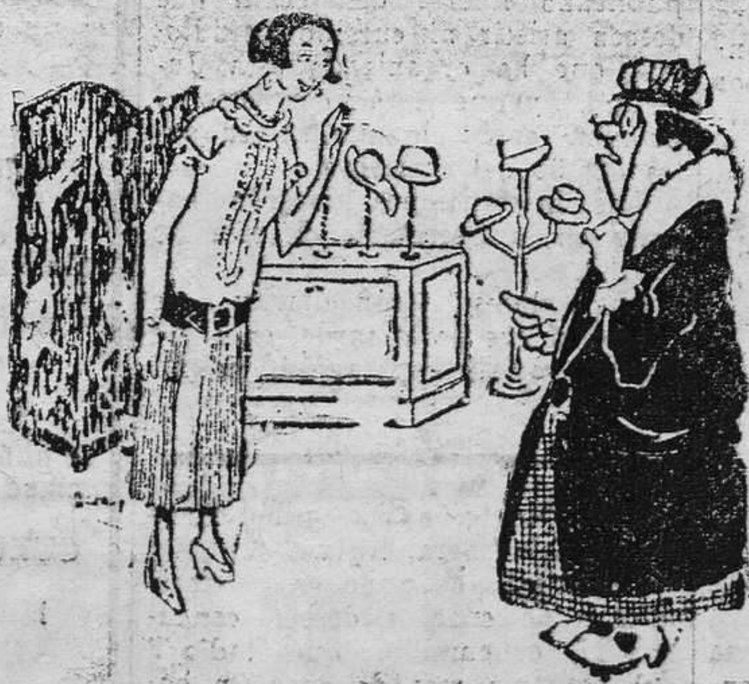
—¿Es esta la tienda de los cien mil sombreros? —Sí, señora. —Enséñemelos usted. Quiero probármelos.