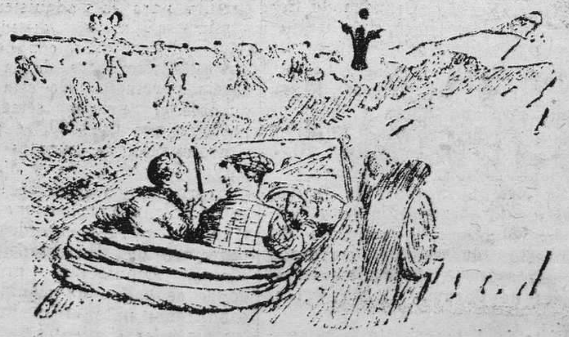
LA SEÑORA CORTA DE VISTA.—Dios mío! ¡Un bandido! No pares. Sigue deprisa.