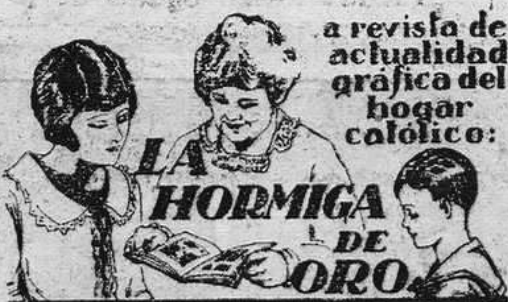
a revista de actualidad gráfica del hogar católico:

Por ello, su fallecimiento ha sido sentidísimo, tanto más cuanto que, por otra parte, dada la buena salud de que disfrutaba, nadie podía esperar tan temprano fin, que sobrevino después de rapidísima enfermedad. El duelo fué general, no sólo en Cuerrias de Maza, sino también en todos los de aquellos alrededores, lo mismo que en esta localidad, donde los padres, hermanos y demás parientes del finado están recibiendo innumerables manifestaciones de pésame a las que unimos la nuestra muy de corazón.