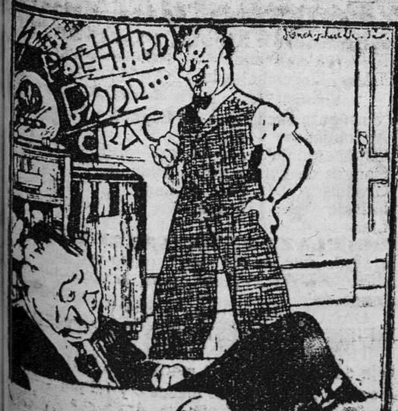
—¿Cómo puedes escuchar dos horas entera seste girigay? —Te olvidas de que he sido cuatro años árbitro de foot-ball.

—Sí, nos contestó; salieron porque han intercedido por ellos, y ahora serán ellos, los que emitan los "sufragos" por los demás.