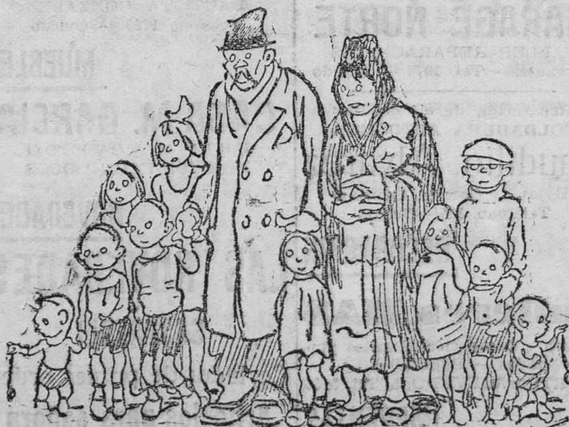
SE ACABARON LOS SUBSIDIOS A LAS FAMILIAS NUMEROSAS

Stadium de BUENAVISTA CLUB GIJON OVIEDO F. C. A las 3 y cuarto de la tarde HOY, DOMINGO