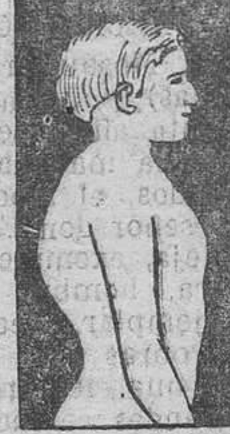
MAL DE POTT