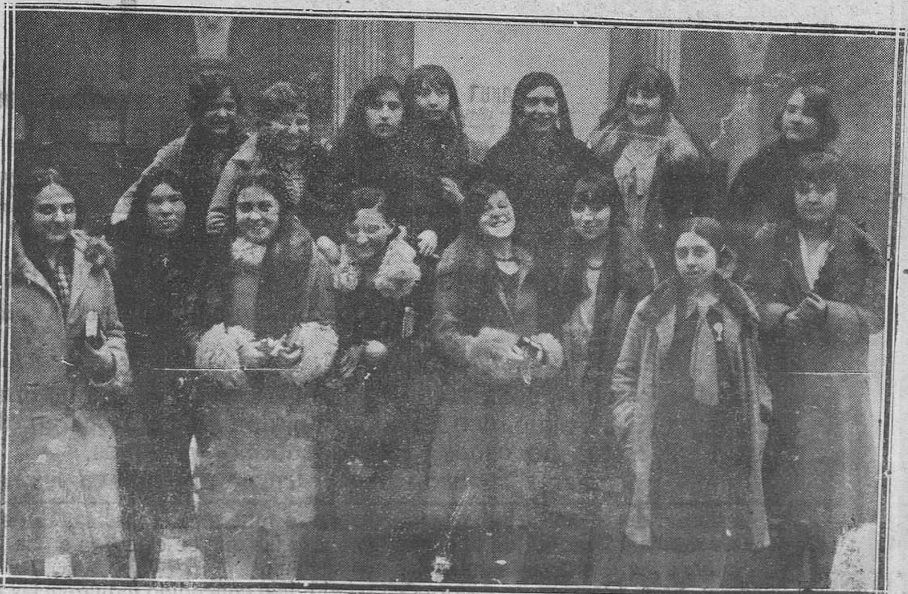
OVIEDO.—Grupo de bellas estudiantes en el patio de la Universidad, a la salida de la misa celebrada el día de Santo Tomás.