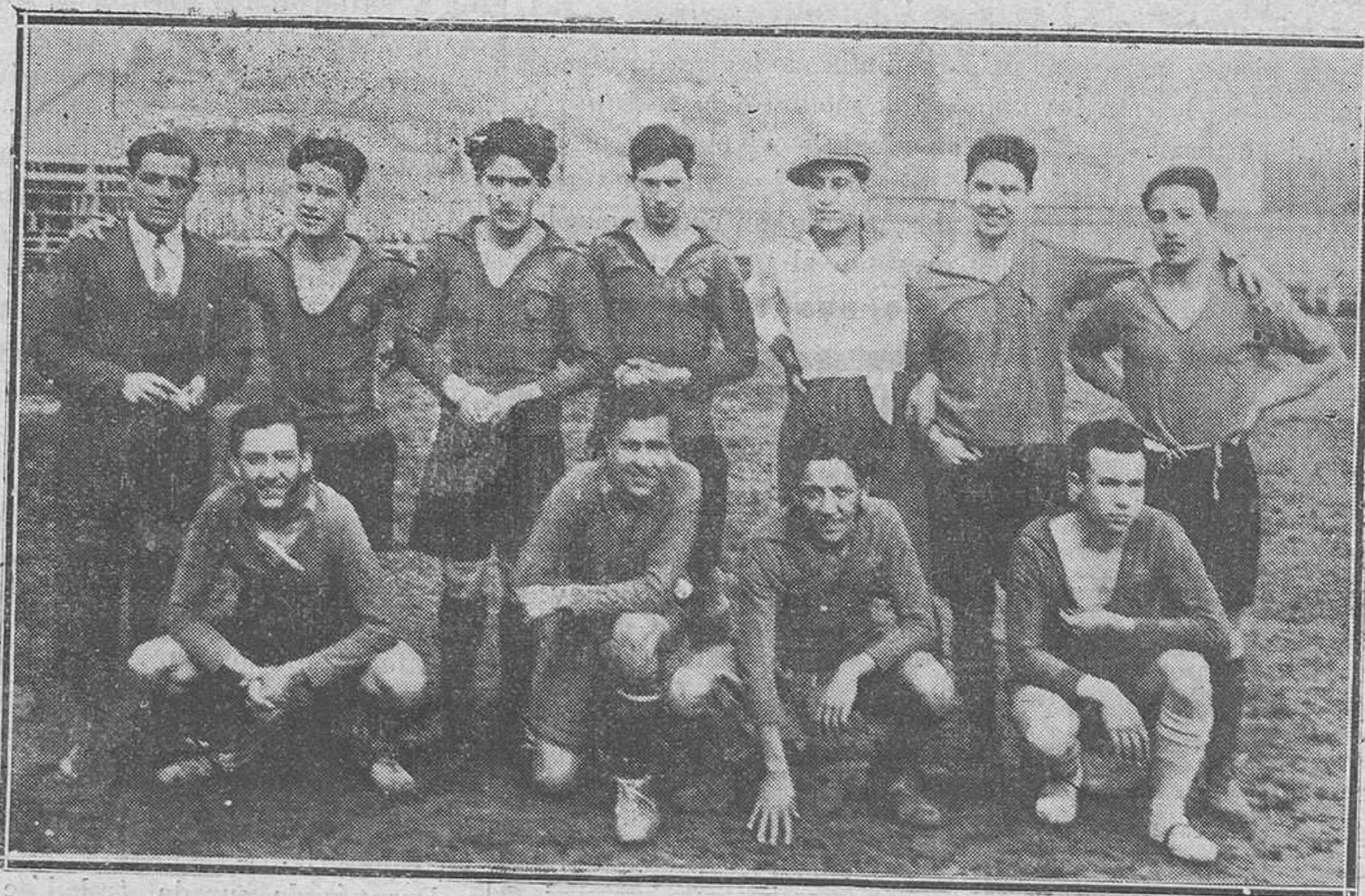
OVIEDO.—Del partido matinal del domingo en Teatinos.—El equipo de estudiantes católicos