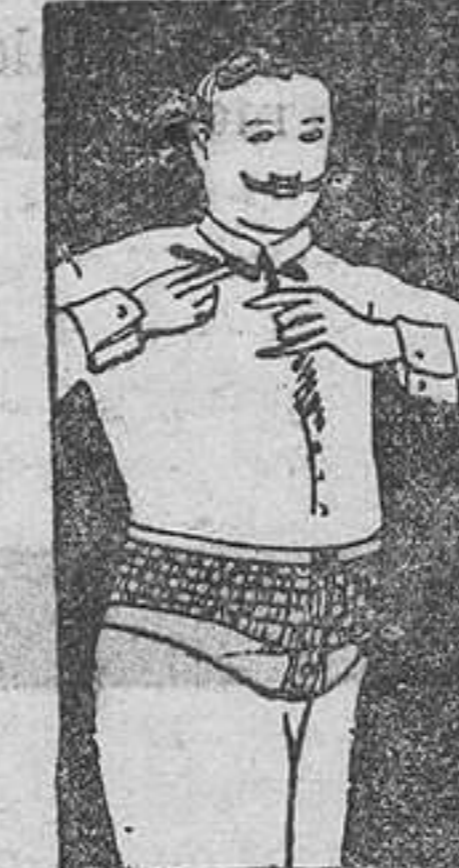
FAJA DE CABALLERO

El propio director técnico y reputado ortopédico de Madrid, Preciados, 33, para que los grandiosos métodos ortopédicos conserven su valor científico colocará personalmente, asesorando a cuantos a él se confíen con los consejos y detalles que por su larga experiencia profesional posee, en Oviedo el 18 y el 19 por la mañana, de Marzo, en el Hotel Francés.