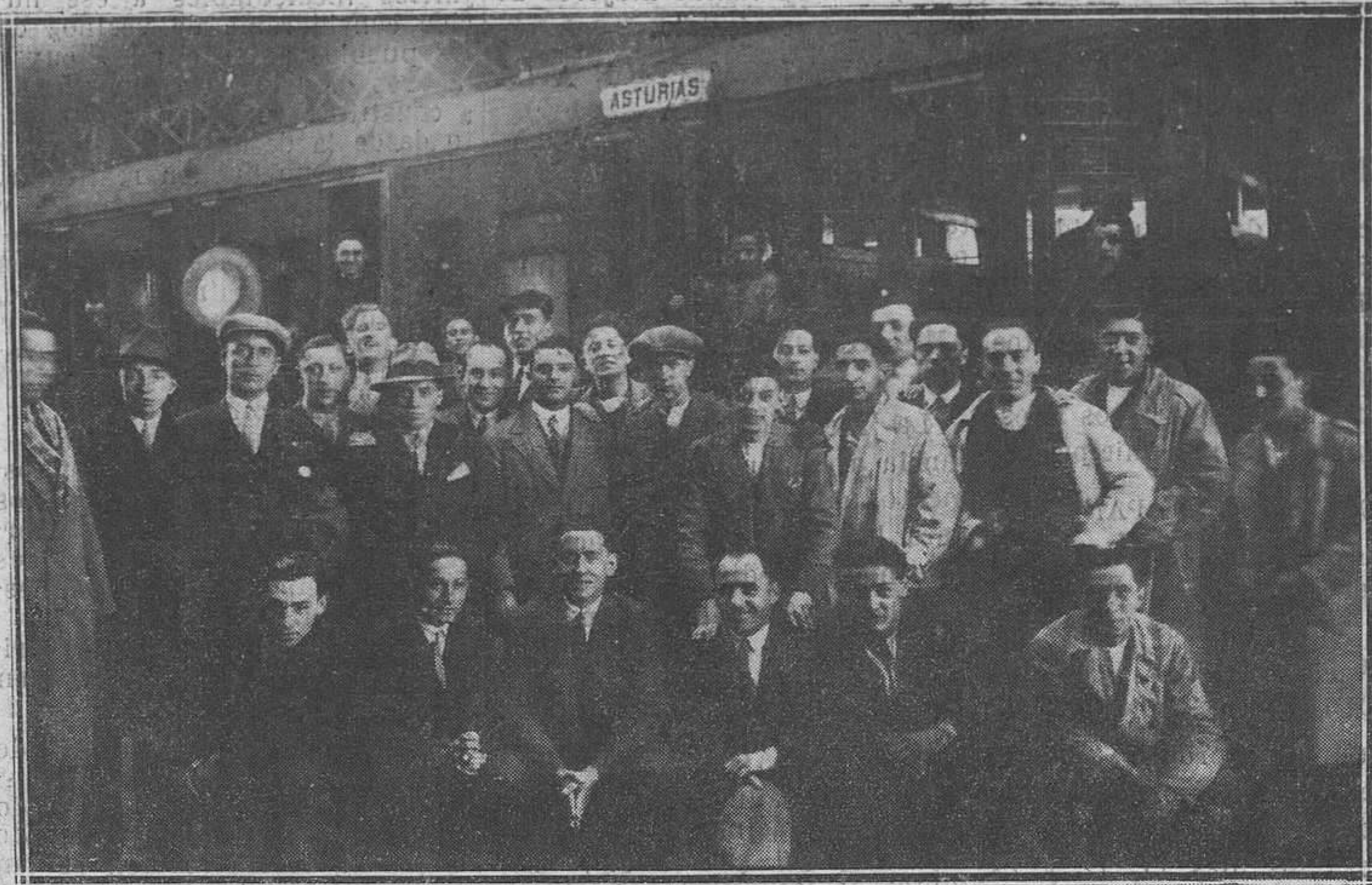
OVIEDO.—Representación asturiana a su salida para Madrid al Congreso de Juventudes Católicas.

El ferriboat "Schwerin" no ha podido realizar viaje alguno desde el lunes.