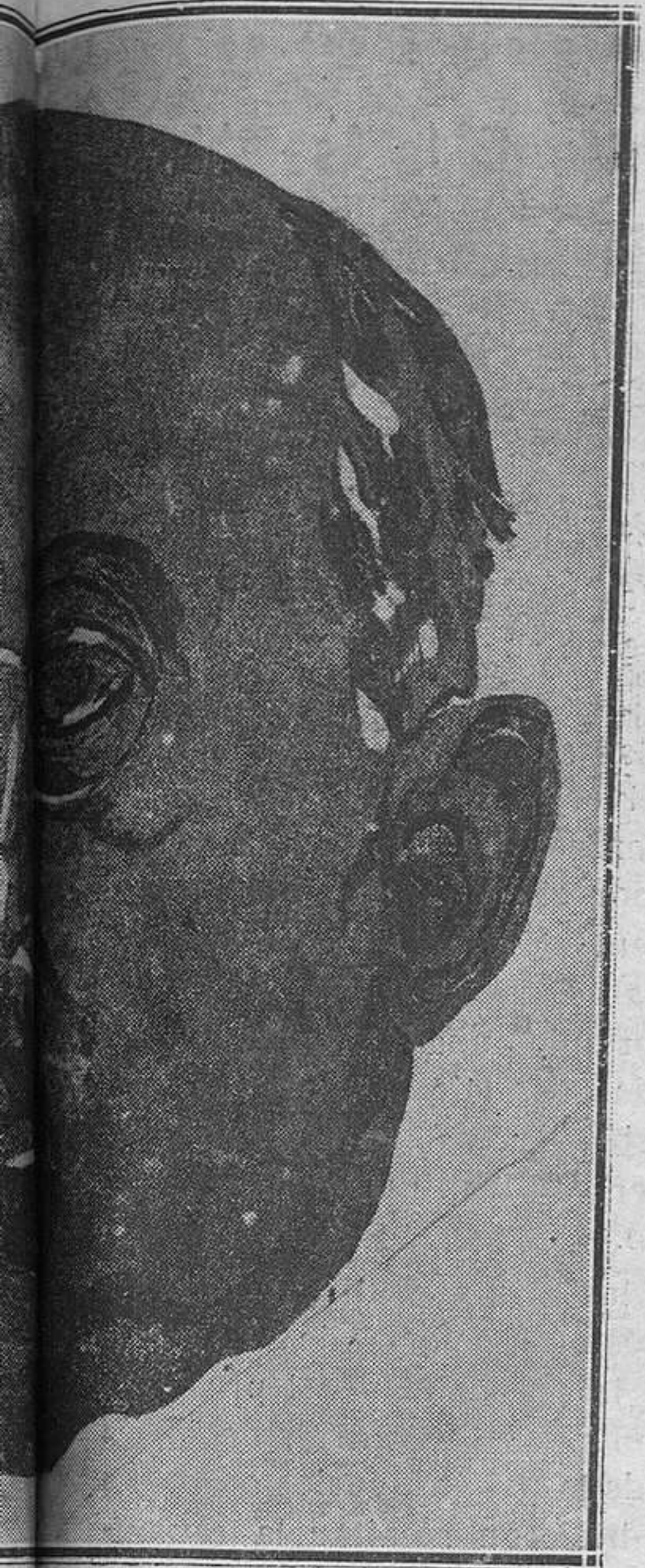
1928 por su drama "Los que no perdonan"