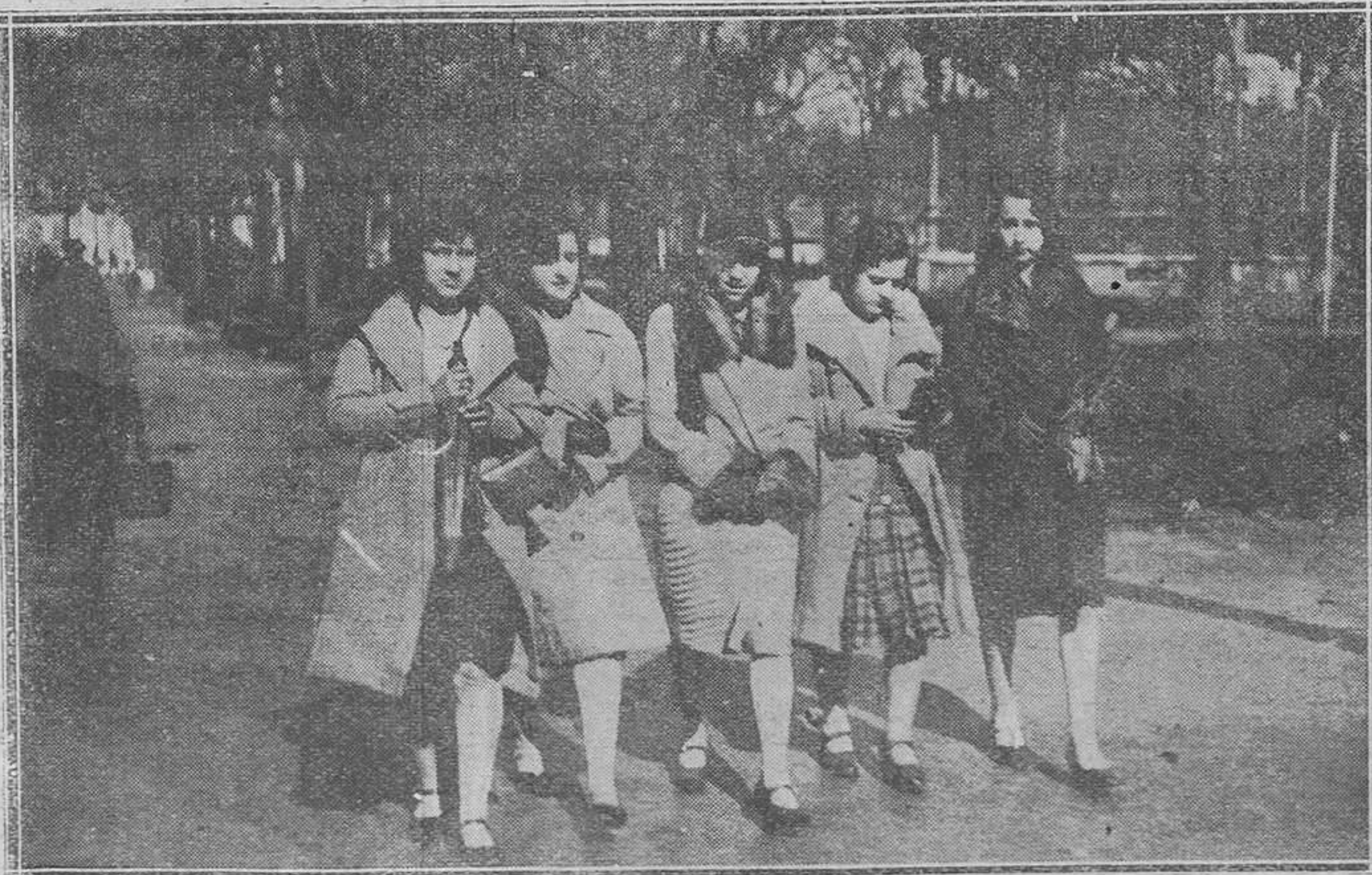
AVILES.—Grupo de lindas avilésinas a la hora del paseo