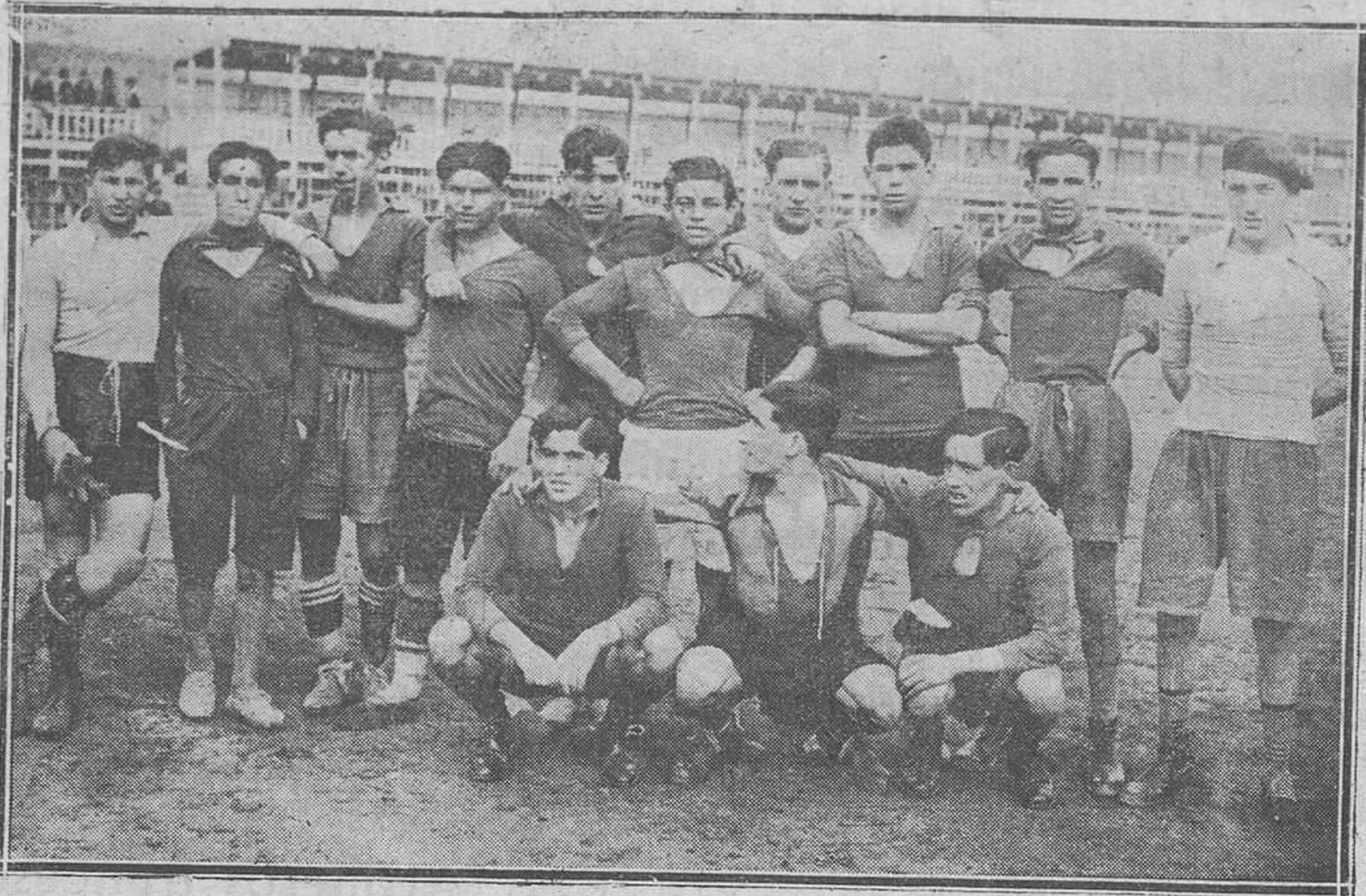
OVIEDO.—Del partido matinal del domingo en Teatinos.—El equipo de estudiantes normalistas