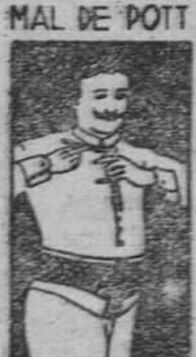
FAJA DE CABALLERO