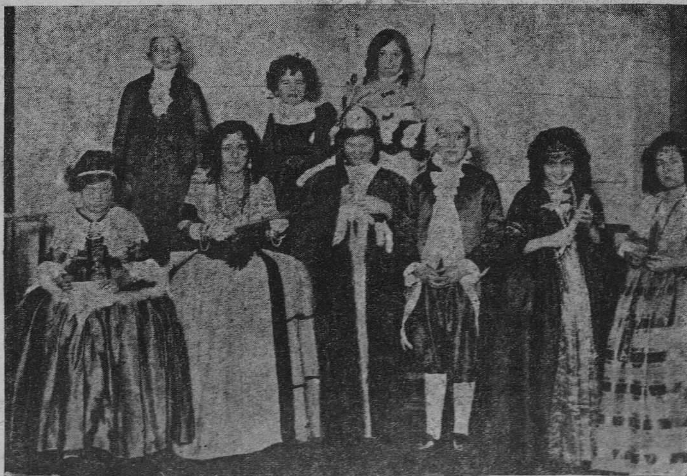
LA FIESTA DE AYER EN LAS ESCLAVAS. — Cual si fueran rey y princesitas de verdad, este grupo de encantadoras chiquillas que ayer tomaron parte en la fiesta celebrada en Las Esclavas, mira el objetivo con ingenua coquetería.