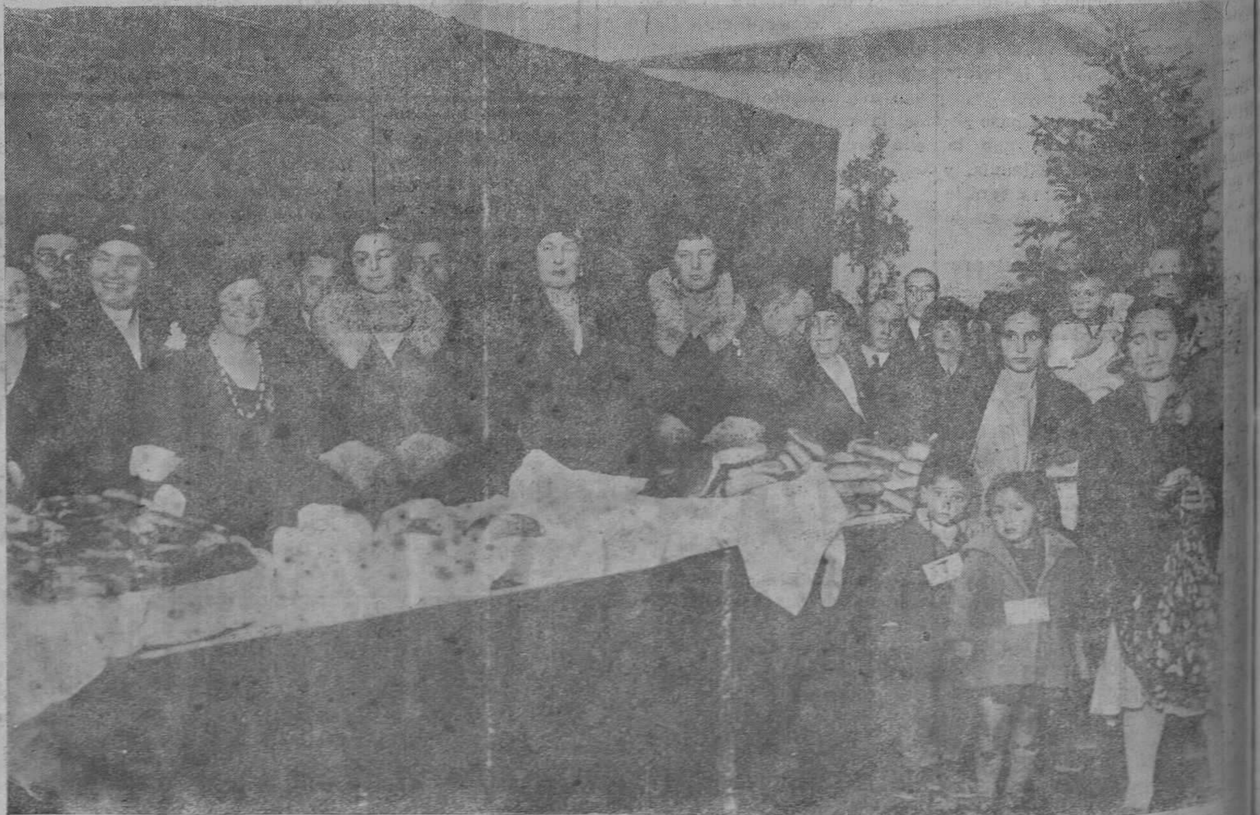
MADRID. — EN EL HOSPITAL DE LA CRUZ ROJA. — S. M. la Reina doña Victoria con sus hijas las Infantas doña María de la Paz y doña Cristina, en el reparto de meriendas y juguetes de Reyes a los niños.