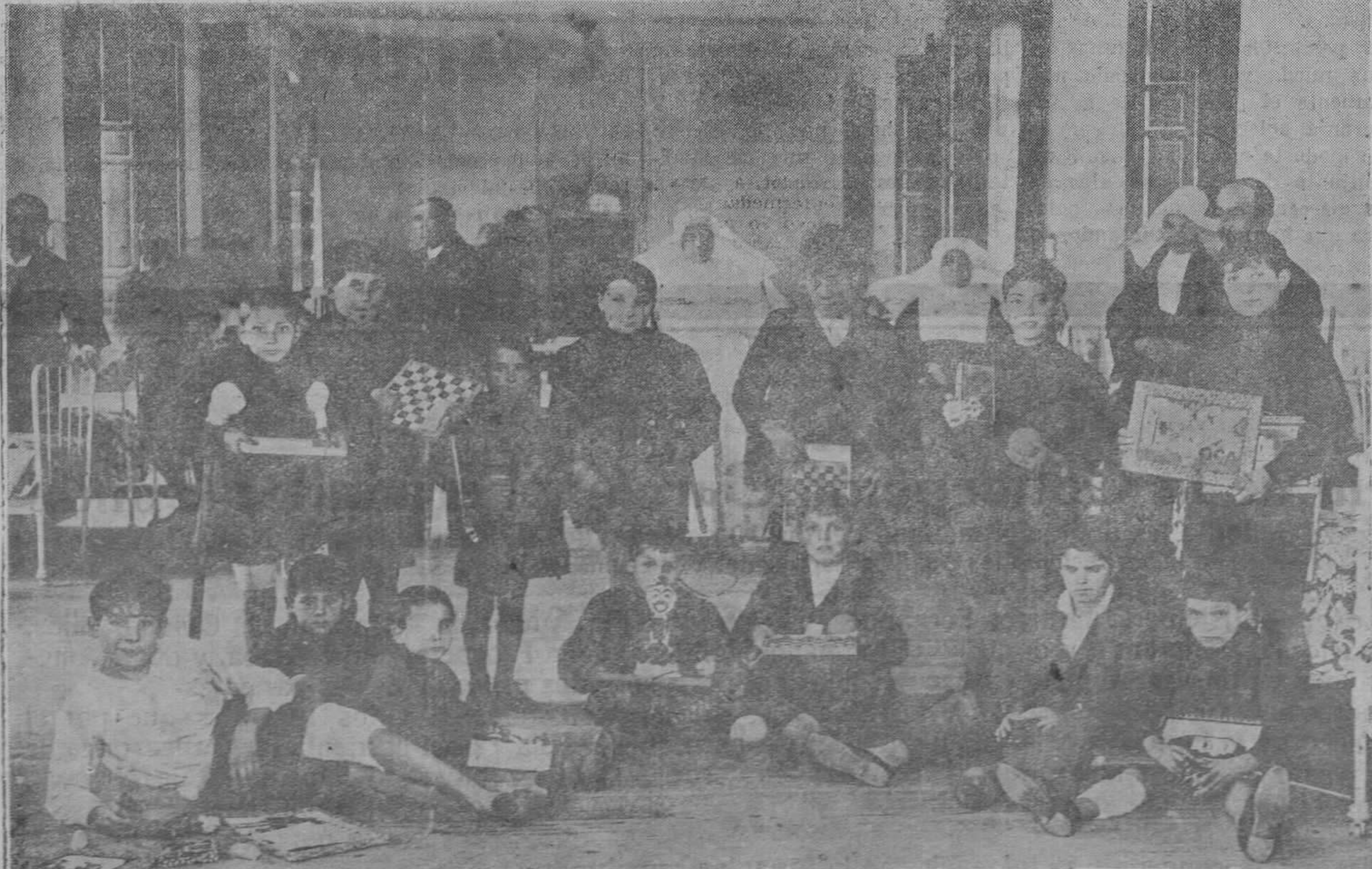
Estos niños a quienes el dolor ha venido a enseñarles demasiado pronto la amargura del vivir, tienen todavía en el rostro el asombro risueño que les ha producido la visita que los buenos de Baltasar, Melchor y Gaspar han hecho al Hospital Provincial.