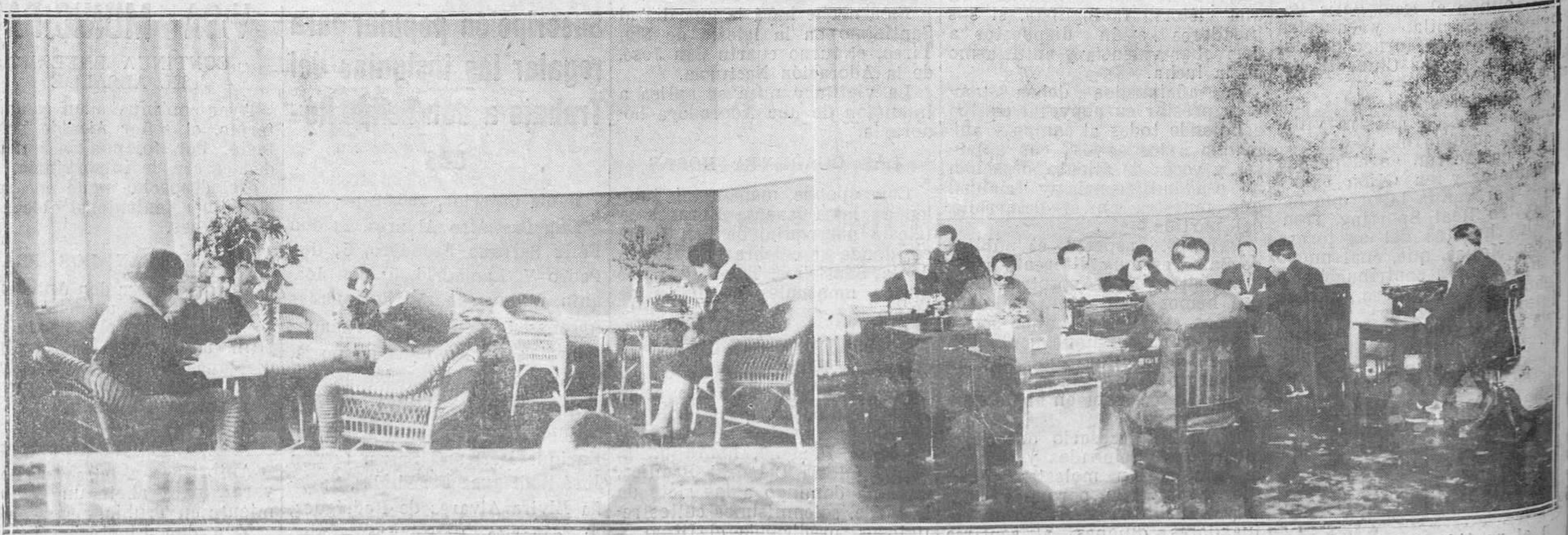
El rincón destinado a las horas de descanso del personal femenino. Una de las oficinas de la Administración