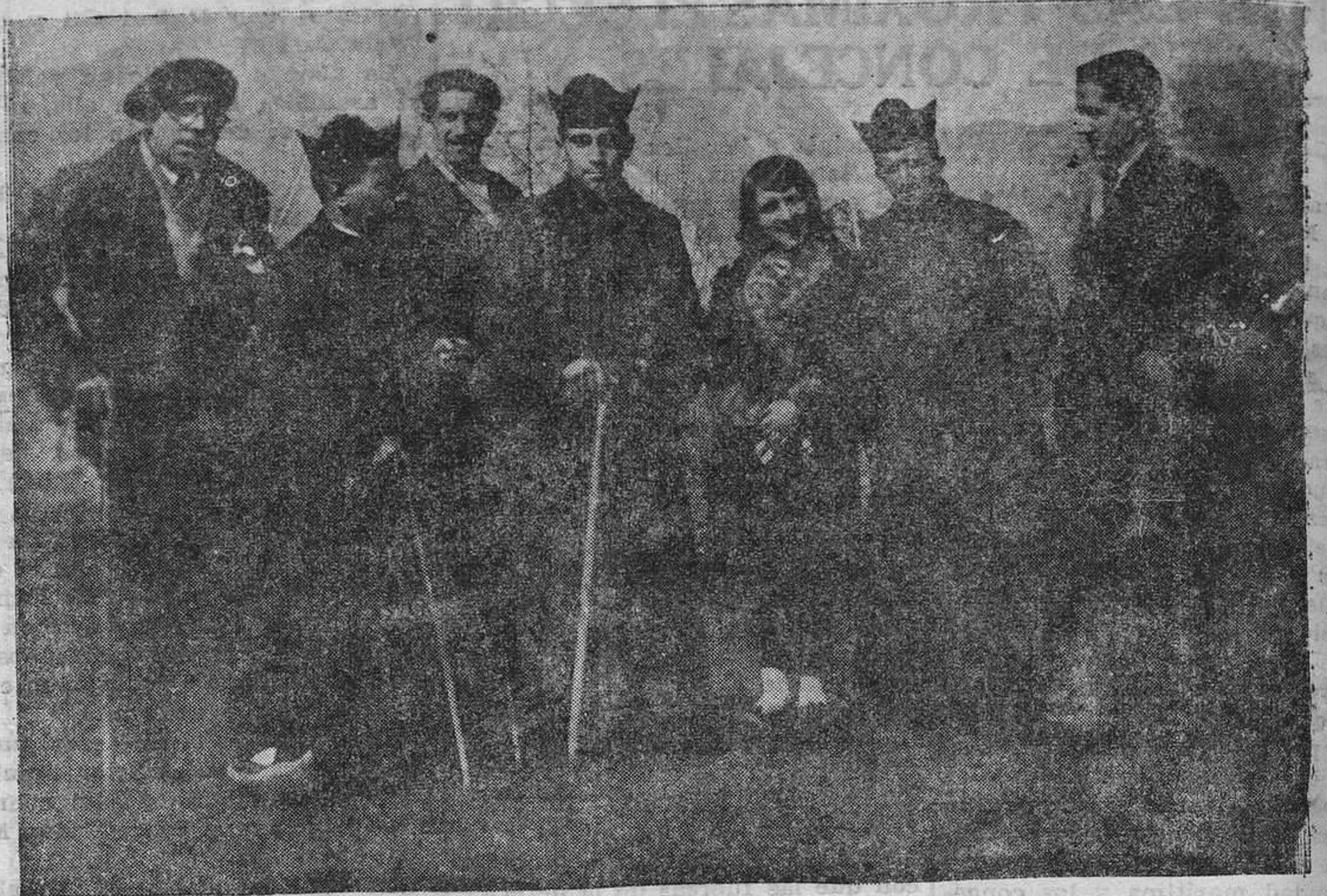
Señores sacerdotes que organizaron y tomaron parte en la semana catequista de Seberga.

Las autoridades competentes han comenzado desde luego las actuaciones del caso.