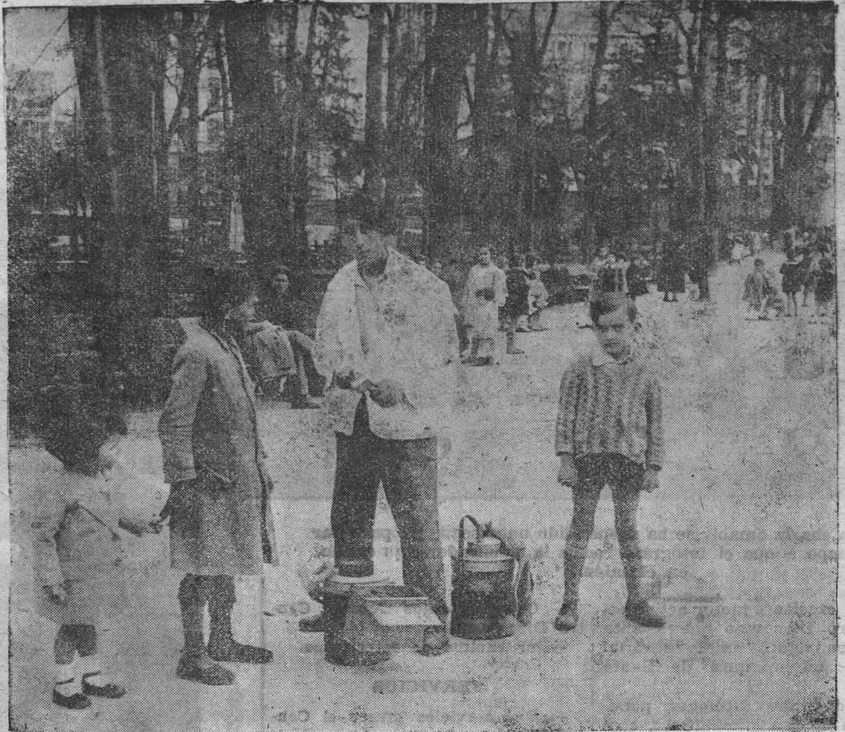
Como las golondrinas parias que buscan el clima veraniego de nuestra tierra, han llegado los heladeros, sueños dorados de estos niños que corretean por el parque. (Foto Castellanos).

REGION está editada por una sociedad anónima cuyos accionistas se hallan distribuidos por todo Asturias. Ello proporciona al periódico un aliento espiritual y una garantía de independencia que trascienden de todos sus comentarios y campañas.