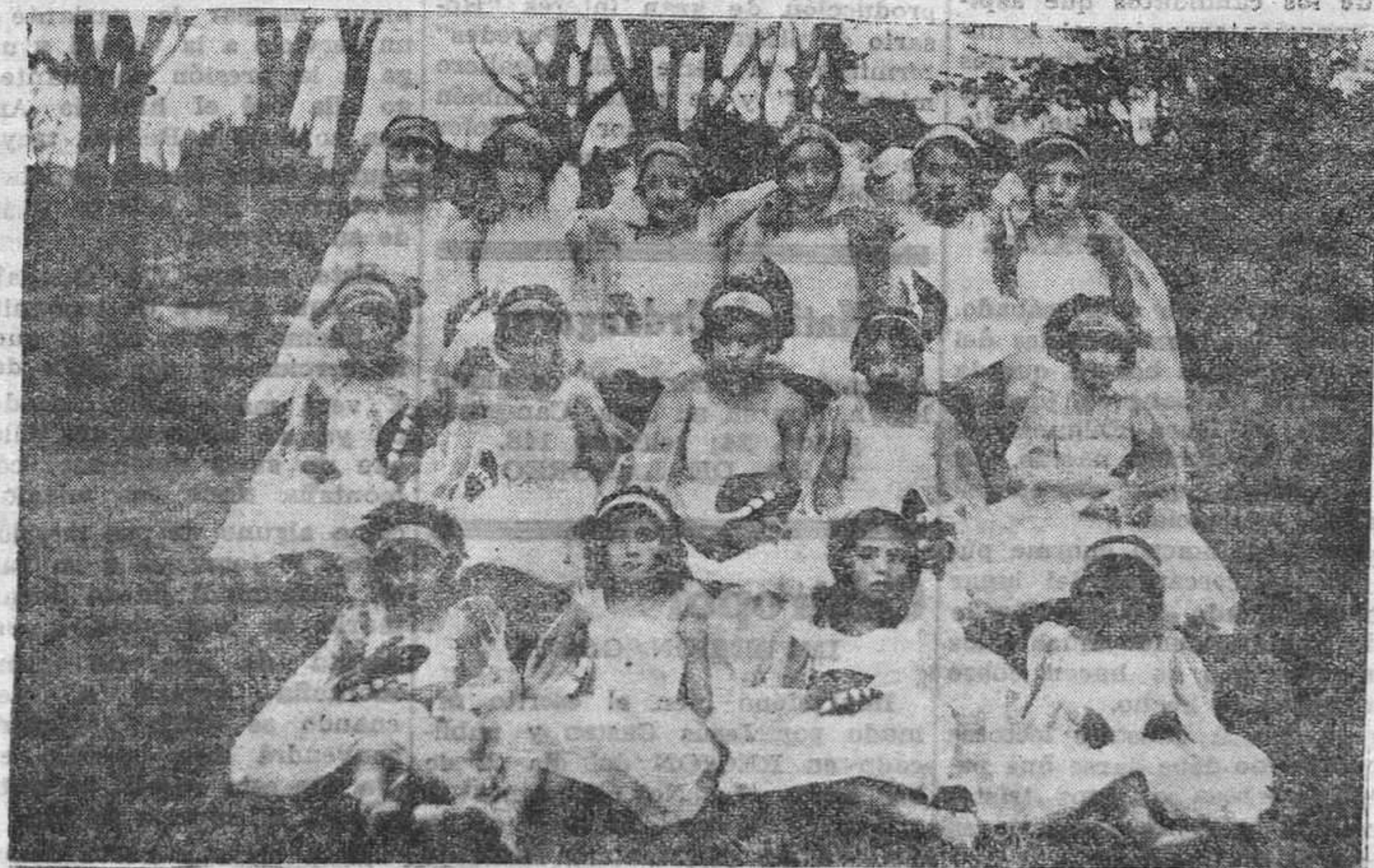
LUANCO.—En el teatro Carmen se ha celebrado un festival infantil, en el que tomaron parte las encantadoras niñas que realizó la fotografía.