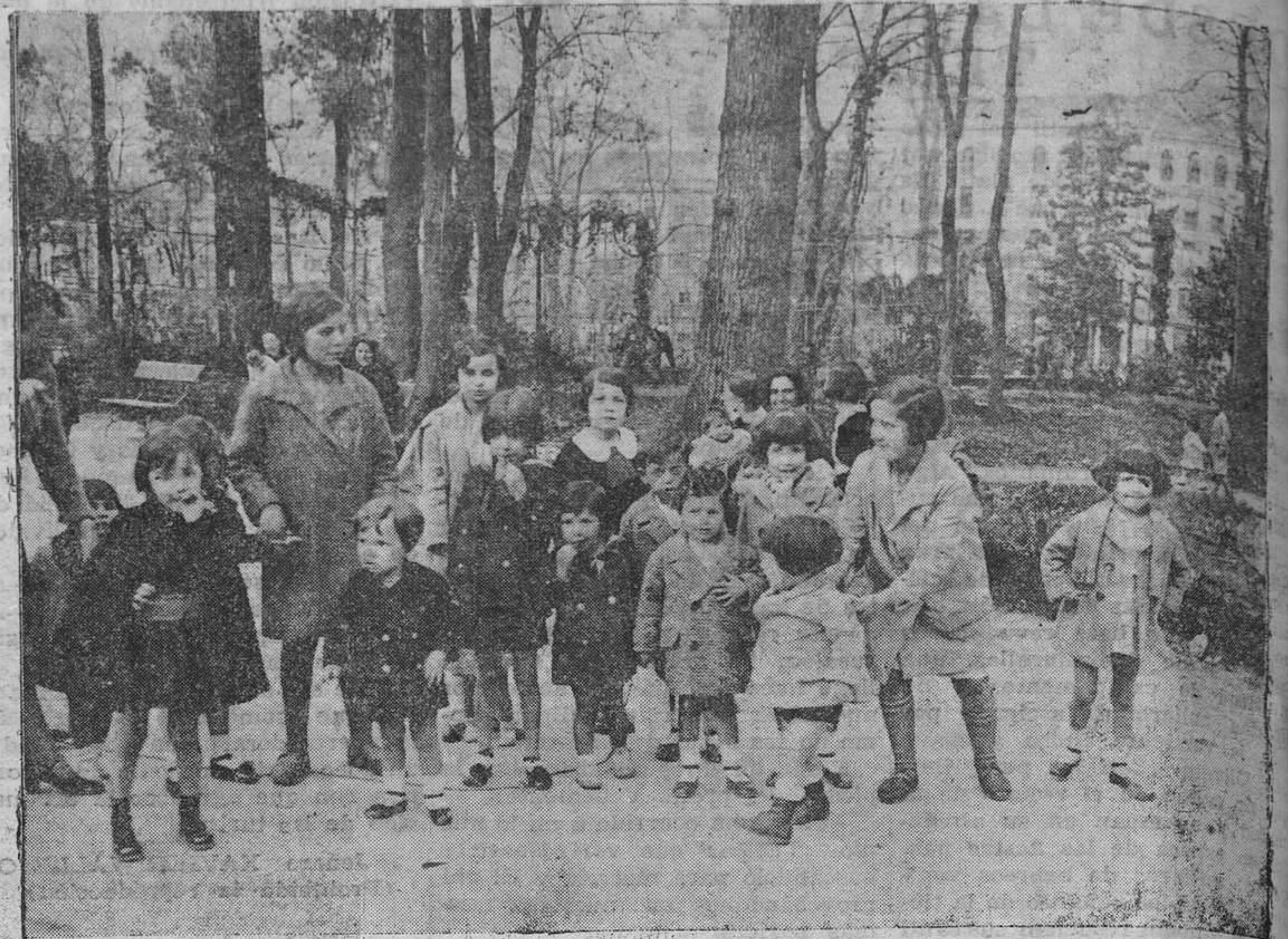
Con los primeros temblores de la primavera la grey infantil llena la órbita sonora del parque de San Francisco con la alegría vocinglera de sus risas y el encanto de sus juegos.

—¿Usted cree, preguntó, que esta vez se llevará a cabo? El señor Bustelo dijo: