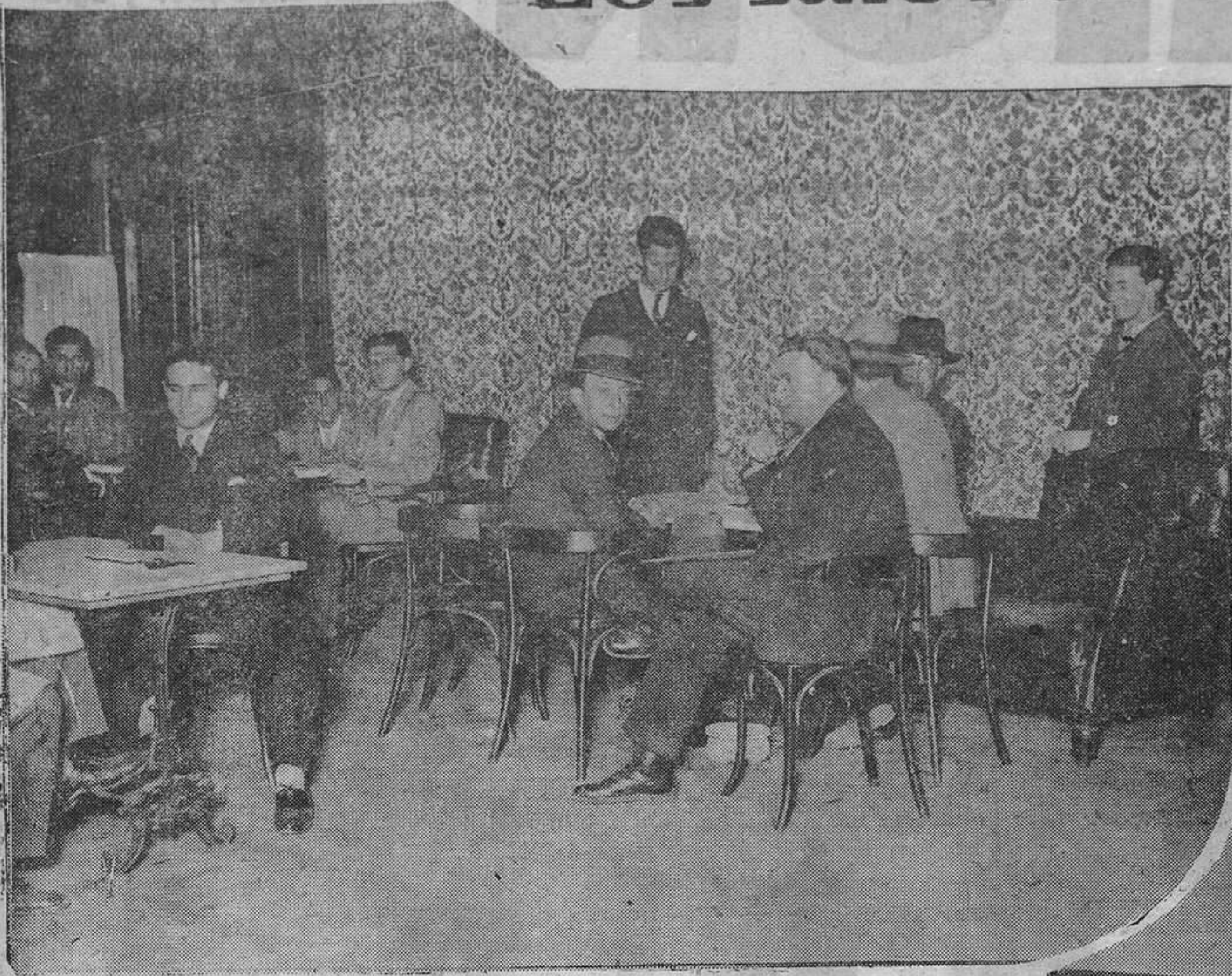
La charla amable se ha suspendido unos segundos para dar tiempo a que el fotógrafo recoja la camaradería que reina en el salón.

que alberga cerca de diez mil nombres entre socios y afiliados a distintas asociaciones católicas allí radicadas