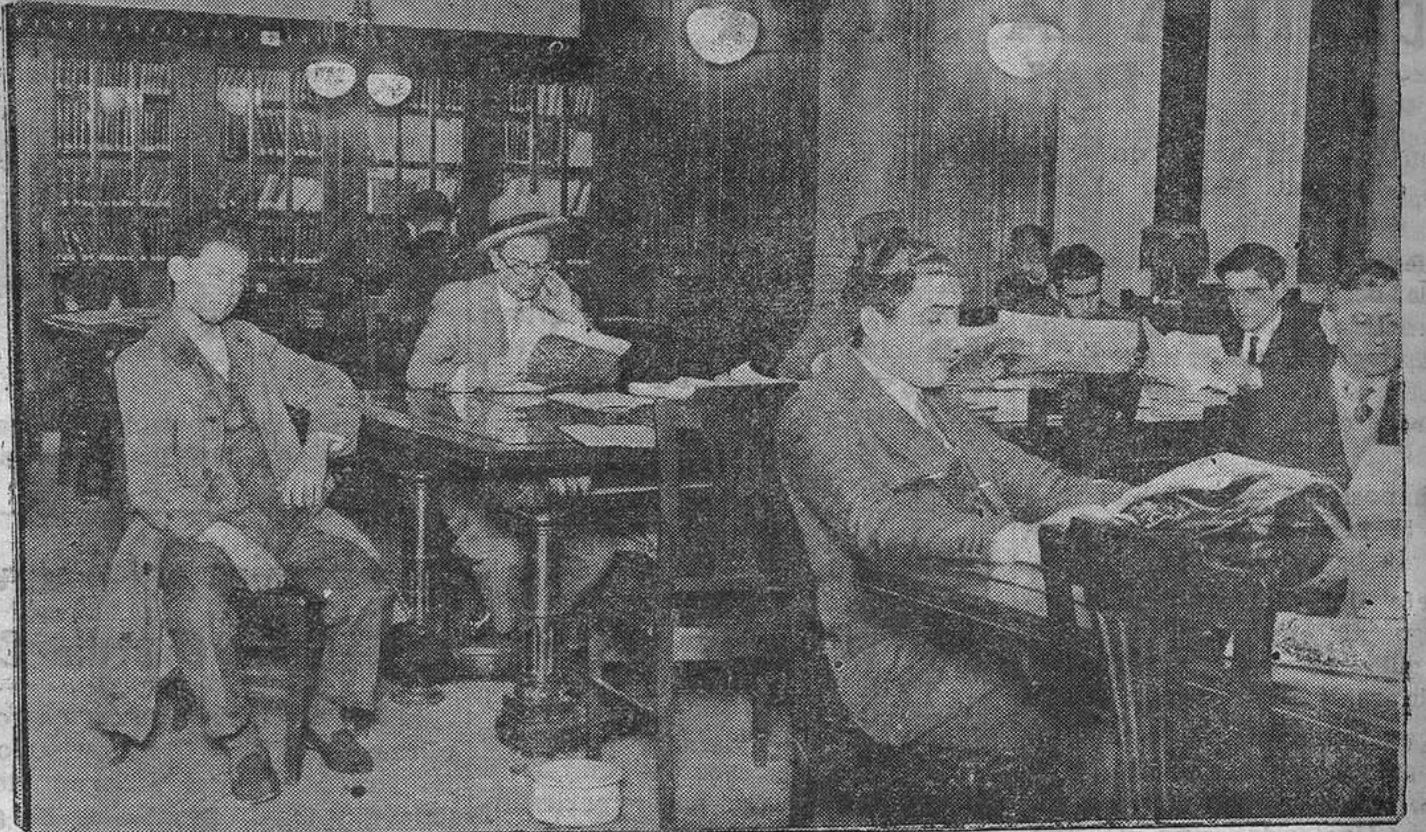
¡Italia, América!... Las revistas, periódicos y libros de todo el mundo ponen en contacto con sus inquietudes a la juventud que se entrega a la lectura. (Fotos Castellanos).