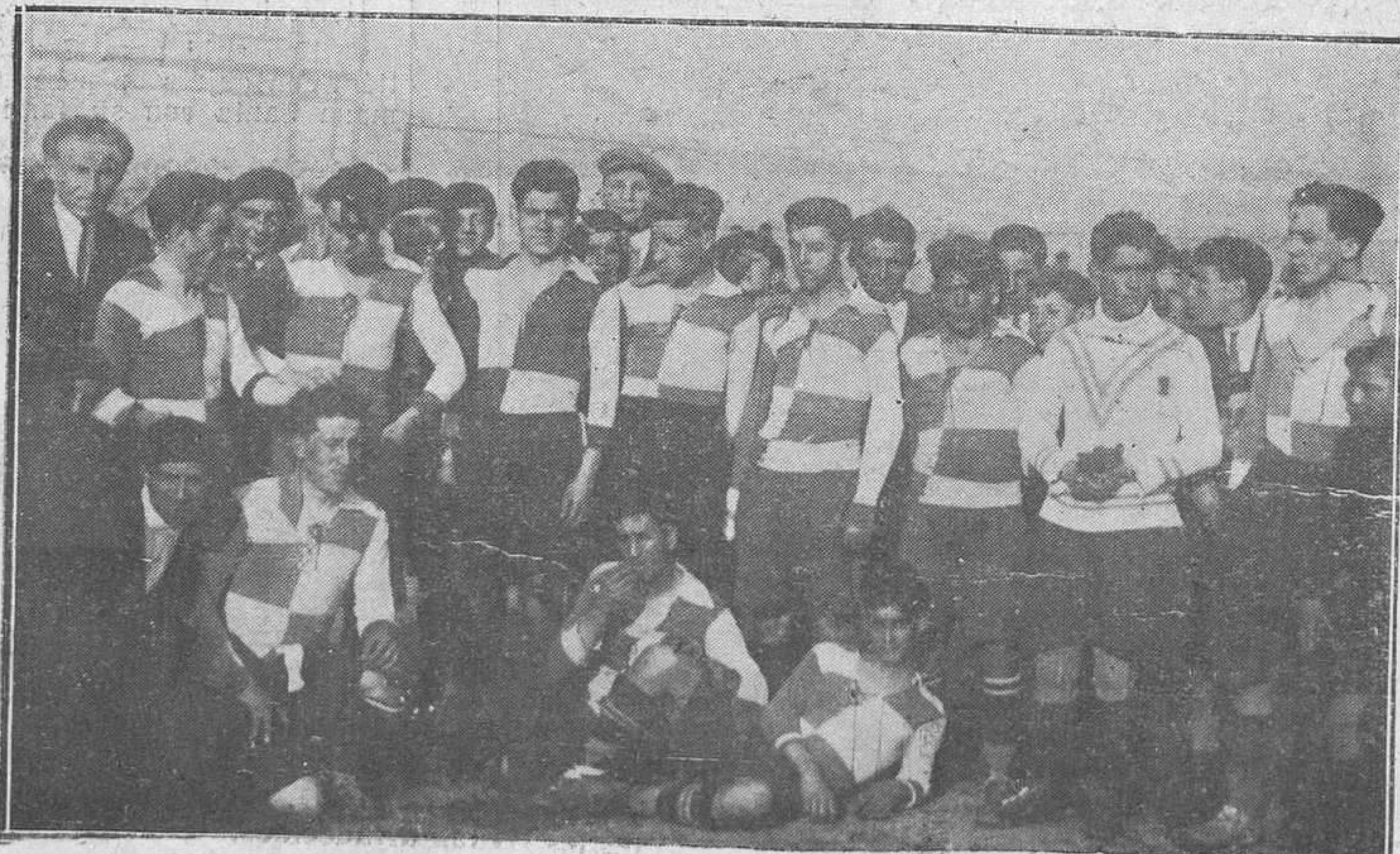
OVIEDO: EL CAMPEONATO DE SEGUNDA CATEGORIA.-El Racing Club Ovatese.