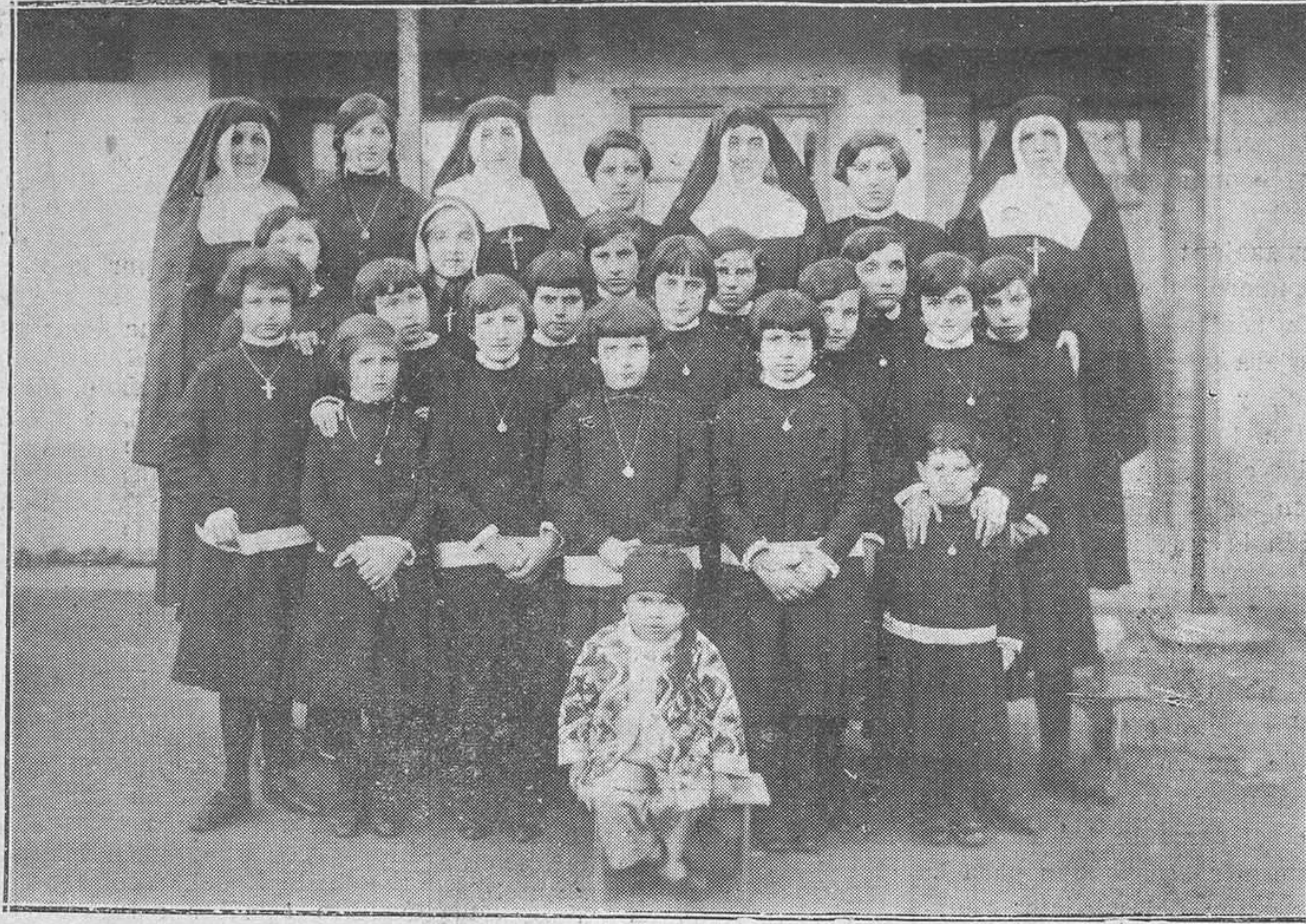
POLA DE SIERO.-Mujeres del Colegio de Notre-Dame, que intervinieron en una función teatral a beneficio del Catecismo.

La patata nueva que se trata de introducir no es la de la provincia, pues ésta se está sembrando ahora en su mayor parte, sino la de Valencia, Murcia y provincias andaluzas, cuyo tamaño es de cuarenta gramos arriba y sobre esta base se podría conceder la autorización, con lo cual se iría de acuerdo con el Gobierno, que vista la gran cosecha de estas regiones autorizó la exportación de este