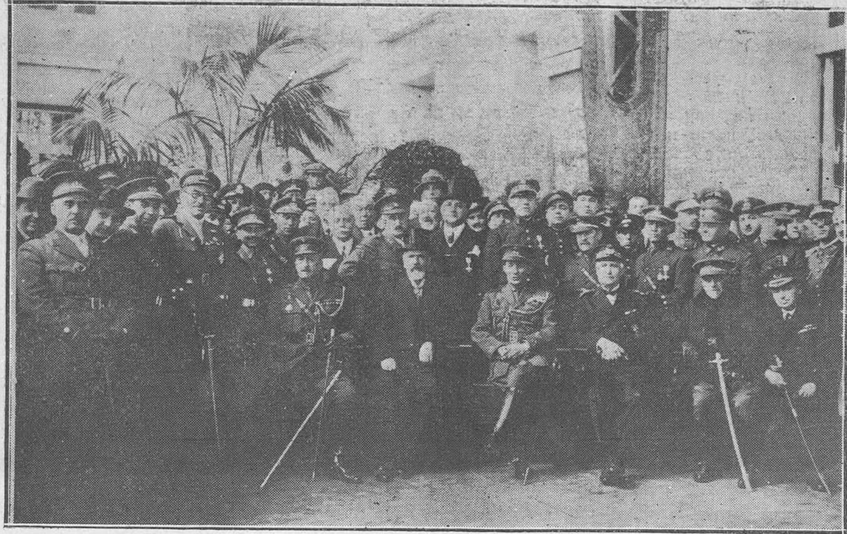
BARCELONA: JURA DE LA BANDERA DE LOS FUERZAS DE COMPLEMENTO DEL PRIMER REGIMIENTO DE FERROCARRILES.—Las autoridades con los oficiales después de reparto de condecoraciones.

Y de pronto llegó la hora señalada. Sacaron algunos cartuchos de dinamita, enredaron algunas mechas, las encendieron pausadamente, los arrojaron al fondo del río... Y luego el estampido y el agua que voló como una nube, y el río quedó seco en un largo trecho, y los pobres pececitos que huyeron amedrentados a sus madrigueras, sin que ni uno sólo, por casualidad, saliese aventado por la vicencia de la explosión.