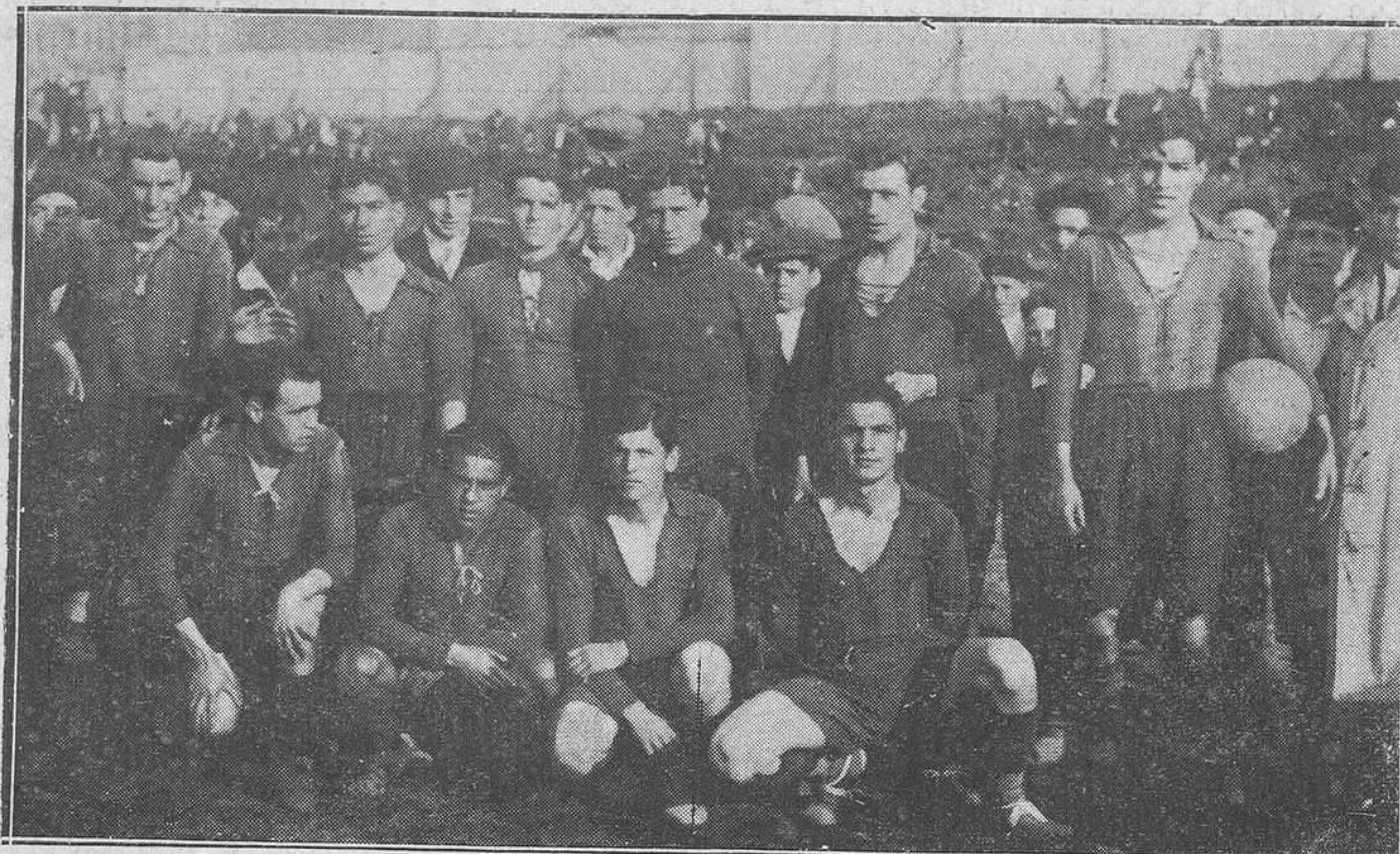
OVIEDO: EL CAMPEONATO DE SEGUNDA CATEGORIA.-El equipo Sportiva Ovatese.