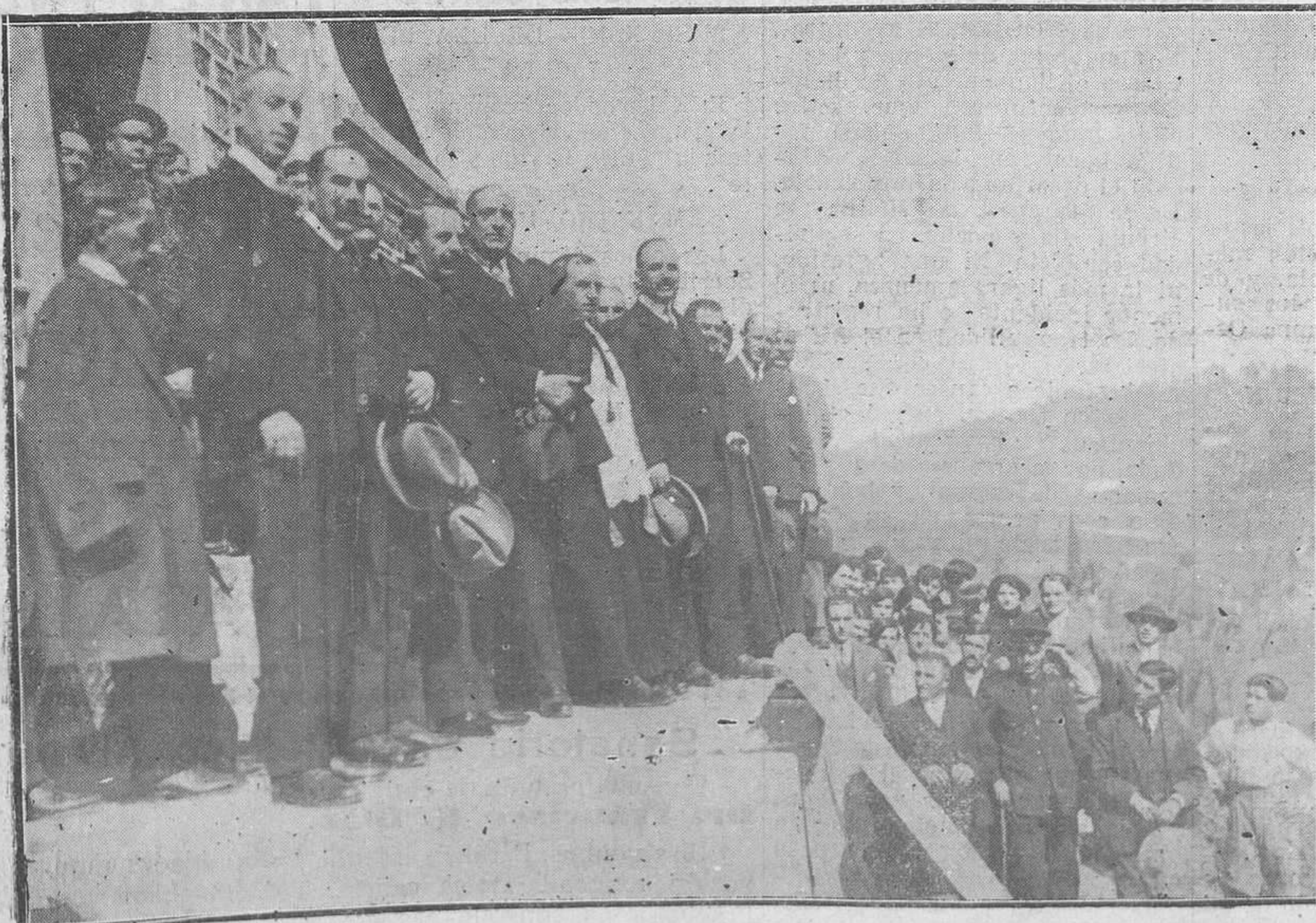
BAZON DE LA SAL (SANTANDER).—Las autoridades en el momento de bendecirse los depósitos de la nueva tralda de aguas.

El mendigo a la dama: —Pues le diré a usted señora. Tomé un coche, fui a cenar a Fornos, me marché luego a la ópera, y me fui a gastar con mi mujer lo que me quedaba.