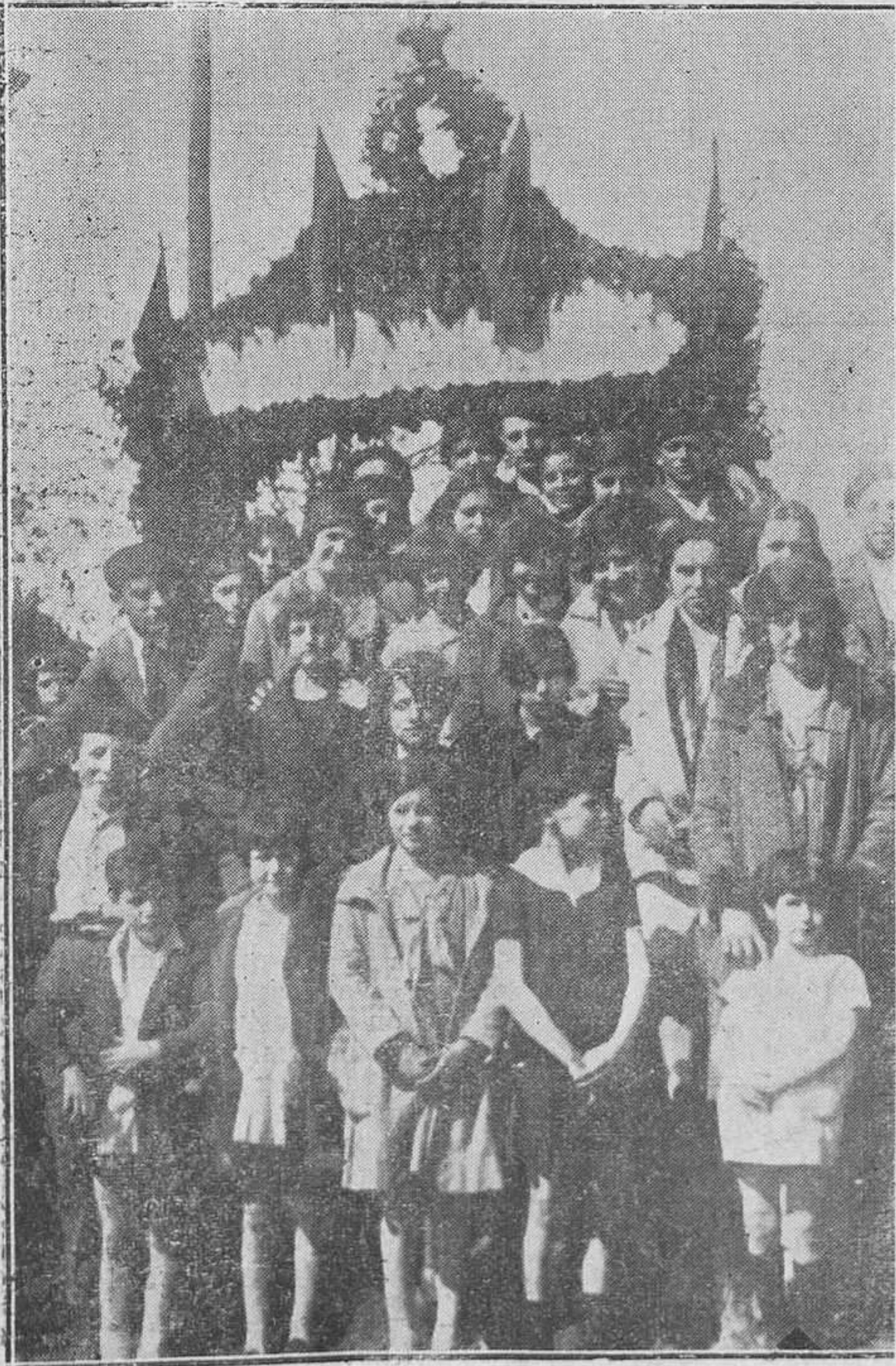
COLLOTO: DE LA FIESTA DEL ARBOL.-Un grupo de jovencitas collotenses momentos después de terminar la cultural festividad.

Resulta, pues, que el Comité pro Unión no representa a Langreo; en realidad, tampoco representa a Sama, pueblo merecedor de toda alta fortuna, hidalgo, noble, progresivo y bueno, debiera pasarse a otros el programa que se puso en las manos de estos hombres, que ya hoy por hoy, apenas si se representan a sí mismos.