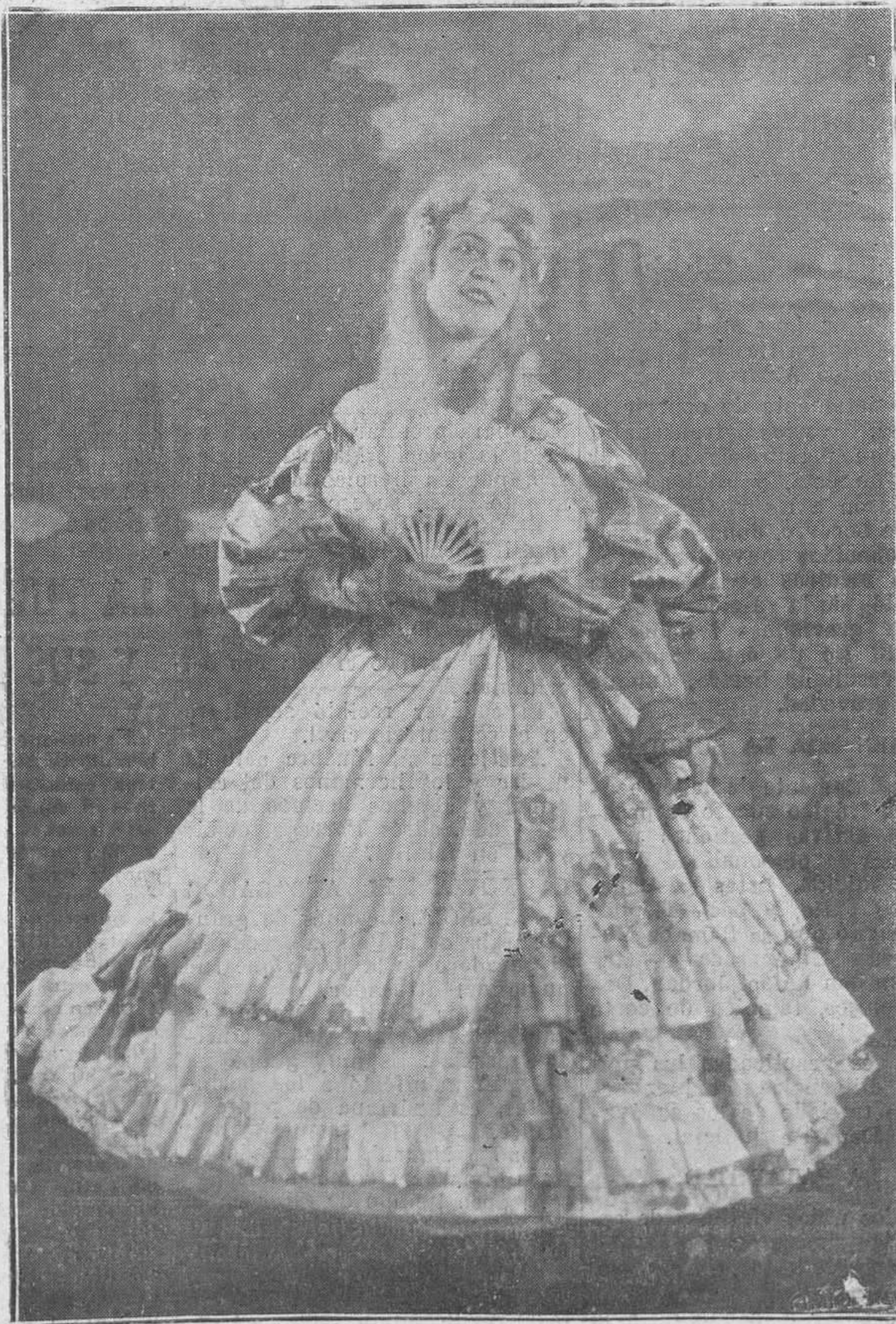
Una de las bellas artistas del gran espectáculo ruso que mañana debuta en el Campomar.

Algunos días de observación bastaron para averiguar cómo aquel pequeño cuerpo celeste, llamado después Ceres, efectuaba su revolución alrededor del Sol, y de qué modo circulaba en el paso libre situado entre el de Marte y Júpiter. Este descubrimiento excitó el más vivo interés y ha tenido mucha influencia en el progreso de la Astronomía.