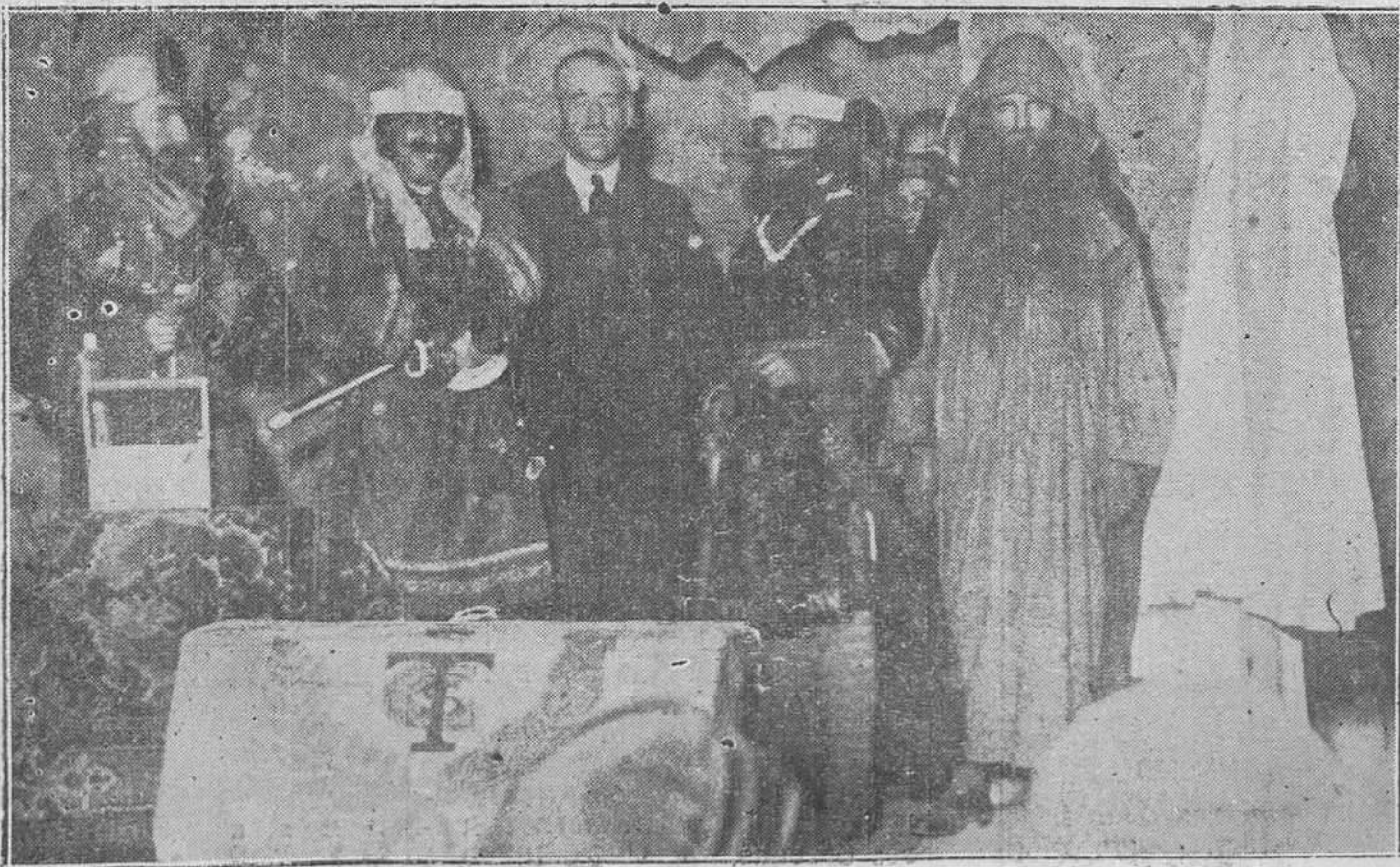
OVIEDO: LA VELADA DEL CIRCULO CATOLICO.-Una escena de la obra "El puñal del Goda", admirablemente representada el domingo último.