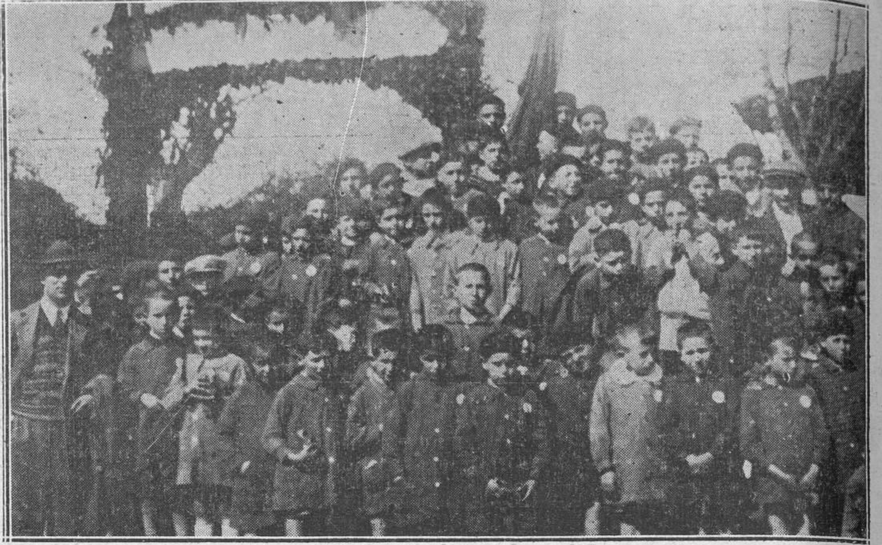
COLLOTO: LA FIESTA DEL ARBOL.-Grupo de niños de una de las Escuelas de este popular barrio.