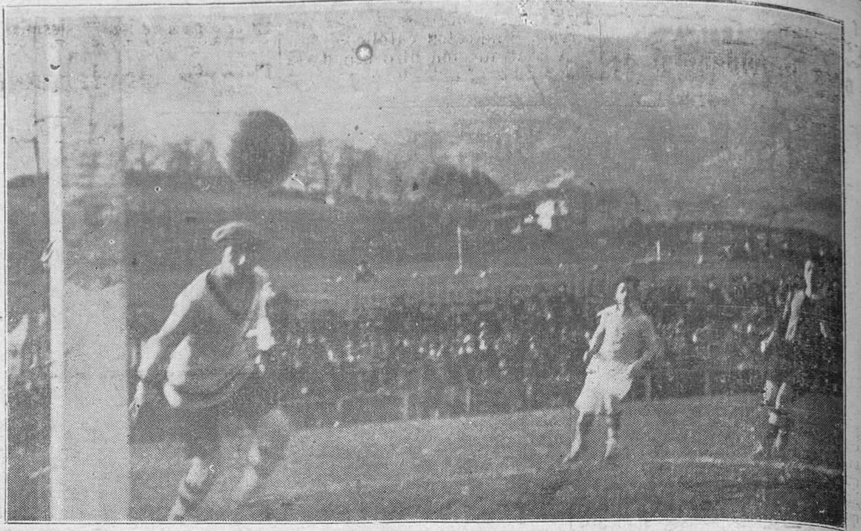
OVIEDO: DEL PARTIDO RACING DE MADRID-REAL OVIEDO.-Un formidable schut de Barrii que hace apuntar un tanto a su equipo.

Estudia la llamada civilización árabe, demostrando que esta civilización es genuinamente española, porque los 12.000 árabes que conquistaron la Península carecían de toda cultura