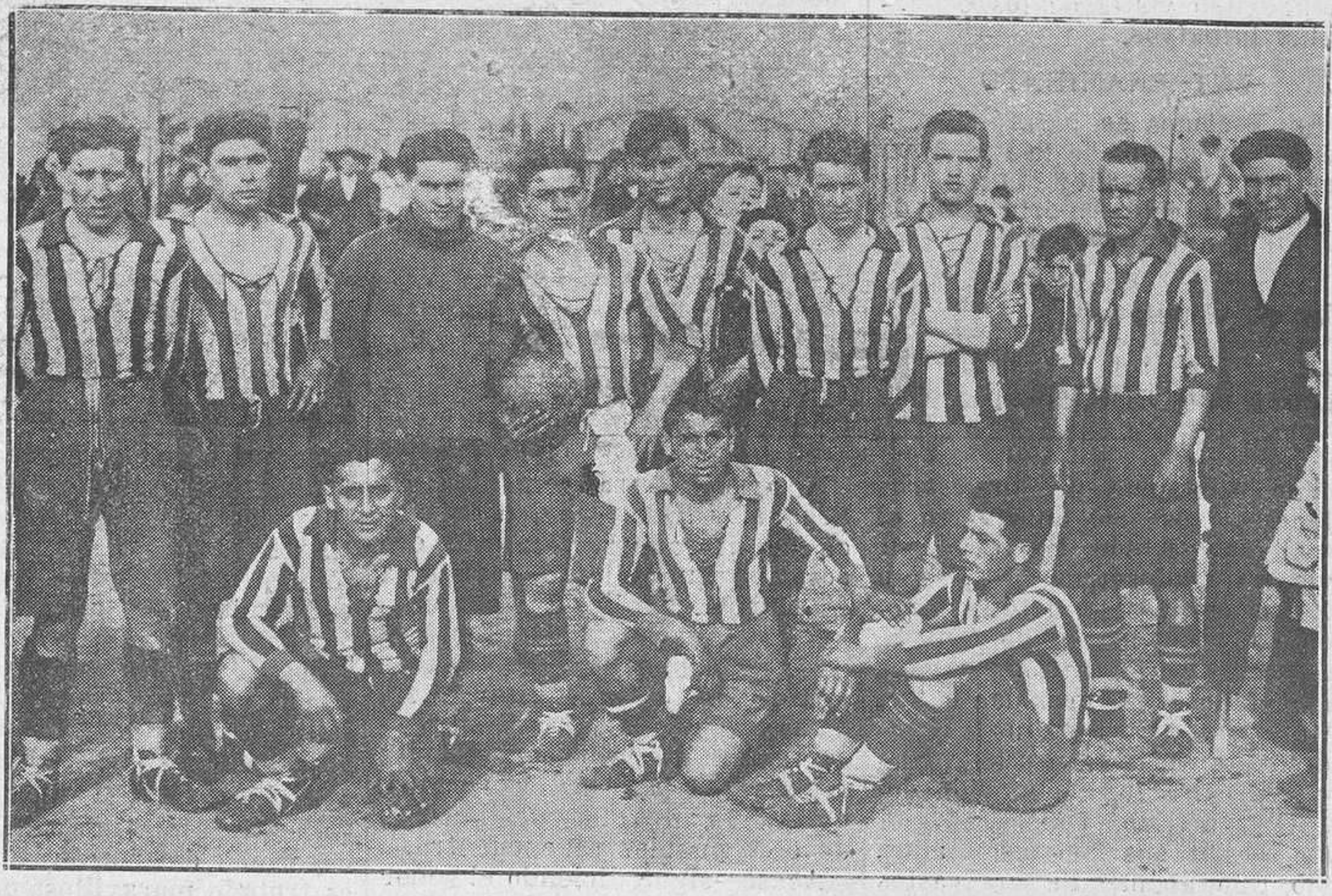
OVIEDO: LOS PARTIDOS DE CAMPEONATO DE SEGUNDA CATEGORIA.—El Sporting de Santo Domingo, que fué vencido el domingo último por la Sportiva Ovetense.