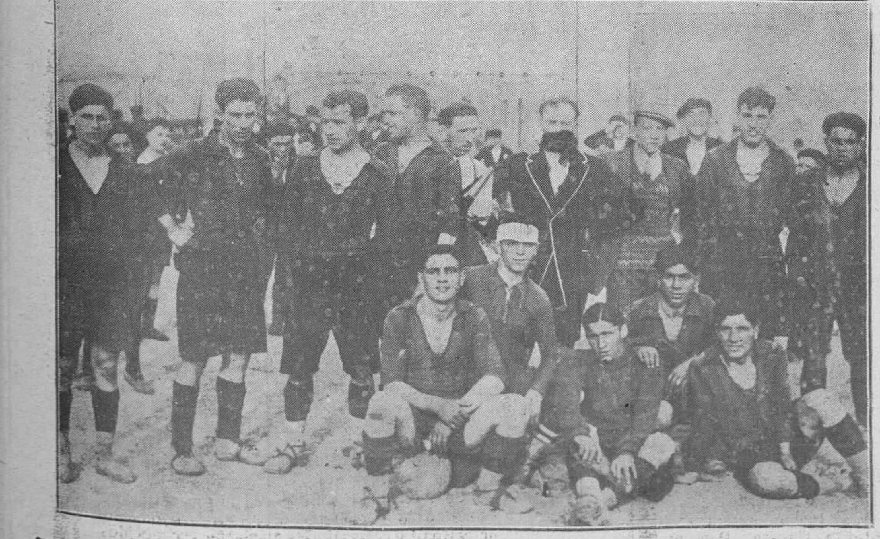
OVIEDO: LOS PARTIDOS DE CAMPEONATO DE SEGUNDA CATEGORIA.—La Sportiva Ovetense, que jugó el domingo último con el Sporting de Santo Domingo y que le venció por 3-0.

Peticiones de mano Por el distinguido comandante de Aviación, don Francisco