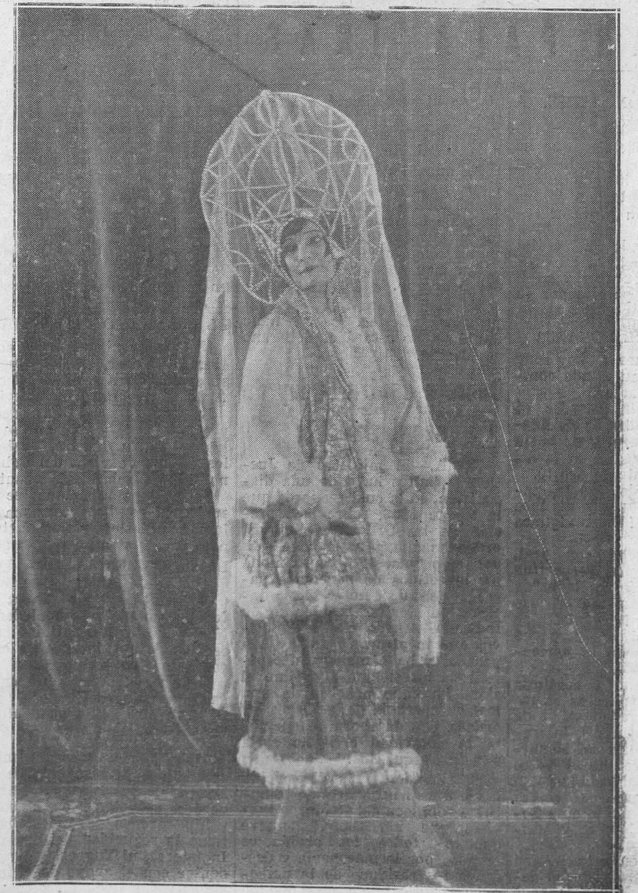
Otra de las bellas artistas del gran espectáculo ruso que mañana debuta en el Campomar.