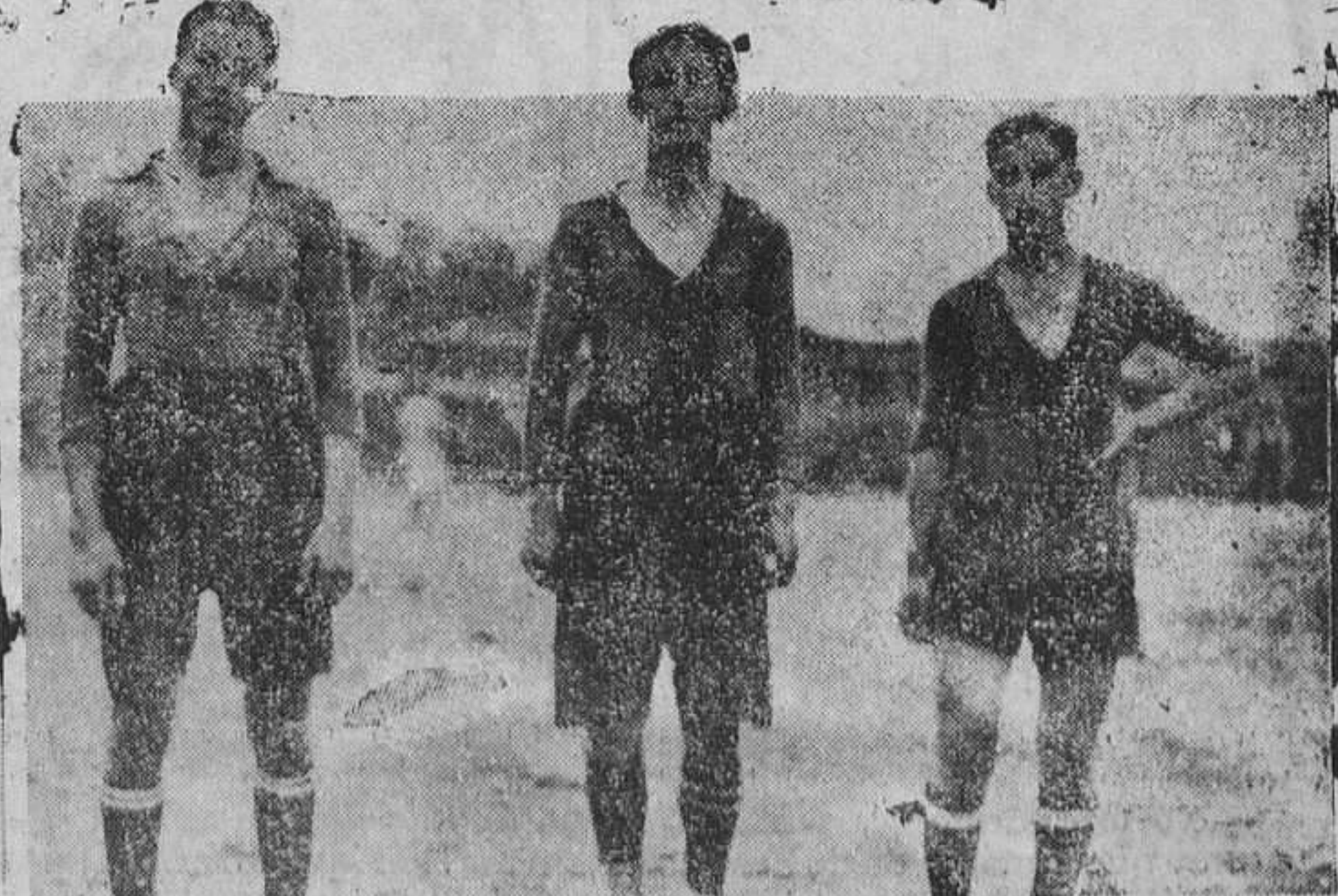
SAN CLAUDIO.—Tres excelentes jugadores del Rápido F. C.