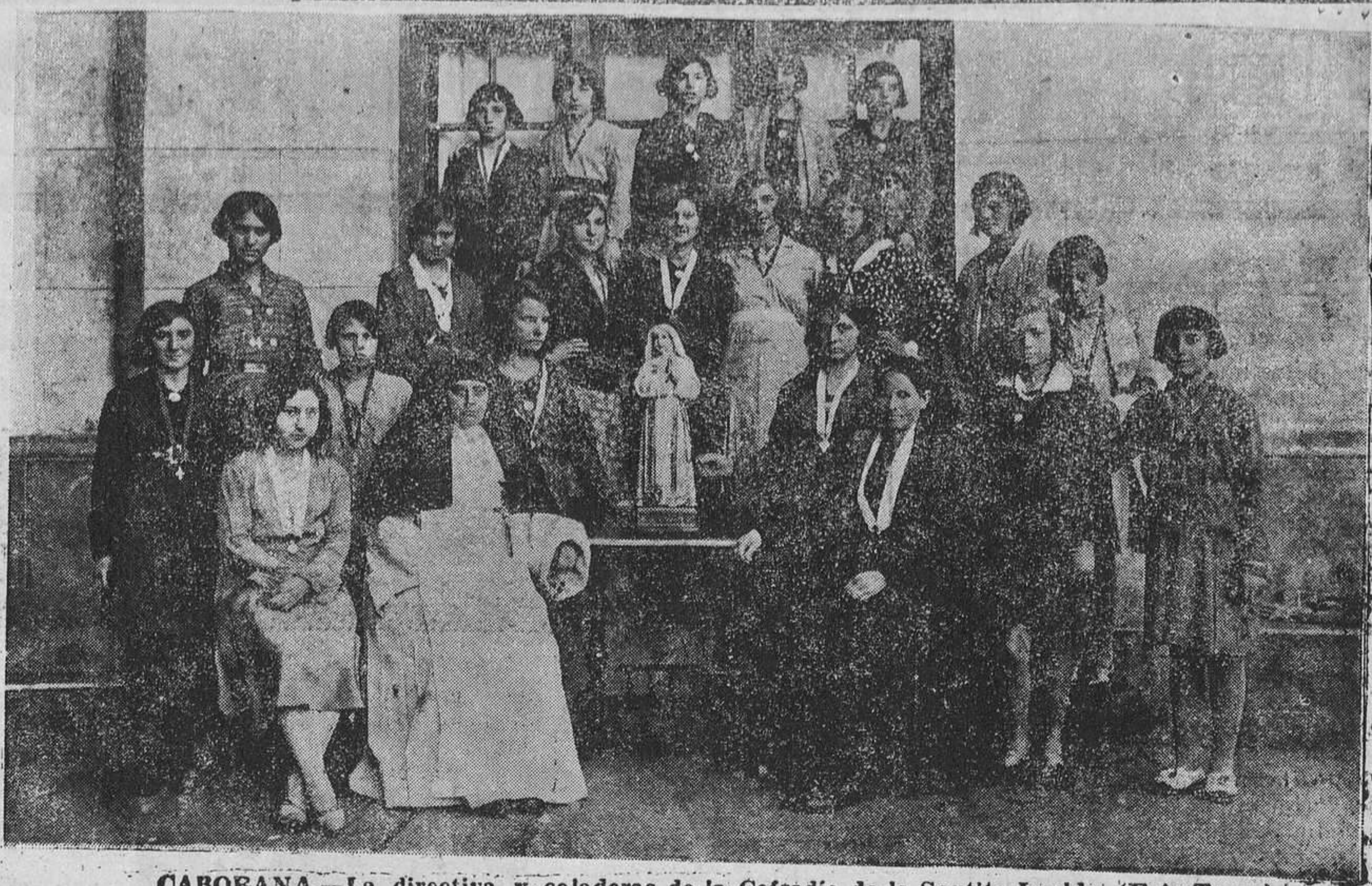
CABORANA.—La directiva y celadoras de la Cofradía de la Santita Imelda.