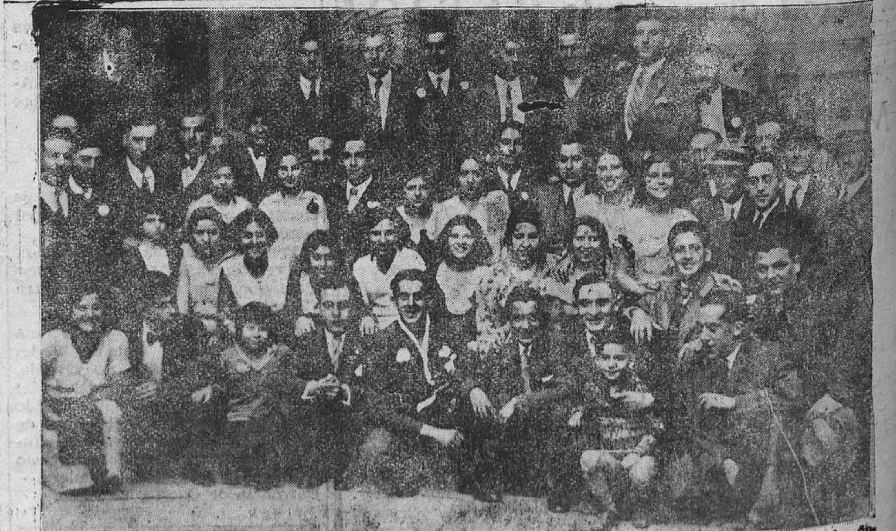
OVIEDO.—Un grupo de orfeonistas momentos después del banquete celebrado el pasado domingo con motivo de la festividad de Santa Cecilia. (Foto Mena).