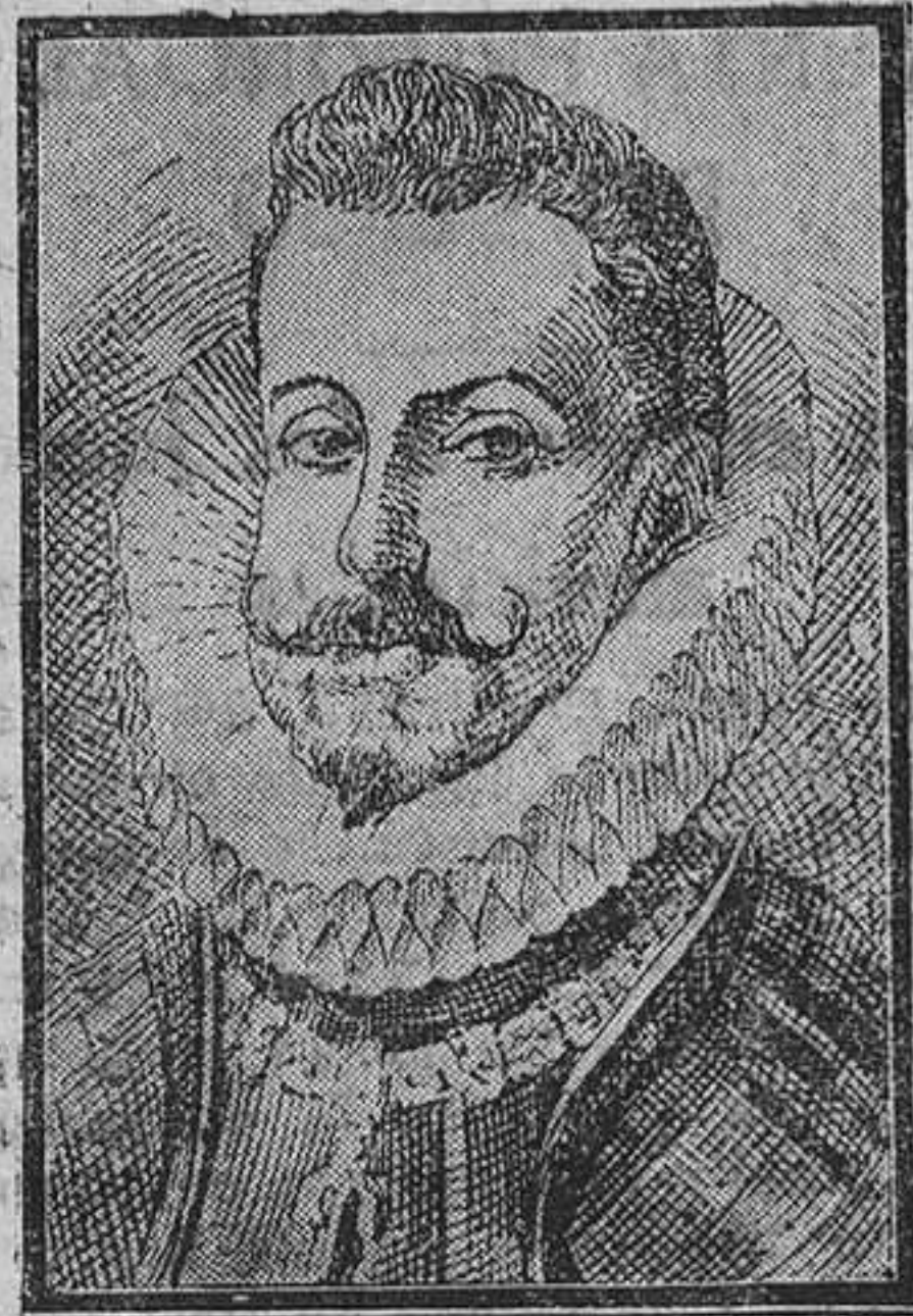
S. M. Católica de España e Indias don Felipe III de Austria, en cuyo reinado la Universidad de Oviedo abrió sus puertas a la ciencia con sus cuatro Facultades de Teología, Leyes, Cánones y Artes, en el año de gracia de 1608.

En la página escolar de la próxima semana daremos más de ellas.