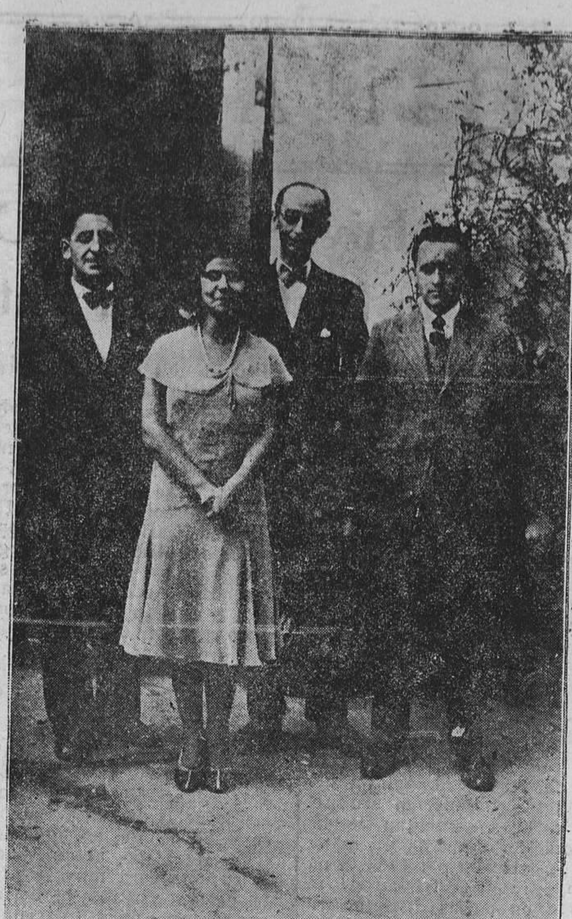
OVIEDO.—Los cuatro artistas que tomaron parte en la velada musical celebrada el sábado último en los salones de la Coral Vetusta. (Foto Mena).

UN ESTUDIANTE DE HISTORIA DE DERECHO Oviedo, 23 de noviembre de 1931.