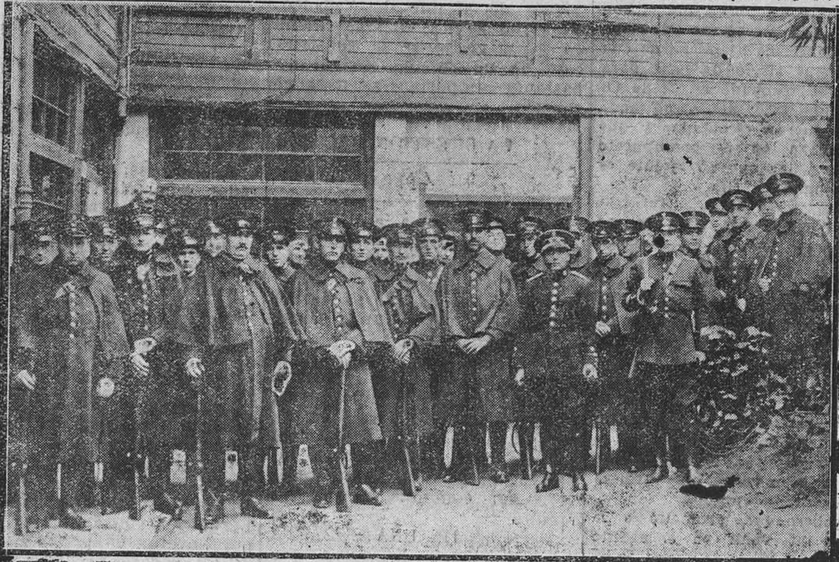
OVIEDO.—Fuerzas de Seguridad que ayer tarde salieron para Gijón con motivo de las actuales huelgas.

Como consecuencia de la actitud adoptada por los huelguistas.