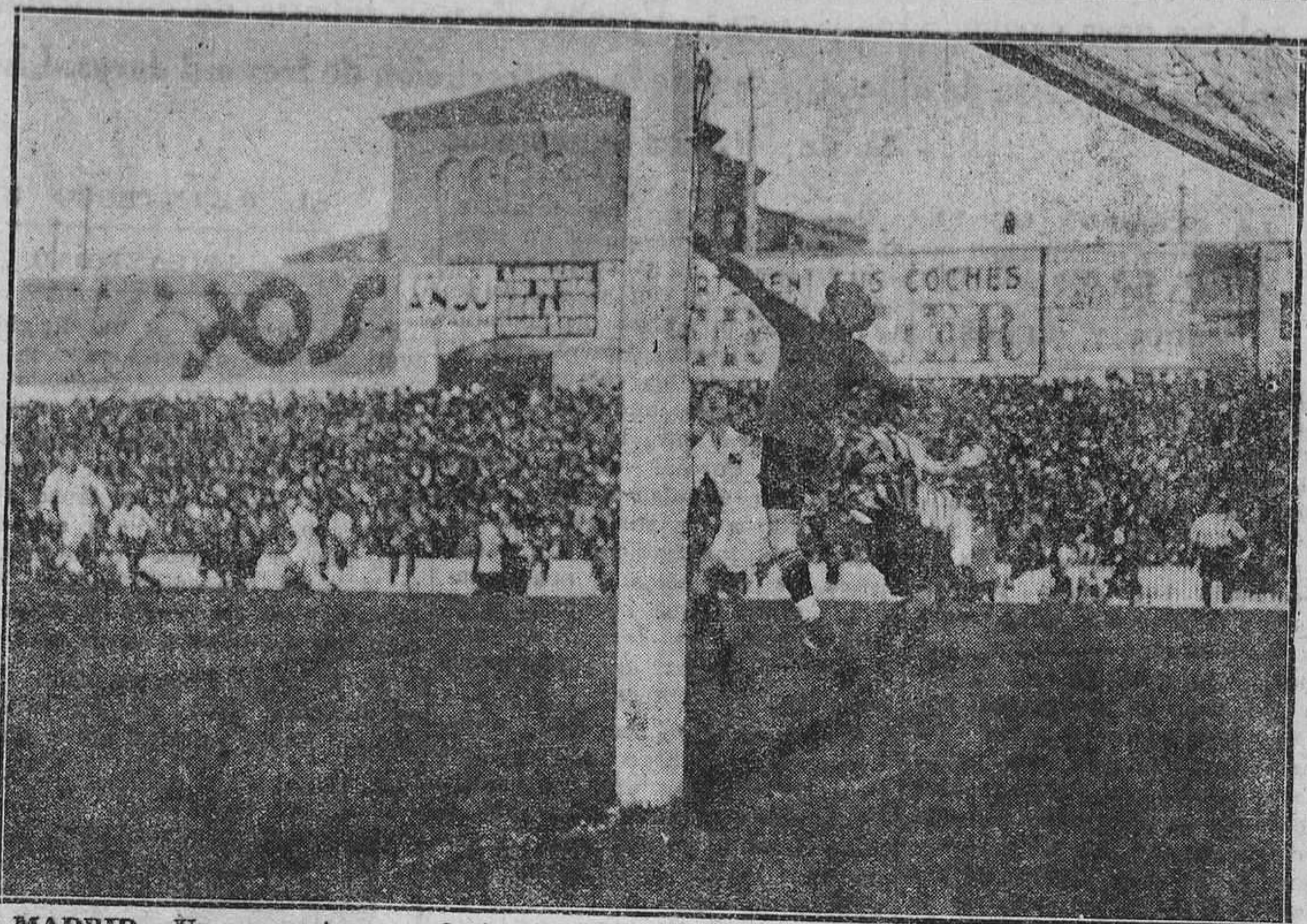
MADRID.—Un momento apurado frente a la meta del Madrid en el partido jugado el pasado domingo entre los "merengues" y el Athlétic de Bilbao.

Triunfaron los del Hércules por dos a cero.