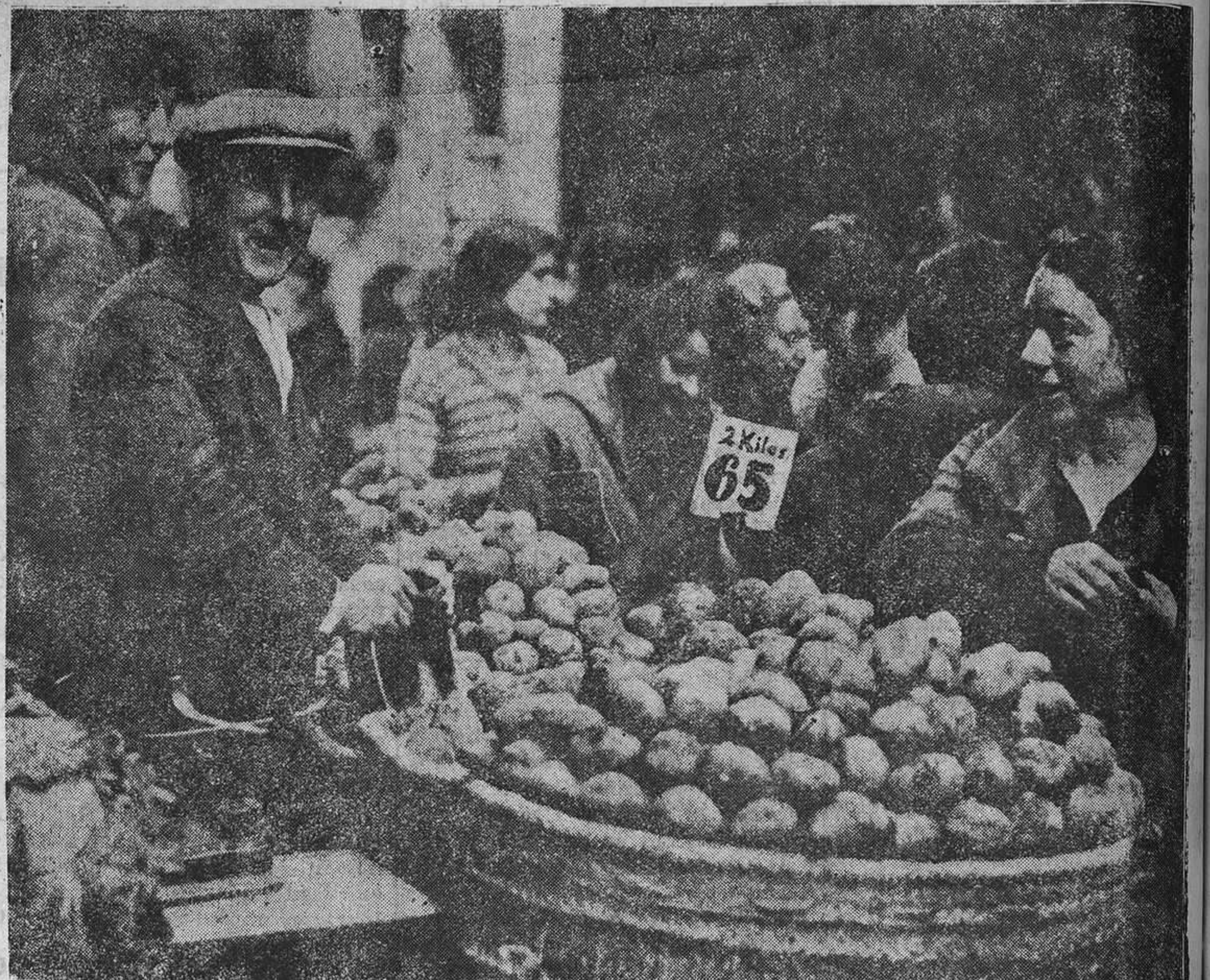
MADRID.—El público adquiriendo en uno de los mercados las patatas, cuya rebaja de precio fué impuesta por el municipio madrileño.