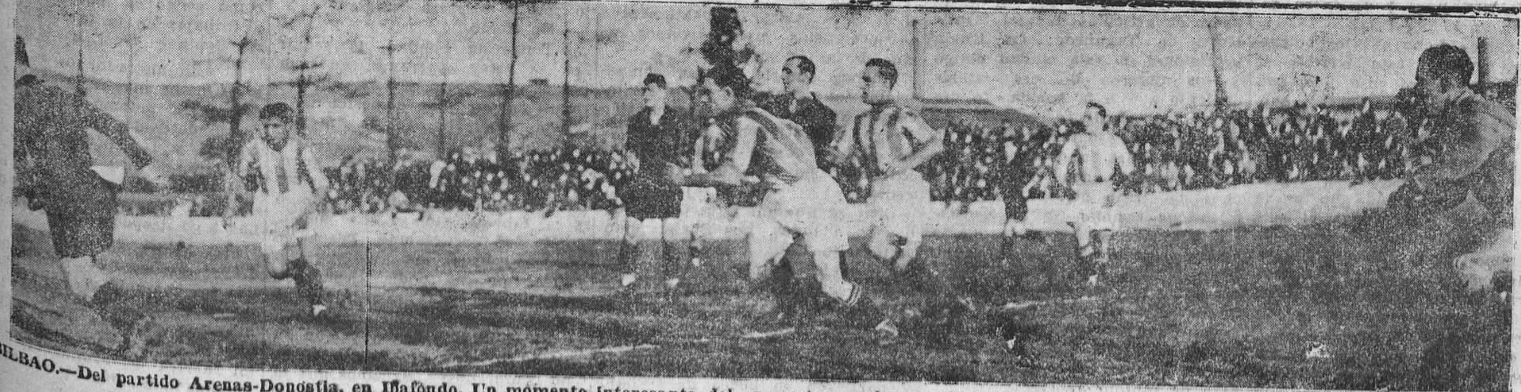
BILBAO.—Del partido Arenas-Donostia, en Ibañeta. Un momento interesante del encuentro en las proximidades de la meta donostiarra. (Foto Gil del Espinar).