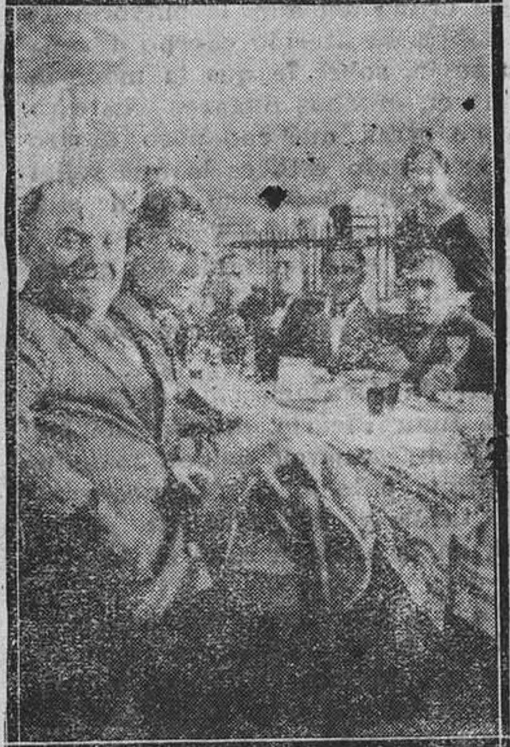
TURON.—Un detalle del banquete organizado por el Orfeón el día de Santa Cecilia.

A las once del domingo se celebró en la iglesia parroquial