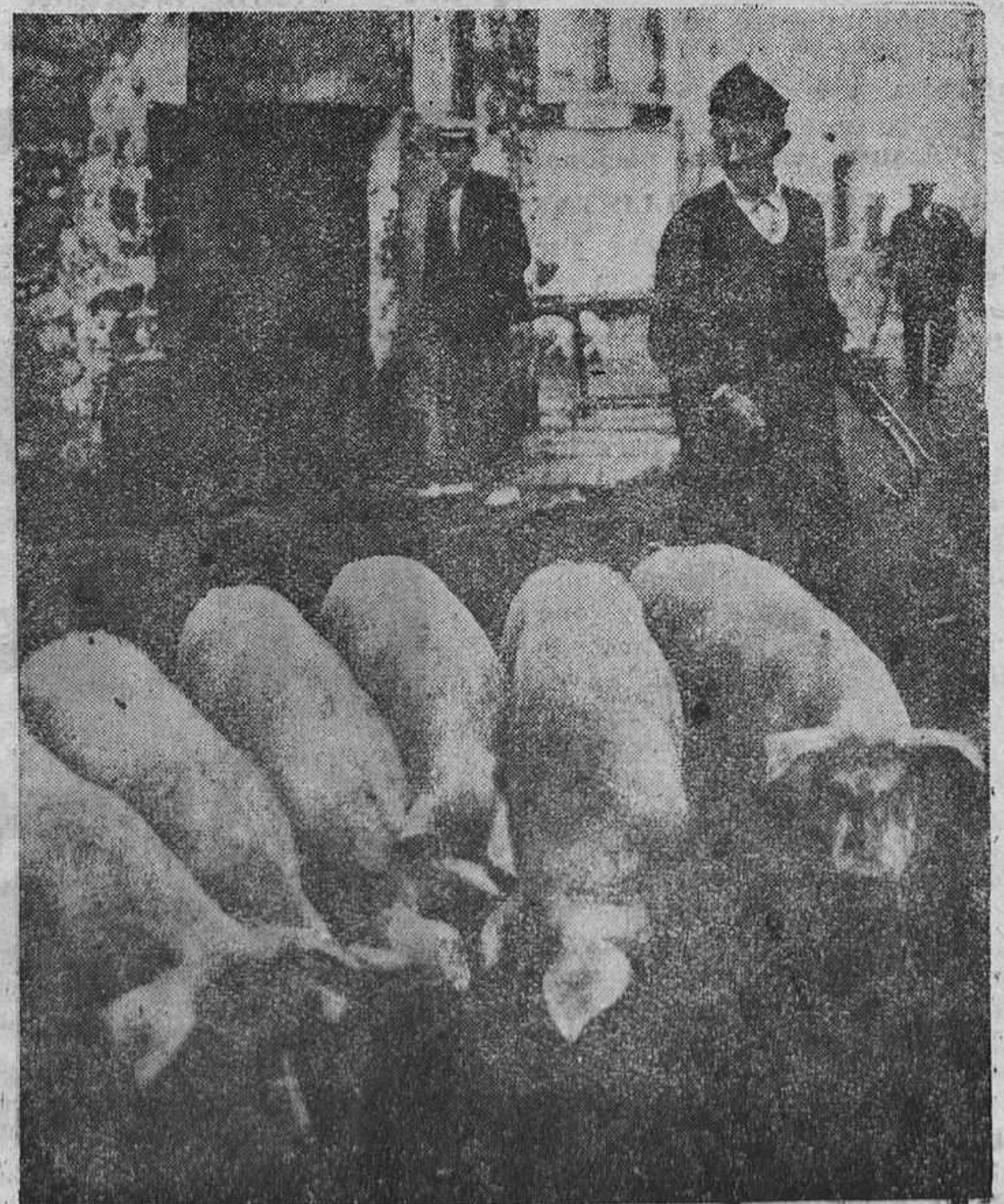
ESTAMPAS ASTURIANAS.—(Código de comercio)

No se devuelven los originales ni se sostiene correspondencia sobre los mismos