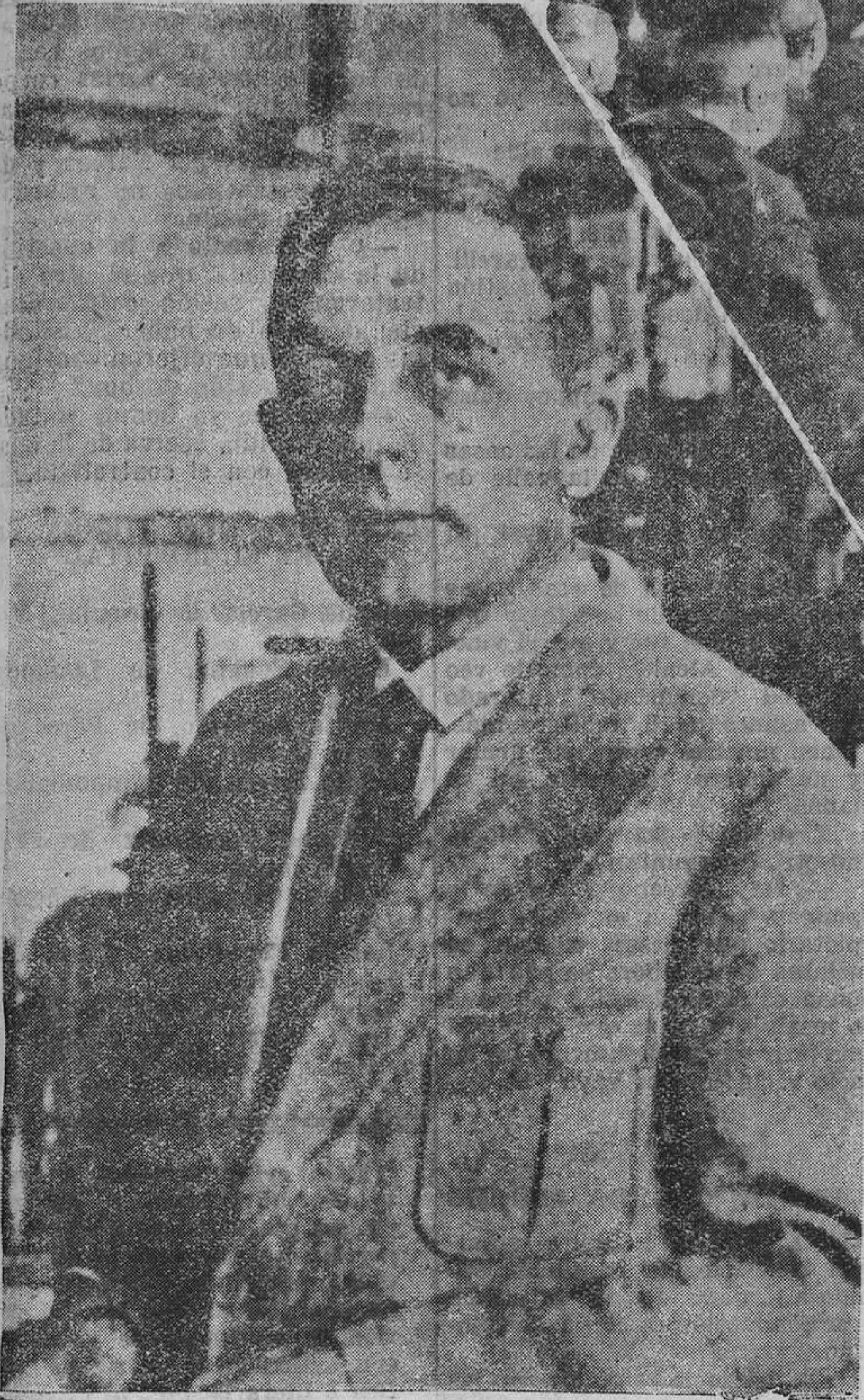
El doctor Otto Warburg, profesor de Física del Instituto Kaiser Wilhelm, de Berlín, a quien acaba de serle concedido el "Premio Nobel de Medicina 1931. (Foto Vidal).