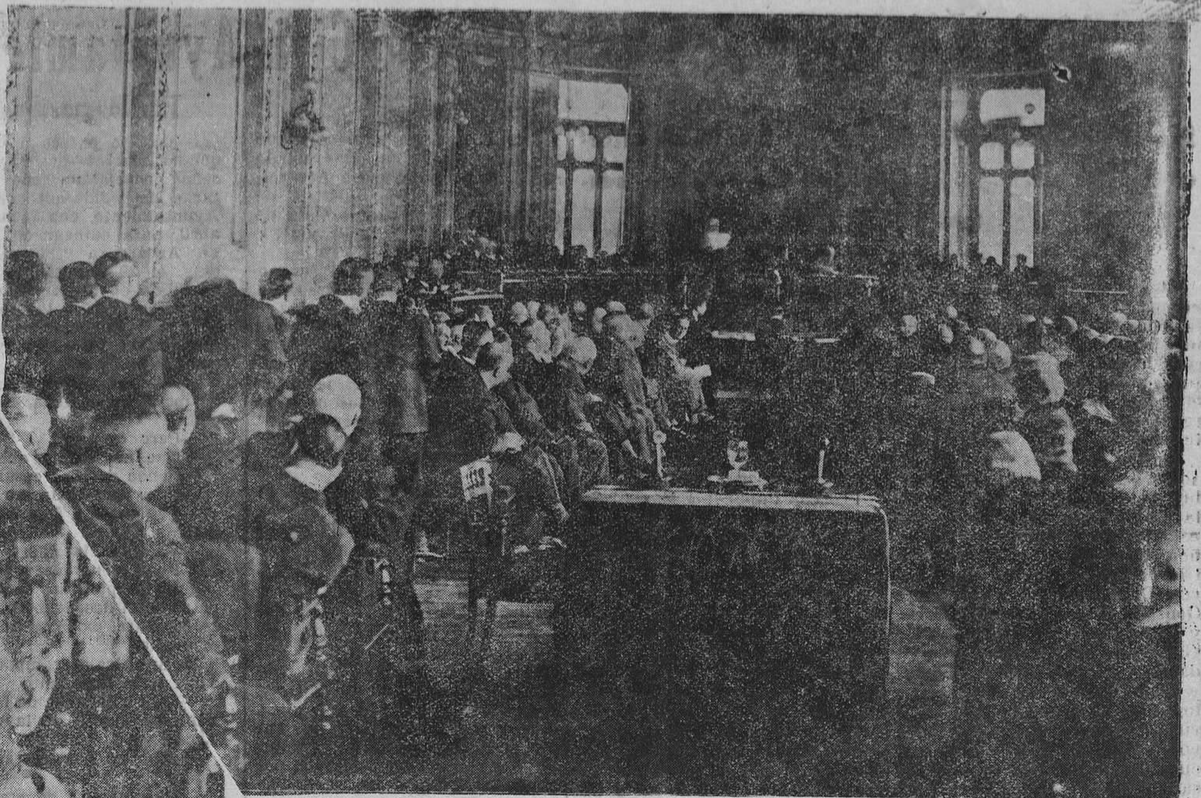
MADRID.—Aspecto del salón de actos del Banco de España durante la junta extraordinaria que se ha celebrado. (Foto Vidal).