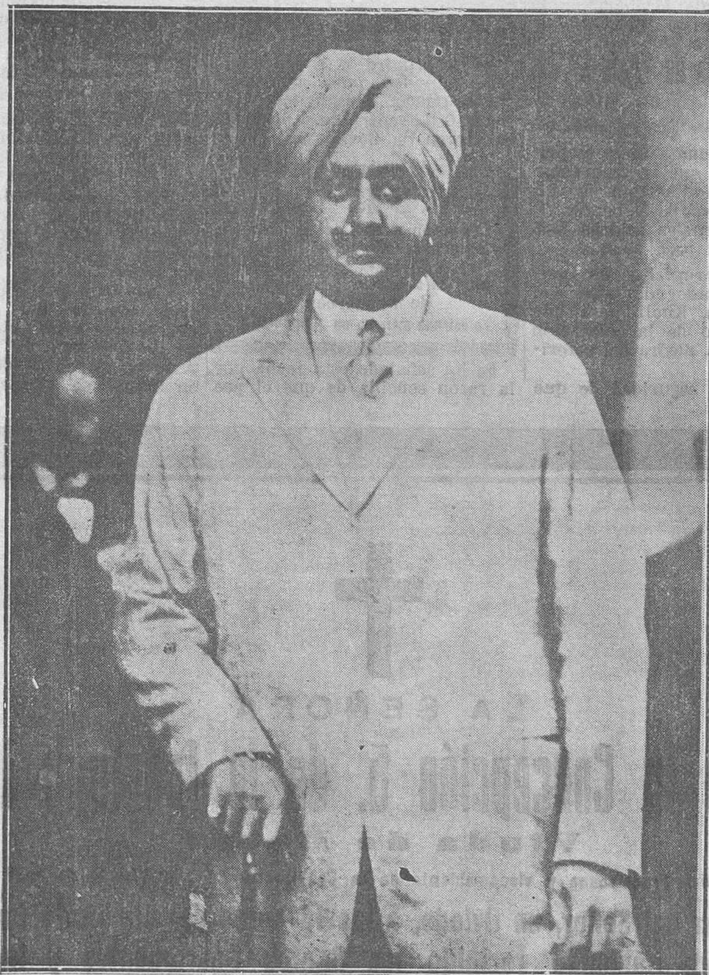
El maharajah de Patla, que llegó a Madrid y es huésped de nuestros Reyes.

De modo, que fué un éxito el cursillo, y tales sus consecuencias, que pueden enriquecer a numerosos labradores pobres!