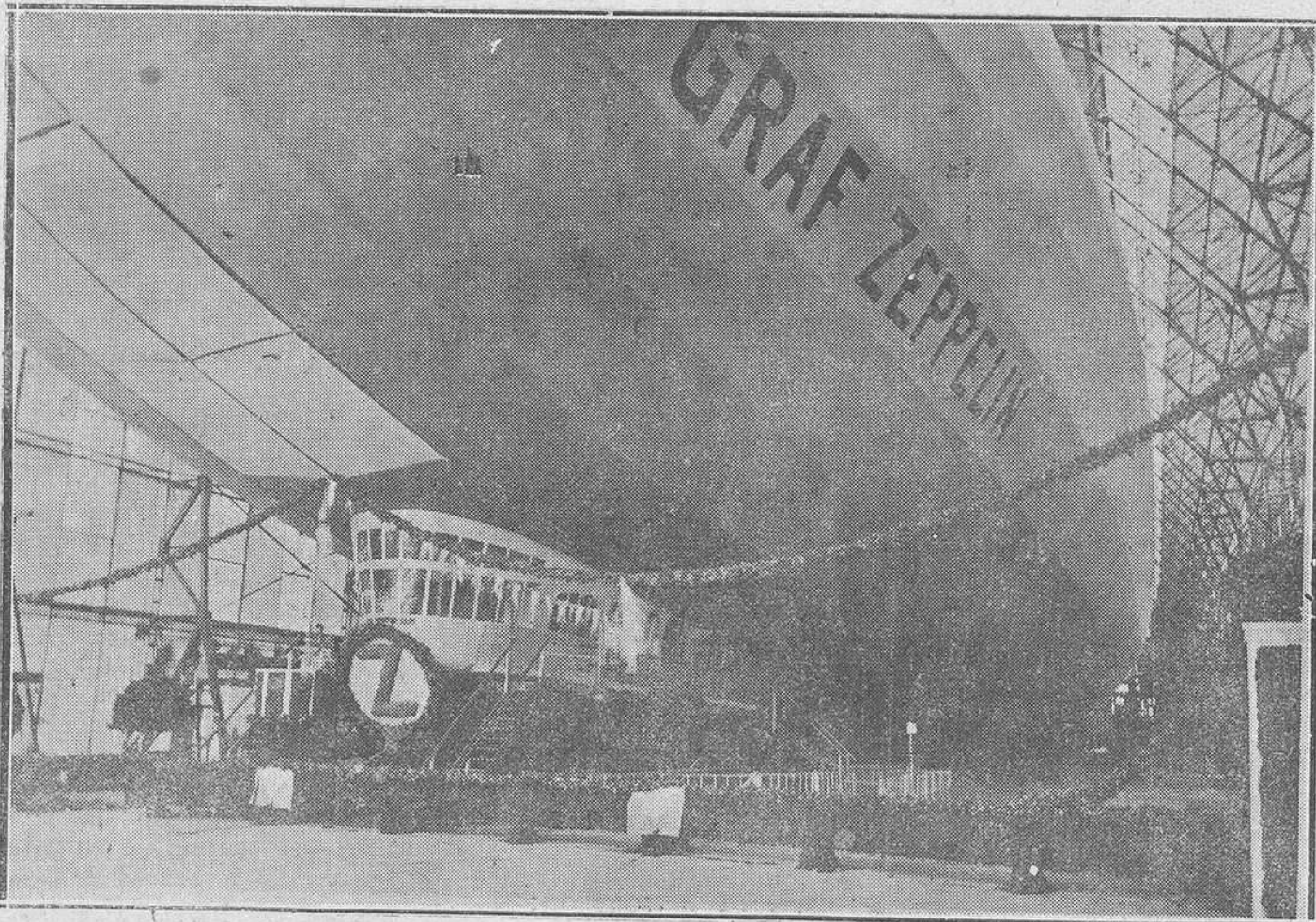
El dirigible "Conde Zeppelin", que acaba de realizar la travesía del Atlántico.

Del hecho se dió cuenta a la autoridad judicial la cual se personó en el lugar del suceso ordenando el levantamiento del cadáver y su traslado al cementerio de aquella parroquia donde se le practicará la diligencia de la autopsia.