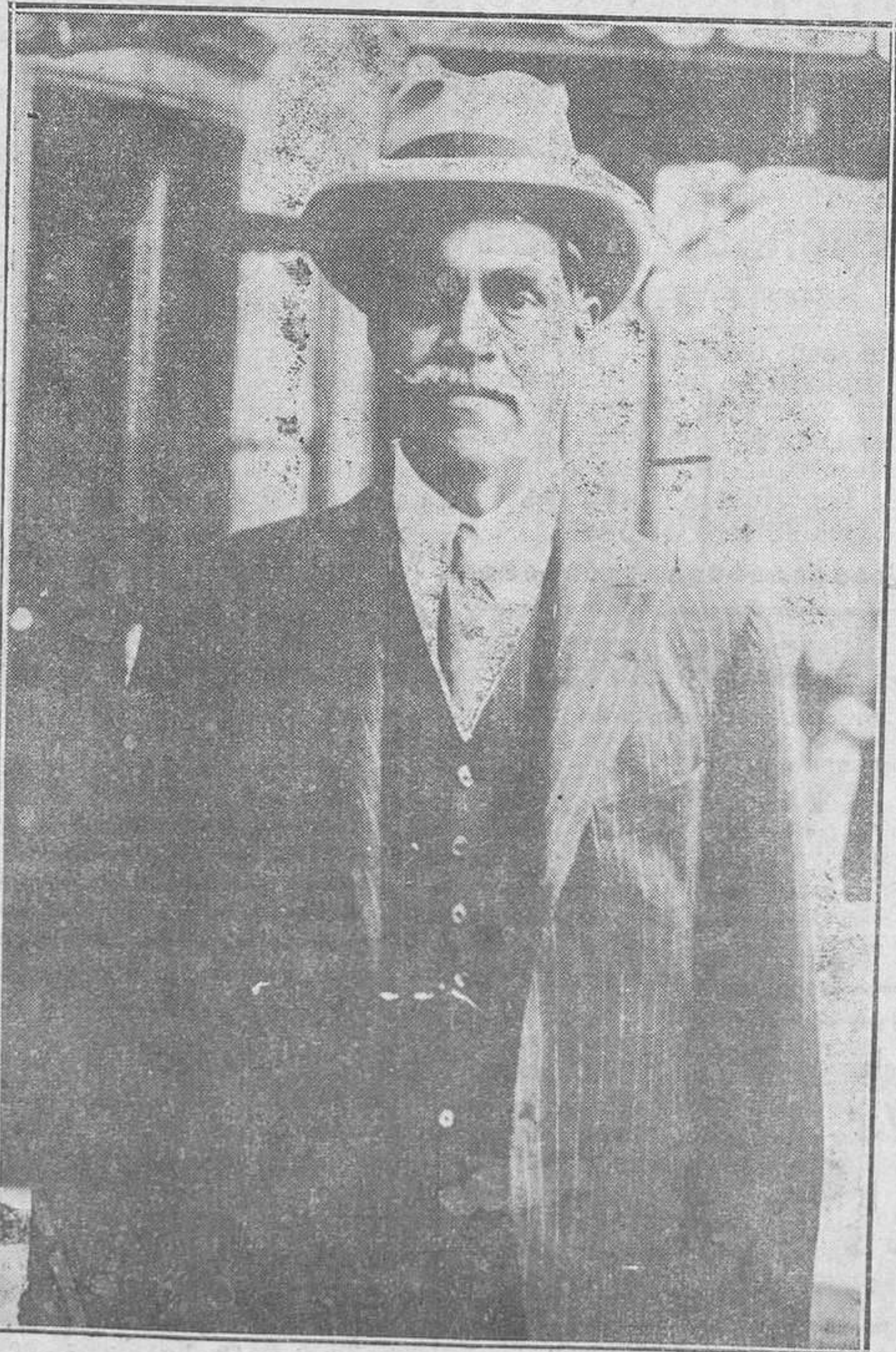
El maharajah de Kapurtala, que el pasado lunes llegó a Madrid y es huésped de nuestros Reyes.

La "Campanilla"—dijo— para ella! Y expiró. L. Redondo LLERANDI