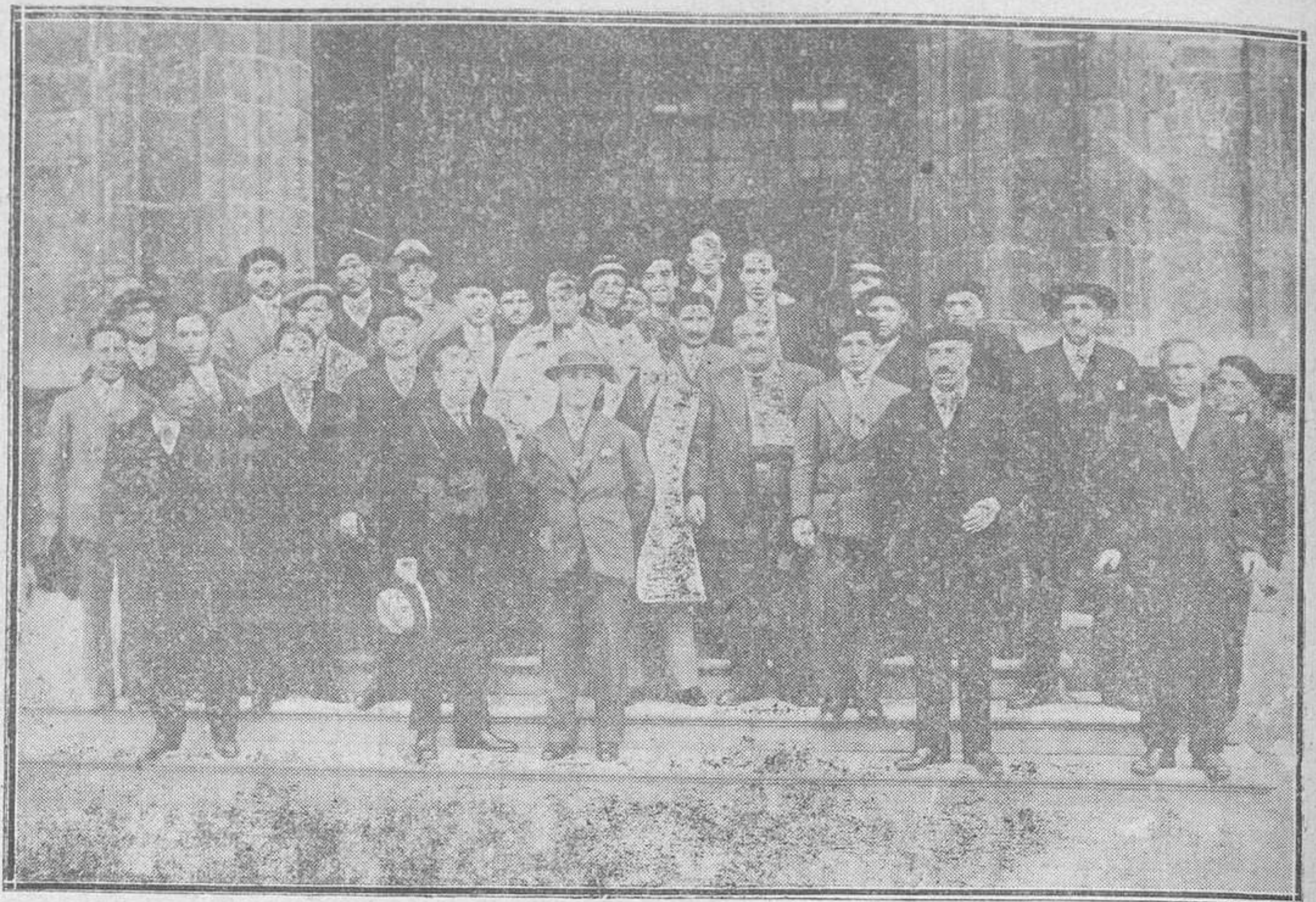
OVIEDO.—El alcalde y fuerzas vivas de Moreda, que asistieron el sábado último al pleito celebrado en la Audiencia, pro Segregación de Moreda.