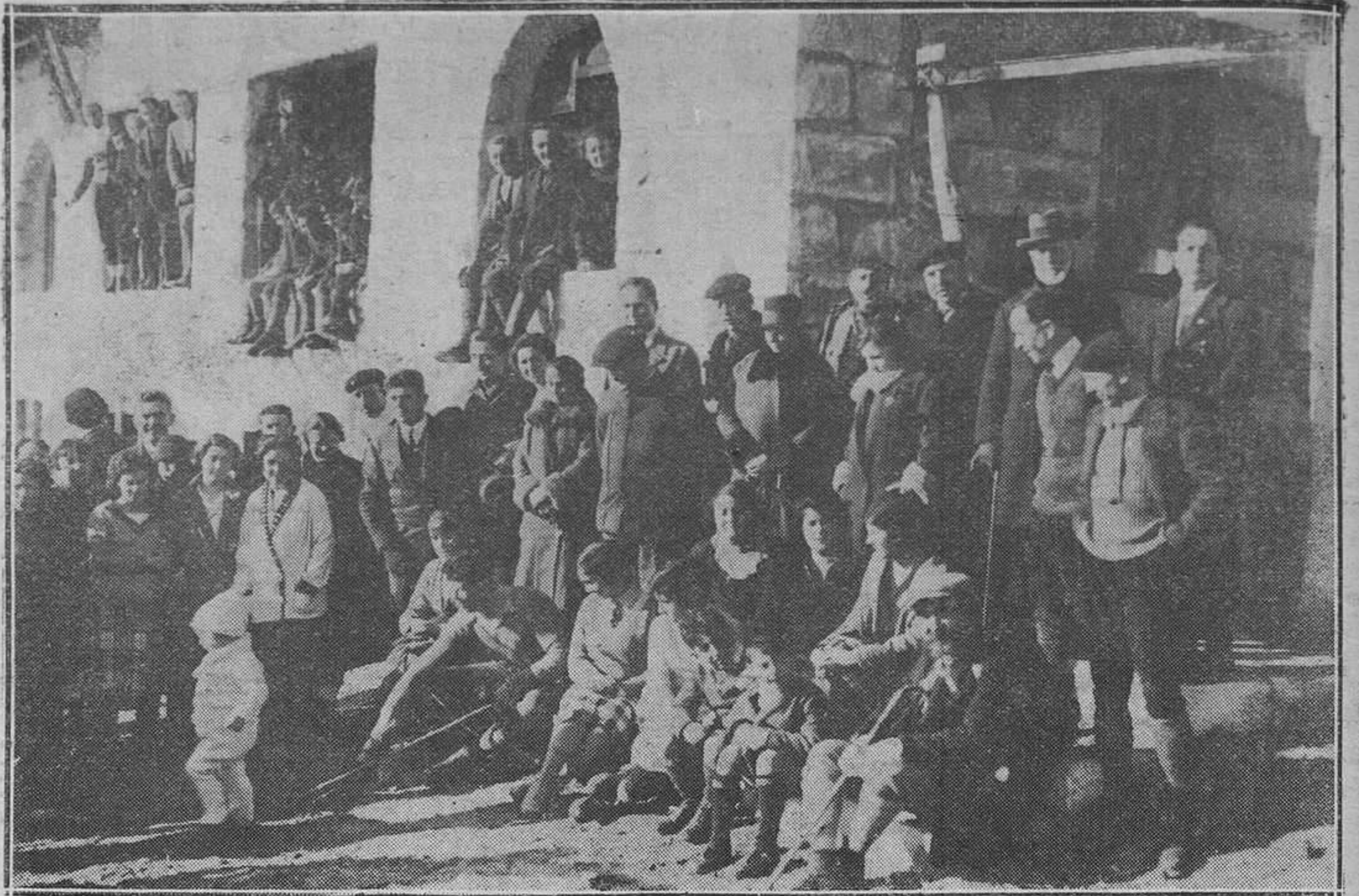
EN EL PUERTO DE NAVACERRADA: INAUGURACION DEL NUEVO CHALET DE LA REAL SOCIEDAD PEÑALARA.-Grupo de socios que han asistido a la simpática fiesta.

Un colega de esta capital en su número de anteayer daba la noticia de que en breve se celebraría una fiesta de caridad organizada por distinguidas señoras y señoritas a beneficio del Colegio-Asilo del Fresno y del Asilo de Ancianos; se nos suplica por los interesados hagamos constar su más sincero agradecimiento, pero que obediendo órdenes superiores, no les es posible admitir ese beneficio, ya que en todas las diócesis los Prelados han dispuesto que las fiestas de caridad no sean de índole teatral; esto, sin embargo, no significa un voto de censura, pues basta saber los nombres de las organizadoras y de las señoritas que van a tomar parte activa, para asegurar sin el menor género de duda que la representación se ajustará a las normas de la más exquisita corrección y de la más escrupulosa moralidad.