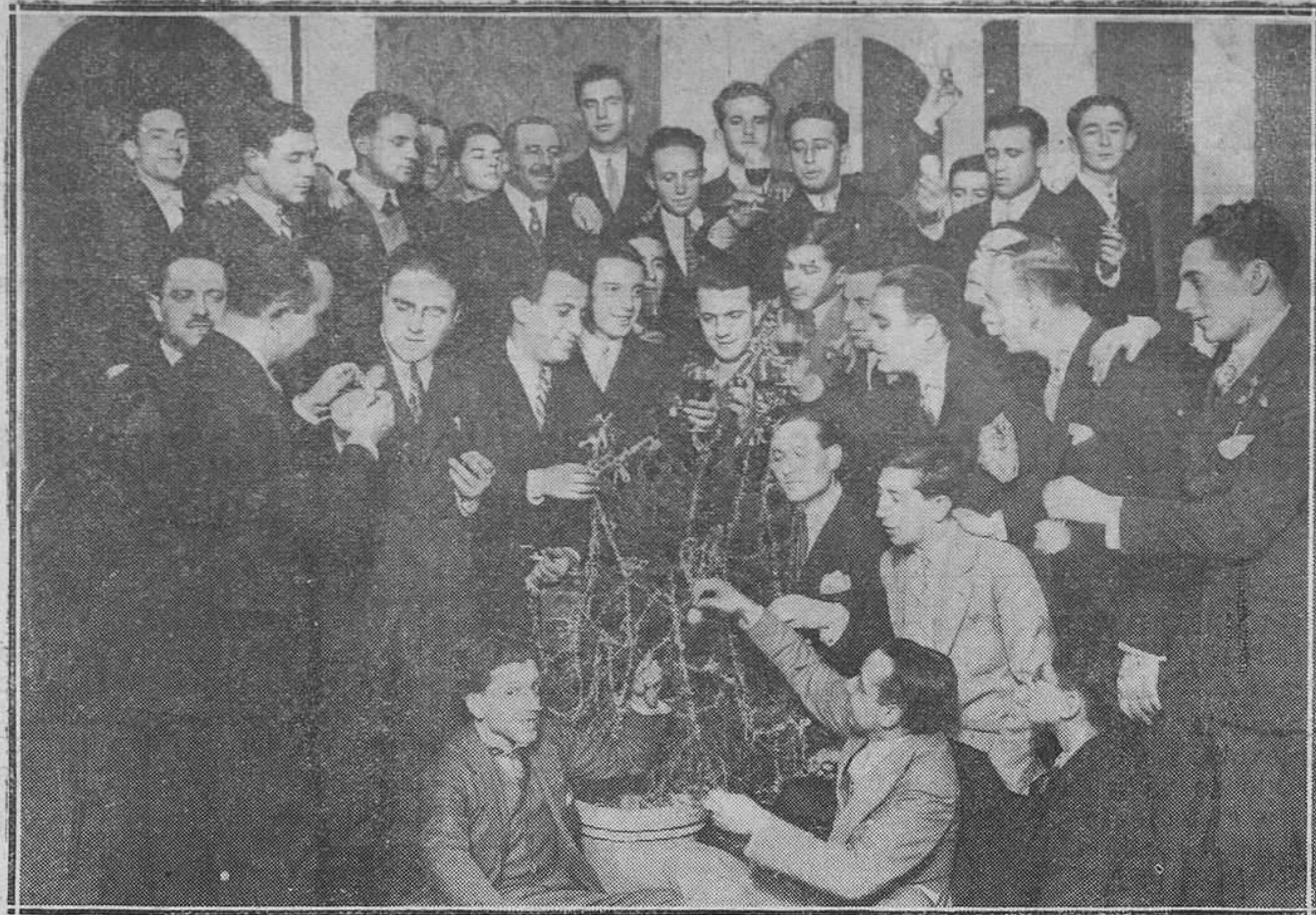
La Casa de España en Roma invita a tomar las uvas a los peregrinos españoles del XI centenario de las canonizaciones de San Luis y San Estanislao de Kostka.

La pericia y el arrojo de la clase marinera, creadas a fuerza de mil peligros, han sabido contrarrestar una y otra vez los