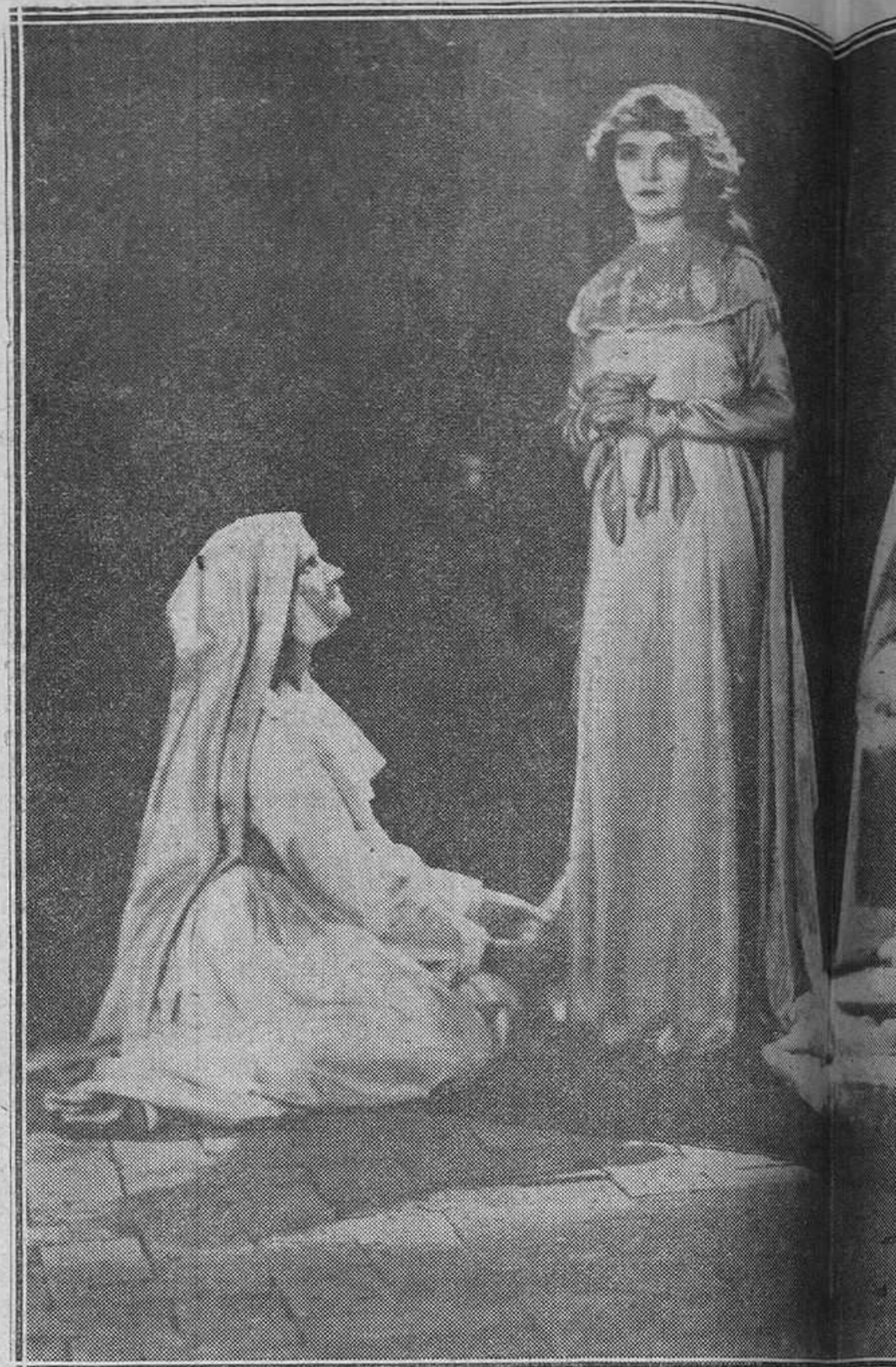
Una interesante escena de la bella producción "Met..."

Yo estoy plenamente convencida que si un artista tiene verdaderos méritos, más tarde o más temprano