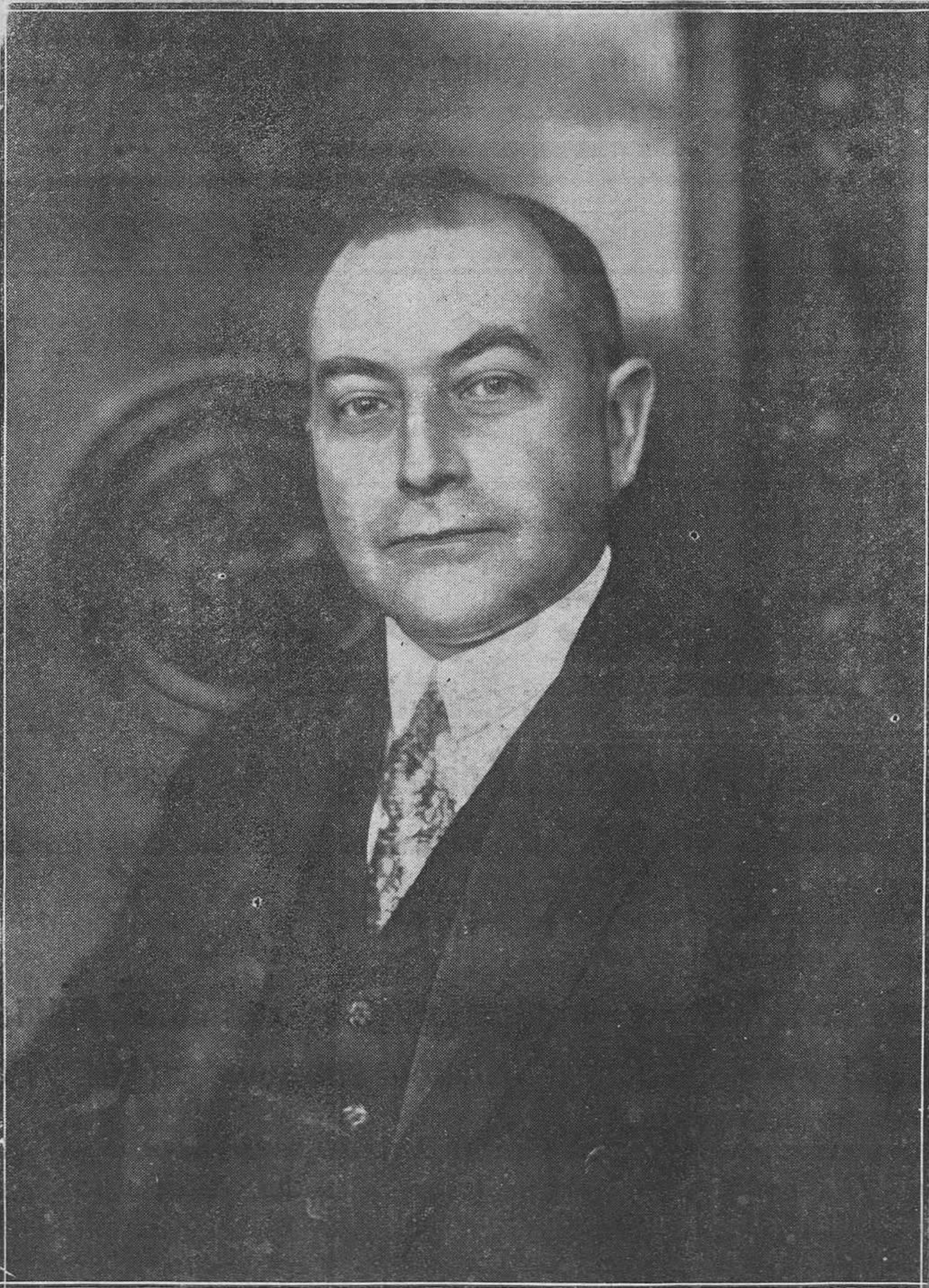
El político alemán doctor Julius Curtius, probable nuevo presidente del Reich.

El primero será un acto agradable; el segundo, ya no tanto. Pero permitirá que el ministro se entere de la justicia de la petición de nuestro Municipio en solicitar que se permitan las obras de adaptación del antiguo Palacio de Toreno para instalar allí los Juzgados.