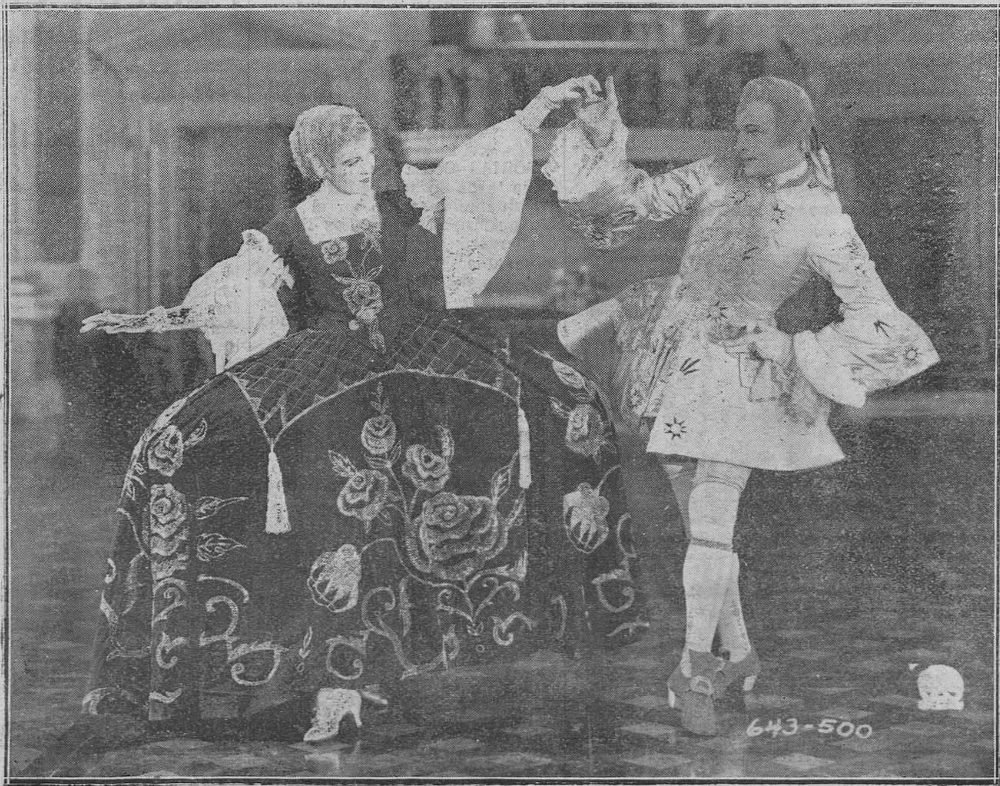
Rodolfo Valentino y Doris Kemjon en una escena de la superproducción Paramount MONSIEUR BEAUCAIRE.

A los doce años intentó ingresar en la Marina de Guerra, siendo rechazado por la Escuela Naval de Venecia por faltarle un centímetro de circunferencia torácica.