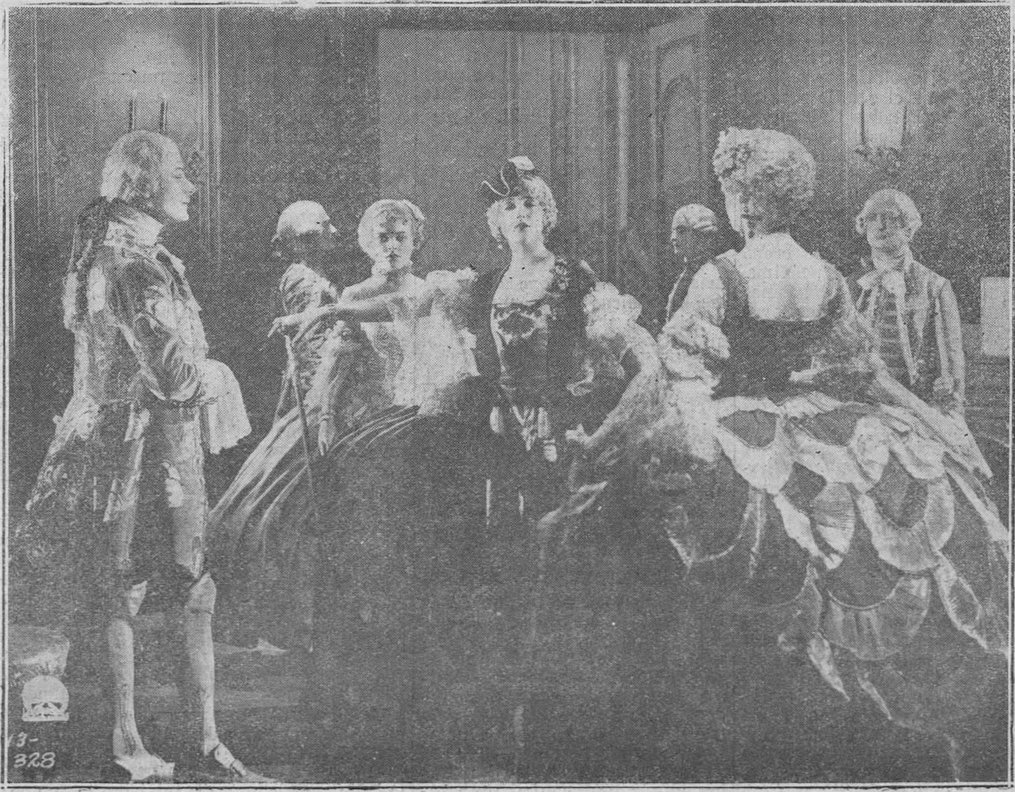
Una escena de la hermosa película MONSIEUR BEUCAIRE.

A los trece años ingresó en la Escuela de Agricultura de Génova, donde permaneció hasta los dieciocho, siempre creyendo que Dios le llamaba a ser un gran colono. Desengañado, abandonó la Escuela y se dedicó a vivir alegremente su vida. Contrajo deudas por varios miles de libras, deudas que pagó su madre, y para regenerarse determinó marchar a los Estados Unidos. Allí lo fué todo: jardinero, bailarín, artista de "musie hall" hasta que un día en California le contrató Norman Kerry, que ya le había visto trabajar en Nueva York. En la "Universal" hizo papeles de todas las clases: muchacho, viejo, salvaje, canalla, obrero, etc., hasta que June Mathis le dió el papel de Julio en "Los cuatro jinetes del Apocalipsis" cuya interpretación le colocó entre los mejores galanes jóvenes. A partir de este momento su vida es un constante éxito. Envalentonado, rompió en 1923 el contrato con la Paramount y se metió en un pleito que fué fallado a favor de la Compañía productora. Poco tiempo después la Paramount cedió en sus derechos y Valentino entró a formar parte de la Empresa "Artistas reunidos" que era el final deseado. En dicha Empresa estaba cuando le sorprendió la muerte en agosto del año último.