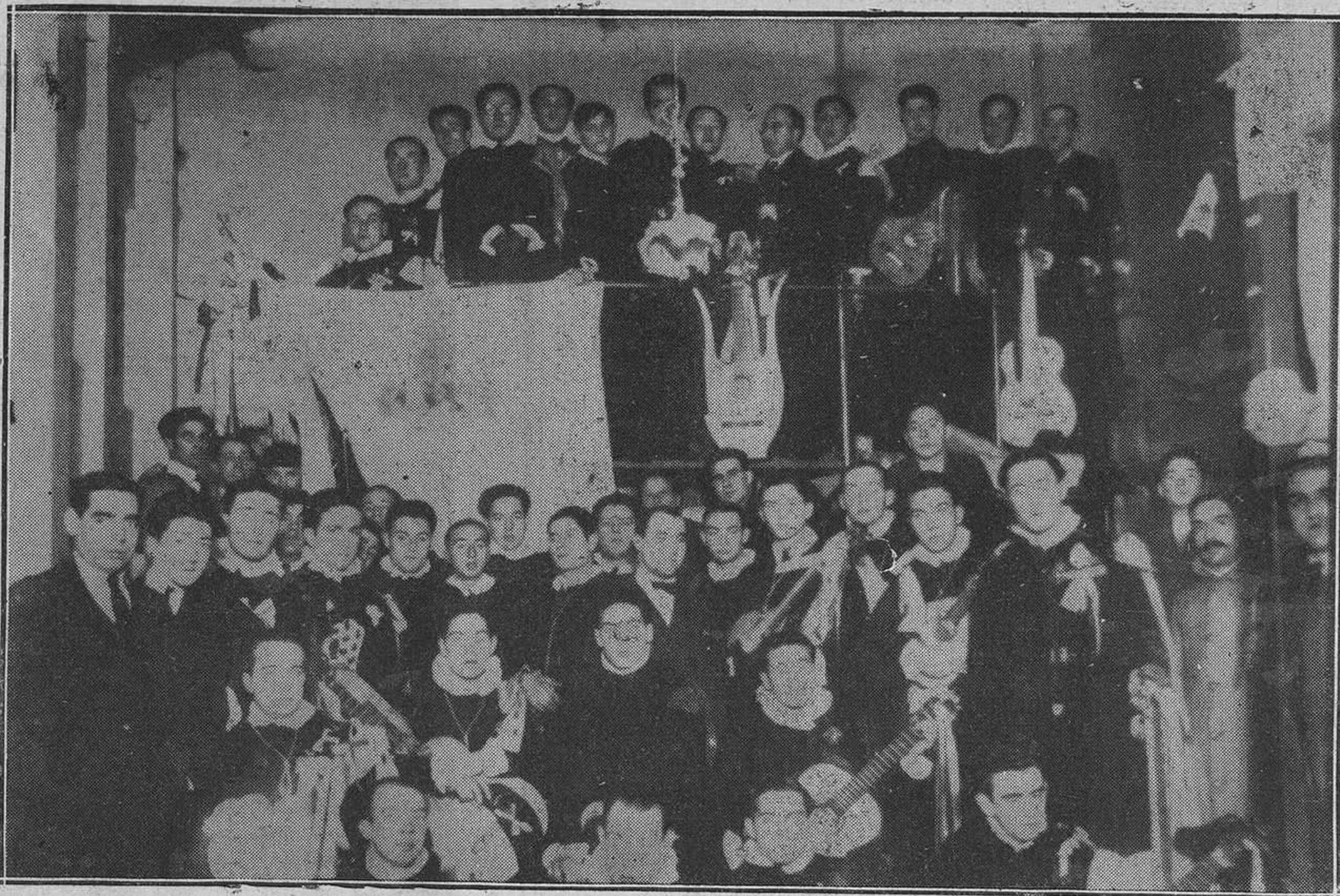
La Tuna Compostelana en los talleres de "REGIÓN".