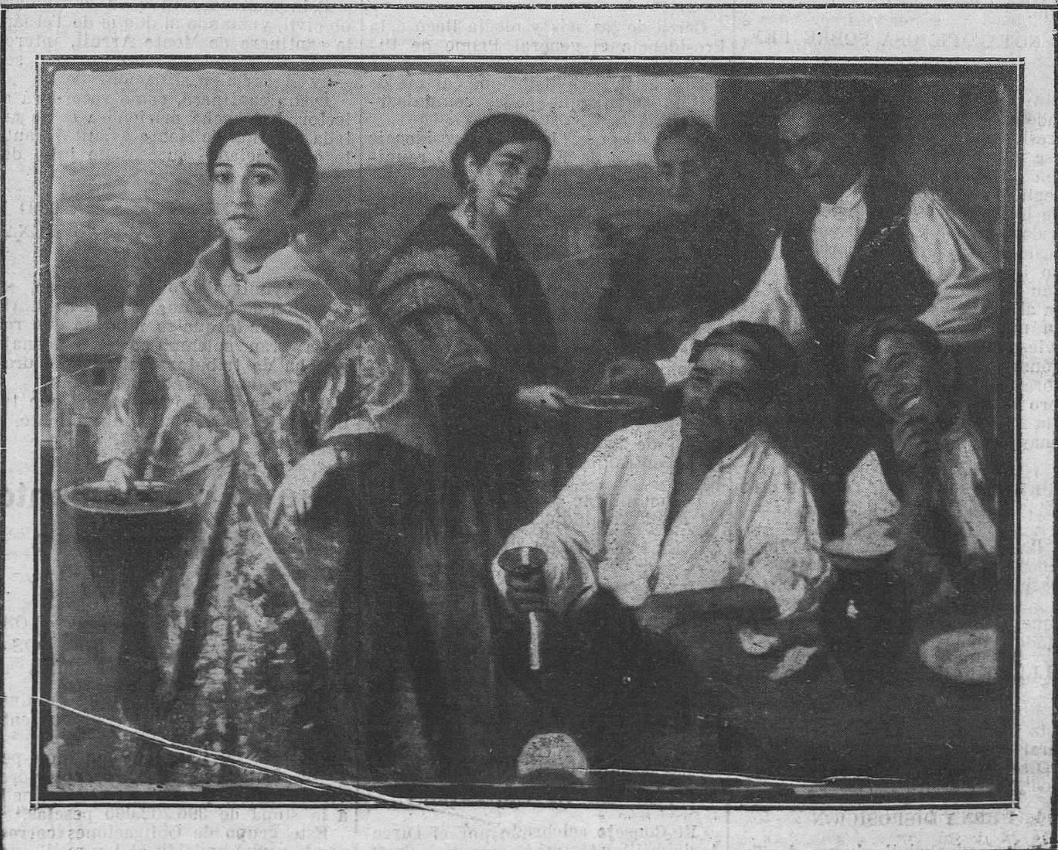
"Para la fiesta de la Virgen", cuadro baturro de Juan José Gárate.

para darnos cuenta de las amplitudes a que ha sabido llegar en los últimos tiempos, nos tro- en esta Exposición con una serie de cuadros que establecen valores más excelsos dentro de total. Ya no es el realismo sólo, la copia del con fidelidad admirable, sino de algo que está de aquél misterio espiritual que se refleja en de las personas, y que establece la misteriosa entre la materia y el espíritu, el divino brote a. Véase, por ejemplo, su "Melancolía crepus- y el cuadro titulado "Añoranzas", y en resumen aquellas telas en donde las figuras femeninas apa- para confesarnos, en su gesto, en su actitud, en ente que rodea su presencia, las más diversas es que, en cada caso, son manifestación palpi- de los matices espirituales de la vida. poder de compenetración con el modelo, este hasta extraer y poner sobre la superficie las des del carácter y el misterio de las psicologías, Gárate, con su dominio del dibujo, un retratista mismo, retratista de los que no han de temer las modelo, de los que hacen figuras que están ha-