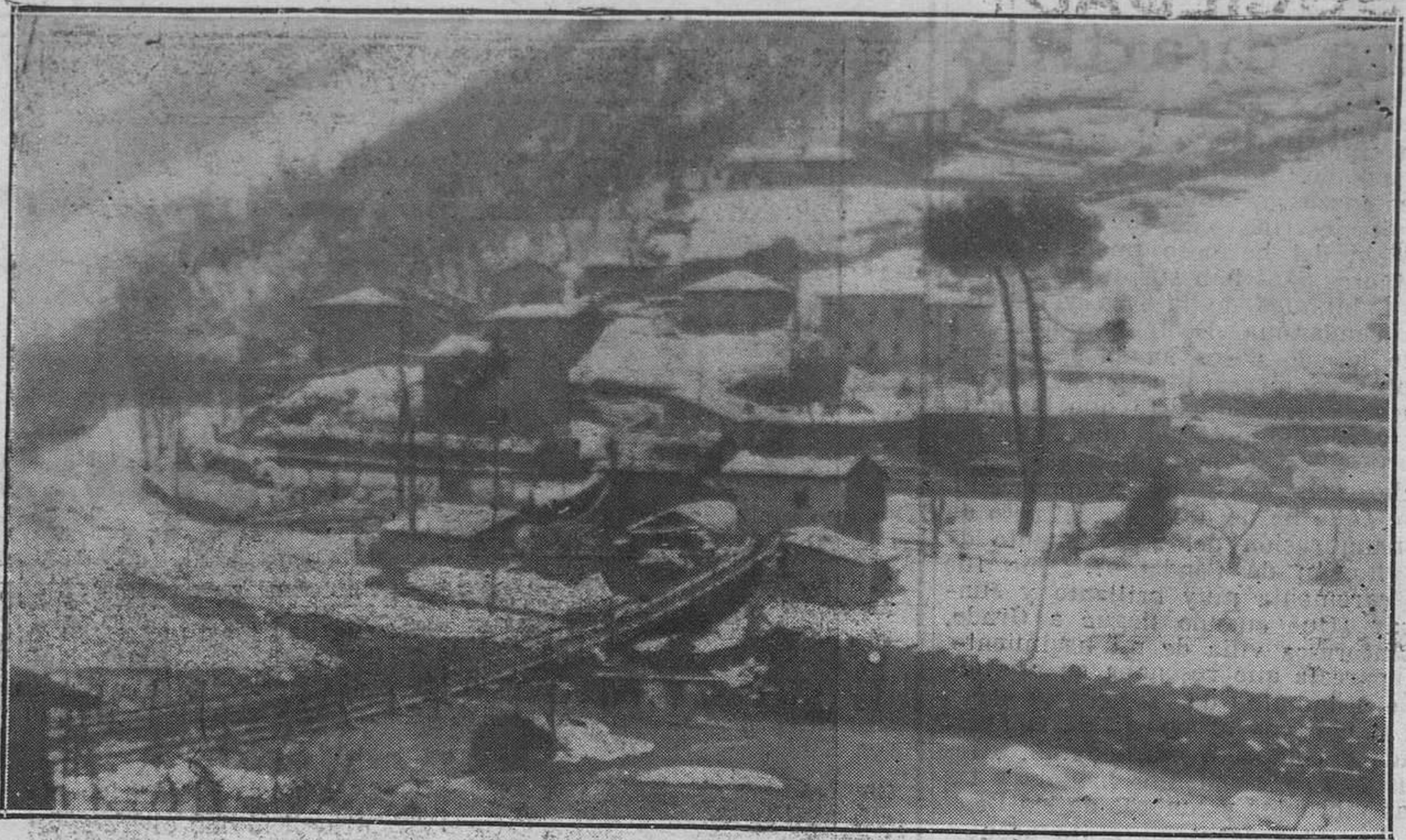
SANTA CRUZ.—Vista panorámica del barrio de Oviella bajo la última nevada. En primer término se ve el puente colgante que pronto va a ser sustituido por uno de cemento armado.

—Eso es, al menos, lo que a mí se me ocurre, sin que esto quiera decir que posea datos que me permitan asegurarlo en firme.