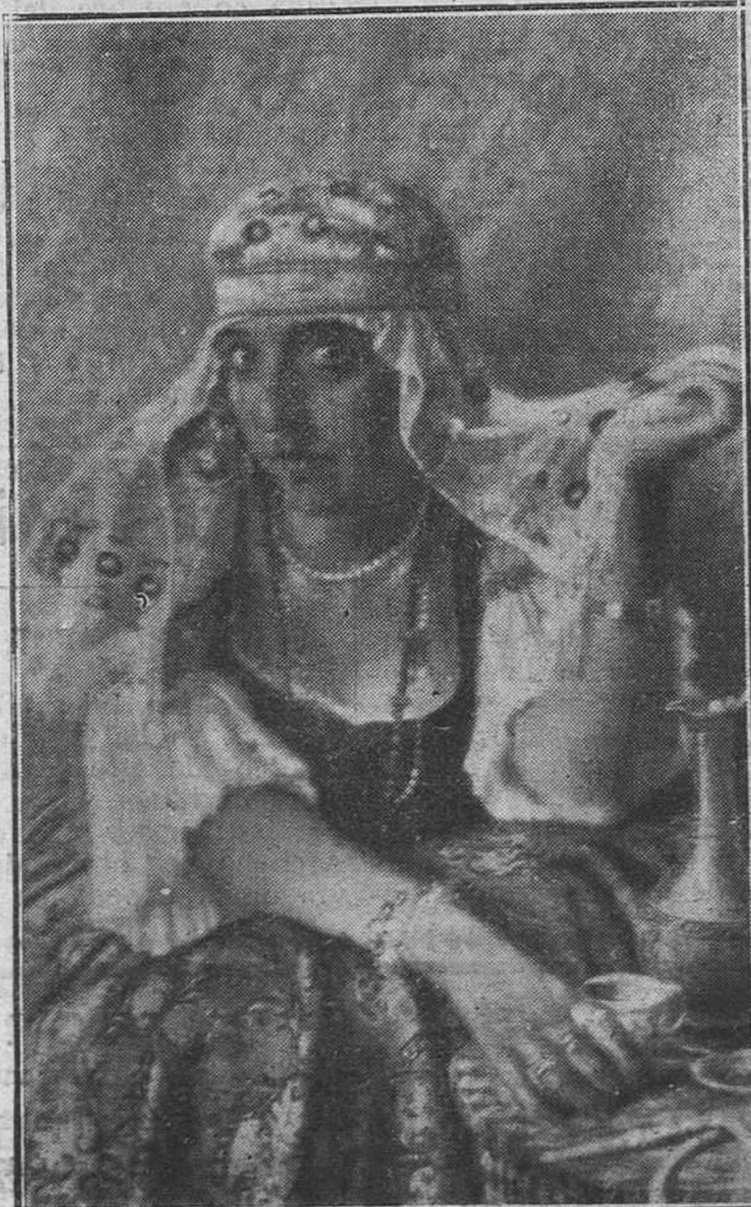
"Bohemia", cuadro de Juan José Gárate.

Encerrado horas y horas en su estudio, no poniendo nunca artificio alguno entre sus medios de adquisición y la realidad, contrastando con ella todas sus impresiones, sus cuadros dan esa nota de verdad, de escri-