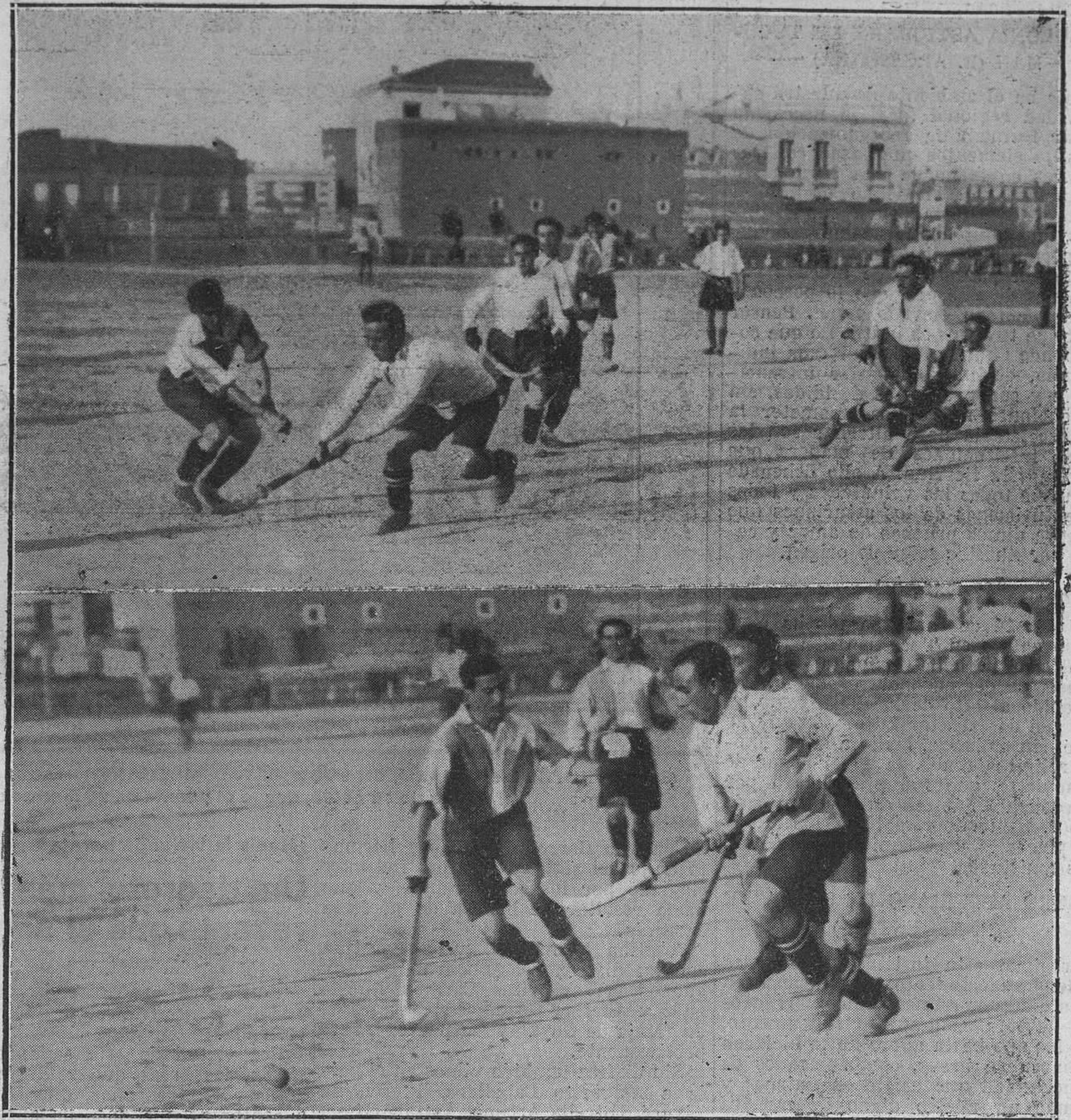
MADRID: CAMPEONATO ESPAÑOL DE "HOCKEY".--Dos momentos del partido jugado entre el "Athletic" y el "Madrid".

Y la Comisión se reúne, en valde, porque no se toman acuerdos.