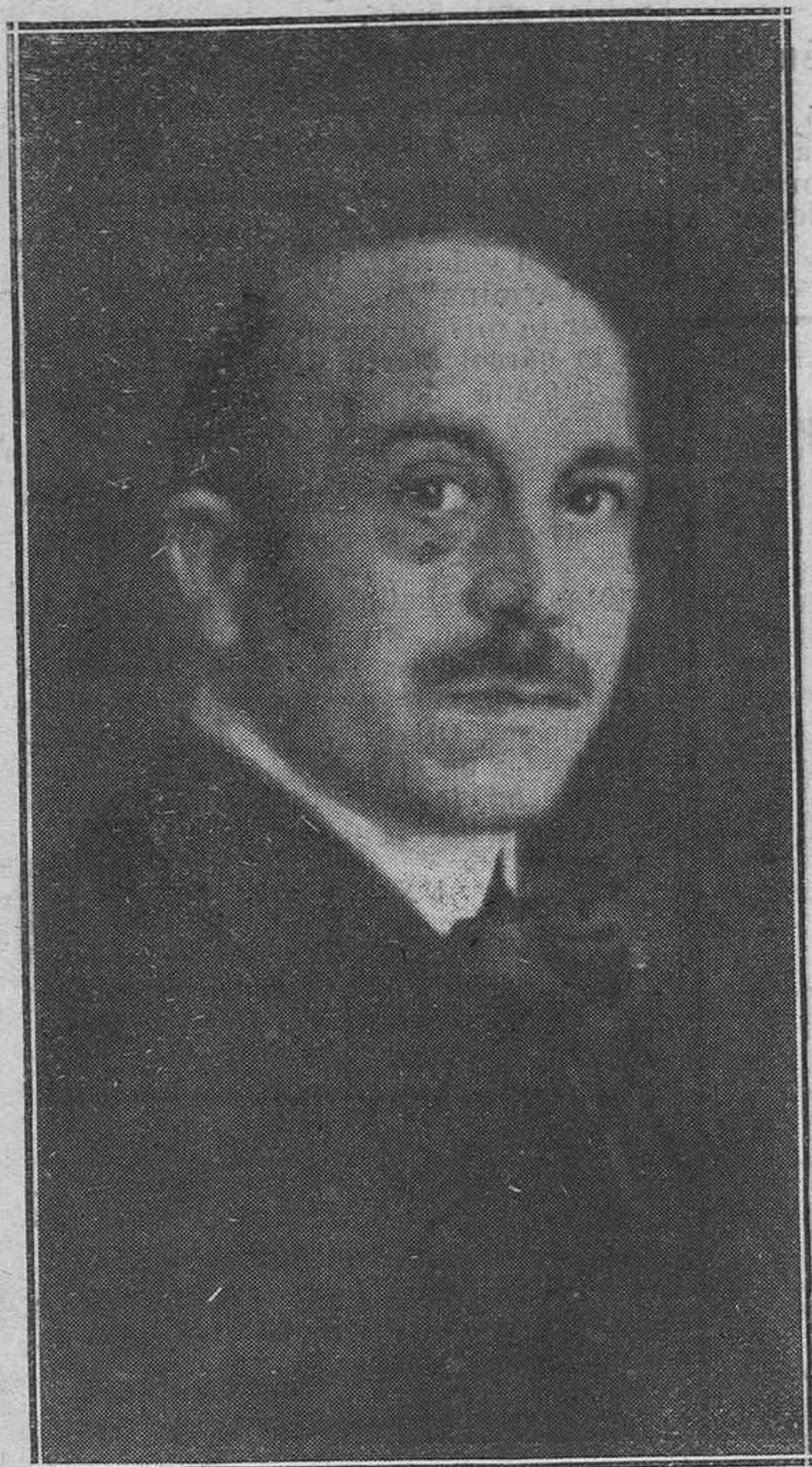
El notable pintor aragonés Juan José Gárate.

pulosa fidelidad con el natural, de honradez pictórica, a la que tan extraños quieren hacernos vivir los que se extraviaron, ellos sabrán guiados por qué solicitaciones o con qué aviesos intentos, por los andurriales de la falsedad y del conceptismo.