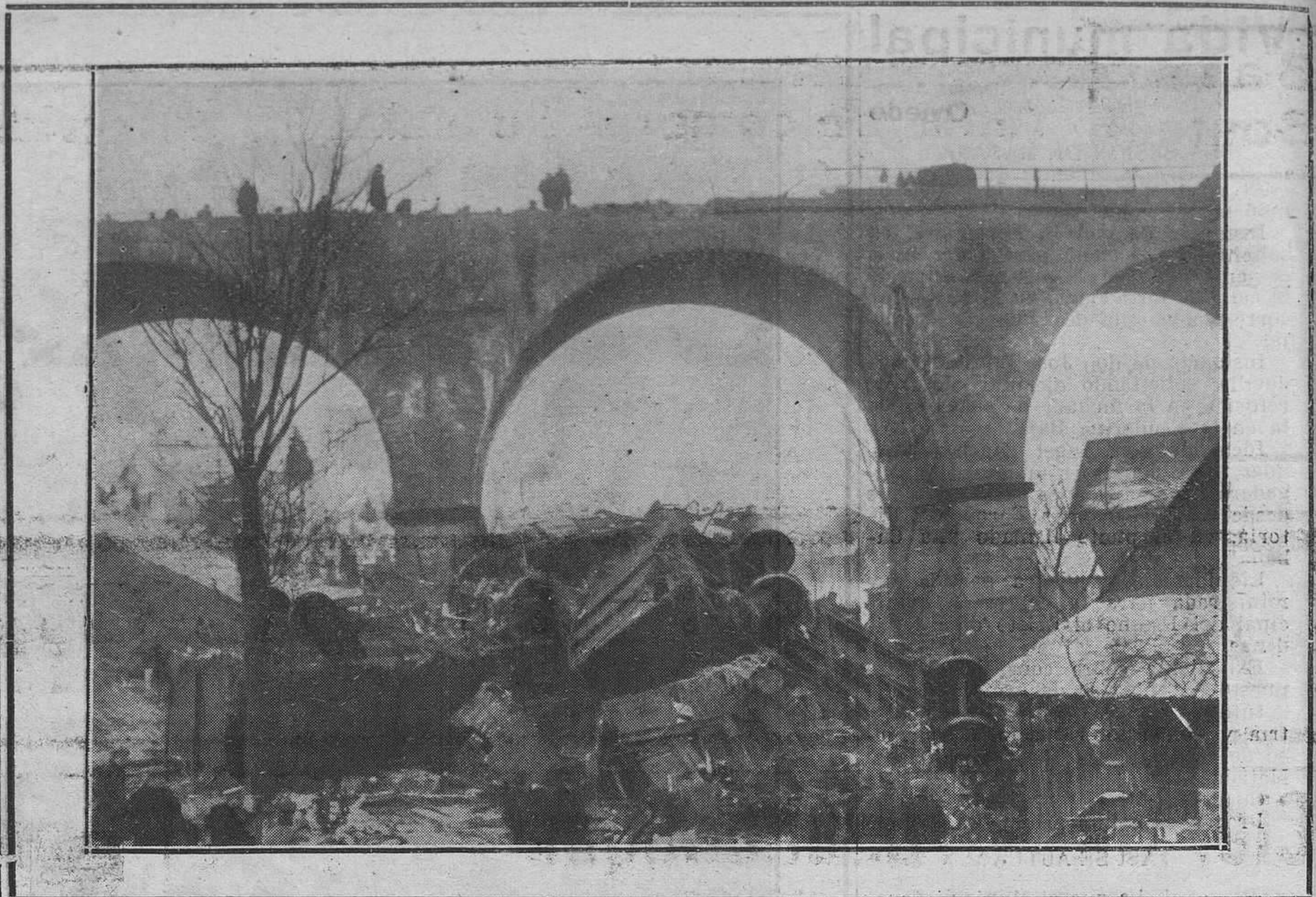
CATÁSTROFE FERROVIARIA EN LUDWIGSTAD (ALEMANIA).—El tren de mercancías Berlín-Munich momentos después de su caída, desde el puente de 26 metros de altura, sobre el pueblo.

Carmencita García, preciosa, disfrazada de "Ultraísta" (1).