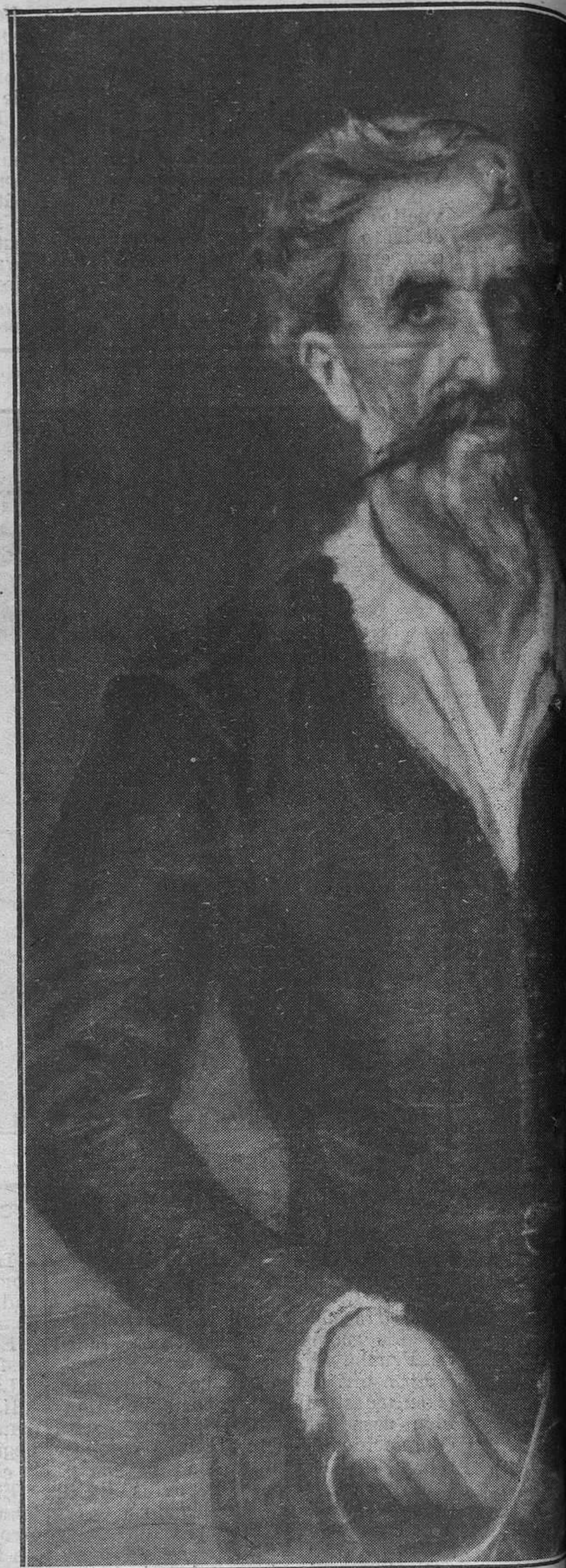
"Don Quijote de la Mancha", admira

pañolones, van recogiendo donativos para que no le faltan a la Virgen los festejos de siempre, y aquellos mozos socarrones y festeros, que, a tiempo que las entregan sus monedas, las regalan con los piropos un poco perfumados por el recio mosto de las uvas de la tierra, pero siempre llenos de esa gracia lozana y fresca que bulle bajo los cachirulos de los baturros, están pintados con ese respeto a la verdad que consagra a Gárate como pintor de la realidad española, no como un adaptador de cuadros españoles a una visión de España nacida en el extranjero.