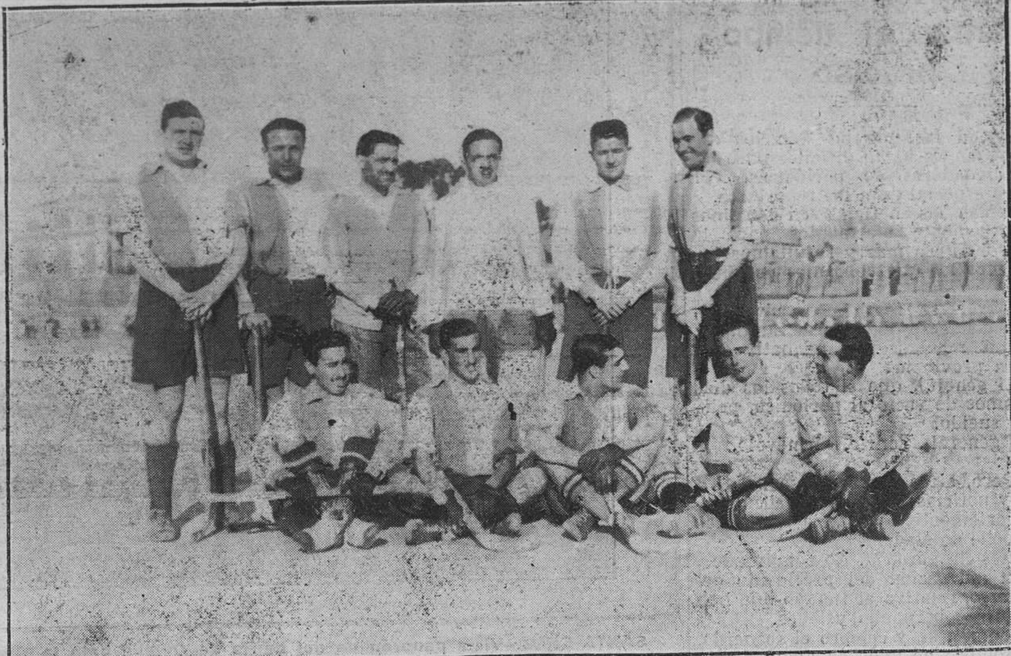
MADRID: CAMPEONATO NACIONAL DE "HOCKEY".—El equipo del Athletic, que ha sido declarado campeón de la región Centro.

El ejercicio de Reparación con la Hora Santa Eucarística, corresponde hoy jueves, día 28 de febrero, en la iglesia de los Padres Misioneros del Llano, de seis a siete de la tarde.