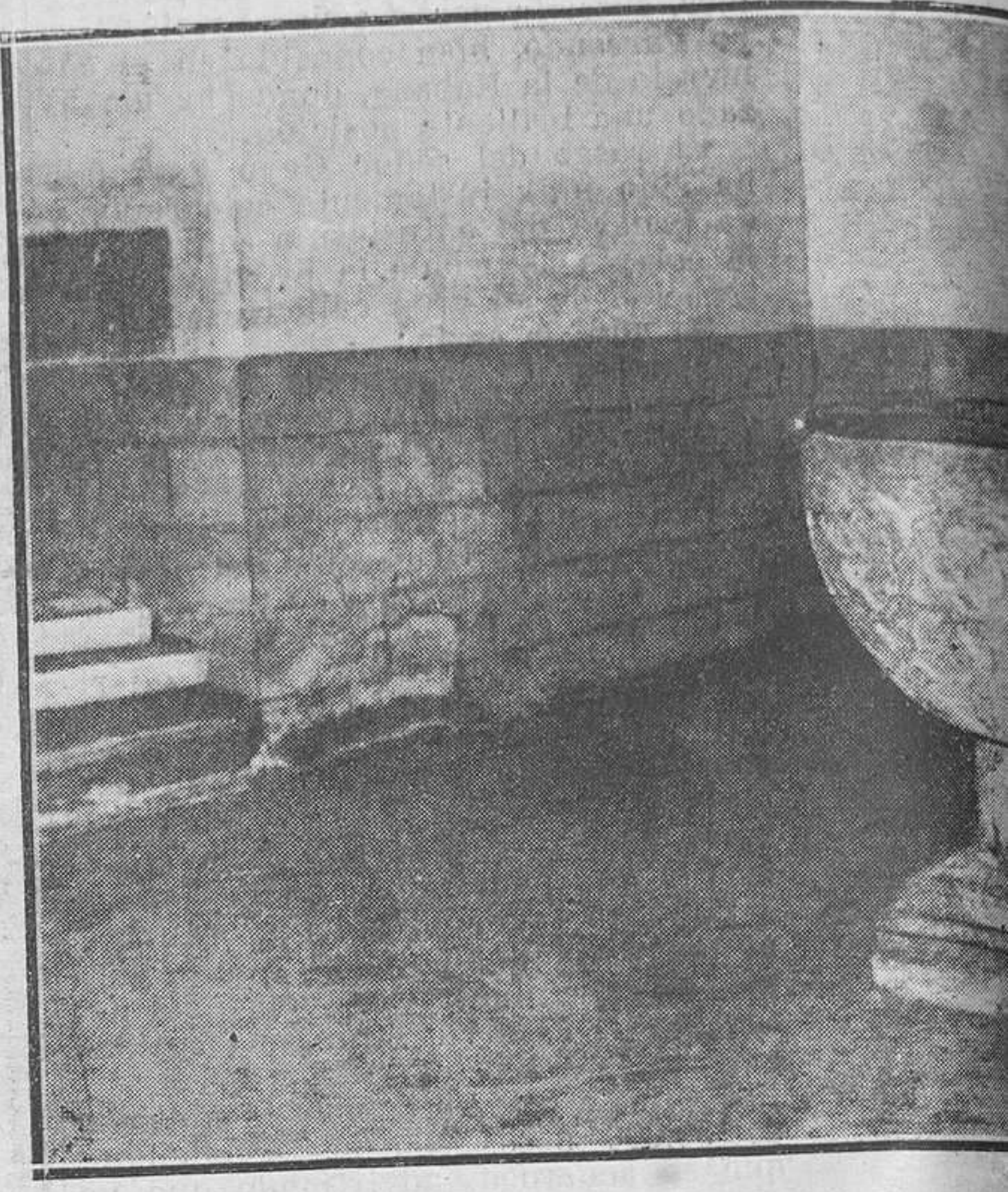
Pila donde fué bautizado Miguel de Cervantes Saavedra