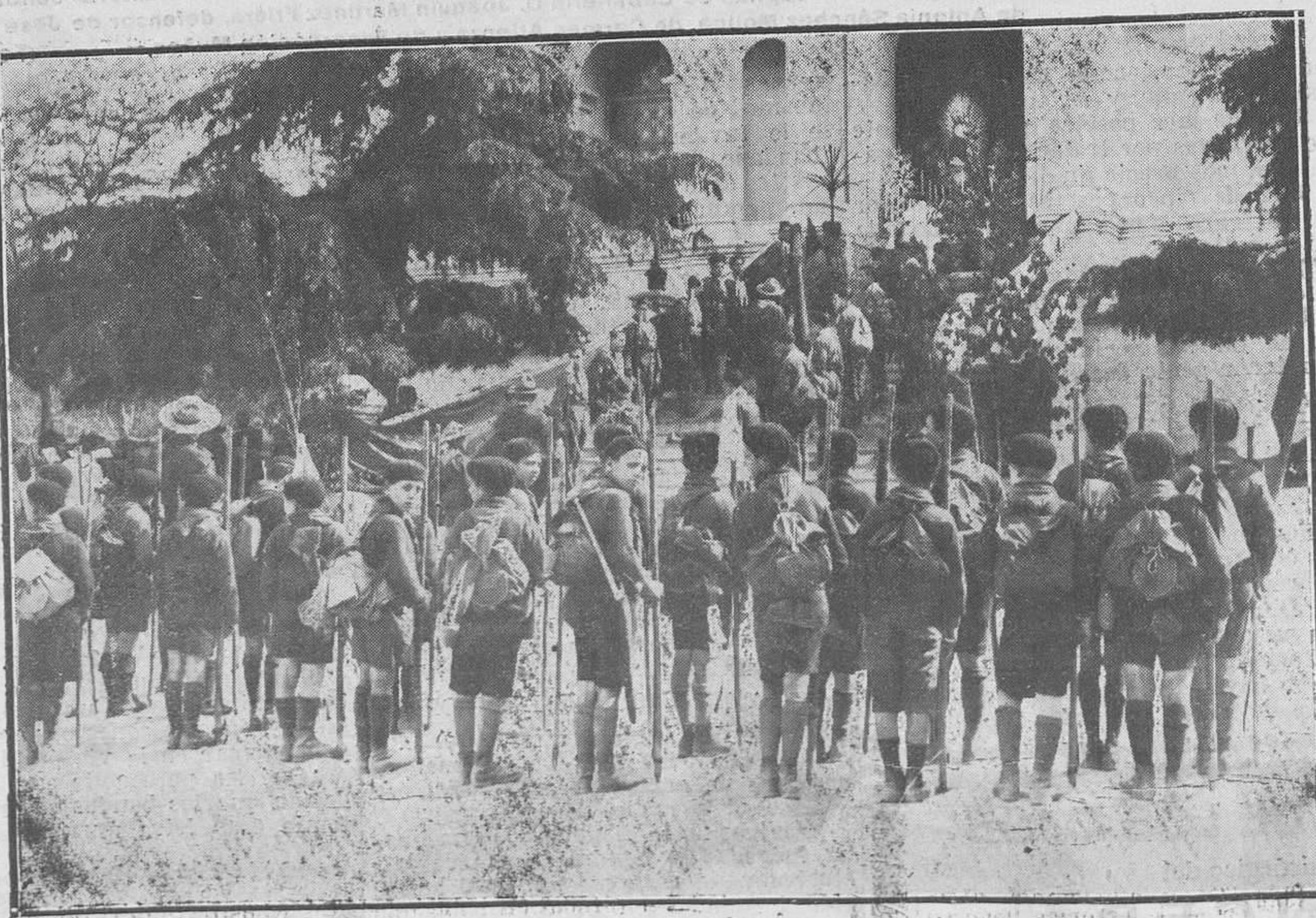
MADRID: FIESTA DE LOS EXPLORADORES.—Misa de campaña celebrada en el Asilo de María Cristina.