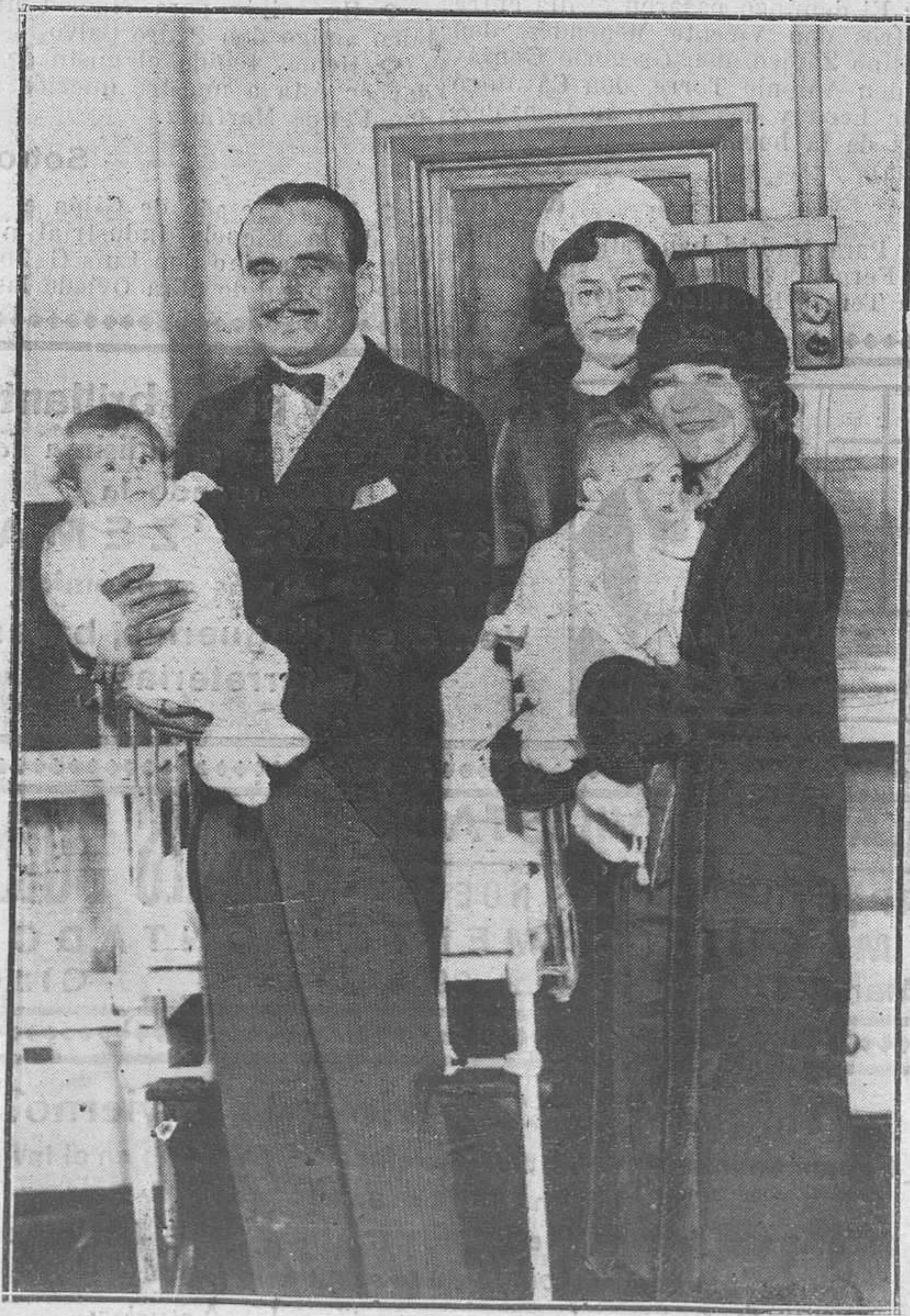
LONDRES.-Curiosa fotografía de Mary Pickford y Douglas Fairbanks, "ases" de la cinematografía, obtenida durante la visita que ambos han hecho al hospital para niños de Hammersmith.