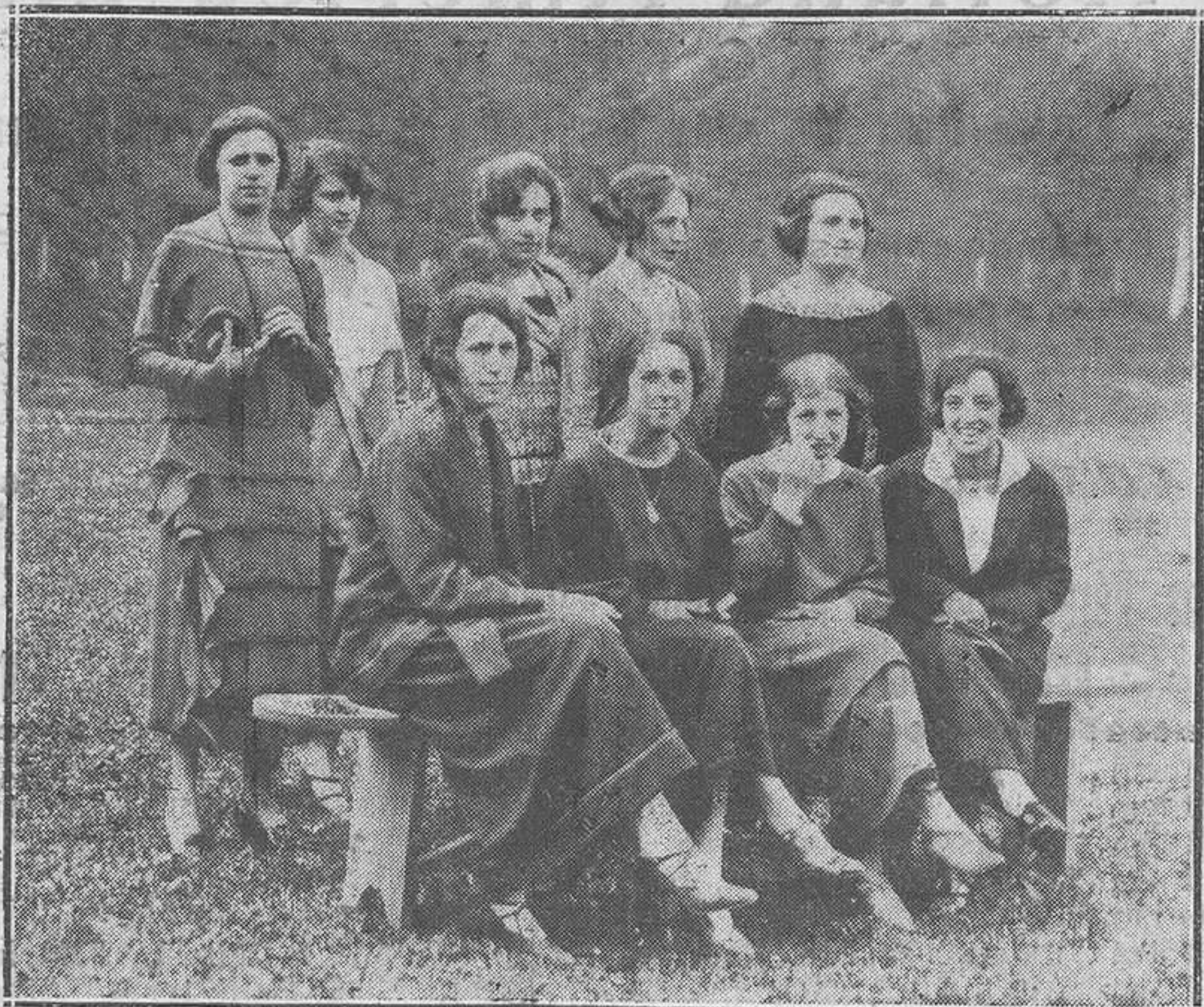
INFIESTO.--Bellísimas señoritas de la buena sociedad pilloñesa, que en unión de distinguidas damas forman la Comisión de festejos del Santuario de La Cueva.

Brillantísimas en extremo han resultado las fiestas celebradas el pasado domingo con motivo de la restauración