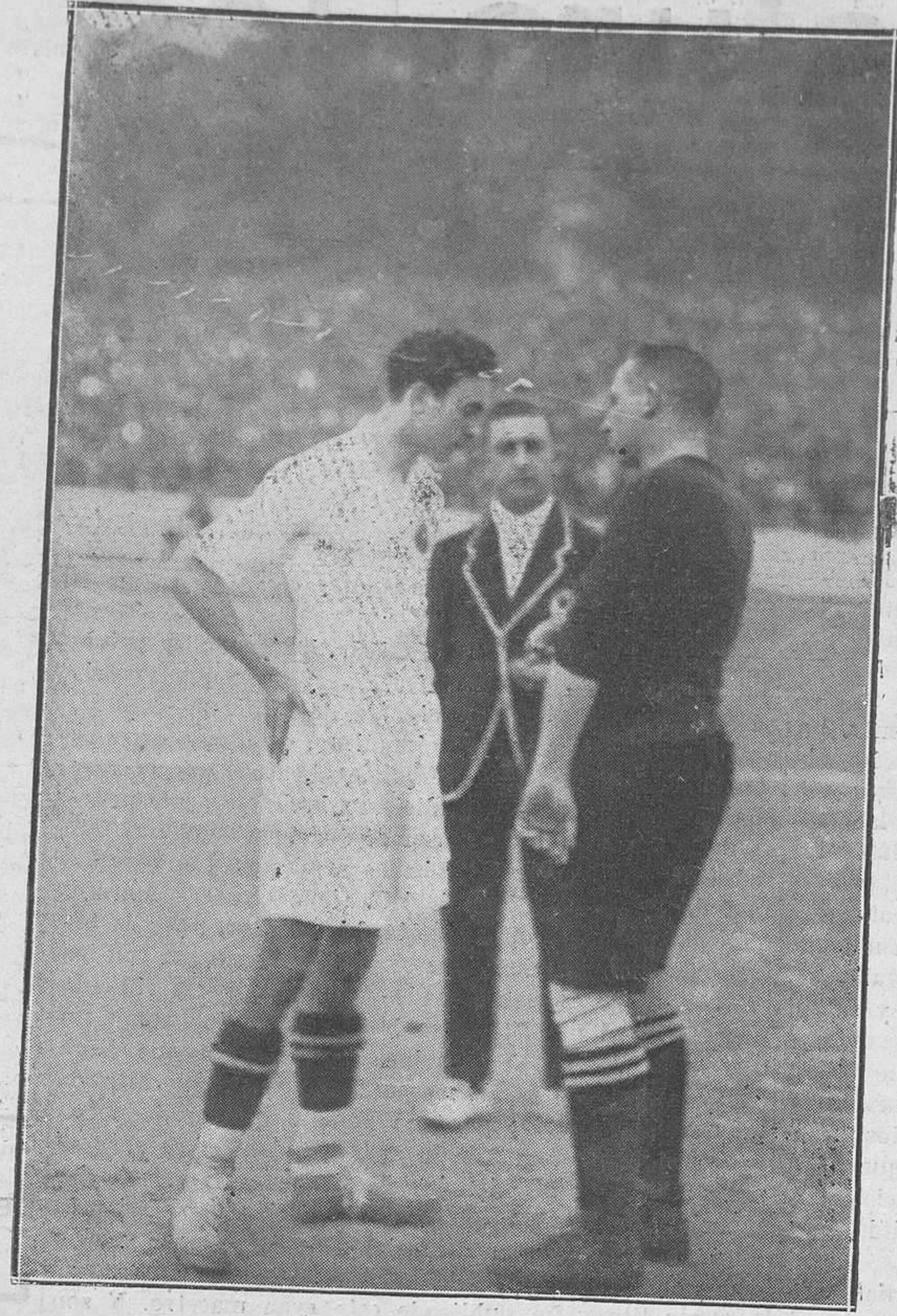
SAN SEBASTIÁN: PARTIDO FINAL DEL CAMPEONATO DE ESPAÑA.-Los capitanes de los Reales Irún y Madrid sorteando el campo.

Vacuna de Ternera Todos los días de diez a una. Instituto de Vacunación Rodríguez San Pedro.-Uría, 72, Oviedo.-Gratis a los pobres.