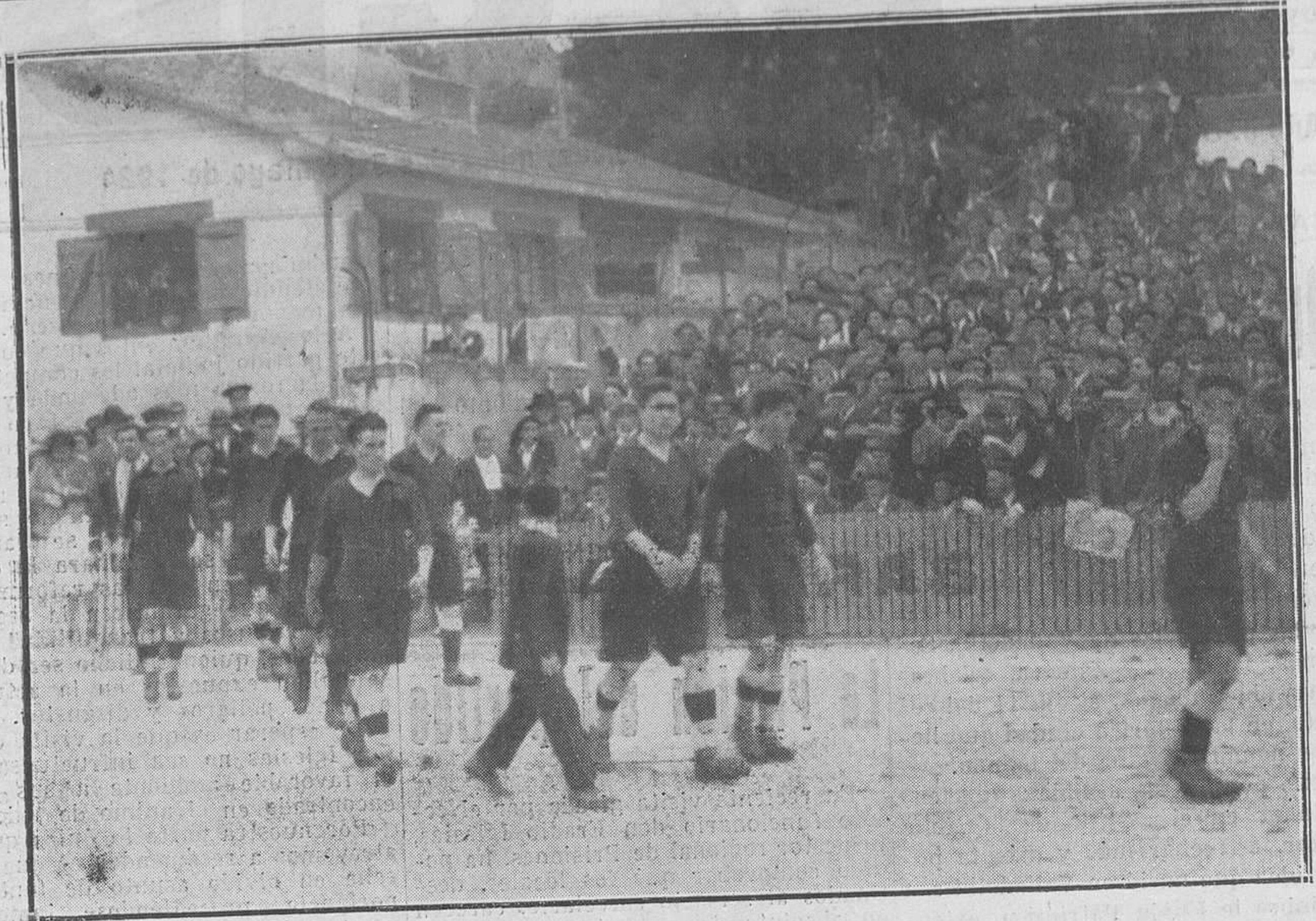
SAN SEBASTIÁN: PARTIDO FINAL DEL CAMPEONATO DE ESPAÑA.—El equipo del Real Irún al hacer su salida al campo.