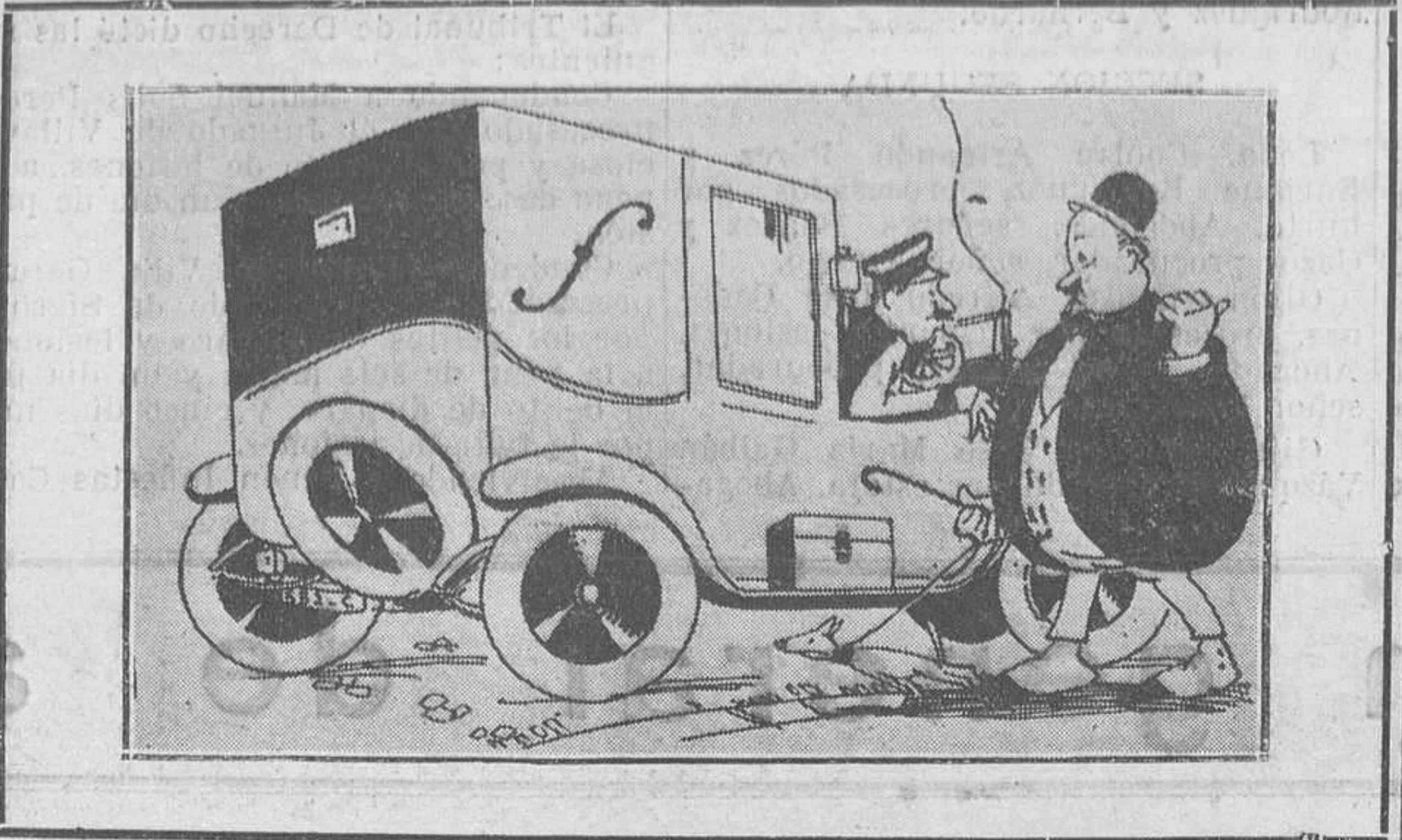
—¡Otro ciclista aplastado por un automóvil! —Ya te decía yo que el de la bicicleta era un deporte peligroso.