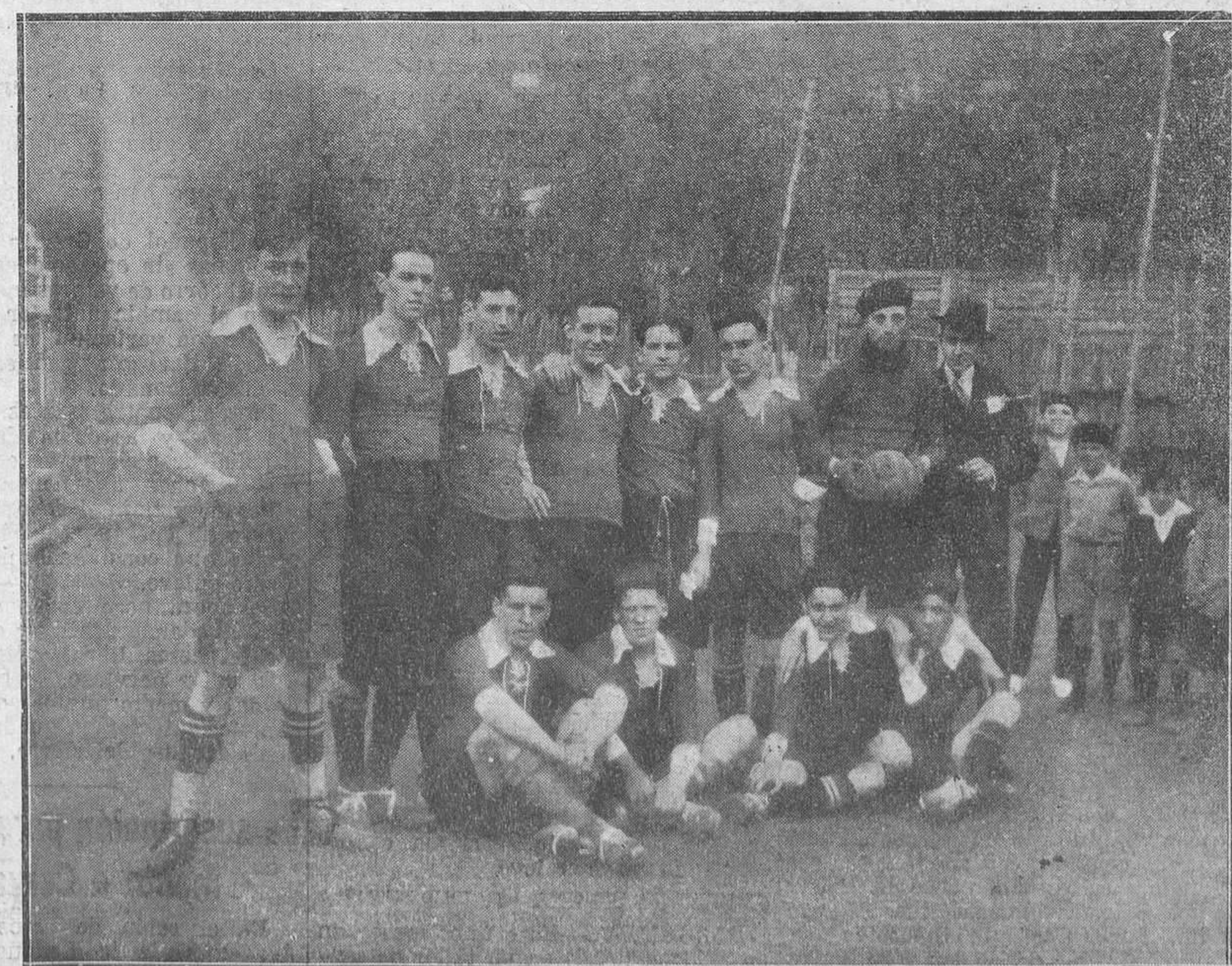
MIERES. El Club Spörting de Sobrelavega, que venció netamente al Victoria de Cortina, por 7-2.