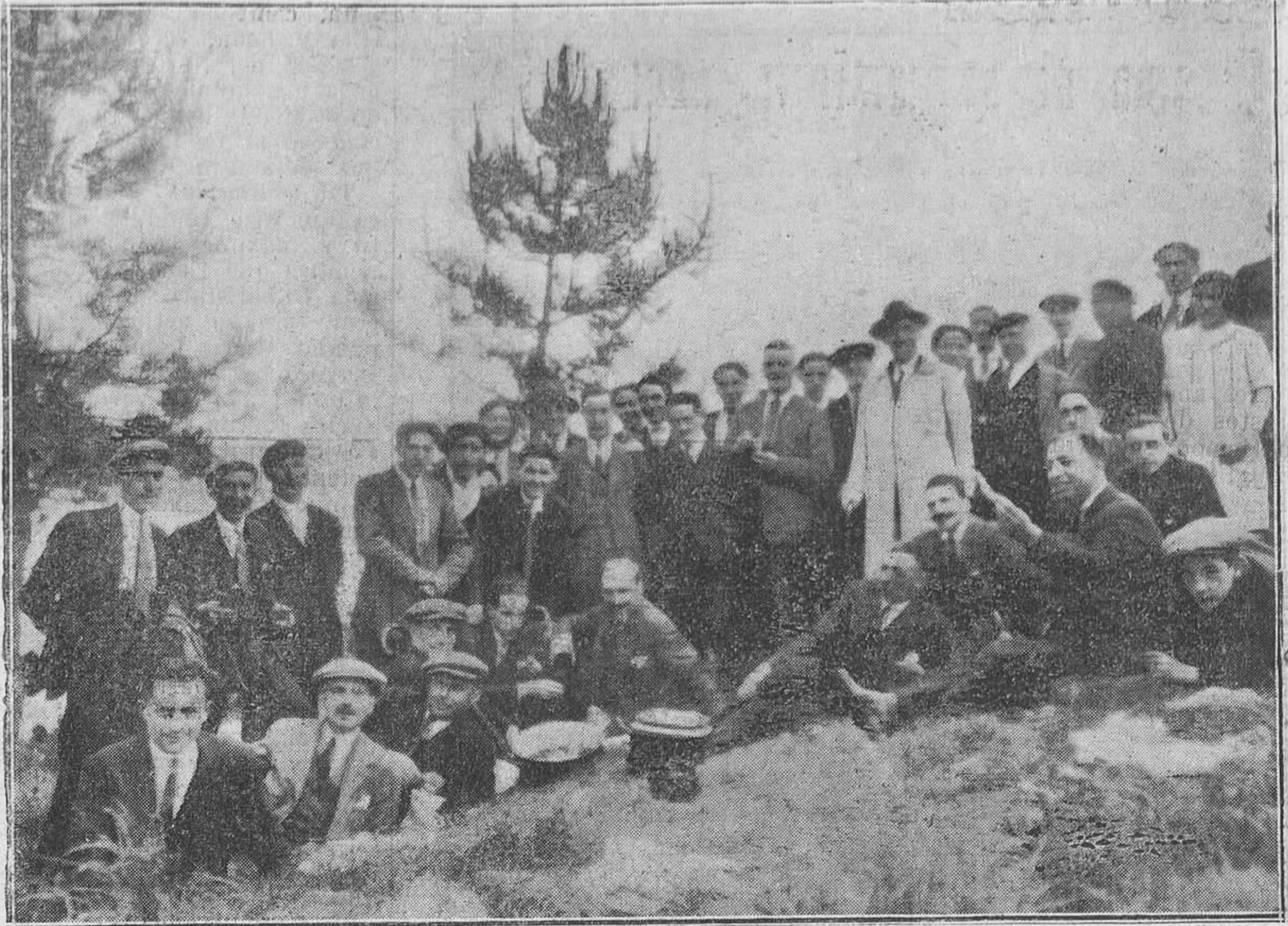
El Ovetense, en su excursión del pasado domingo.