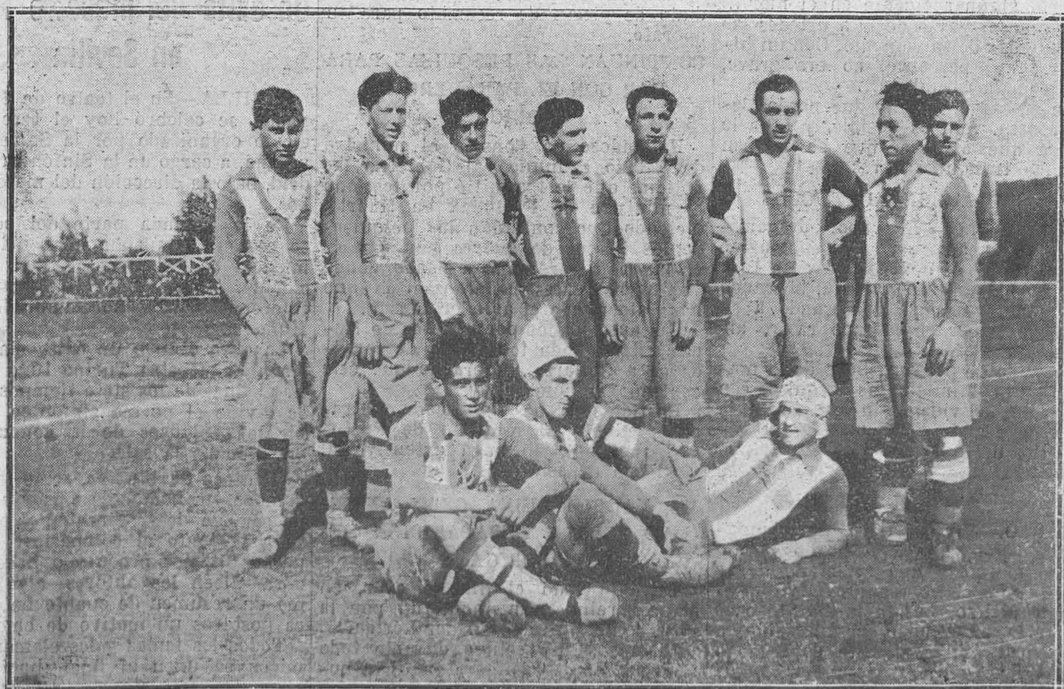
EQUIPO DEL REAL STADIUM AVILESINO. Uno de los más notables equipos asturianos.

Al mismo piadoso fin, a procurar la ida a Lourdes de los que dejan de ir por falta de recursos, pueden contribuir las personas piadosas enviando a la Junta los donativos que su generosidad les inspire. Un billete de tercera, como es sabido, cuesta sólo sesenta y dos pesetas.