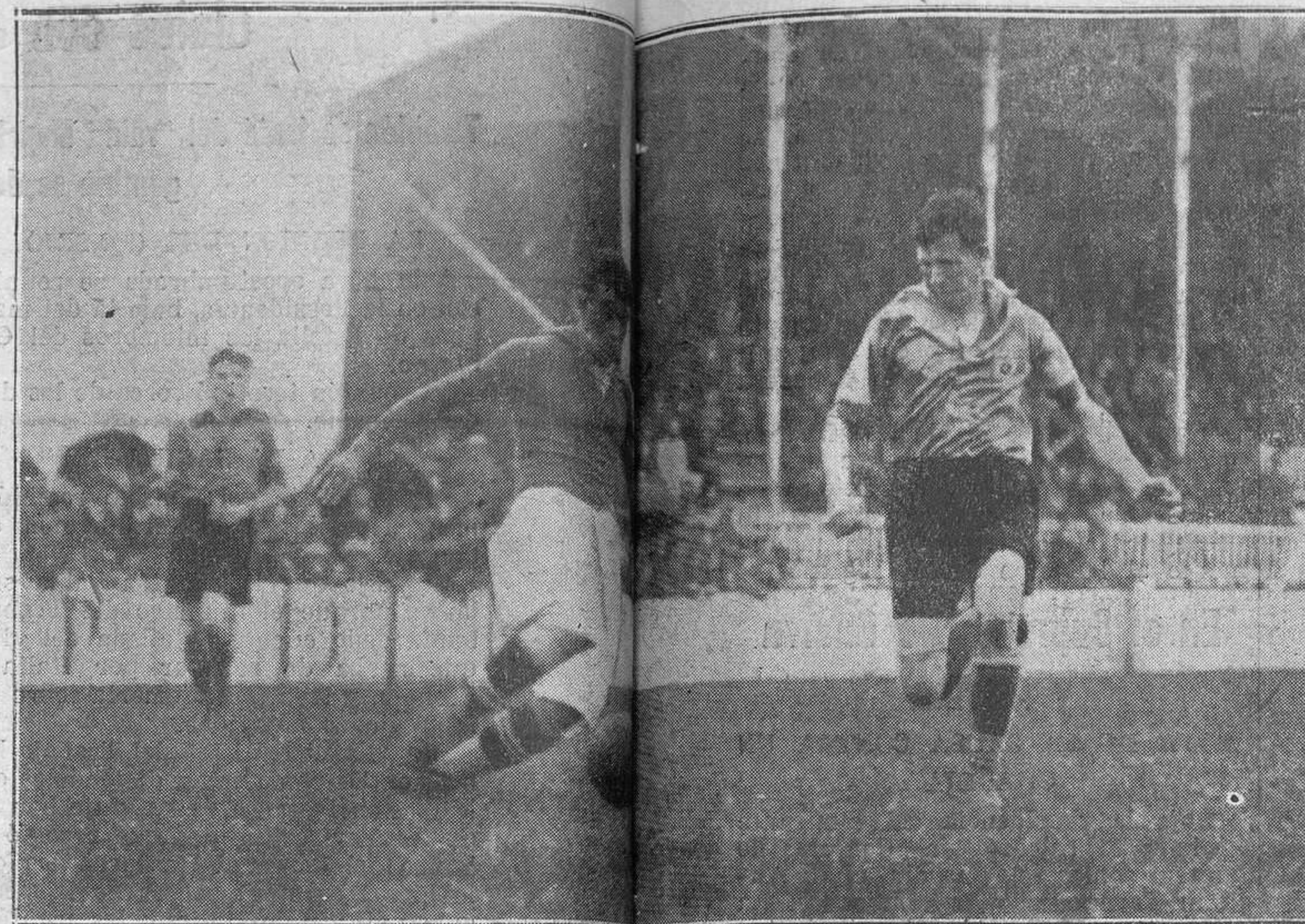
SANTANDER: CIMADEVILLA-PASANA momento interesante del encuentro.