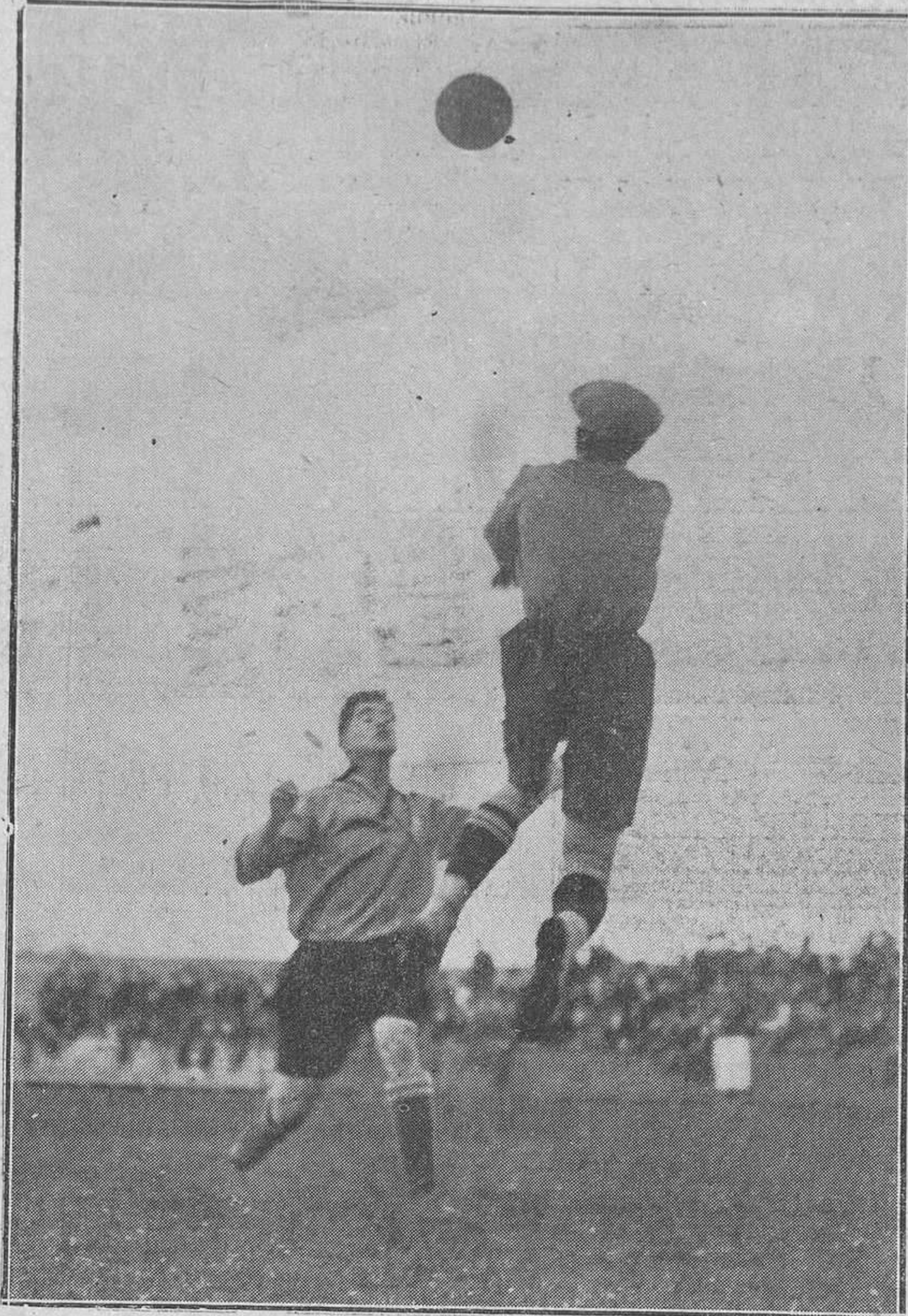
SANTANDER: CIMADEVILLA-PASAYAKO.-El portero del Cimadevilla despejando por alto muy bien.