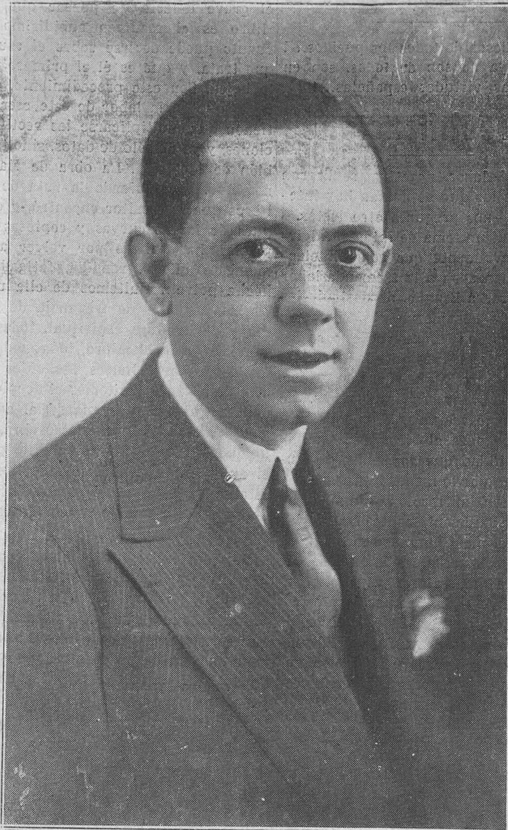
El notable artista Valeriano León, que al frente de su Compañía debuta mañana en el Cam-poamor.

Deseamos a la feliz pareja un hogar venturoso y enviamos nuestra sincera enhorabuena a sus familias, tan estimadas en esta capital.