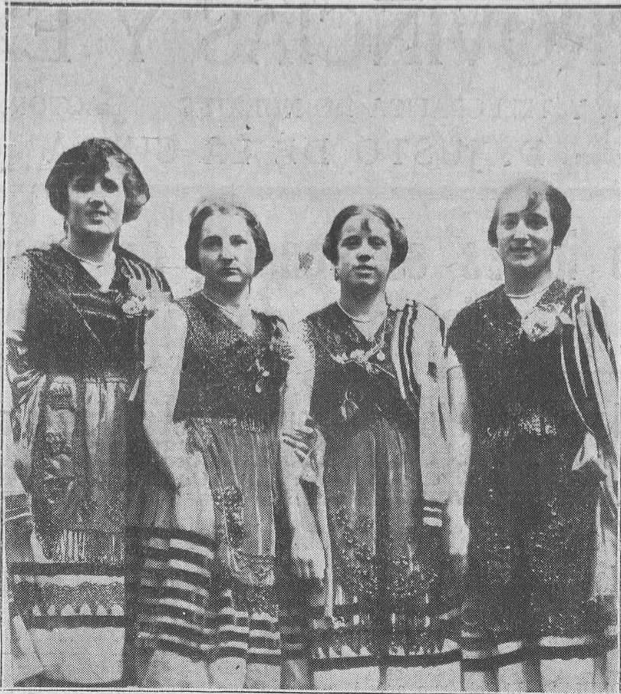
Bellísimas llaniscas con el traje típico de marañegas.

Fuó el partido llevado a gran tren, como en el día anterior, y La Cultural Leonesa tuvo una actuación