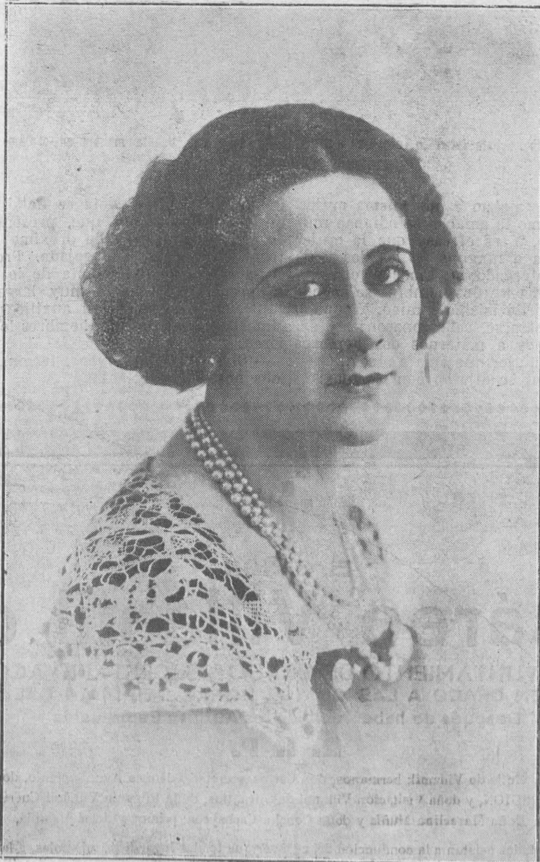
La encantadora y finísima actriz Aurora Redondo, de la Compañía que debuta mañana en el Campoamor.