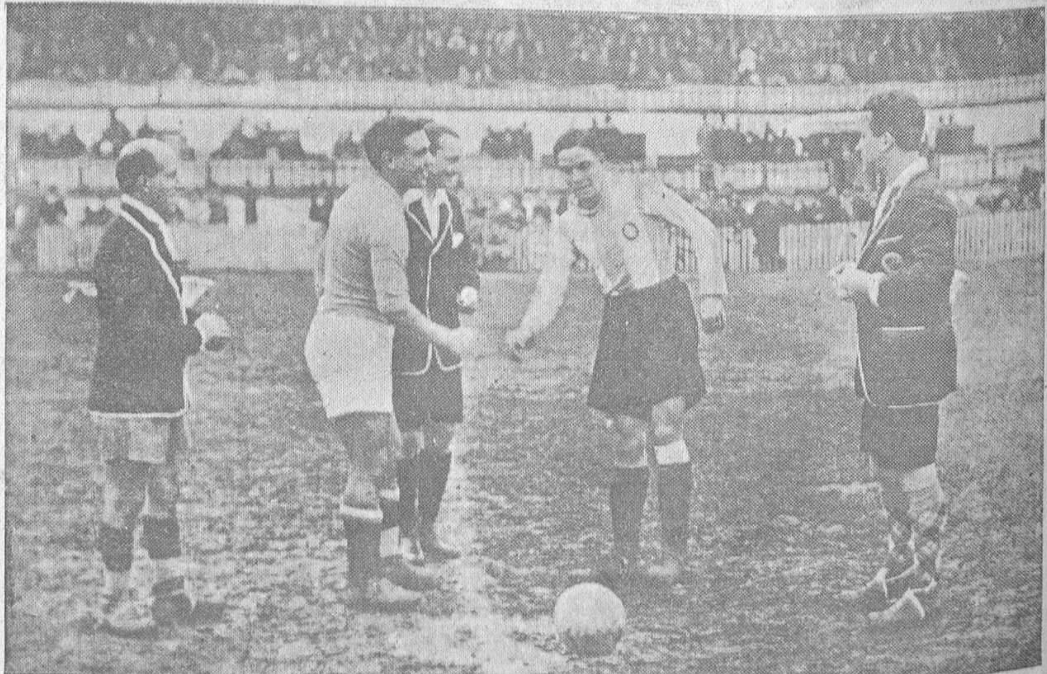
DEL ENCUENTRO ESPAÑOL-OVIEDO.-Arbitro y capitanes se saludan antes de sortear los campos

Acaso mañana quede señalada la fecha, que ha de ser en la semana entrante.