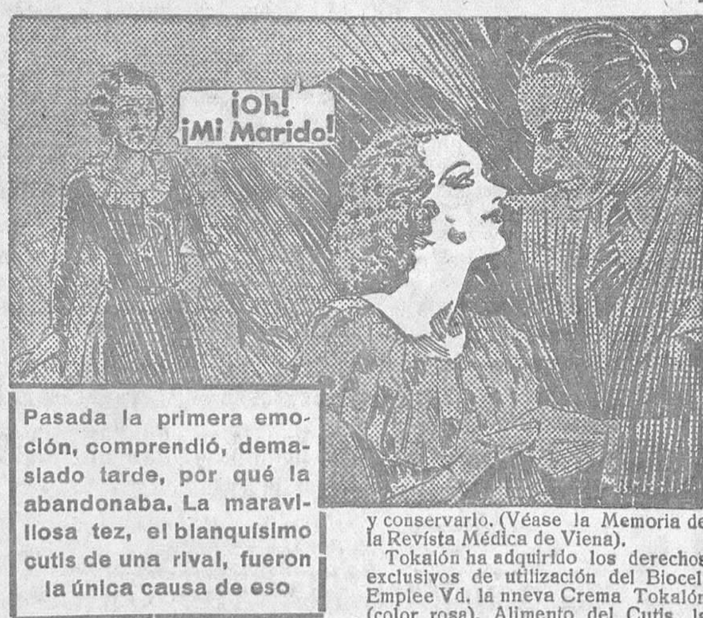
Pasada la primera emoción, comprendió, demasiado tarde, por qué la abandonaba. La maravillosa tez, el blanquísimo cutis de una rival, fueron la única causa de eso

Es un procedimiento verdaderamente milagroso de rejuvenecimiento que el célebre Profesor Dr. Stejskal, de la Facultad de Medicina de Viena, ha puesto al alcance de todas las mujeres con su reciente descubrimiento de Biocel. Ha demostrado que «la Piel puede comer», y, nutriendola con ese poderoso alimento de los tejidos, el Biocel, que ha obtenido de animales muy jóvenes, ese sabio médico ha permitido a rostros de 50 a 75 años quitarse arrugas profundas, tenderse de nuevo, fortalecerse; adquirir, en resumen, un aspecto nuevo de juventud