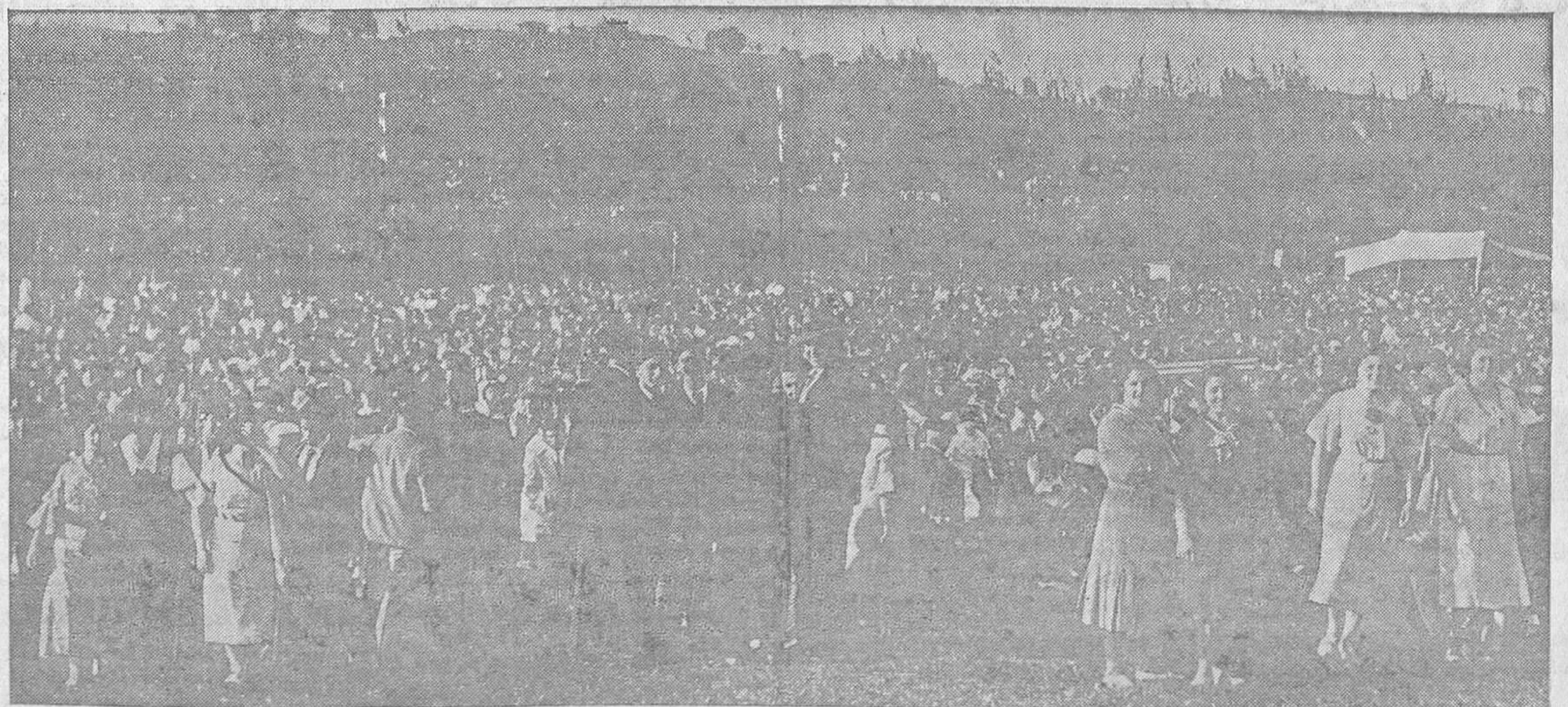
LA ROMERIA DEL CARMIN Y POLA DE SIERO.—He aquí una nota gráfica de la fiesta del lunes, que es el mejor documento de cuál fué la extraordinaria animación en la que sigue siendo la primer fiesta popular de Asturias. Y es que los

Habiendo sido hecho efectivo el libramiento para satisfacer las actuaciones del Cursillo de perfeccionamiento de los maestros nacionales, verificados en Mayo último, se ruega a los perceptores pasen a cobrar a la Escuela Normal, ya personalmente o autorizando a sus Habilitados para hacerlo en su nombre dentro de los 20 días a partir del 15 del actual.