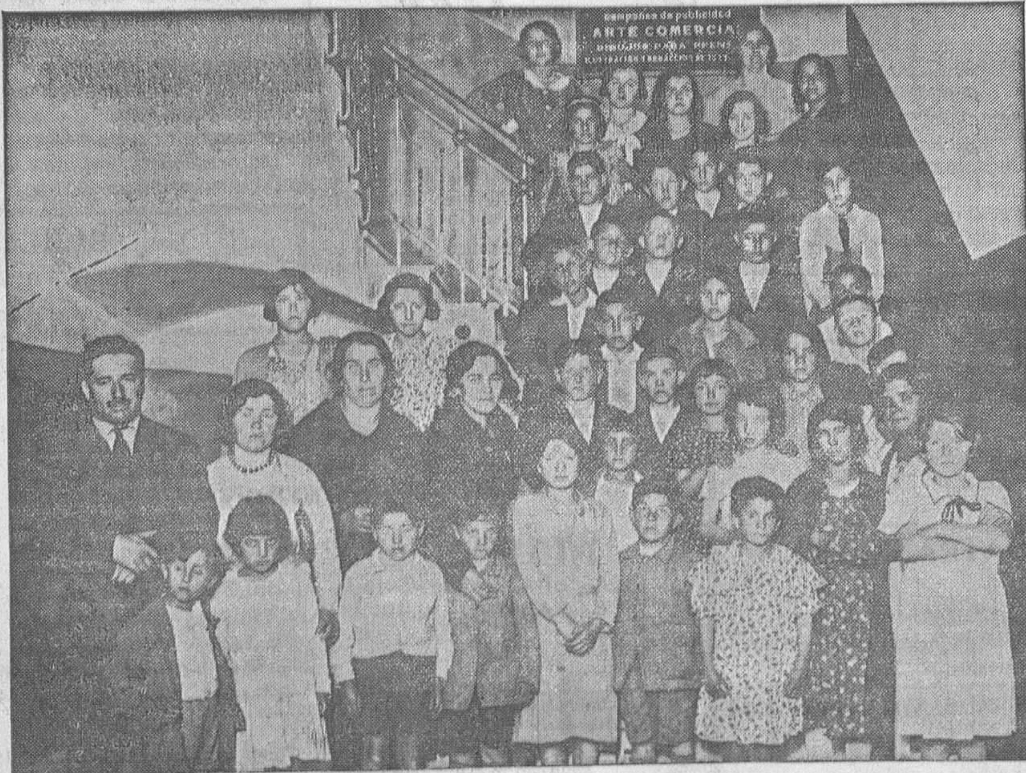
EXCURSIONES ESCOLARES.—Los alumnos de la escuela de Villanueva de Teverga que con su maestro y algunos vecinos visitaron recientemente nuestros talleres.

Para mañana domingo se anuncian tres funciones: infantil, a las 4,30; y a las 7,30 y 10,30, con importantes debuts.