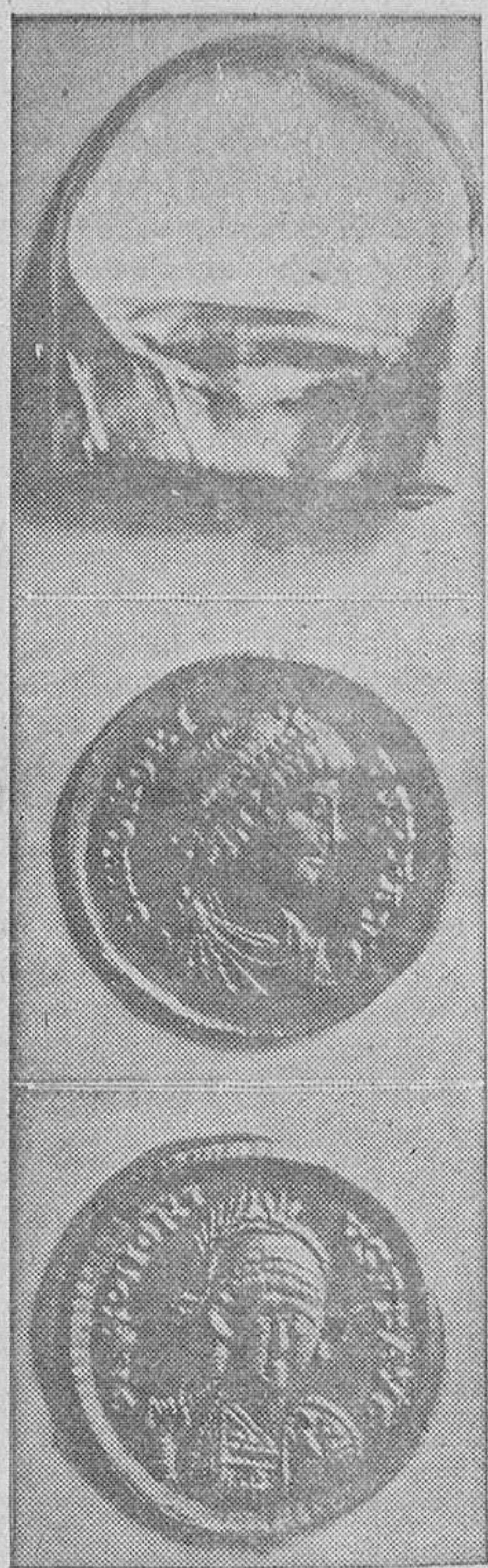
Un anillo y dos de las monedas de oro encontradas en la cueva de Coalla, que han sido adquiridas por la Comisión de Monumentos.

No fué Asturias la primera provincia española que sufrió su presencia, aunque sí la soportó más tarde; pero supo de ellos porque aquí se refugiaban los huidos de otras regiones y, quien sabe, si esta circunstancia dió lugar a que alguien hubieran querido poner a salvo de los invasores su tesoro. El hallazgo de algunas monedas sueltas en distintas cuevas de Asturias, da lugar a la leyenda de los tesoros, a que tan aficionados son nuestros paisanos y a que, cada vez que aparece algo, sean legión los que provistos de picos y palas, buscan el vellocino de oro de la narración bíblica. Por desgracia, no se apaleaba el oro en ningún tiempo, para que se encuentre a montones escondido en las entrañas de la tierra. El señor Fernández Prida se ofreció a ir a Coalla y a hablar con los paisanos, para que digan a quién han vendido las monedas o que las entreguen, si aún las conservan. Con satisfacción damos esta noticia, más aún por haber sido un redactor de LA VOZ DE ASTURIAS quien contribuyó al rescate inmediato de dos de las monedas históricas y del anillo no menos interesante.