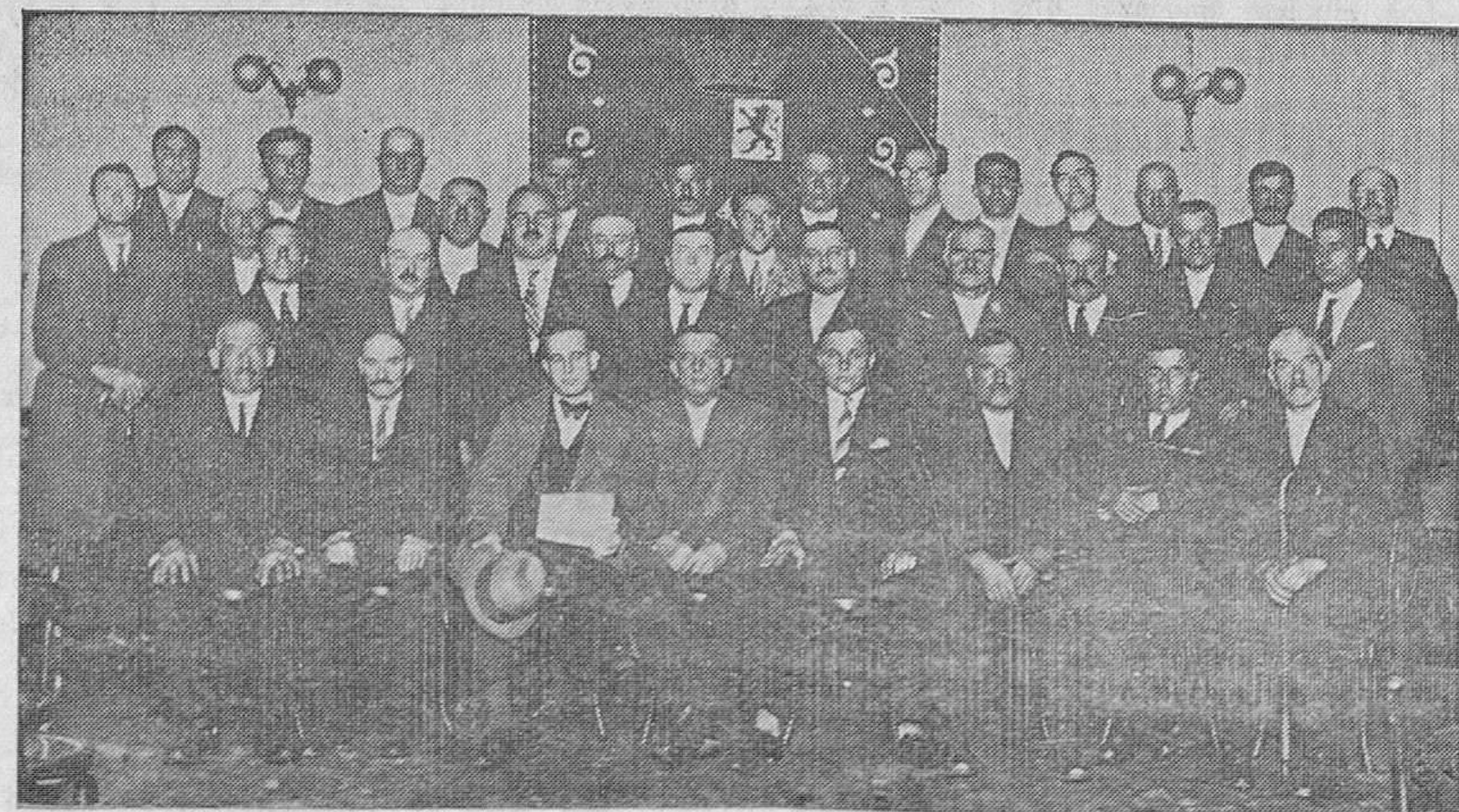
EN LA CAMARA DE COMERCIO.—Los concurrentes a la asamblea de fabricantes de sidra que se celebró ayer para unir su protesta a la de otros industriales y entidades, ante la amenaza que supone para la riqueza asturiana, que es el cultivo de la manzana, la anunciada desgravación de los vinos.

Asimismo se les advierte que la inscripción para dicho viaje se halla abierta en la Secretaría de esta Agrupación hasta el viernes, día 21 del actual, inclusive, hasta las diez de la noche. El precio por asiento será de cinco pesetas aproximadamente.—El Comité.