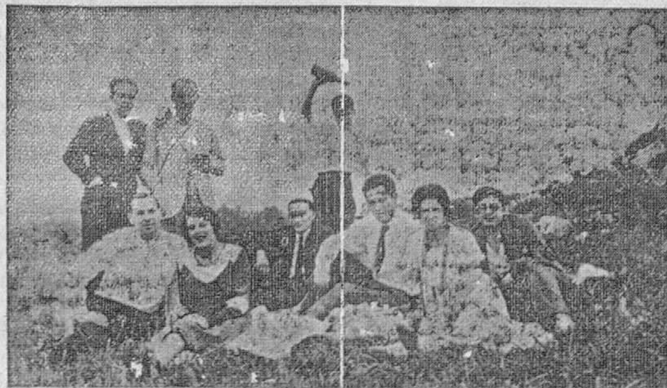
DE LA EXCURSION DEL ORFEON A CELORIO. He aquí recogido en esta "foto" una de los incontables grupos que a la hora del yantar se repartieron por la cardosa montaña, desde la cual se observa maravilloso paisaje.

Para matricularse es condición indispensable la presentación de la papeleta de examen de la última asignatura aprobada.