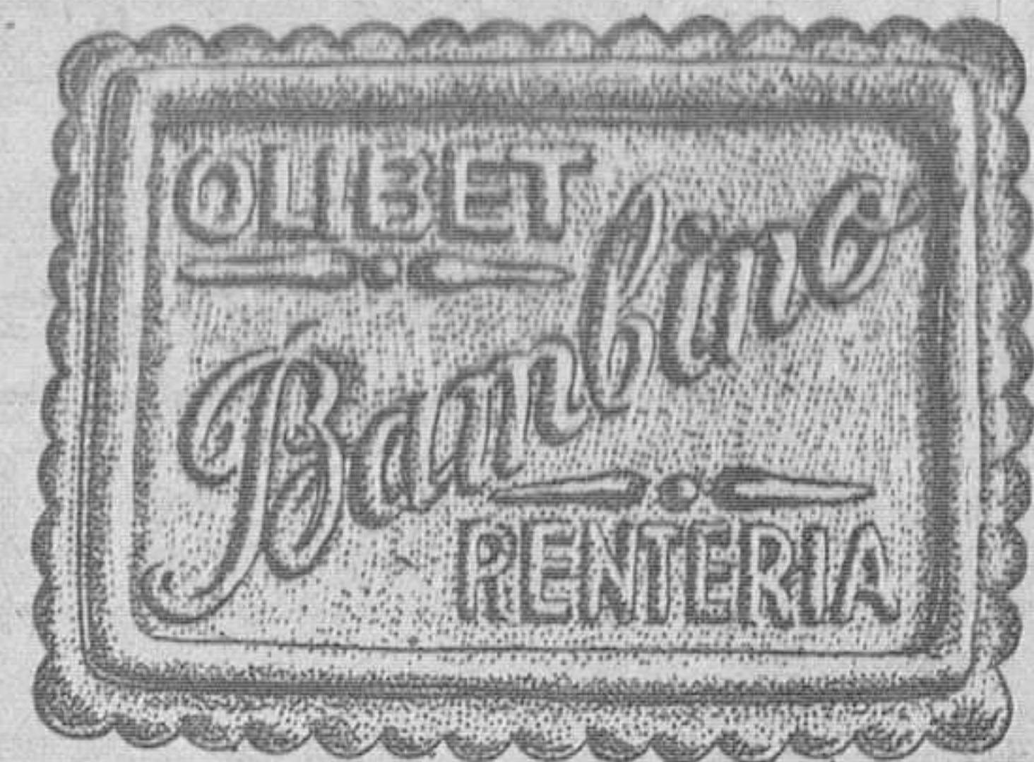
Deliciosa para los niños