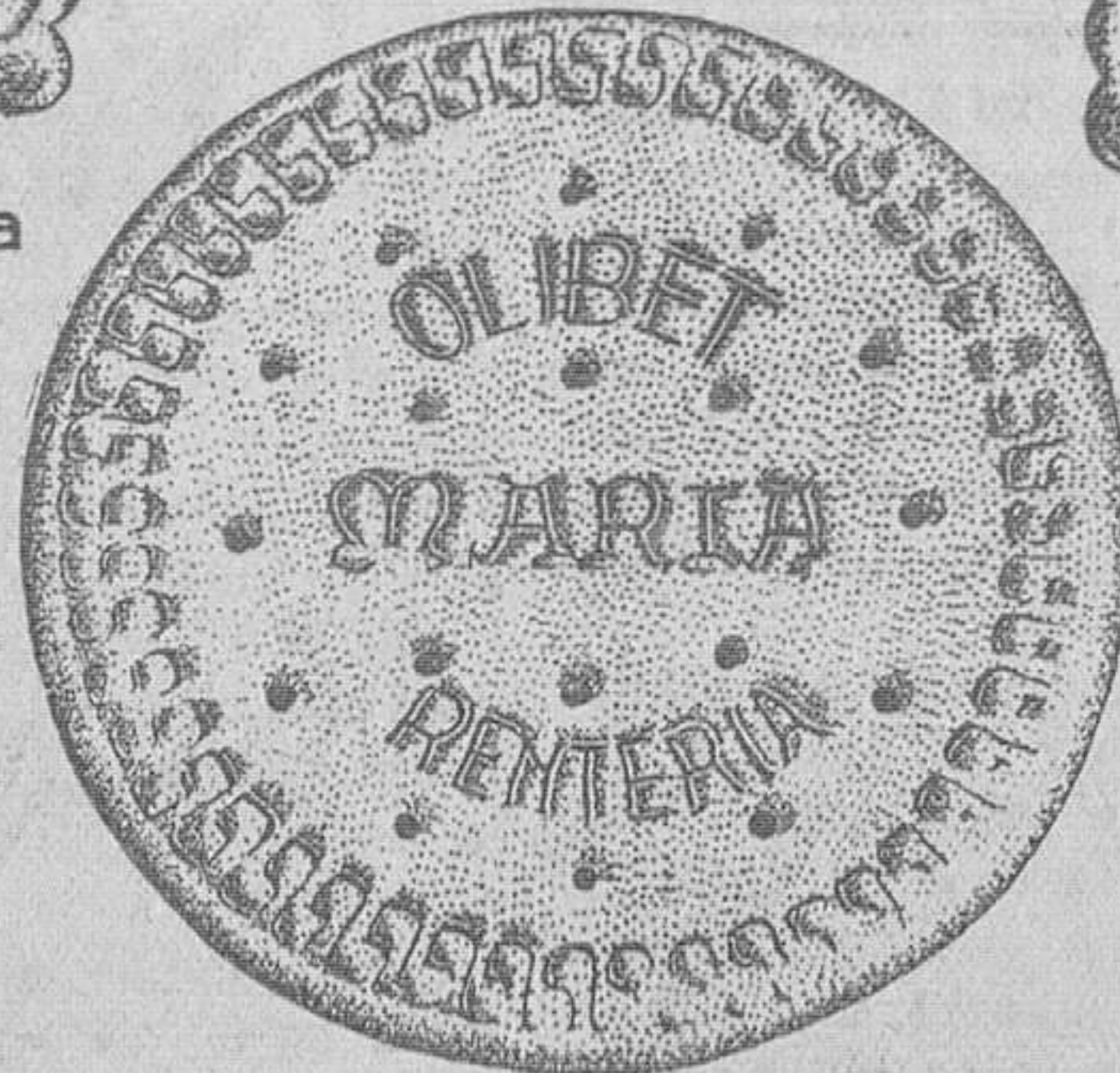
María sin rival