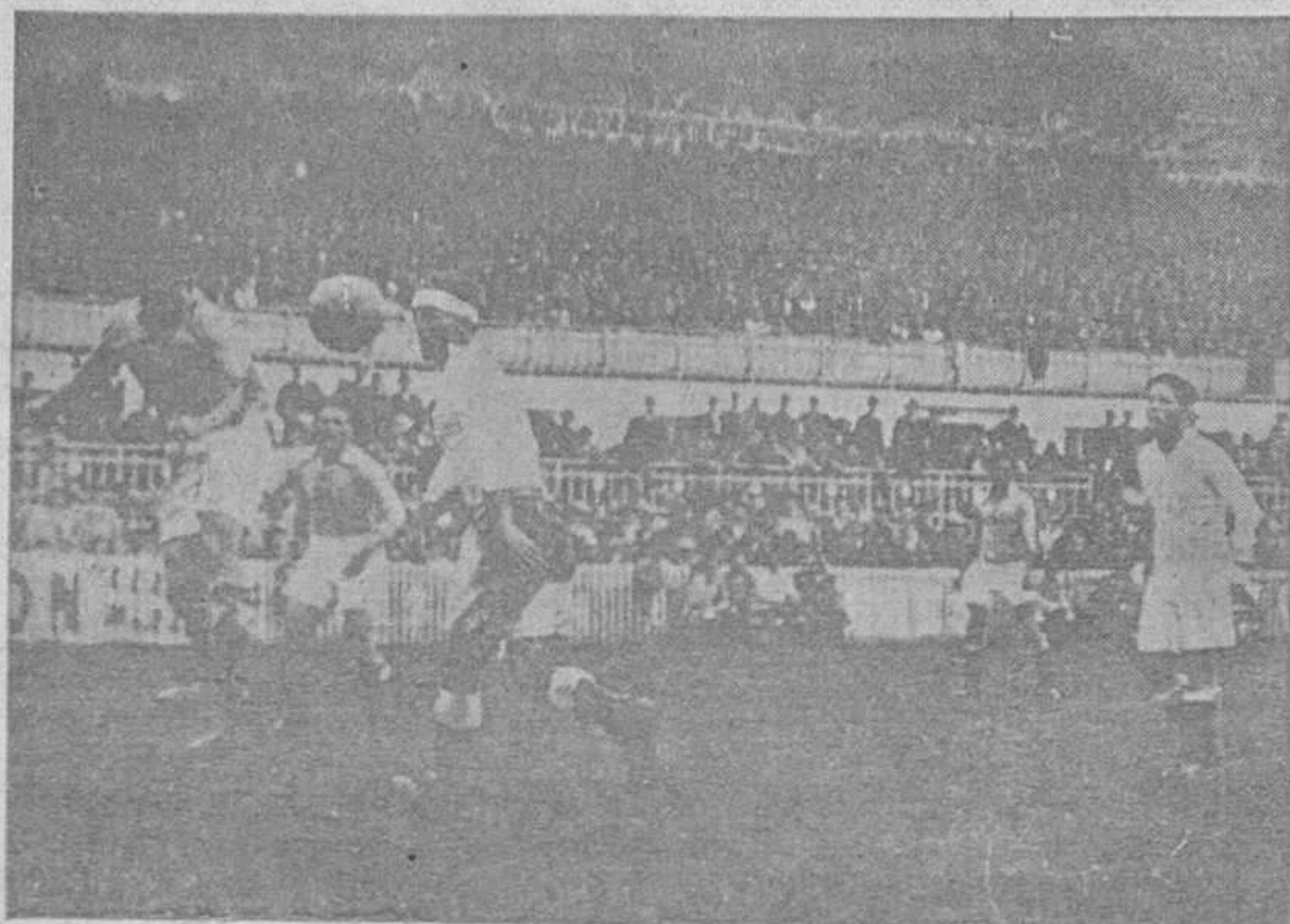
PARTIDO MADRID-OVIEDO.—Un momento interesante del gran partido celebrado el domingo, organizado por la Asociación de la Prensa Diaria Ovetense

Fué despedida por los orfeonistas gijoneses.