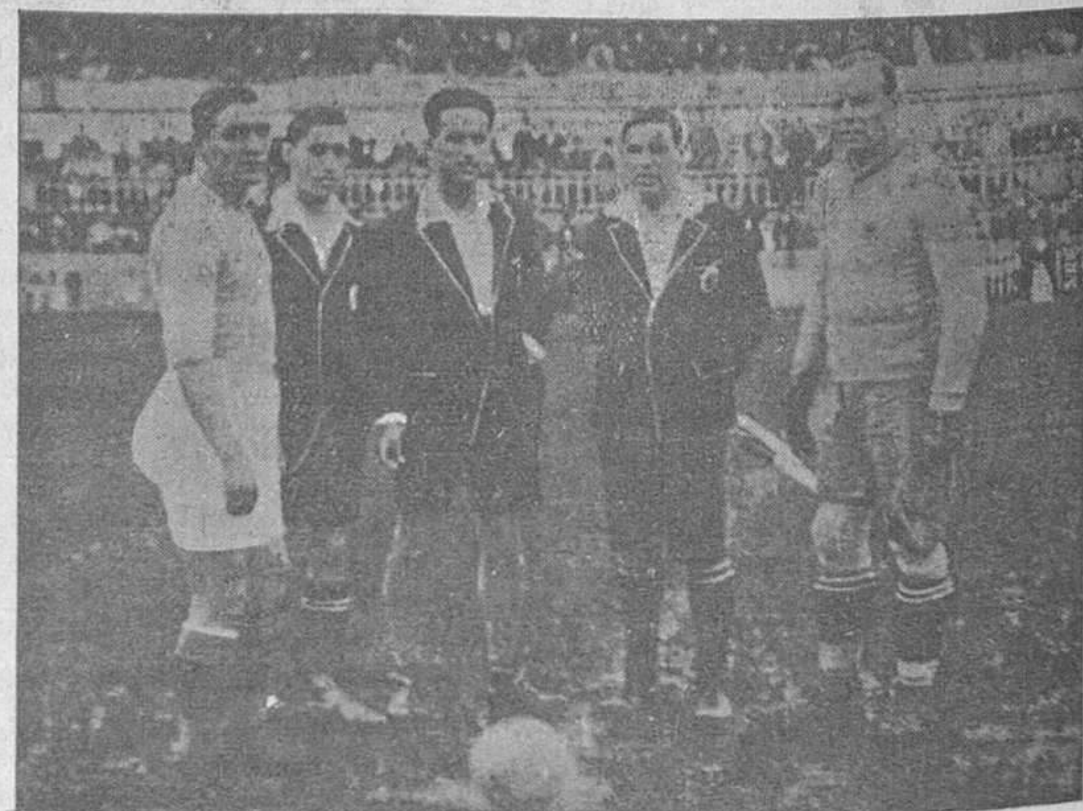
PARTIDO MADRID-OVIEDO.—Los capitanes de los equipos con el árbitro y jueces de línea