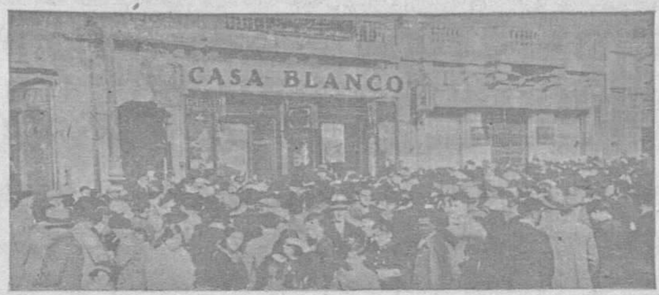
PARTIDO BETIS-OVIEDO.-Esta fotografía da una pequeña idea de la inmensa muchedumbre de aficionados que gozaban o sufrirían ante la CASA BLANCO...