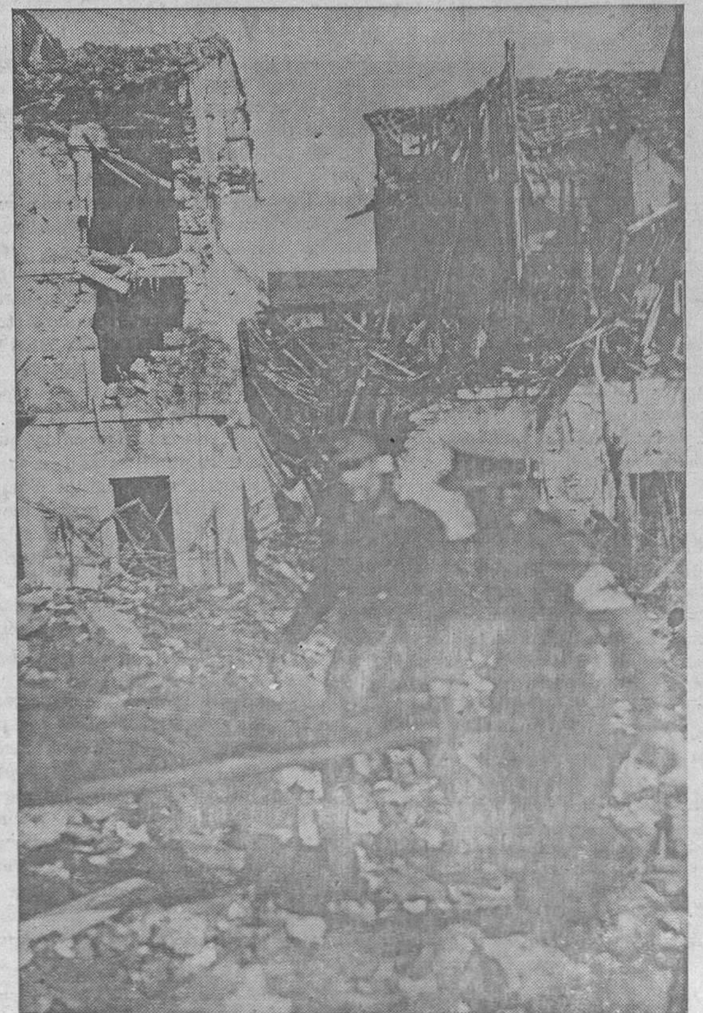
Otra muestra de la tragedia que supusieron los sucesos desarrollados en Oviedo es el constante transporte de víctimas por los camilleros de la Cruz Roja, cerca de las ruinas que ahora son muchas casas