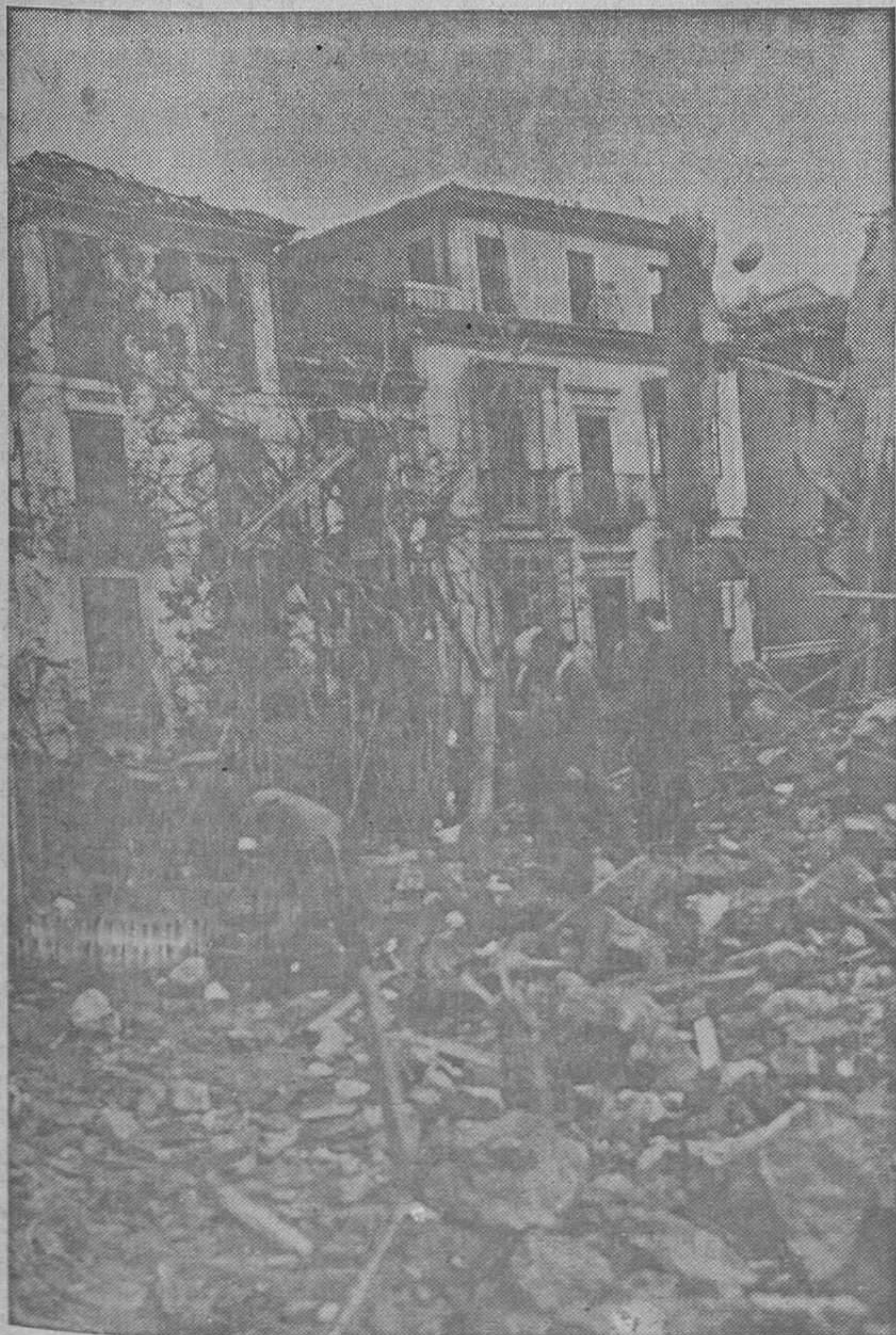
En la finca donde estaba instalado el Instituto adquirieron los sucesos una gravedad extraordinaria y así se desarrollaron escenas como ésta en que la benemérita Cruz Roja se dedica a recoger cadáveres

El ministro de Justicia, señor Aizpún, conferenció con el señor Gil Robles, marchando después a la Presidencia, donde dijo a los periodistas que el Gobierno espera los informes del Supremo respecto a algunos casos y que tardaría dos o tres días en emitir los referidos informes.