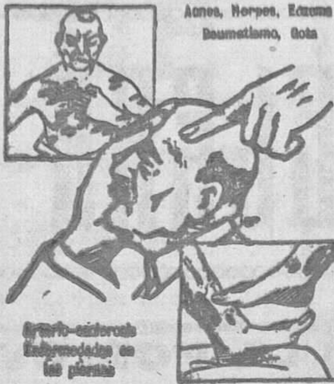
Acnes, Herpes, Eczema, Dermatitis, Gota

LOECHES AGUA NATURAL PURGANTE DEPURATIVA SALES NATURALES LAXANTES-ANTISEPTICAS BALNEARIO PIEL-HIGADO-APARATO DIGESTIVO Y ESPECIALES DE LA MUJER