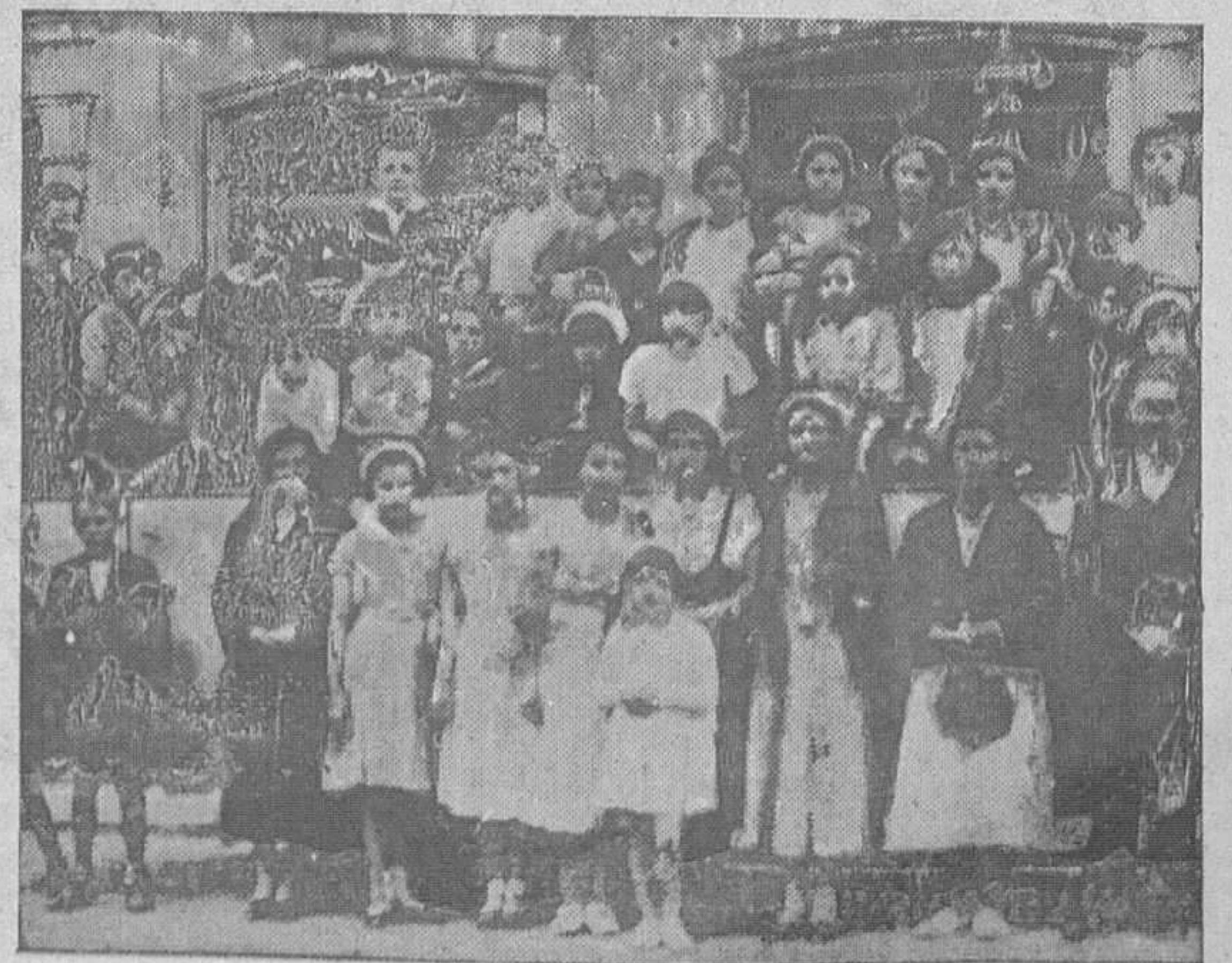
EXCURSION ESCOLAR.—Los niños y niñas de las escuelas de Belmonte que después de un viaje de estudio y recreo por Asturias visitaron nuestros talleres