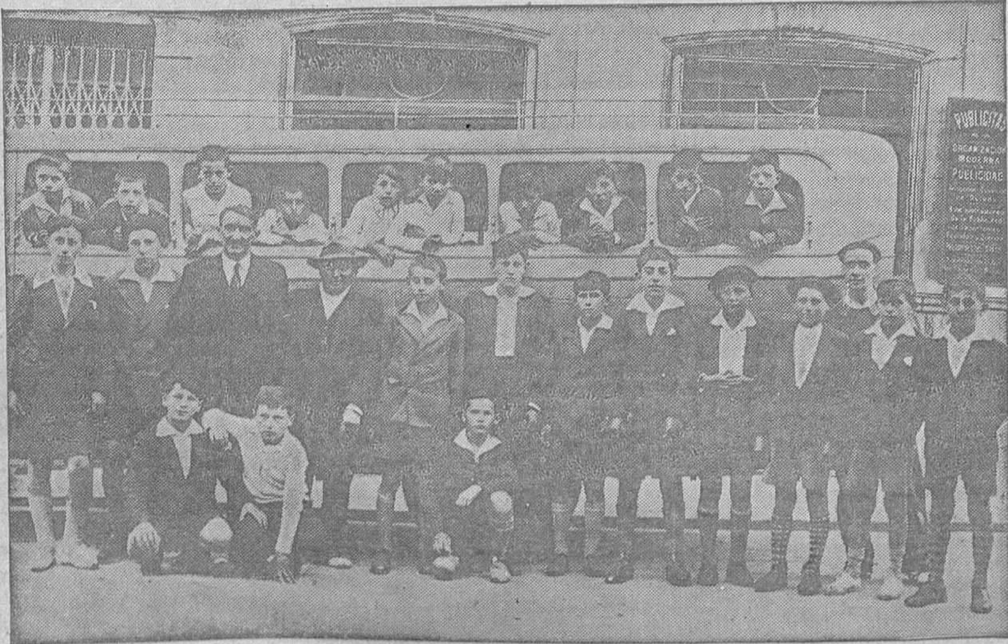
VISITAS ESCOLARES.—Los niños de la escuela de Granda que con su profesor realizaron una excursión y en su visita a Oviedo quisieron ver cómo se confecciona nuestro periódico