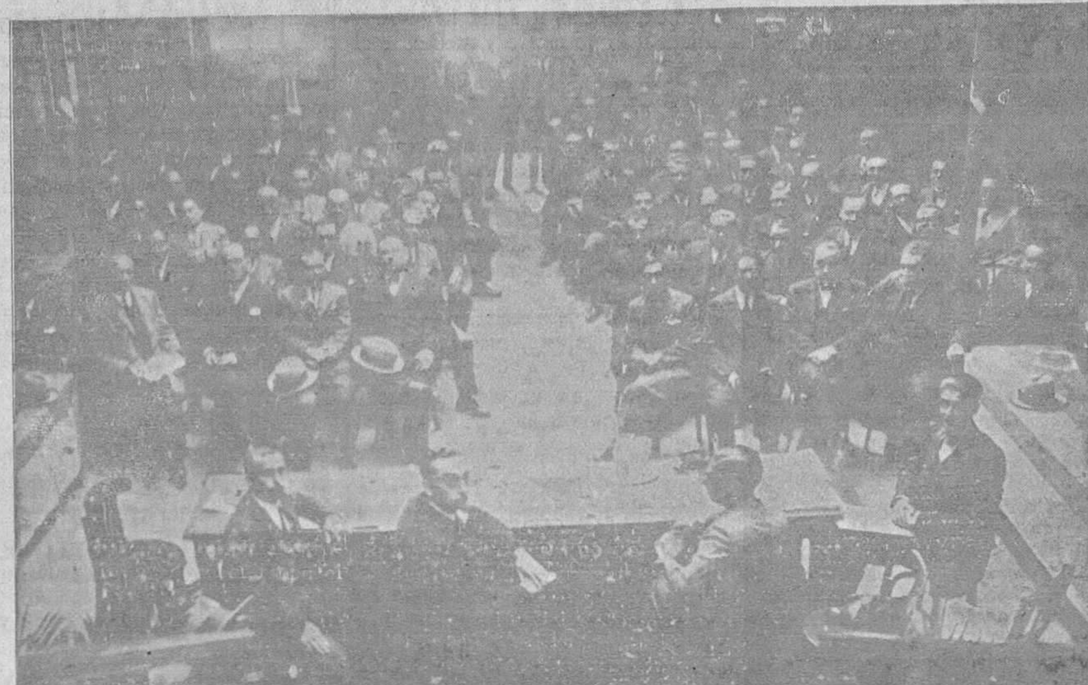
CONGRESO DEL PARTIDO RADICAL SOCIALISTA.—Los concurrentes a la sesión inaugural de este Congreso, celebrada ayer sábado en los locales de la Coral Vetusta