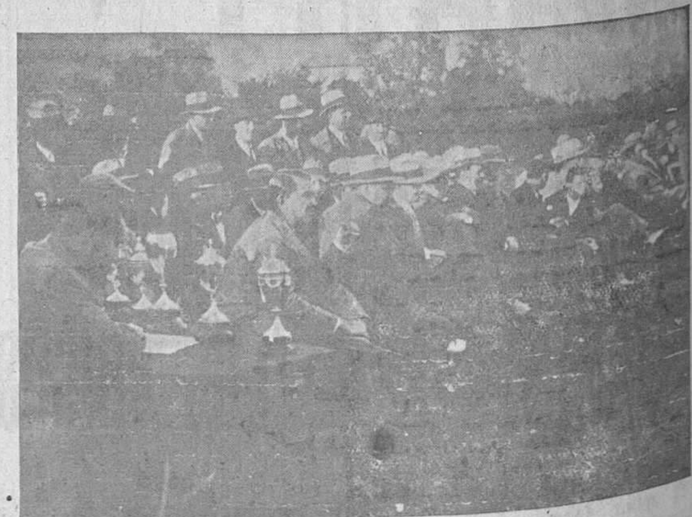
Un grupo de distinguidos aficionados al deporte del Tiro de Pichón presenciando las tiradas ayer celebradas en Buenavista