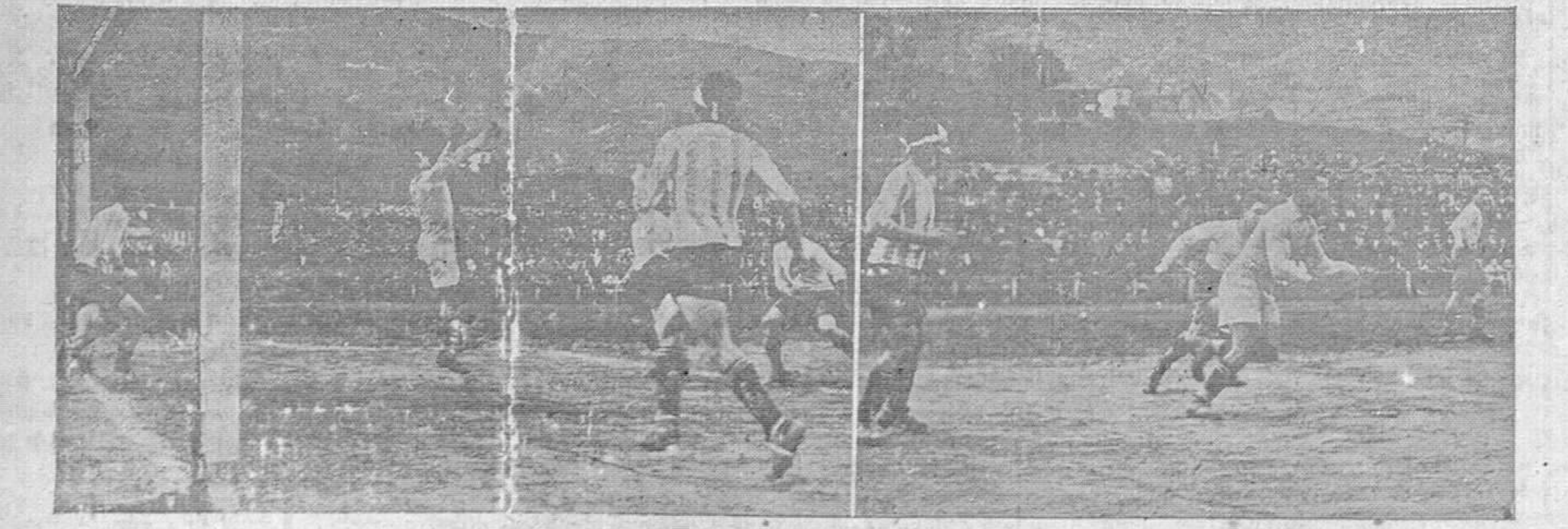
Dos intervenciones afortunadas de Isidro en el encuentro Real Oviedo-Deportivo de La Coruña