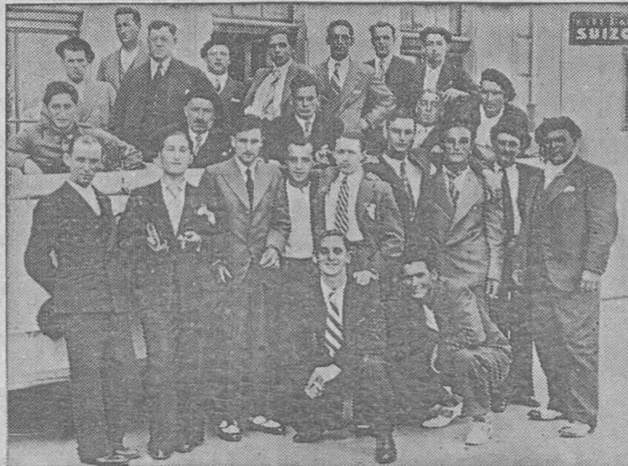
La Sociedad de Santa Marina de Piedramuelle que realizó una excursión a las provincias gallegas. Aparecen en la foto sorprendidos a su llegada a La Coruña

AUSTIN Luaces y Canabal-Martínez Marina, 5. T. 3582 OVIEDO