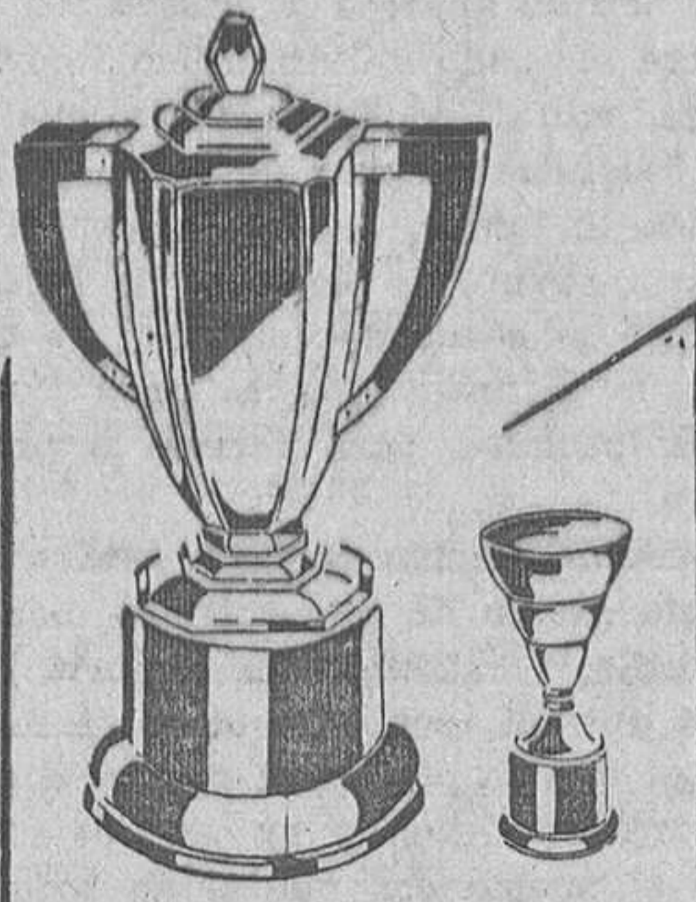
COPAS DE SPORT PLATA DE LEY JOYERIA PEDRO ALVAREZ OVIEDO TELFONO 2950

No sólo no hay noticias de que el Alcalde anterior haya suspendido una moción aprobada por sorpresa, sobre la asociación religiosa en los entierros, sino que, por el contrario, hecha la propuesta por el señor Martín, propuso la Alcaldía, y así aprobó la Corporación, que pasara a informe de la ponencia que formaban los síndicos, el secretario y el abogado consistorial, así como el asunto sobre secularización de cementerios.