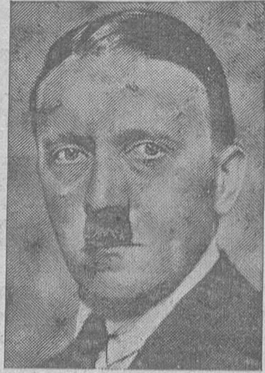
Hitler, Canciller de Alemania erigido en Presidente