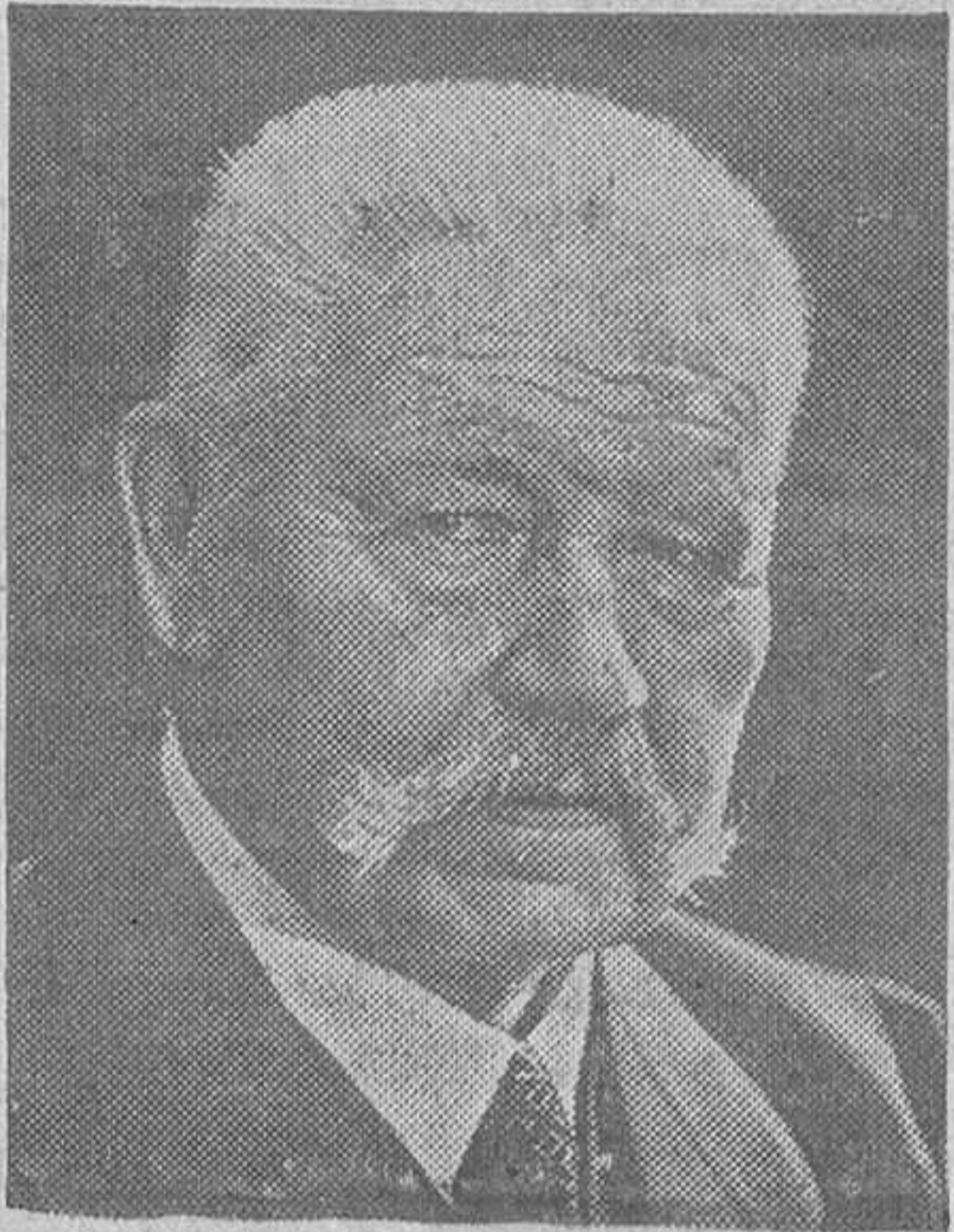
Hindenburg, el Presidente de Alemania fallecido

núa, viviendo en nuestros corazones como símbolo de la gloriosa historia alemana, como vencedor de Tannenberg, como Mariscal de campo en la guerra mundial, como padre de un gran pueblo. Los combatientes pro libertad alemana bajan sus banderas en señal de duelo y de profundo respeto y gratitud a Hindenburg que llamó al "führer" al Poder dando así comienzo a la nueva historia de Alemania.