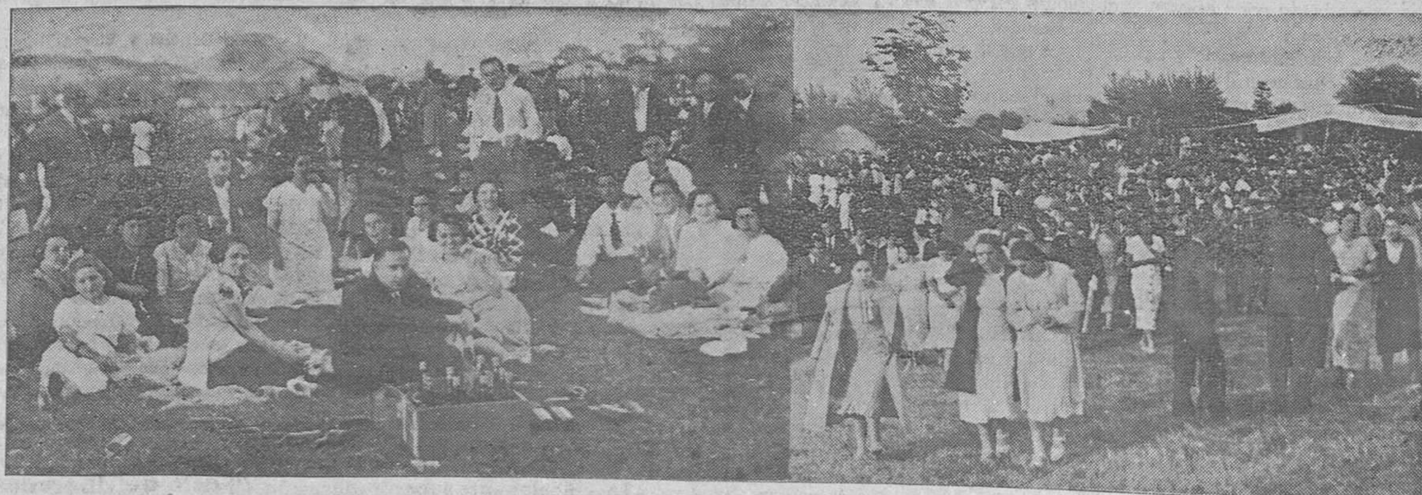
DEL CARMIN DE LA POLA.—Dos aspectos de la popular romería, celebrada ayer con el éxito de siempre

El portero se hallaba cogiendo saltamontes para alimento de animales domésticos, y fué alcanzado por la hélice del aparato, que le mutiló horriblemente.