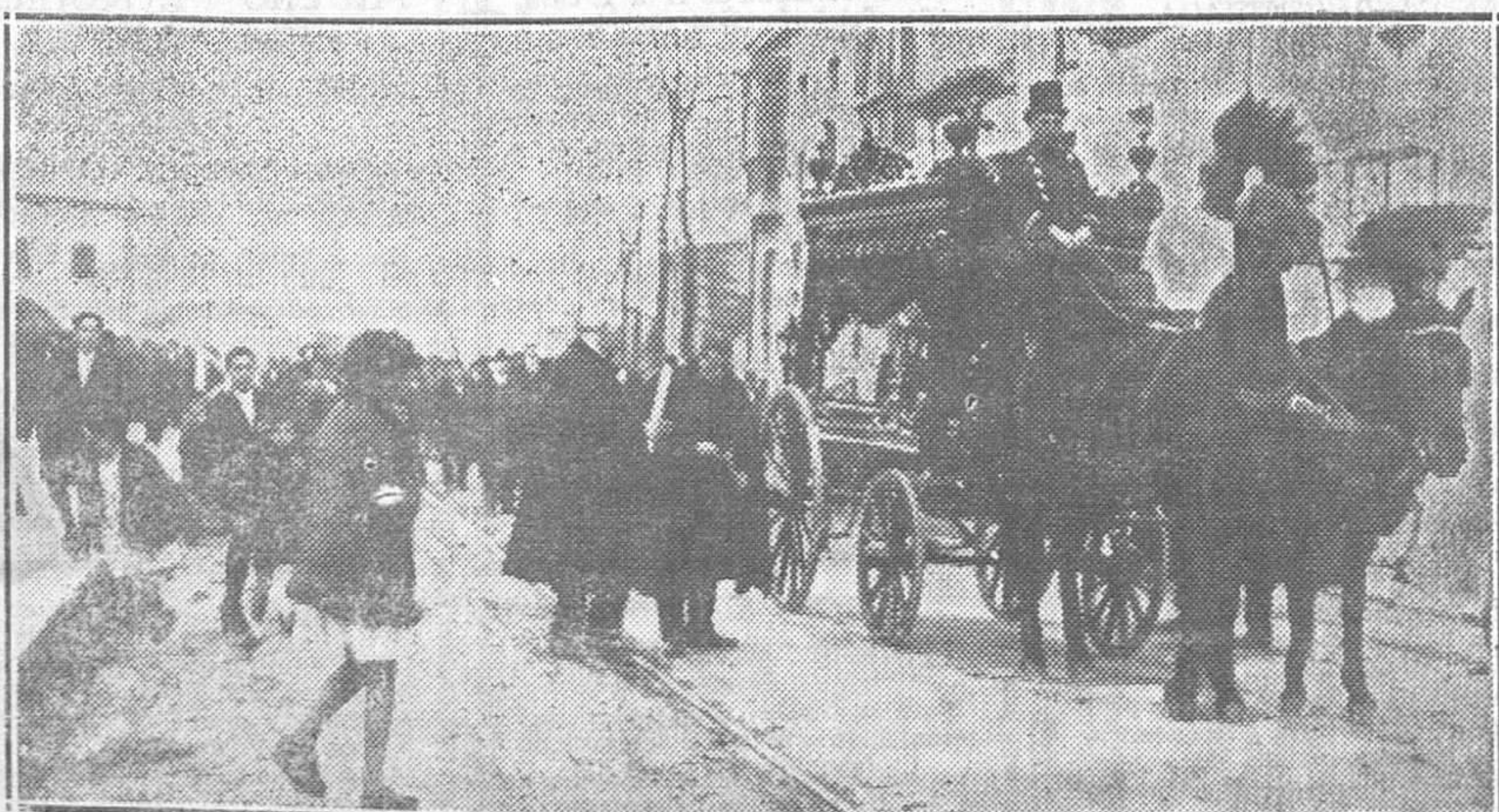
La comitiva en el traslado de los restos de las víctimas de los episodios de Julio y Septiembre de 1868.

—Don Victoriano Lopez, solicita instalar un puesto de carne fresca en Trubia.