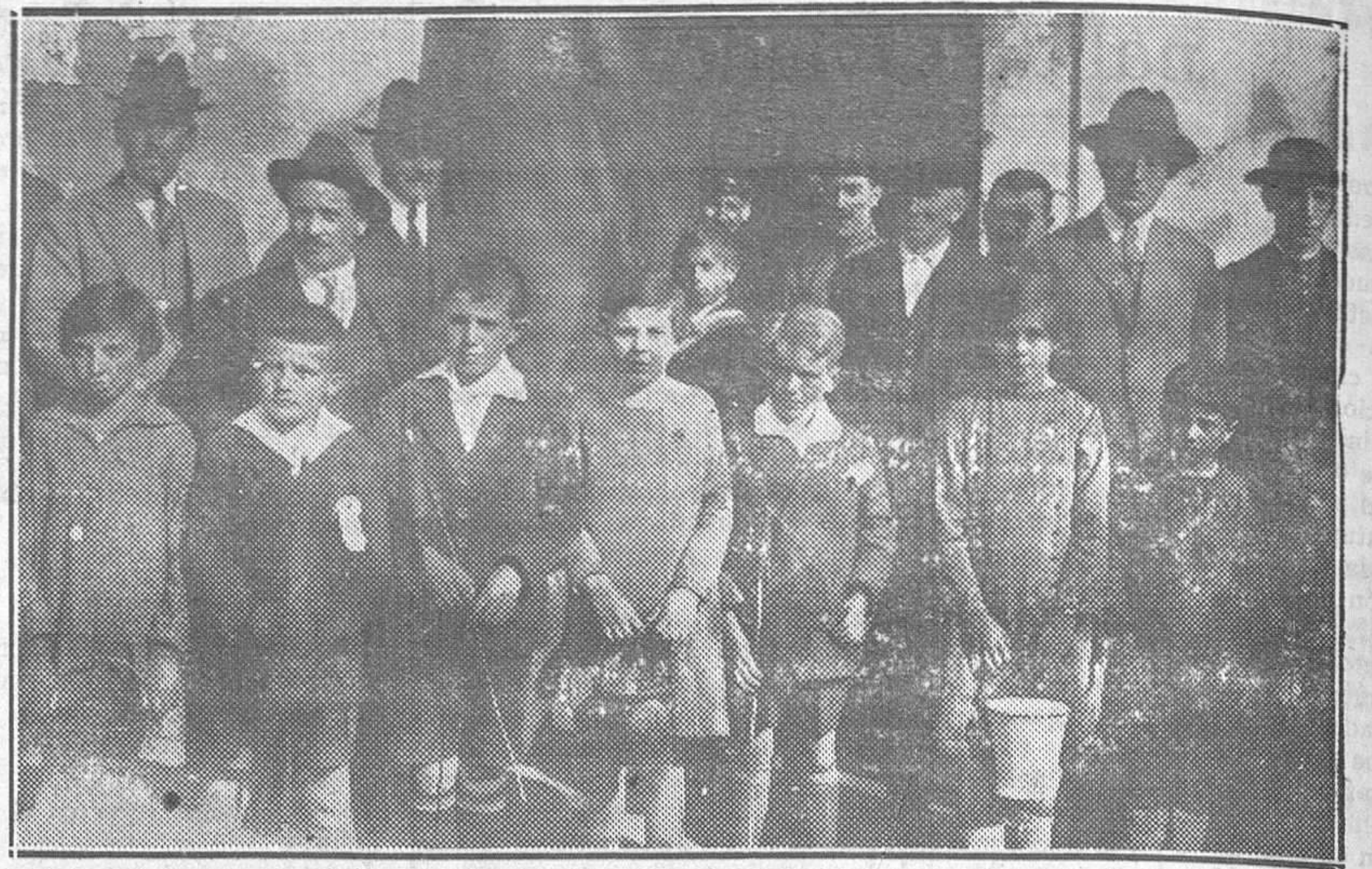
LA FIESTA DEL ARBOL EN NAVA.—Las autoridades, oradores y niños que tomaron parte en la solemnidad.