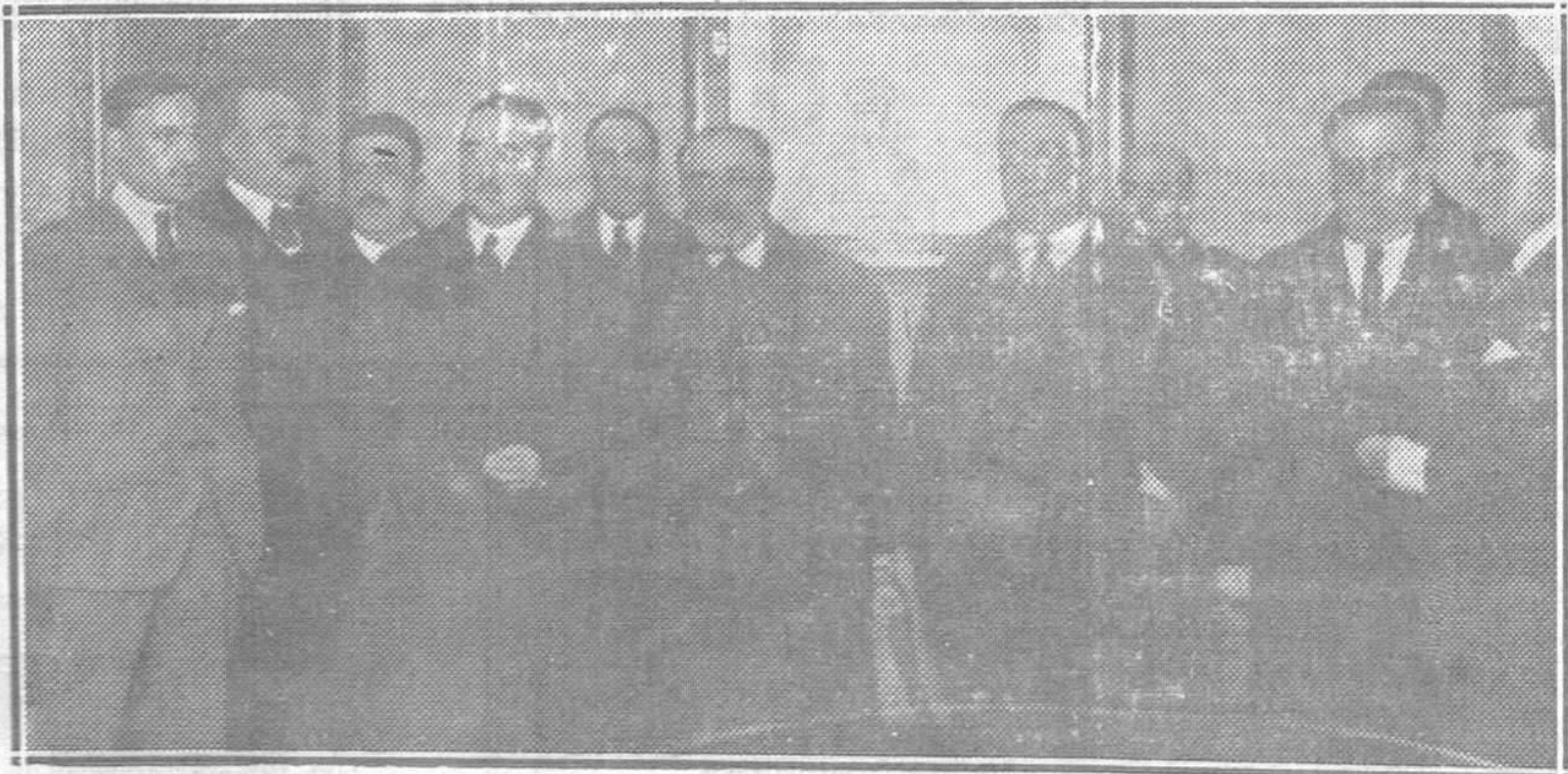
Los oradores del mitin reunidos en la Cámara de Comercio

Añádase a esto que 12 importantes Casas matriculadas para el tráfico y embarque de carbones desaparecerían necesariamente al desaparecer la industria hullera; que por falta de finalidad dejarían de acudir al puerto los buques, con la consiguiente desastrosa repercusión en el comercio avilesino en general; que el activo movimiento de trenes entre las minas y el puerto cesaría; que la Junta de Obras del puerto vería casi totalmente anulados sus ingresos y que centenares de hombres se quedarían sin