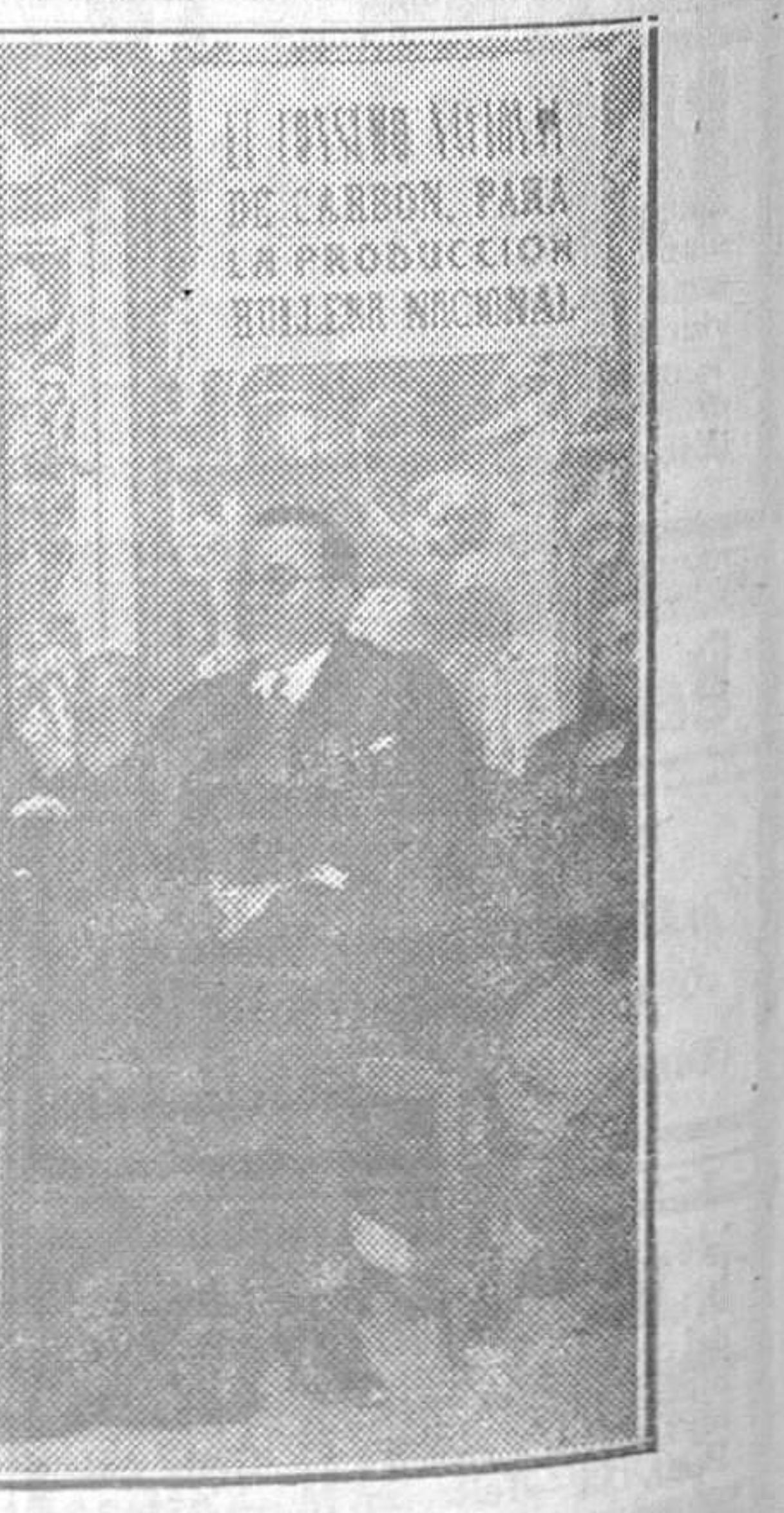
La mesa presidencial en el mitin del Campoamor