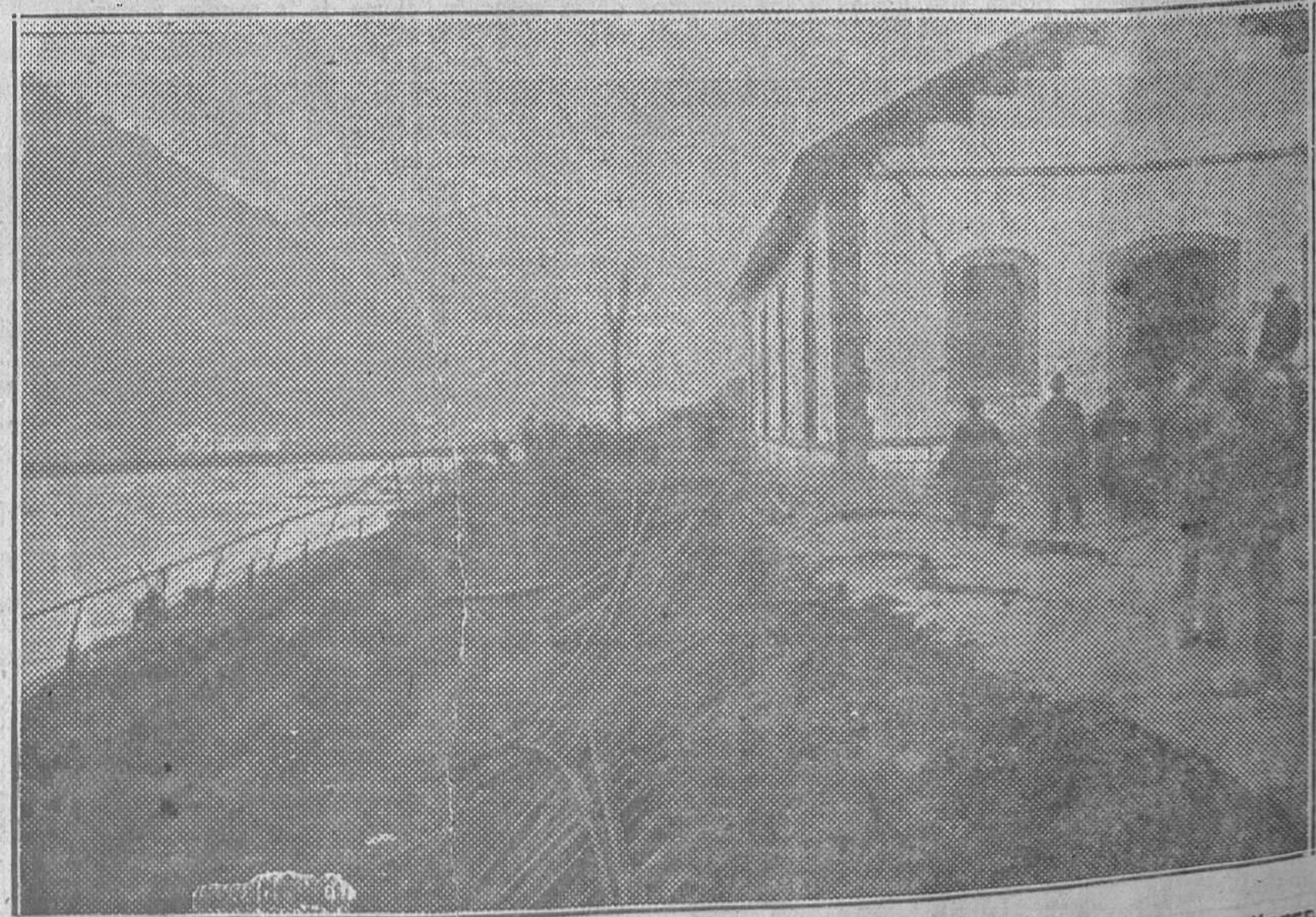
SANTULLANO DE MIERES.—Muelles de la estación que fueron desmoronados al correrse las tierras, desapareciendo las vías y quedando los edificios en situación ruinososa

Las hijas de aquél, María, de 16 años (había sido sorprendida por