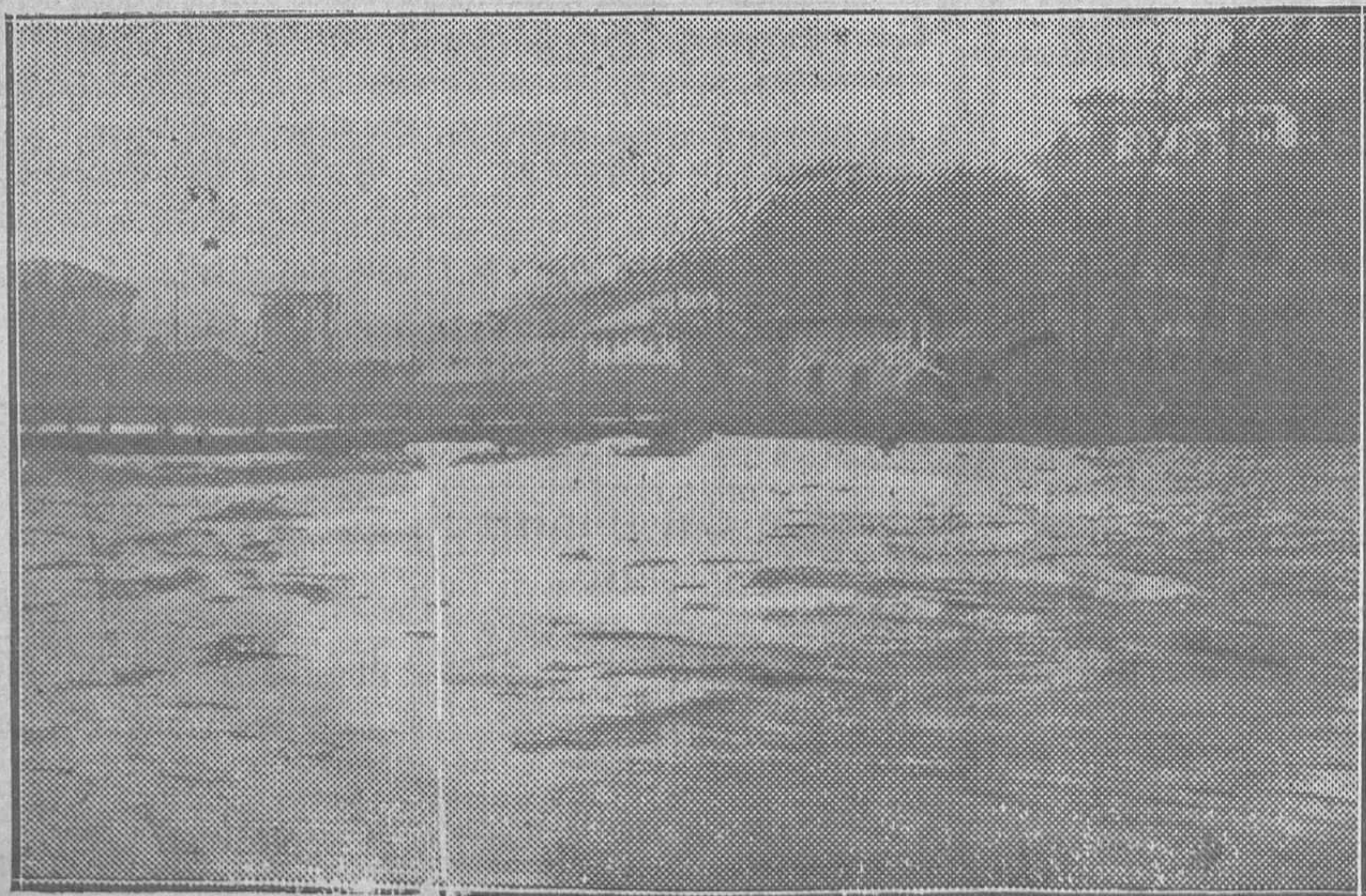
SAMA DE LANGREO.—El Puente Viejo aparece destruido por la corriente del Nalón

Redacción de "La Voz de Asturias" Apartado núm. 29