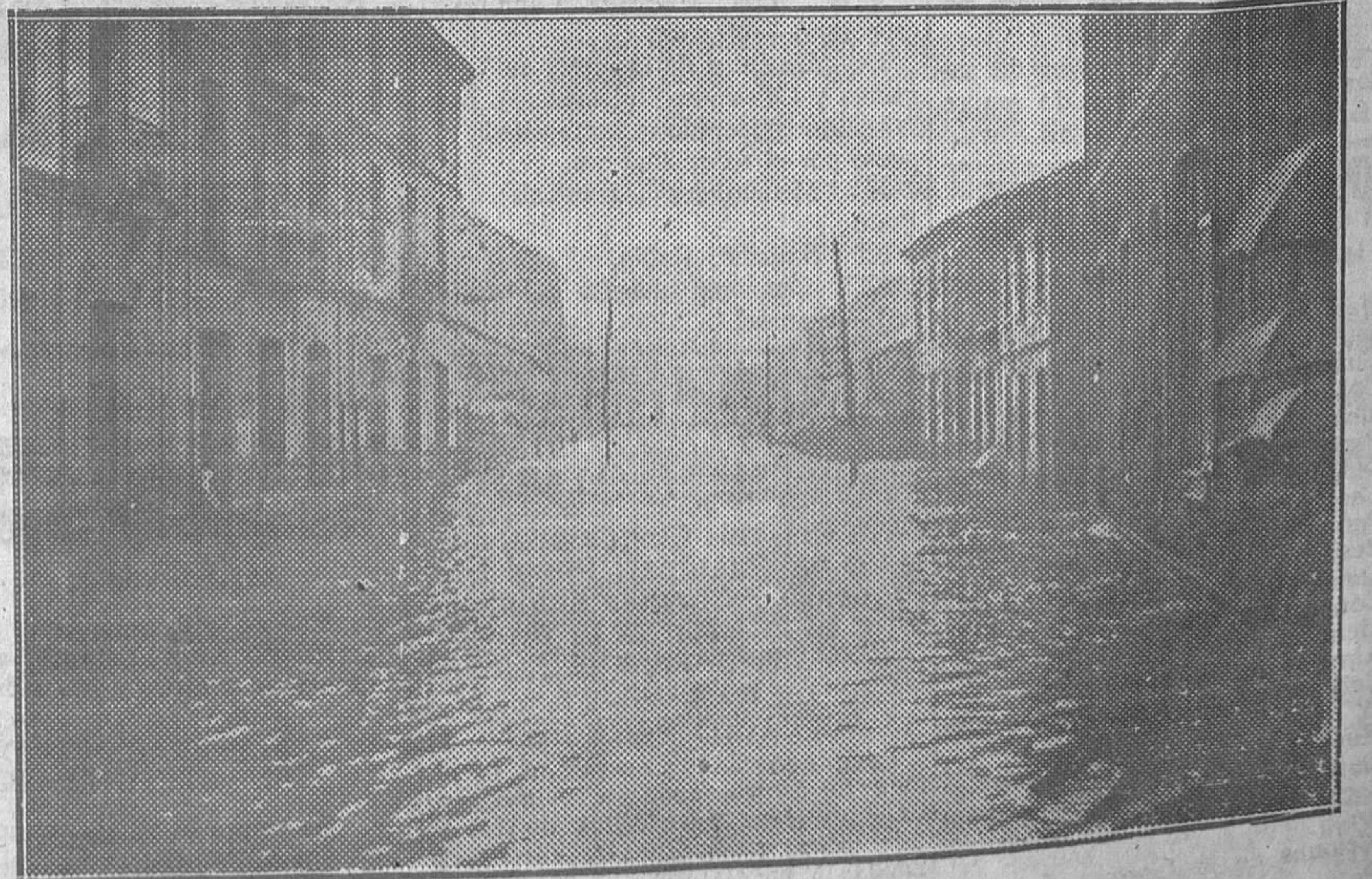
SAMA DE LANGREO.—Un aspecto de la carretera de Ciaño, convertida en un verdadero río