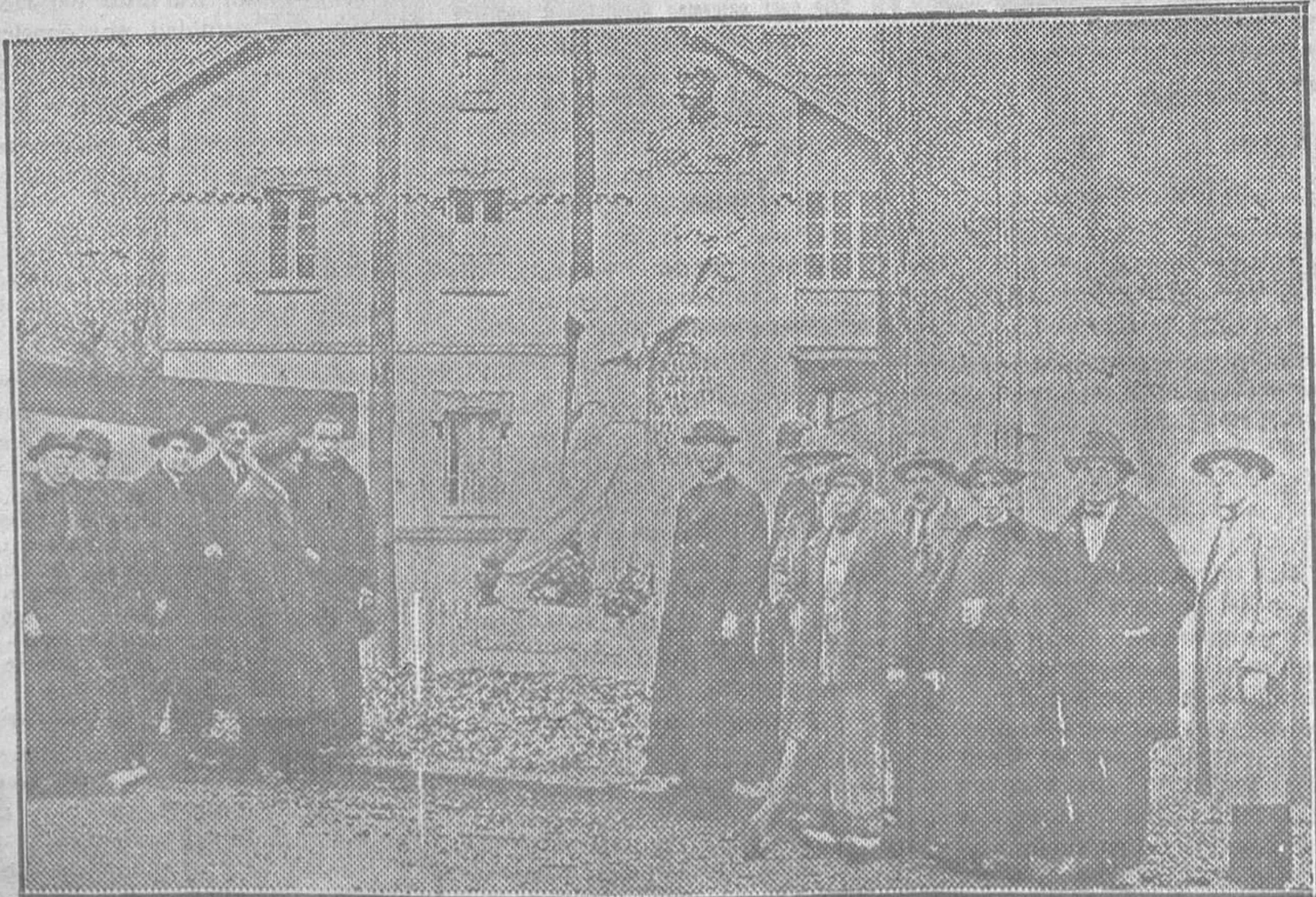
BUSTIELLO.—El público contemplando el monumento descubierto ayer en memoria del Marqués de Comillas

Cangas de Onís.—Condenando a Enrique de la Natividad González Bárcena, por tenencia ilícita de arma, a un mes y un día de arresto mayor y 100 pesetas de multa.