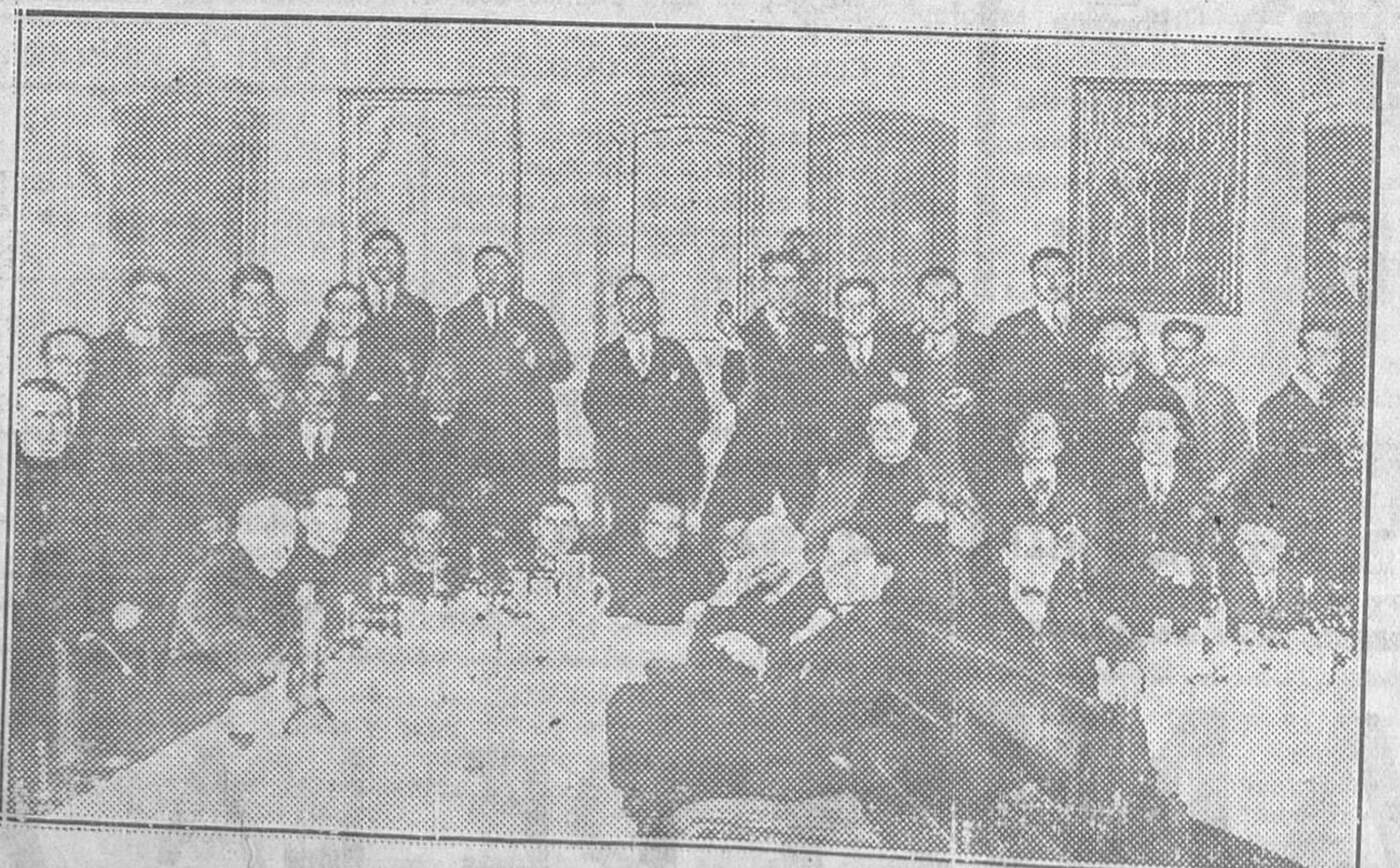
BUSTIELLO.—Invitados al descubrimiento del monumento al Marqués de Comillas, reunidos después del banquete con que fueron obsequiados

Se depositarán coronas sobre la tumba del "leader" socialista y se darán conferencias en distintas poblaciones acerca de la figura y personalidad del viejo propagandista.